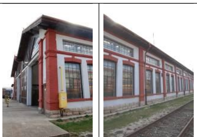
Rušňová remíza. Severná fasáda. Foto apríl 2009