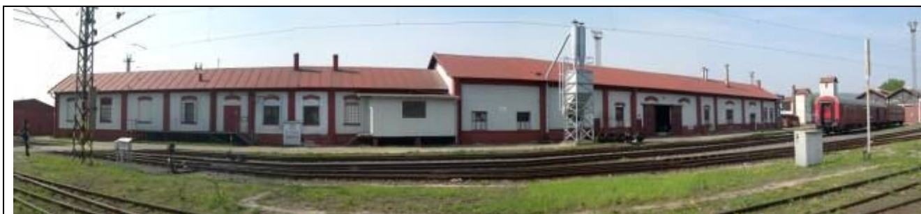
Sklad depa a dielňa opravovne vozňov. Foto apríl 2006