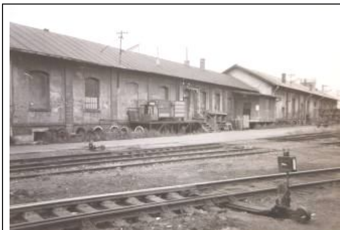
Sklad depa a dielňa opravovne vozňov. Foto – 2. pol. 20. stor.