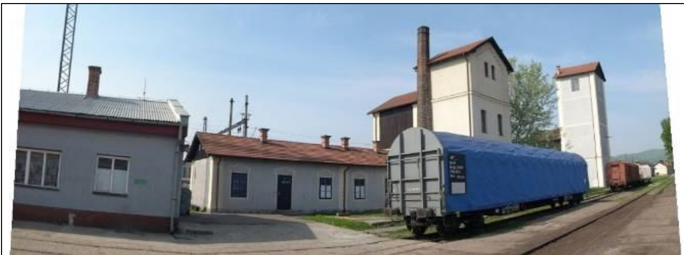
Vodárne. Pohľad z východu. /vľavo – administratívna budova (II.)/ Foto apríl 2006.