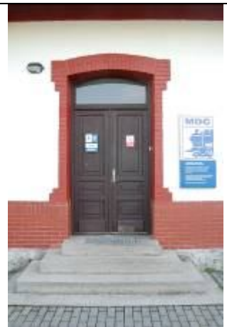
Vľavo – bývalá personálna kuchyňa, dnes pracovisko a archív Múzejno-dokumentačného centra ŽSR. Vpravo – trubkáreň. Foto apríl 2006.