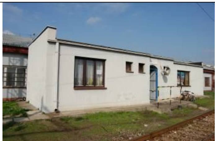
Administratívna budova (II.). Pohľad z juhu. Foto apríl 2009