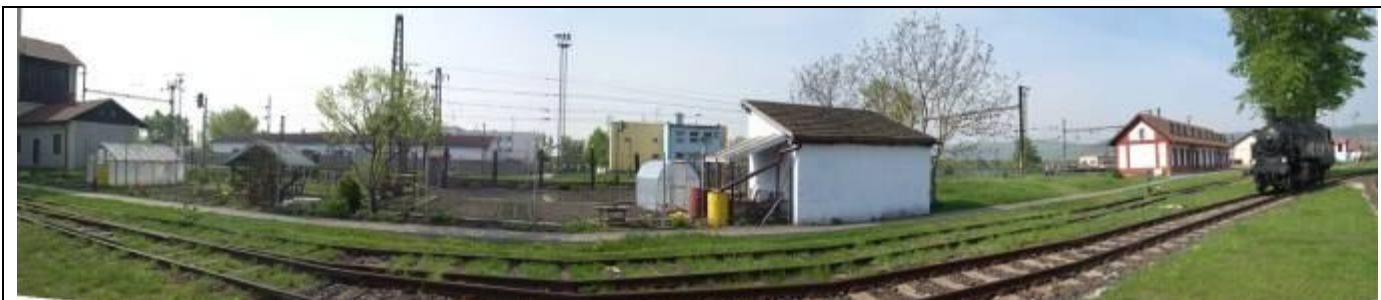
Pohľad zo severu. Západné krídlo veľkej vodárne, objekt (I.), v pozadí objekt (II.), vpravo – bývalá personálna kuchyňa. Foto apríl 2006.