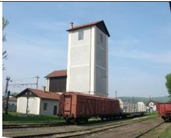
Veľká vodáreň. Foto apríl 2006.