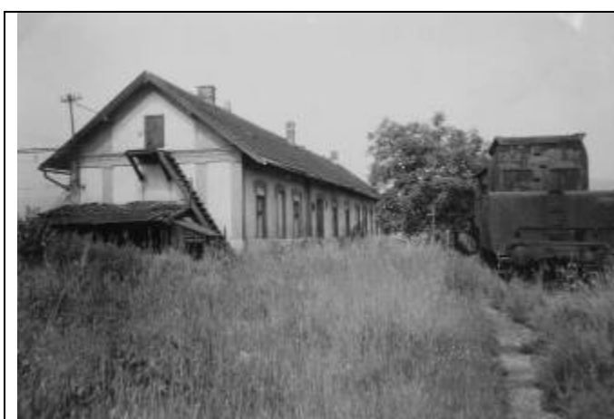
Bývalá personálna kuchyňa. Foto – 2. pol. 20. stor. (Pamätná kniha – Rušňové depo Bratislava - Východ, MDC ŽSR)