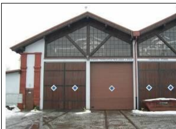
Rušňová remíza. Čelná – východná fasáda. Foto apríl 2006