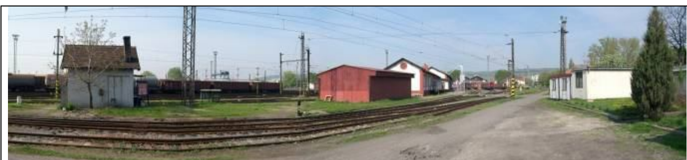
Pohľad z východu. Stanovisko signalistu, sklad (II.), sklad depa a dielňa opravovne vozňov (vpravo objekty mimo územia PZ). Foto apríl 2006.