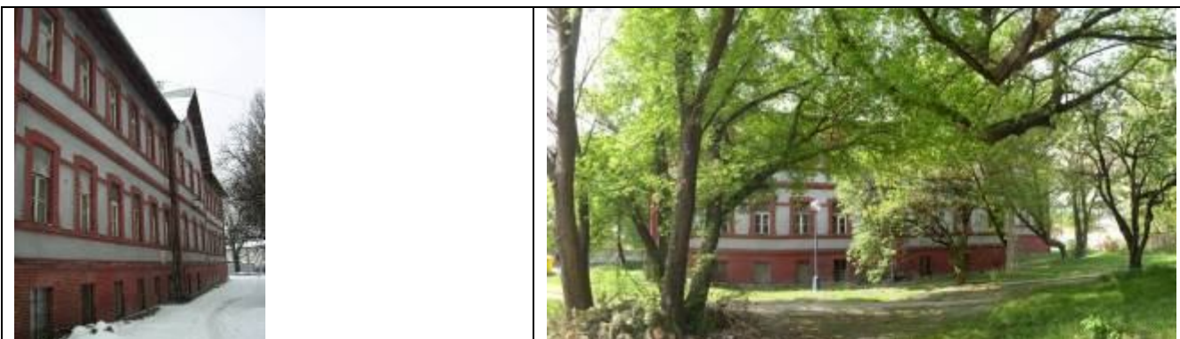
Objekt personálnych kasární (II.) Foto febr., resp. apríl 2006