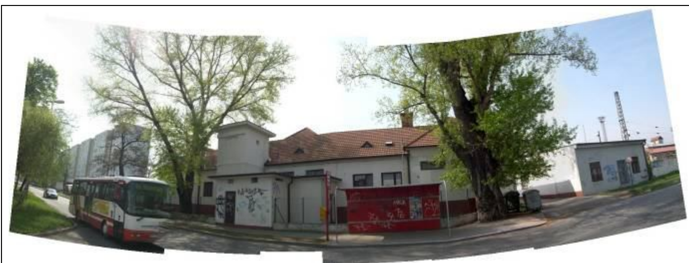
Pohľad zo severu z Dopravnej ulice. Uprostred – administratívna budova (I.), vstup do areálu depa, elektrodielňa. Foto apríl 2006.