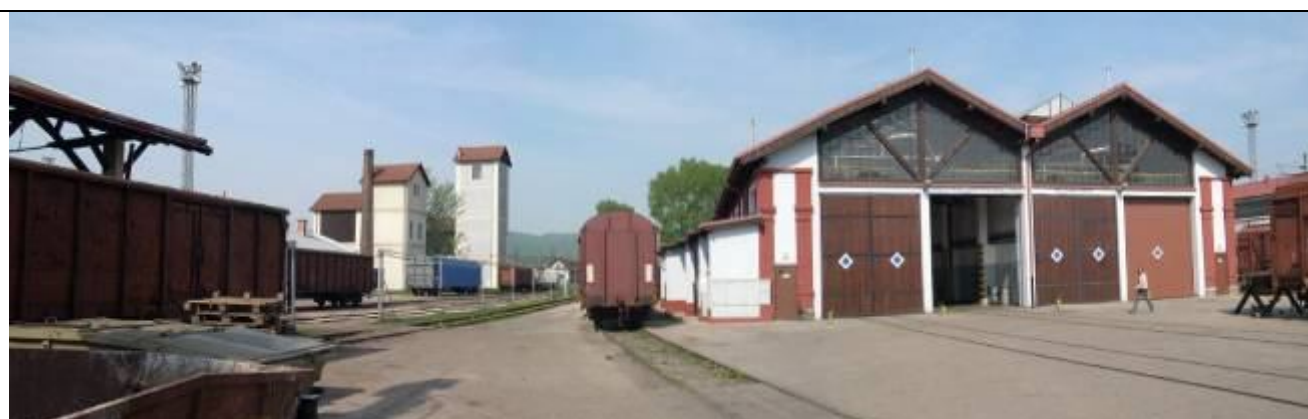
Pohľad z východu. Vodárne, remíza. Foto apríl 2006