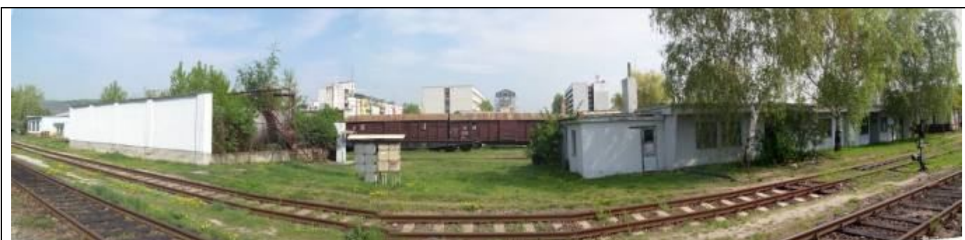
Pohľad z juhu. Nádrže na olej, sociálne zariadenia. Foto apríl 2006