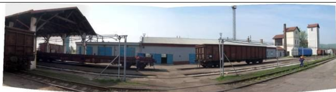
Pohľad zo severu. Prístrešok pre vlakové súpravy, sklady, vodárne. Foto apríl 2006