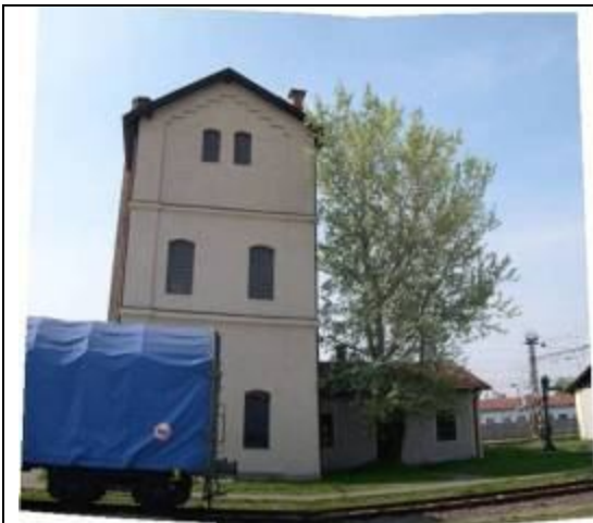
Malá vodáreň. Foto apríl 2006.