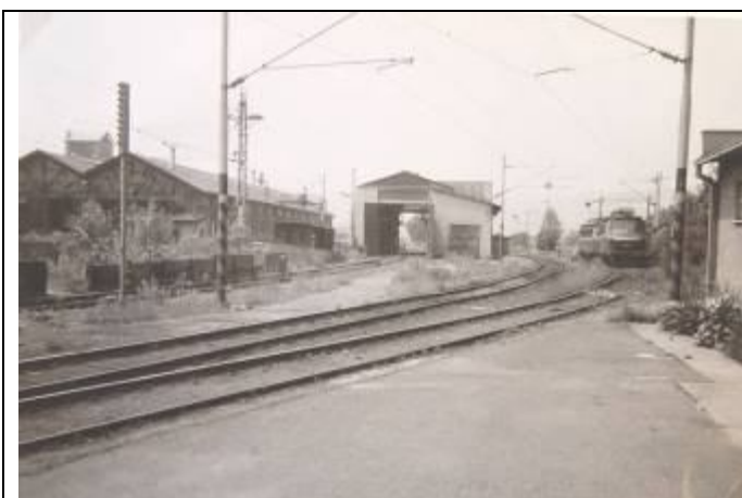
Uprostred – hala prevádzkového ošetrovania pre rušne elektrickej trakcie Foto – 2. pol. 20. stor. (Pamätná kniha – Rušňové depo Bratislava - Východ, MDC ŽSR)