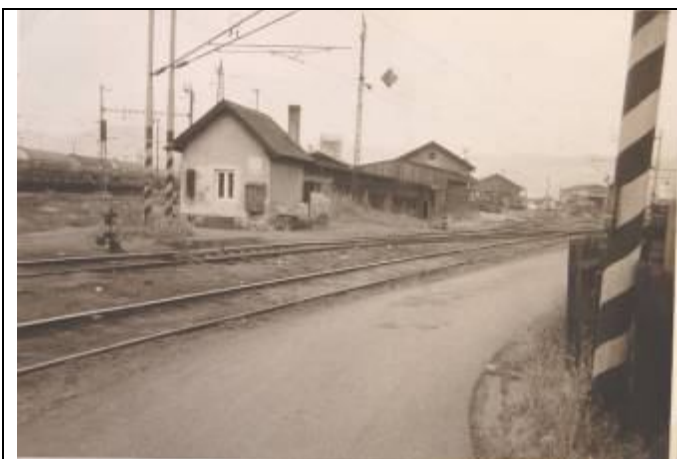
Stanovisko signalistu. Všetky hnacie vozidlá parné, motorové ako i elektrické, ktoré vchádzali do depa sa zapisovali na tomto stanovišti (stanovište č.3). Foto – 2. pol. 20. stor. (foto aj text – Pamätná kniha – Rušňové depo Bratislava - Východ, MDC ŽSR)