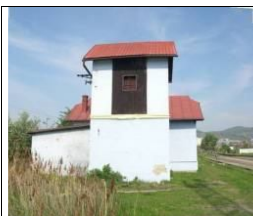
Dezinfekčná stanica. Východná fasáda. Foto apríl 2006.