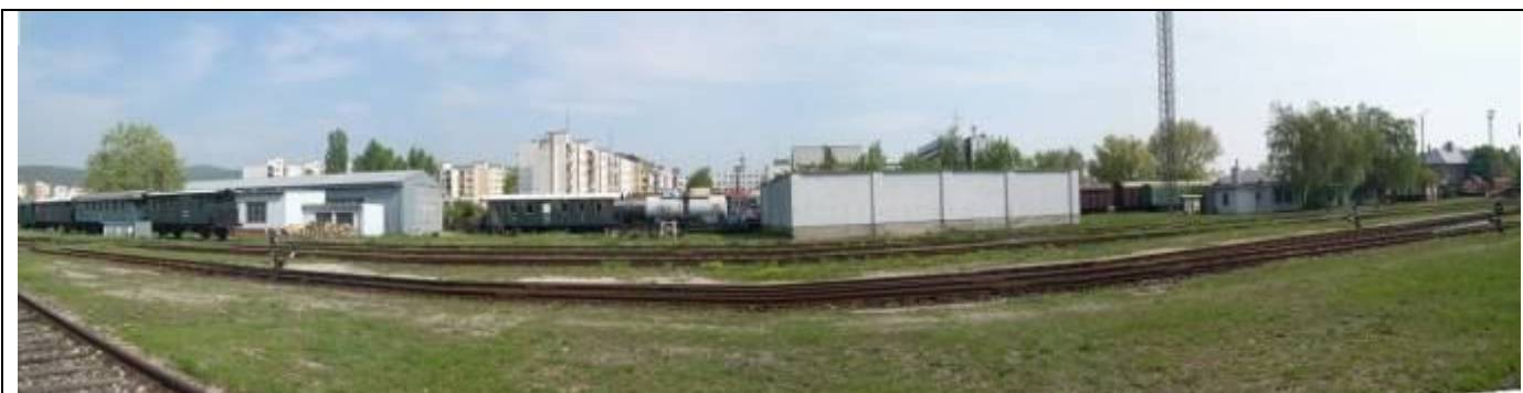
Pohľad z juhu. Hala MDC, nádrže na olej, sociálne zariadenia. Foto apríl 2006