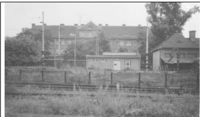
Obytný objekt (I.) na Dopravnej ulici. Foto – 2. pol. 20. stor. Uprostred elektrodielňa. (Pamätná kniha – Rušňové depo Bratislava - Východ, MDC ŽSR)