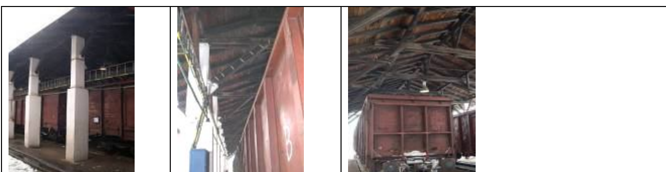
Prístrešok pre vlakové súpravy