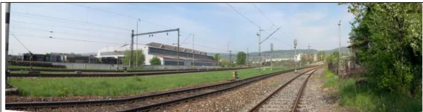
Pohľad z východu. Koľajisko juhozápadne od rušňového depa – územie PZ. Južná hranica PZ smeruje v línii oplatenia z pohľadových panelov.