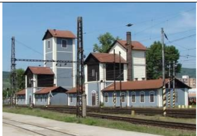
Vodárne. Pohľad z juhu. Foto máj 2009