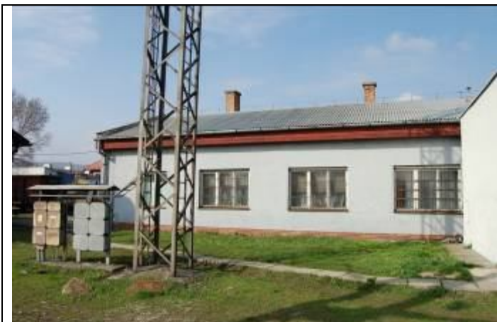
Administratívna budova (II.). Pohľad z juhu. Foto apríl 2009