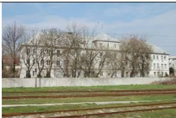
Obytný objekt (I.) na Dopravnej ulici. Južná fasáda. Foto apríl 2009