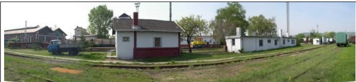
Pohľad zo severu. Remíza, útulok popolárov, sociálne zariadenia. Foto apríl 2006