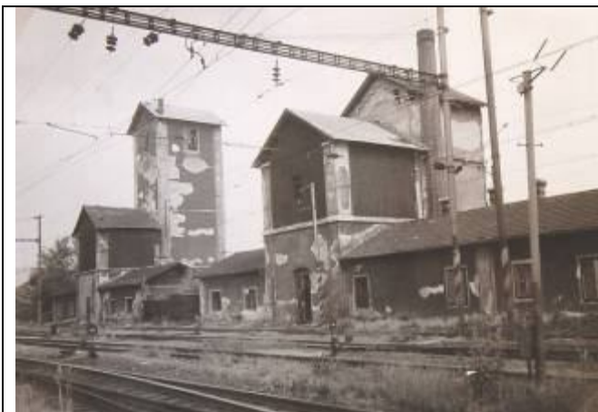
Budovy vodárni krátko po opustení pôvodnej prevádzky depa. Pohľad z juhu. Foto – 80-te (?) roky 20. storočia.