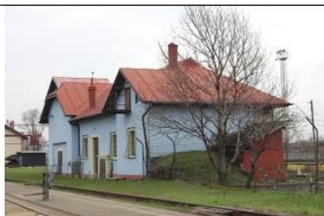
Dezinfekčná stanica. Pohľad zo severu. Foto apríl 2009.