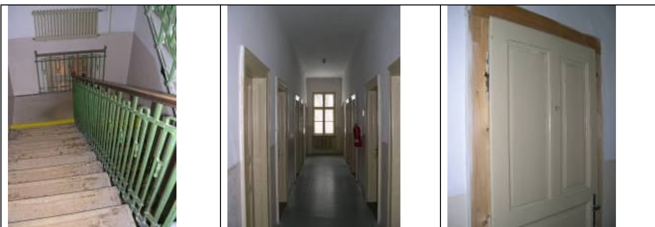
Objekt personálnych kasární (I.) – interiér