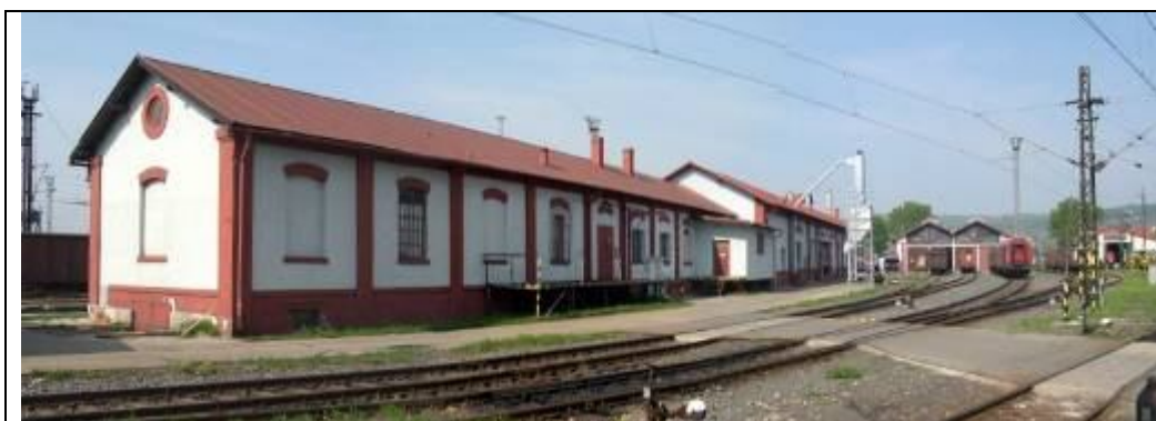
Sklad depa a dielňa opravovne vozňov. Foto apríl 2006.