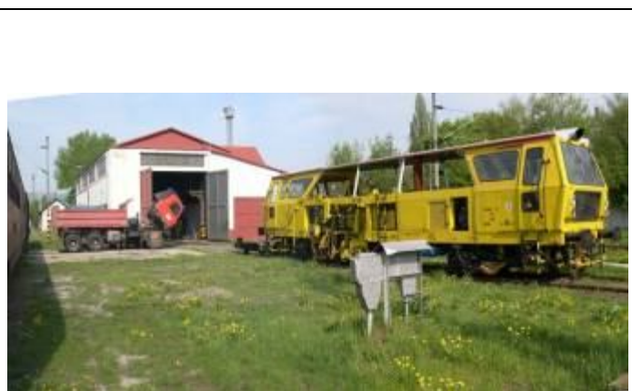
Hala prevádzkového ošetrovania pre rušne elektrickej trakcie. Foto apríl 2006