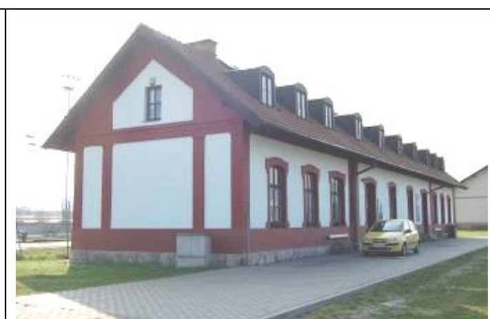
Bývalá personálna kuchyňa, dnes pracovisko a archív Múzejno-dokumentačného centra ŽSR. Foto apríl 2009.