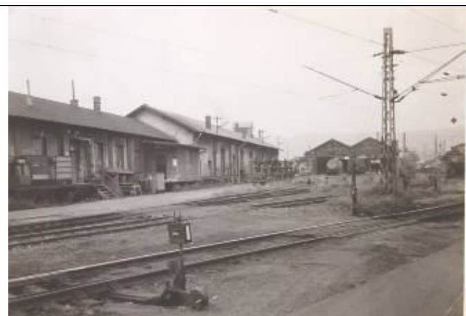
Sklad depa a dielňa opravovne vozňov. Foto – 2. pol. 20. stor. (Pamätná kniha – Rušňové depo Bratislava - Východ, MDC ŽSR)