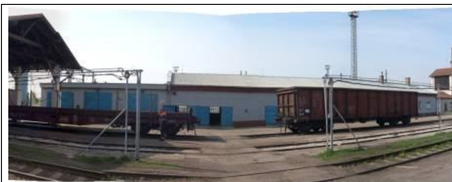
Sklad (III.), resp.garáže a administratívna budova (II.). Pohľad zo severu. Foto apríl 2006