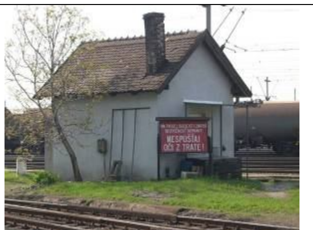
Stanovisko signalistu. Foto apríl 2006.