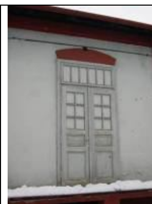
Sklad depa a dielňa opravovne vozňov – details. Foto apríl 2006.