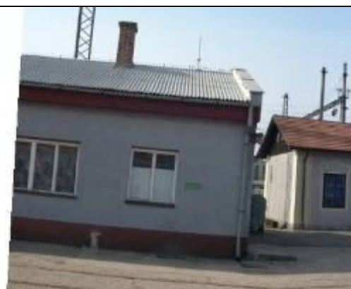
Administratívna budova (II.). Pohľad zo severu. Vpravo – bočné krídlo malej vodárne. Foto apríl 2006