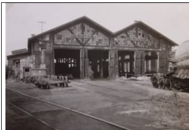
Rušňová remíza. Foto – 2. pol. 20. stor. (Pamätná kniha – Rušňové depo Bratislava - Východ, MDC ŽSR)