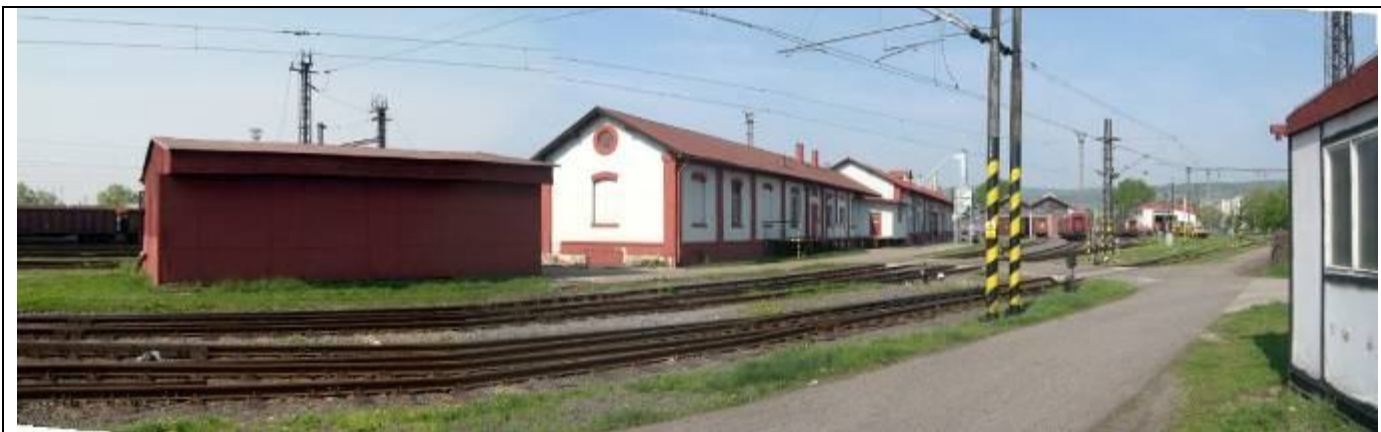
Pohľad z východu. Sklad (II.), sklad depa a dielňa opravovne vozňov. Foto apríl 2006.