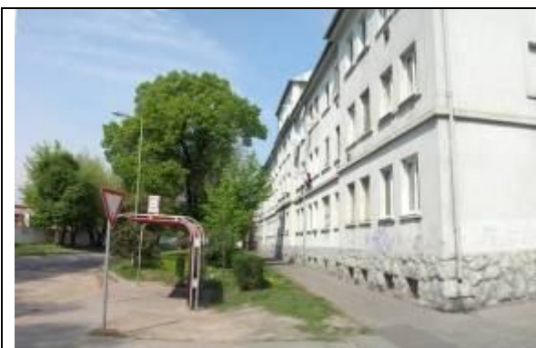
Obytný objekt (I.). ( Objekt mimo PZ ) Južná fasáda (z Dopravnej ulice) Foto apríl 2006.