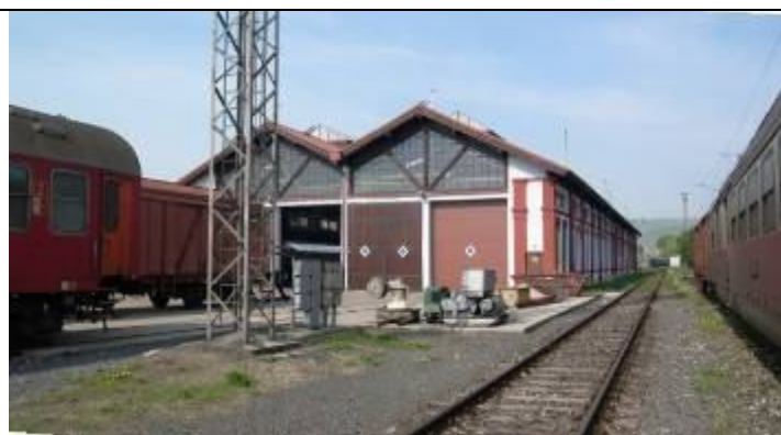
Rušňová remíza po pamiatkovej obnove. Foto apríl 2006.