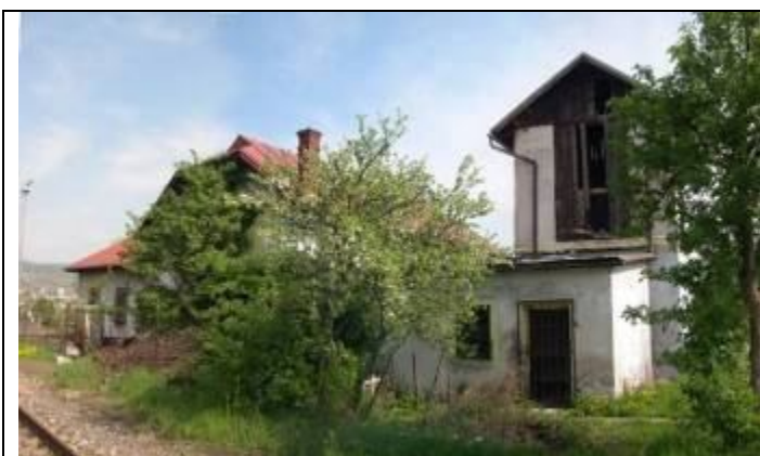
Dezinfekčná stanica. Južná fasáda. Foto apríl 2006.