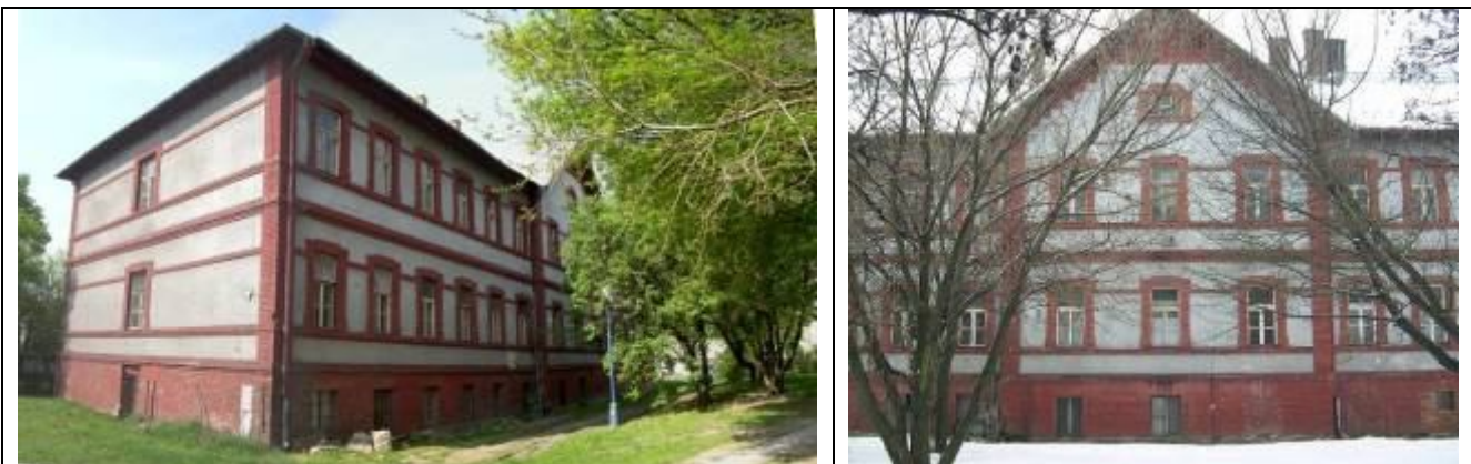
Objekt personálnych kasární (II.). Foto febr., resp. apríl 2006