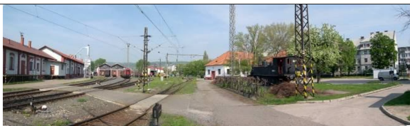
Pohľad z východu. Dielne, remíza, administratívna budova. Foto apríl 2006