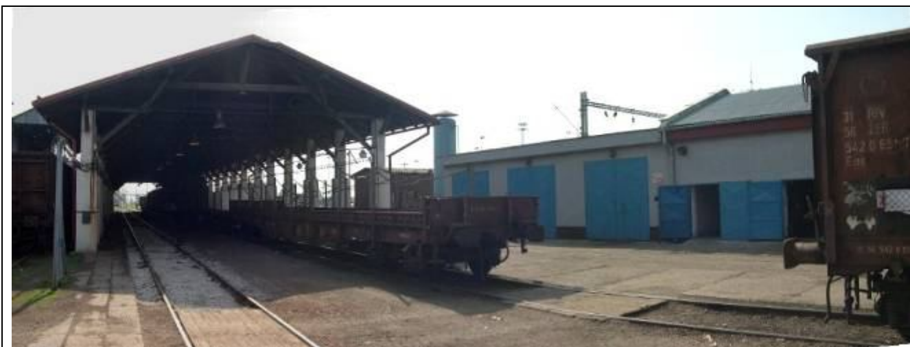
Prístrešok pre vlakové súpravy. Foto apríl 2006