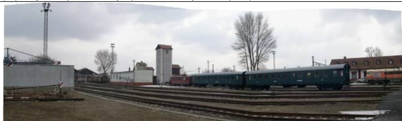
Pohľad zo severozápadu. Nádrže na olej, archív, vodárne, býv. personálna kuchyňa. Foto apríl 2006

(Popis objektov v panoramatických pohľadoch – vždy zľava doprava)