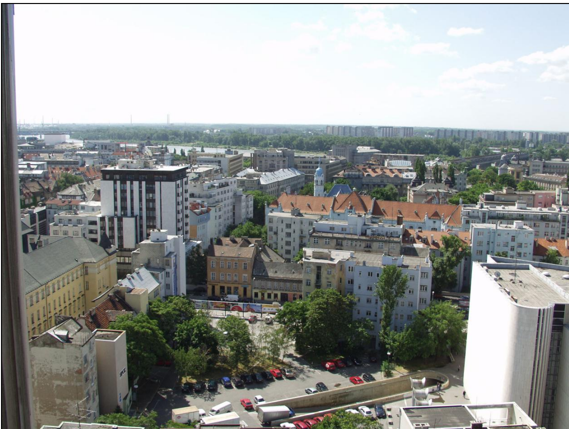
Zástavba Dunajskej ulice, pohľad z hotela Kyjev, 11. 6. 2002