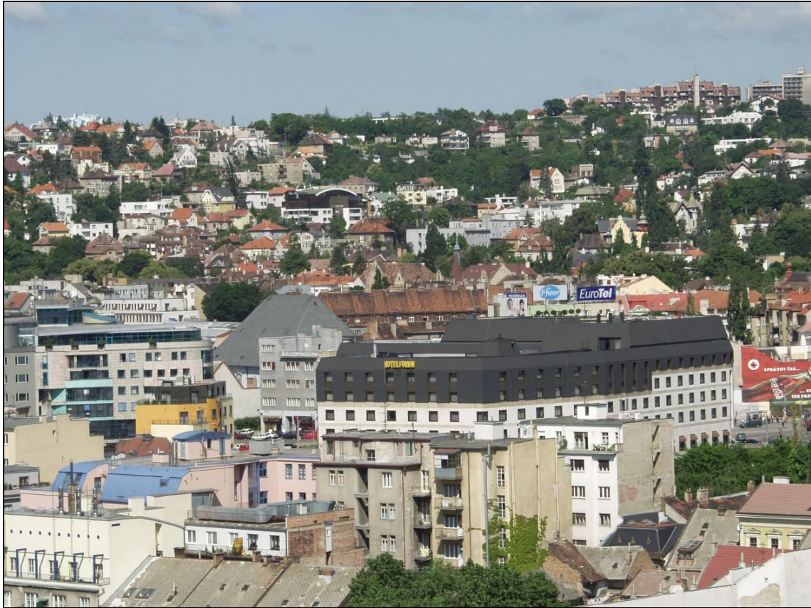
Zástavba okolo hotela Crowne Plaza ( bývalý hotel Fórum), pohľad z hotela Kyjev, 11. 6. 2002