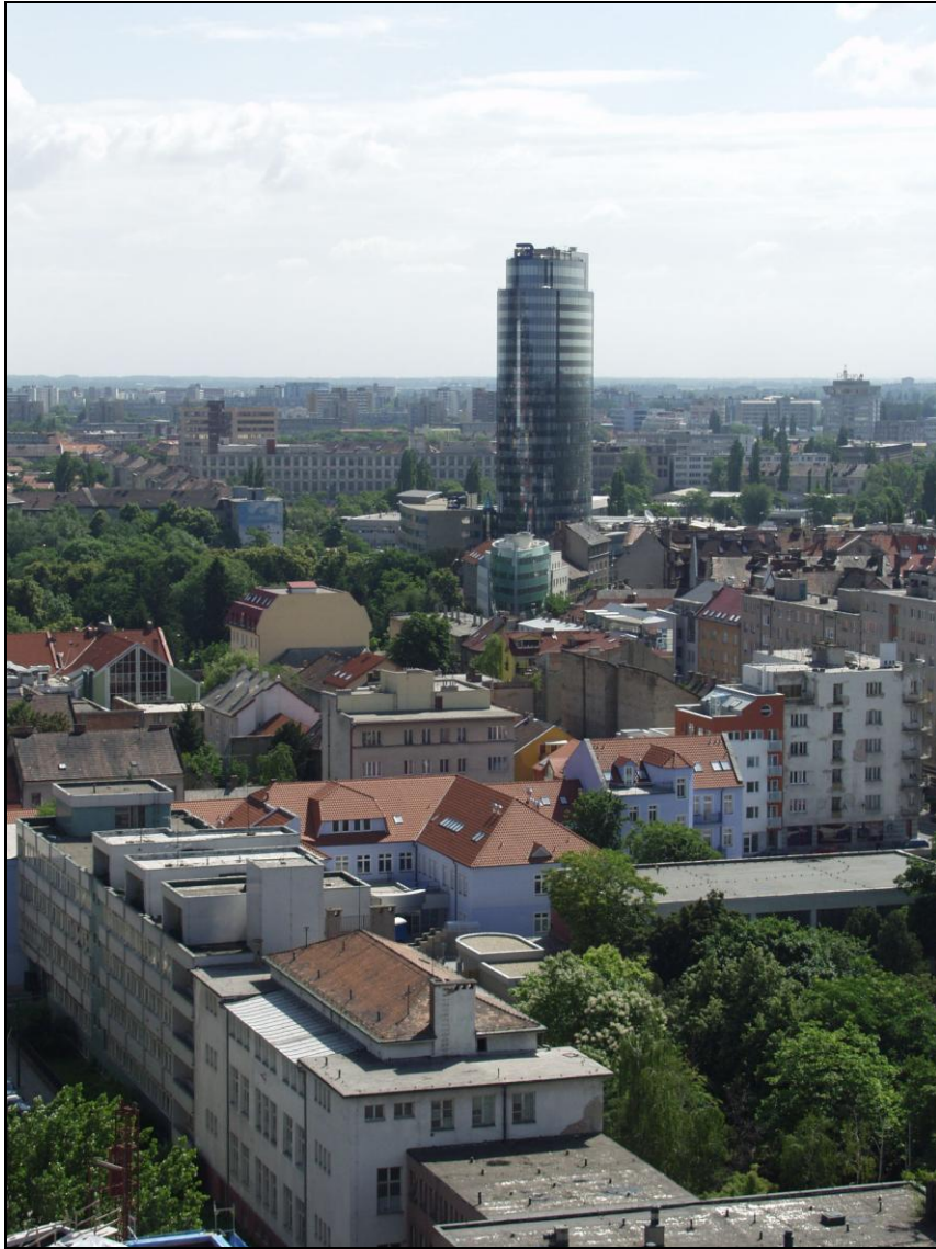
Zástavba medzi Cintorínskou a Dunajskou ulicou, pohľad z hotela Kyjev, 11. 6. 2002