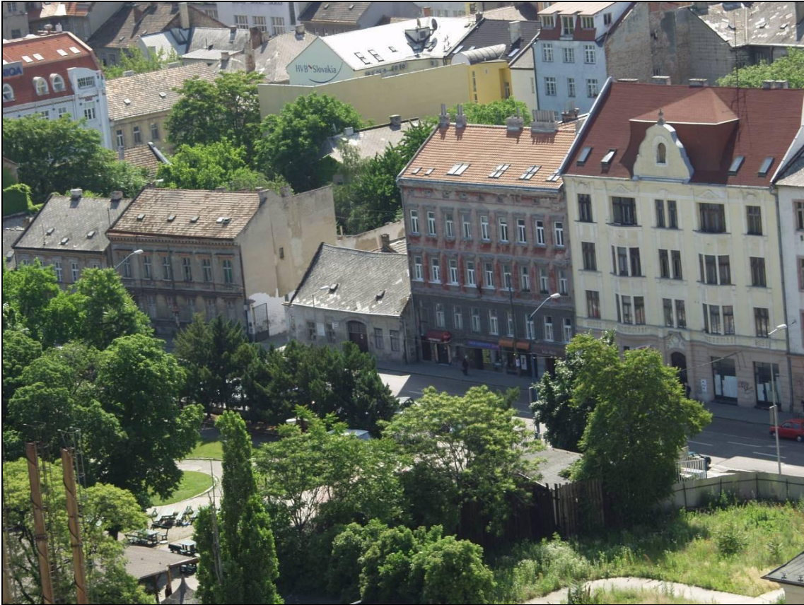
Asanovaná zástavba Dunajskej ulice, pohľad z hotela Kyjev, 11. 6. 2002