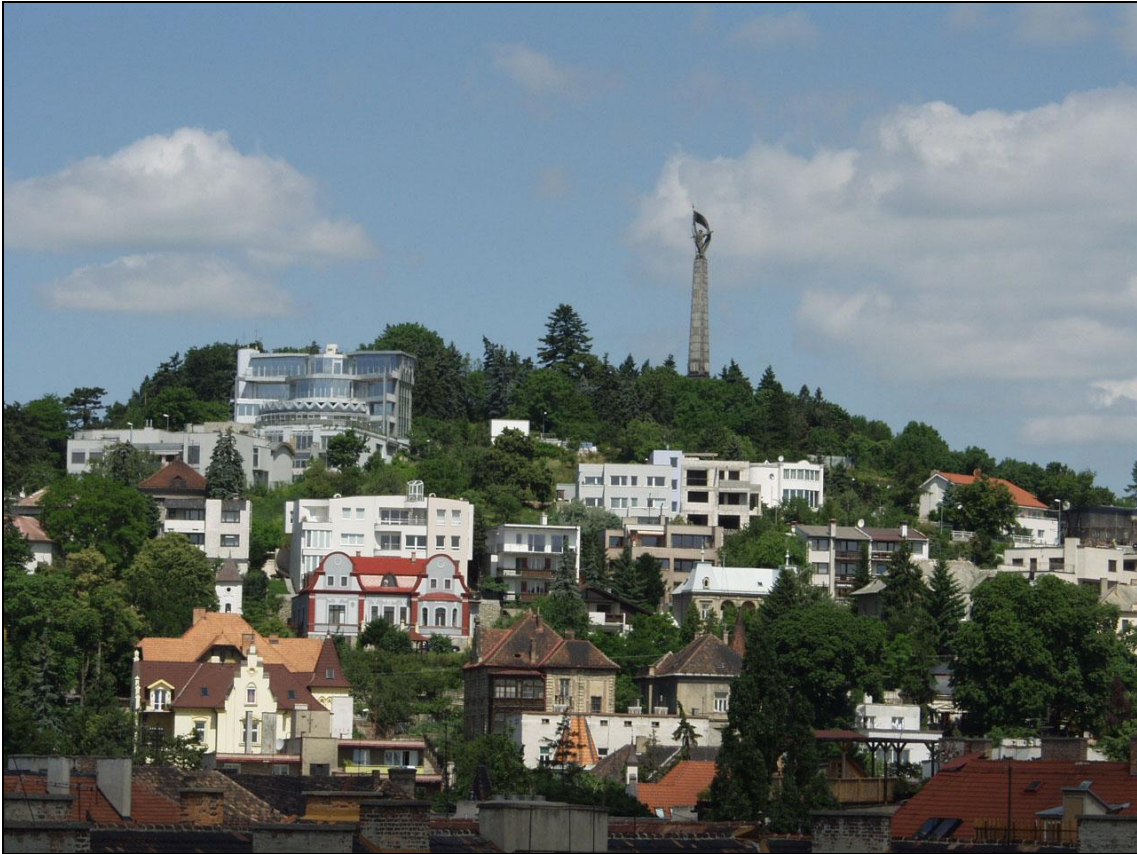
Vilová zástavba pod Slavínom, pohľad z budovy Slovenskej Sporiteľne, 11. 6. 2002