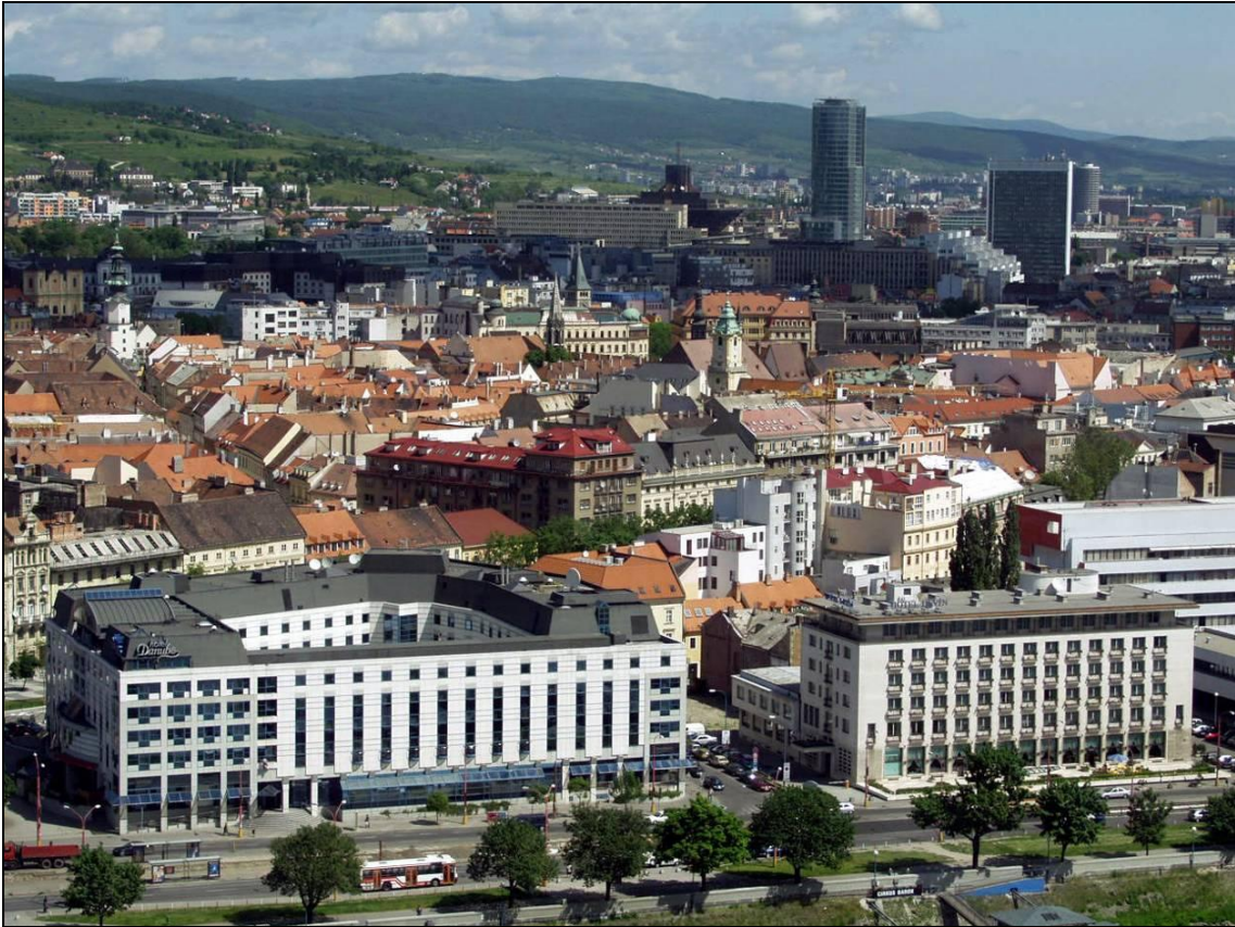
Zástavba Rázusovho nábrežia - hotel Danube a Devín, pohľad z Nového mosta, 15. 5. 2002