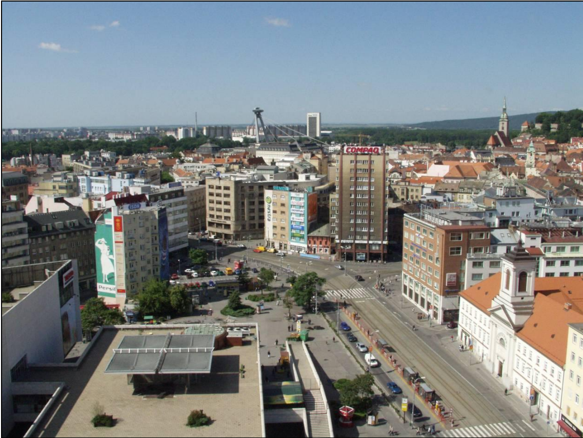
Zástavba Kamenného námestia a Špitálskej ulice, pohľad z hotela Kyjev, 11. 6. 2002