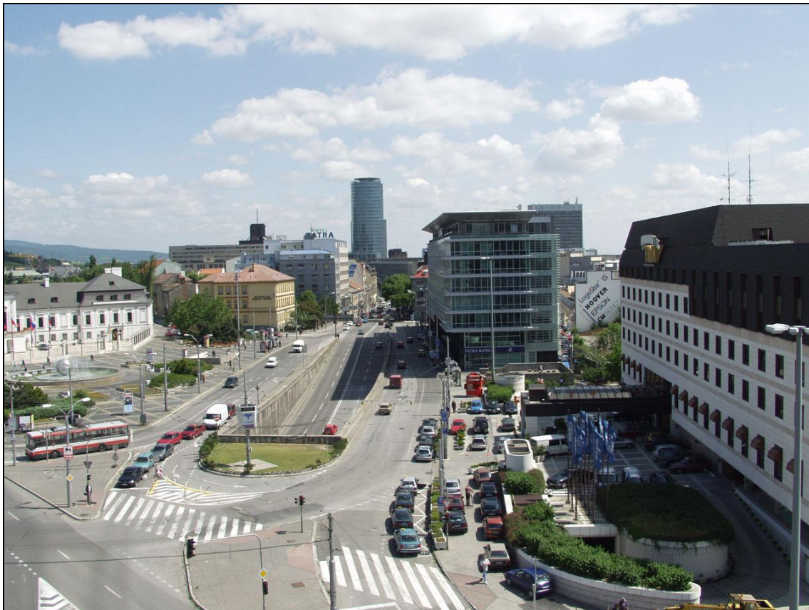
Priestor Hodžovho námestia, pohľad z budovy Slovenskej Sporiteľne, 11. 6. 2002