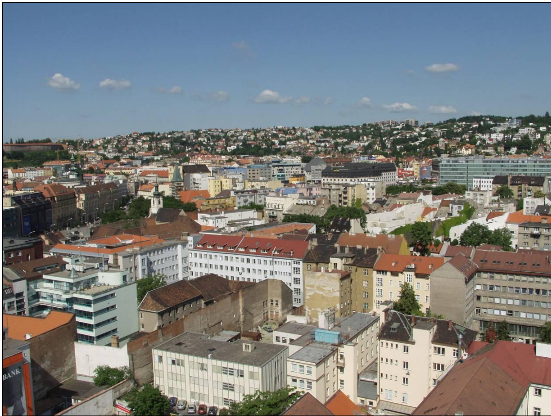
Zástavba medzi Špitálskou a Heydukovou ulicou, pohľad z hotela Kyjev, 11. 6. 2002