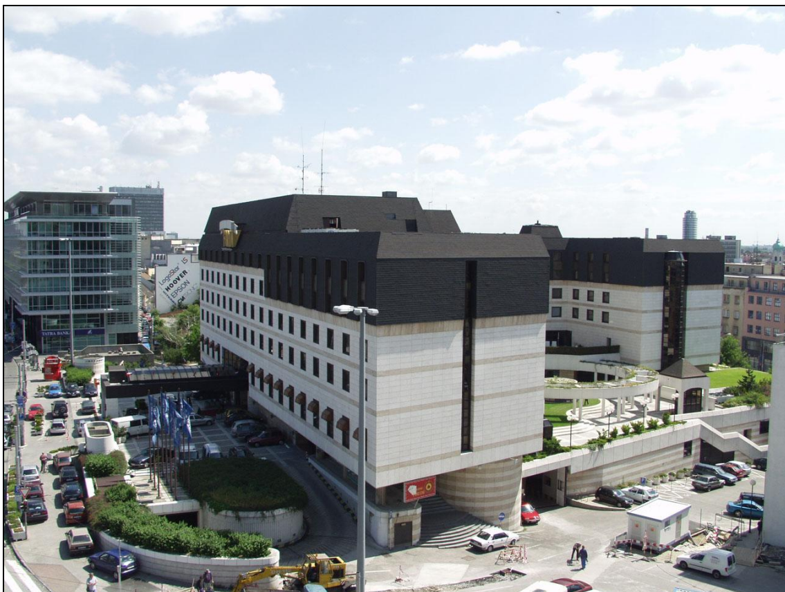
Budovy hotela Crowne Plaza a Tatracentrum, pohľad z budovy Slovenskej Sporiteľne, 11. 6. 2002