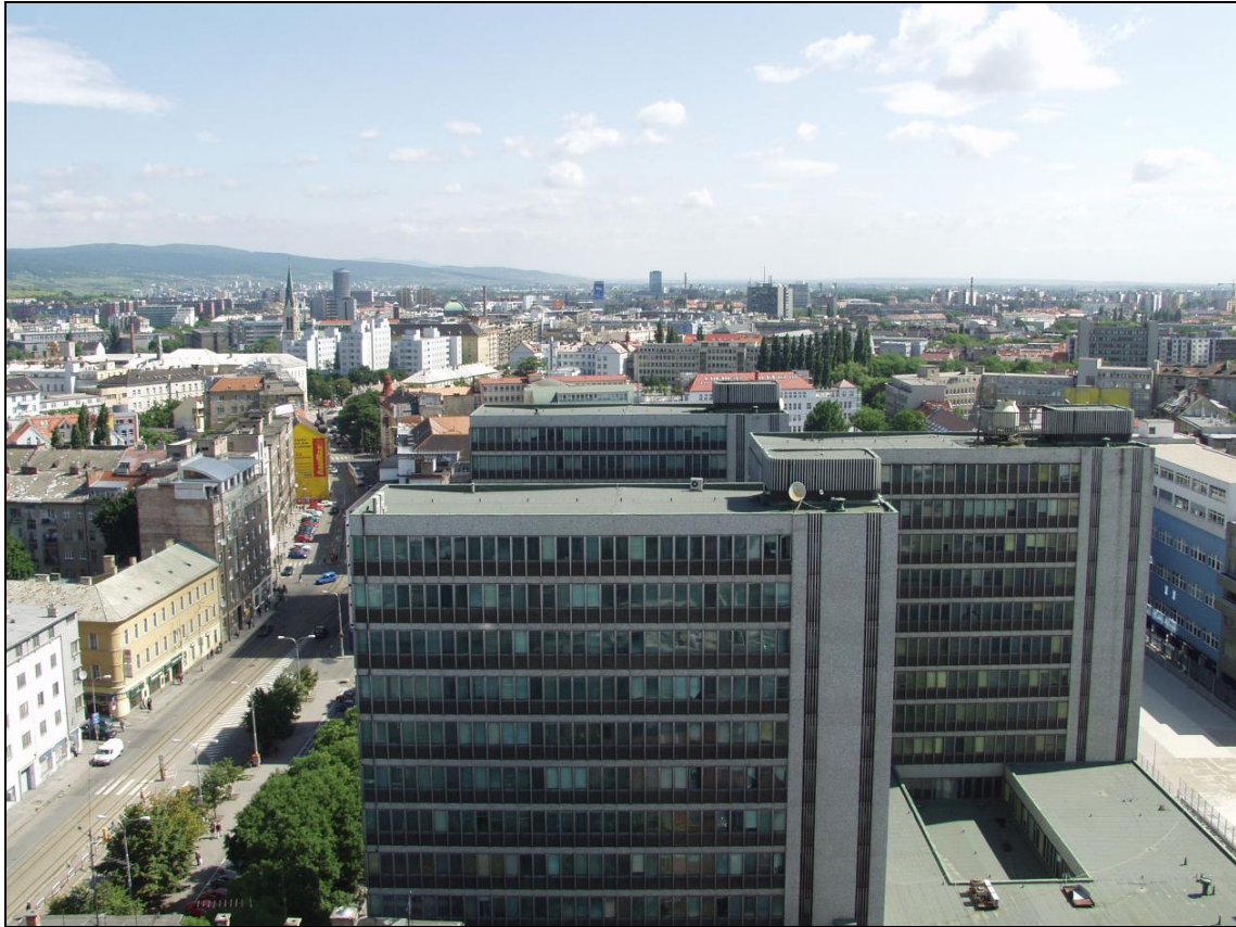
Areál Ministerstva sociálnych vecí na Špitálskej ulici, pohľad z hotela Kyjev, 11. 6. 2002