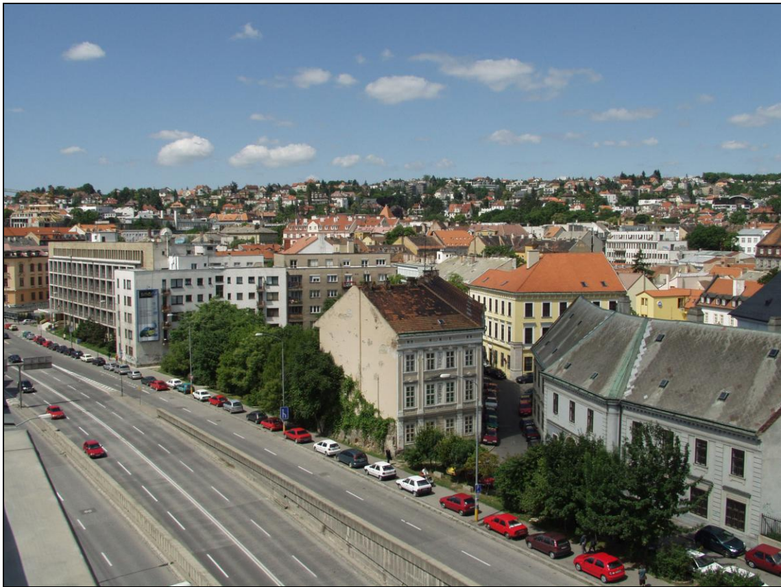
Priestor Staromestskej ulice, pohľad z budovy Slovenskej Sporiteľne, 11. 6. 2002