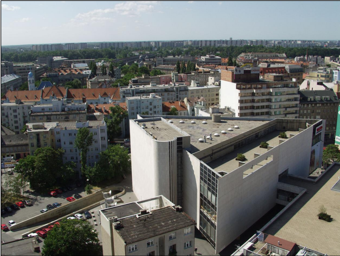
Zástavba okolo obchodného domu Tesco , pohľad z hotela Kyjev, 11. 6. 2002