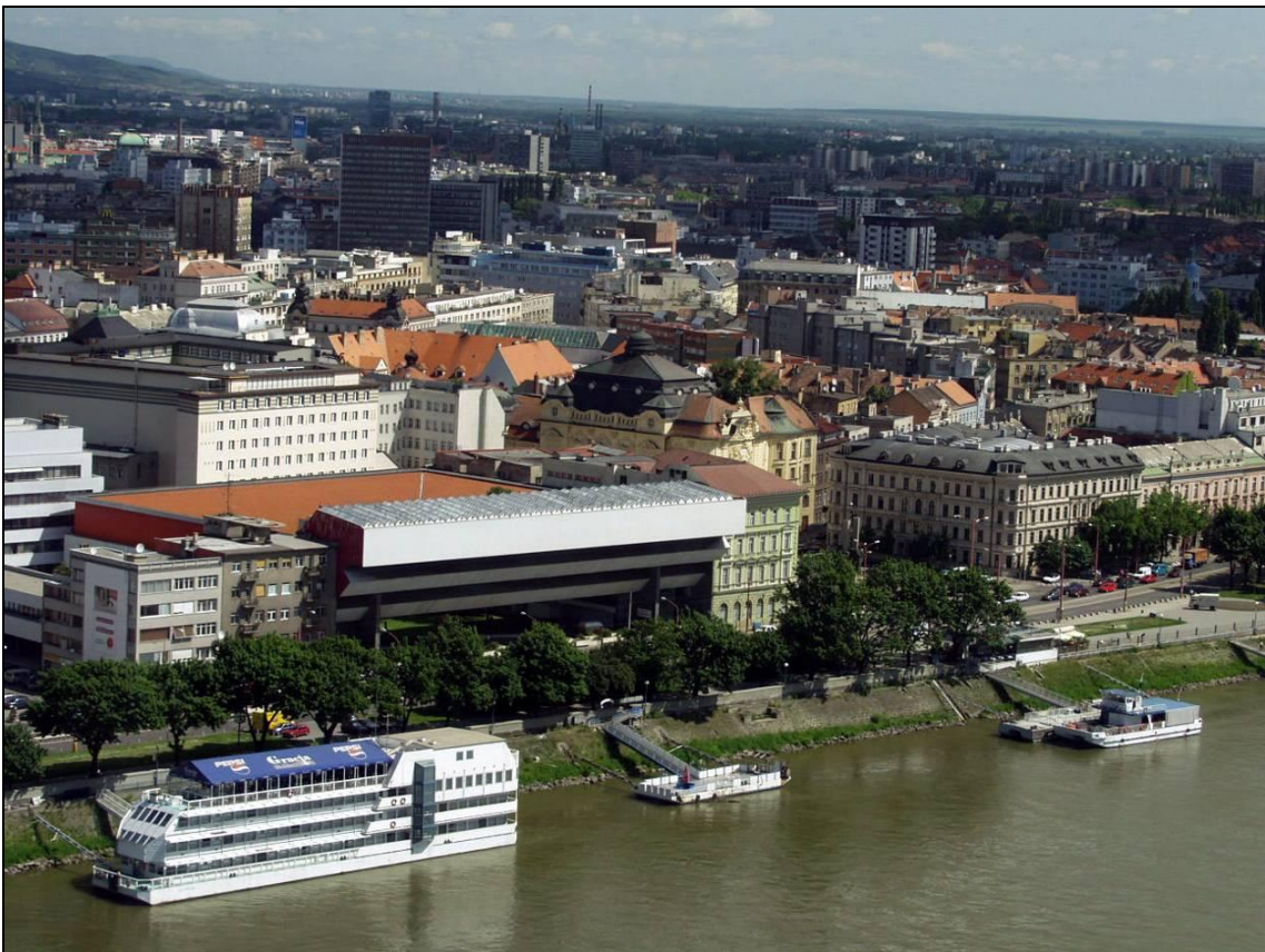
Zástavba Rázusovho nábrežia - Slovenská národná galéria, pohľad z Nového mosta, 15. 5. 2002