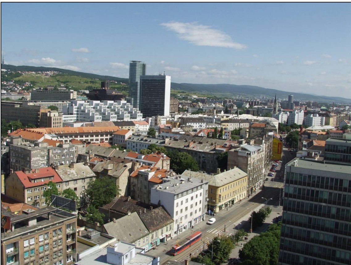
Zástavba Špitálskej ulice, pohľad z hotela Kyjev, 11. 6. 2002