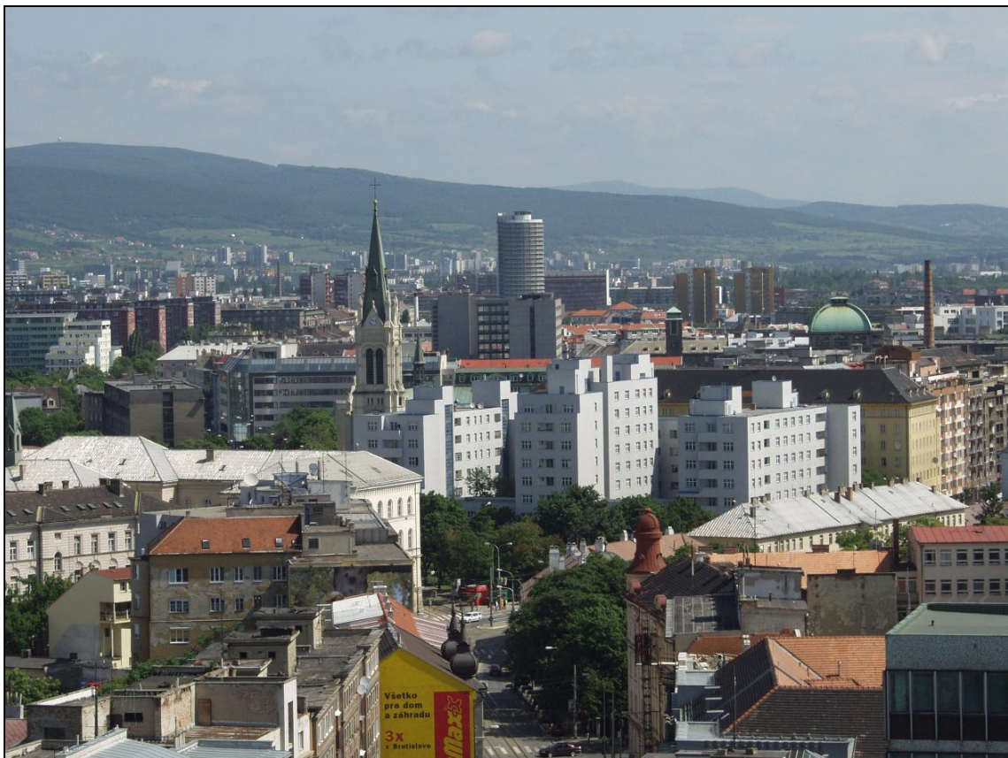
Zástavba okolo Avionu a Blumentálskeho kostola, pohľad z hotela Kyjev, 11. 6. 2002