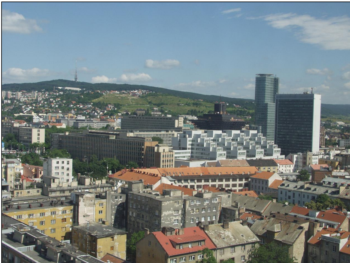
Zástavba medzi Mariánskou a Heydukovou ulicou, pohľad z hotela Kyjev, 11. 6. 2002