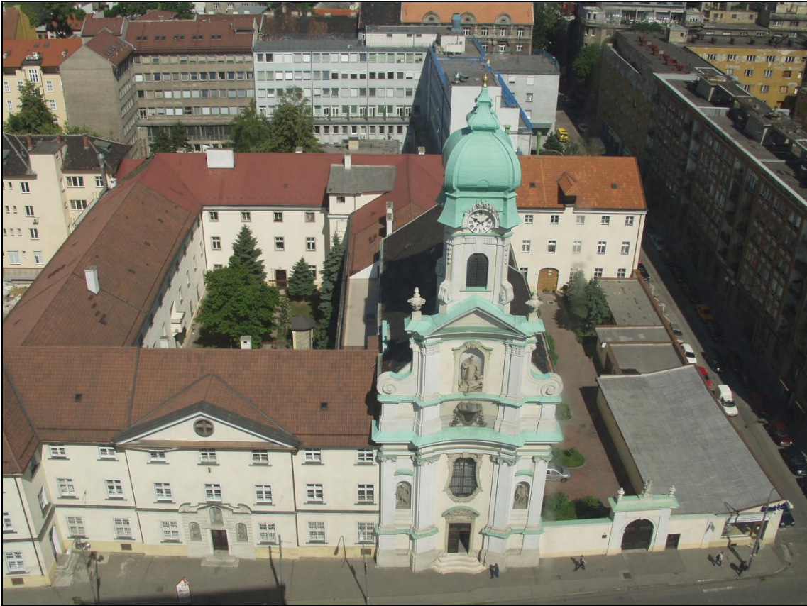
Areál alžbetínskeho kláštora na Špitálskej ulici, pohľad z hotela Kyjev, 11. 6. 2002