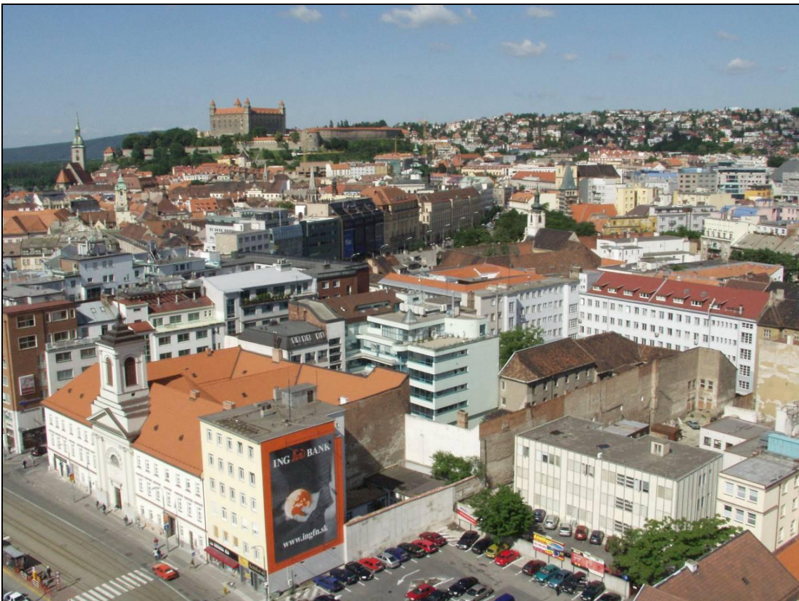
Zástavba Špitálskej a Kolárskej ulice, pohľad z hotela Kyjev, 11. 6. 2002