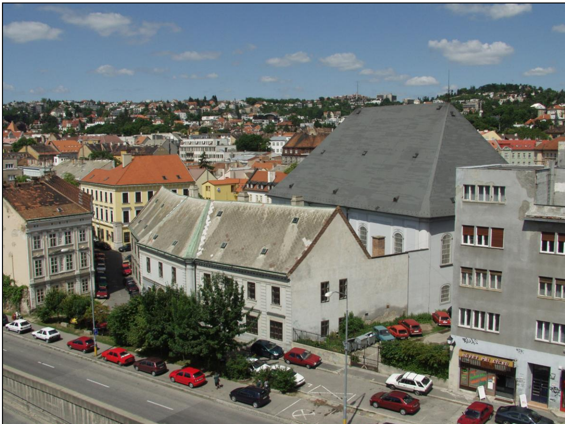
Zástavba okolo Veľkého evanjelického kostola, pohľad z budovy Slovenskej Sporiteľne, 11. 6. 2002