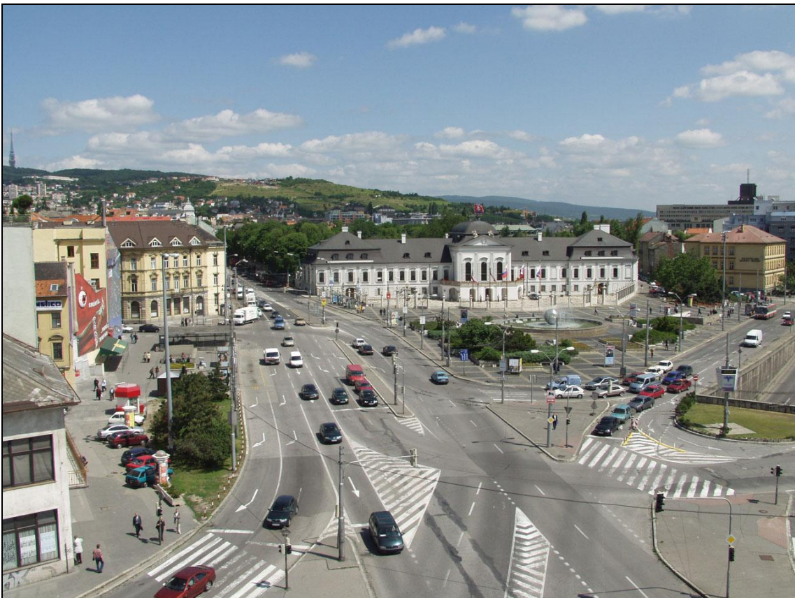
Priestor Hodžovho námestia, pohľad z budovy Slovenskej Sporiteľne, 11. 6. 2002