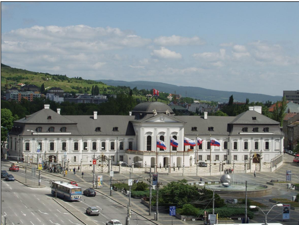
Grassalkovichov palác, pohľad z budovy Slovenskej Sporiteľne, 11. 6. 2002