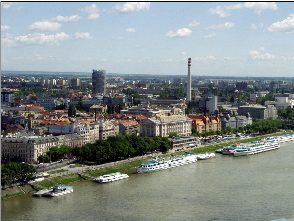
Zástavba Vajanského a Fajnorovho, pohľad z Nového mosta, 15. 5. 2002