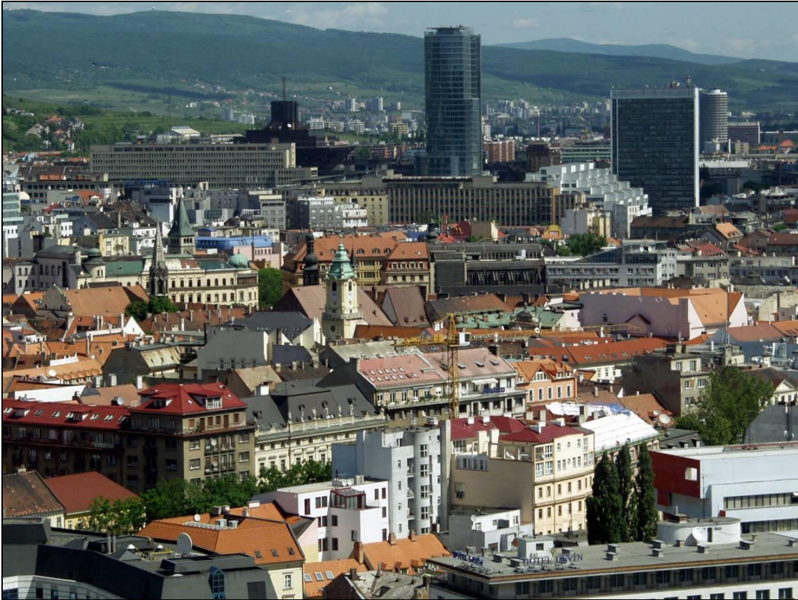
Zástavba v línii Hviezdoslavovho námestie, pohľad z Nového mosta, 15. 5. 2002