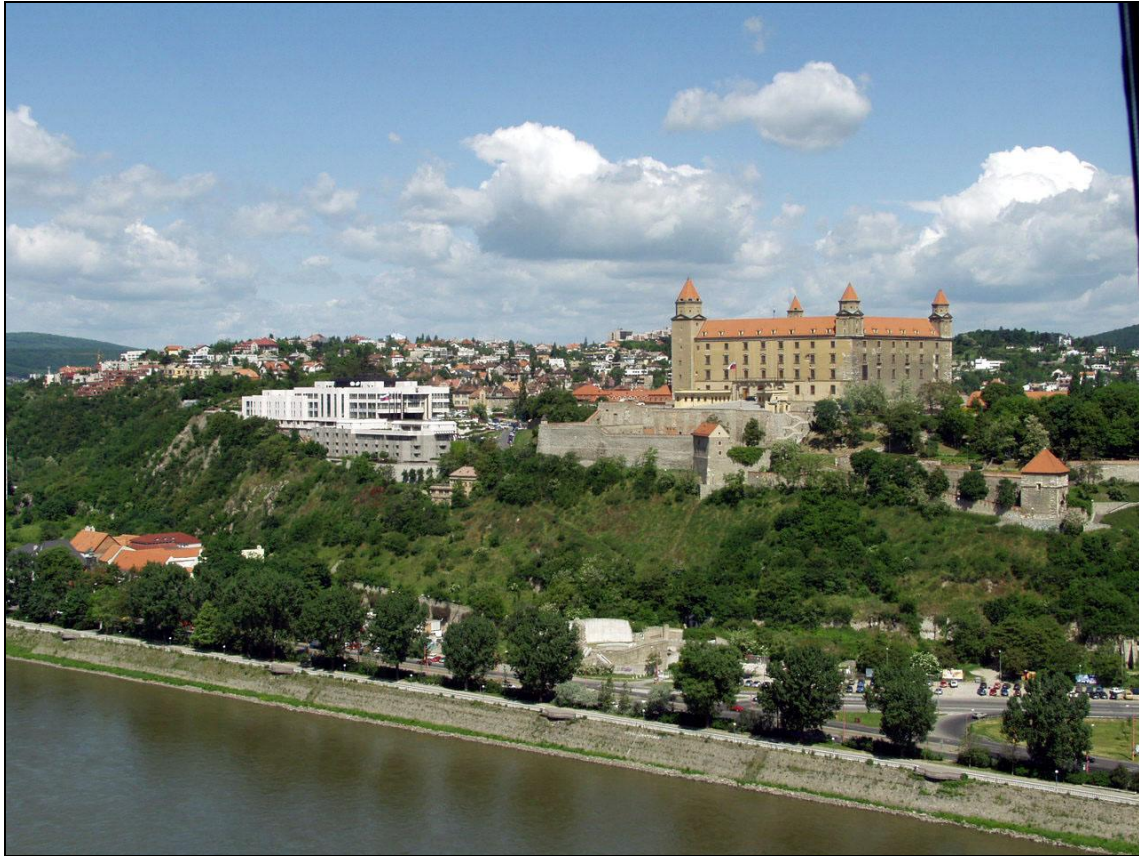
Hradný kopec s príľahlou vilovou zástavbou, pohľad z Nového mosta, 15. 5. 2002