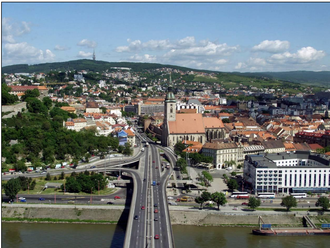
Vyústenie mosta do Staromestskej ulice, pohľad z Nového mosta, 15. 5. 2002