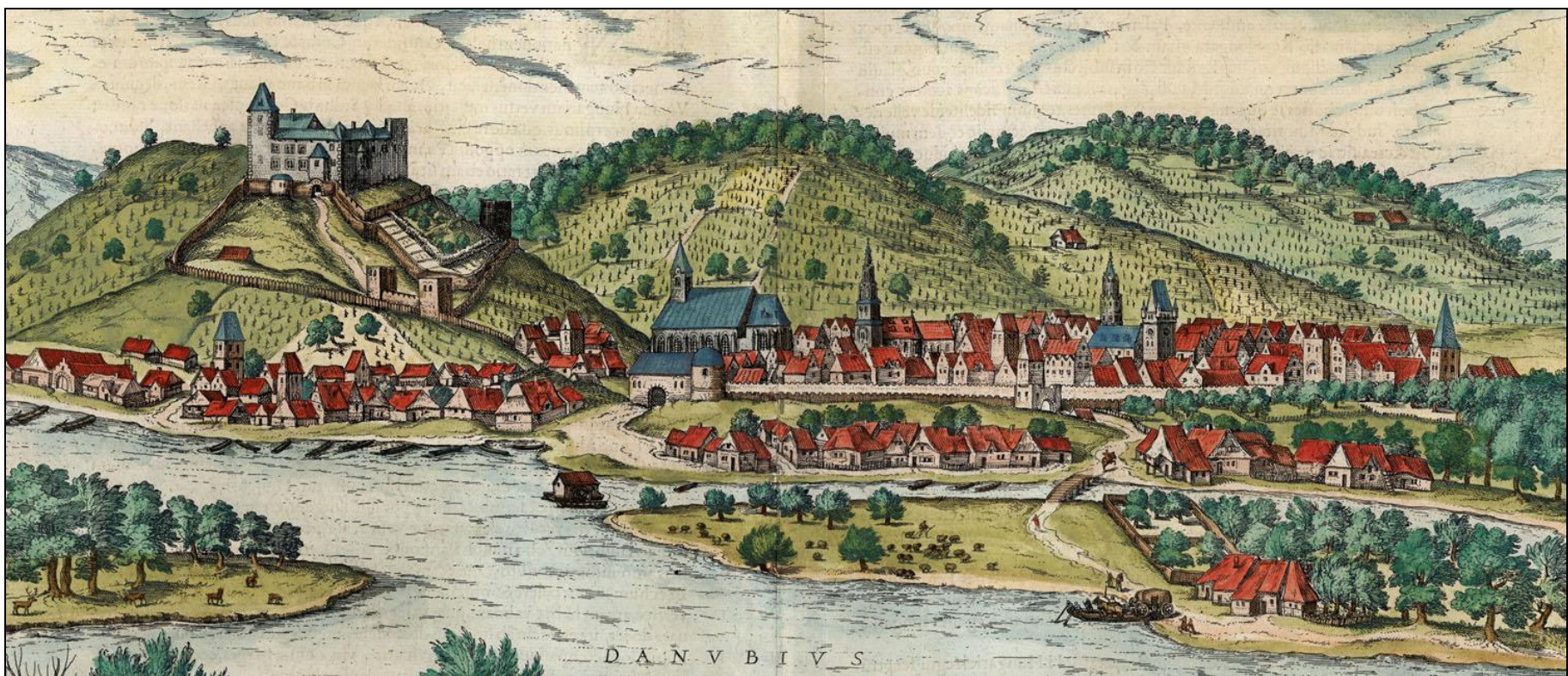
Bratislava z juhu, medirytina F. Hogenberga 1593