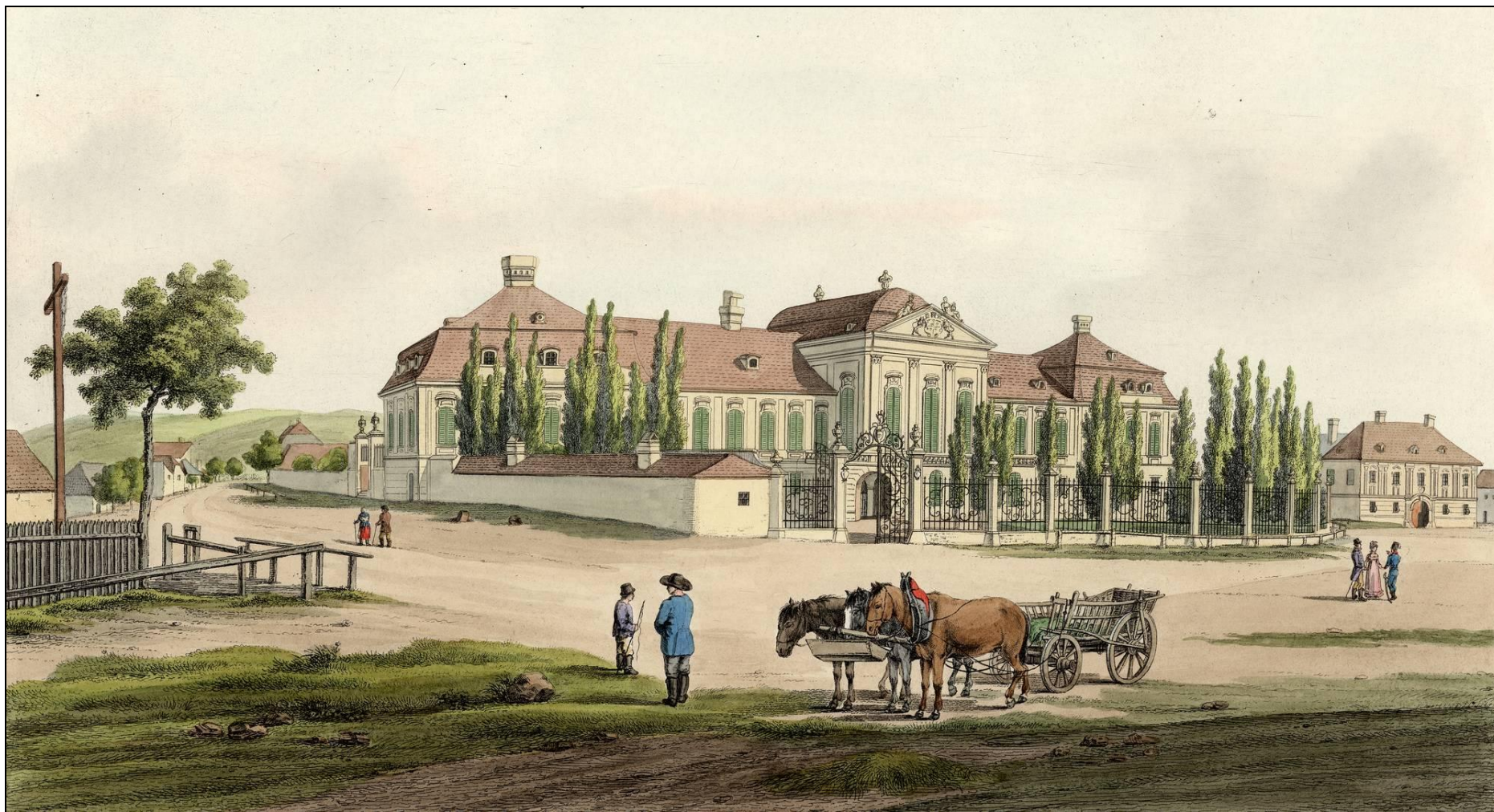
Grassalkovichov palác, kolorovaný lept C. Bschora 1815