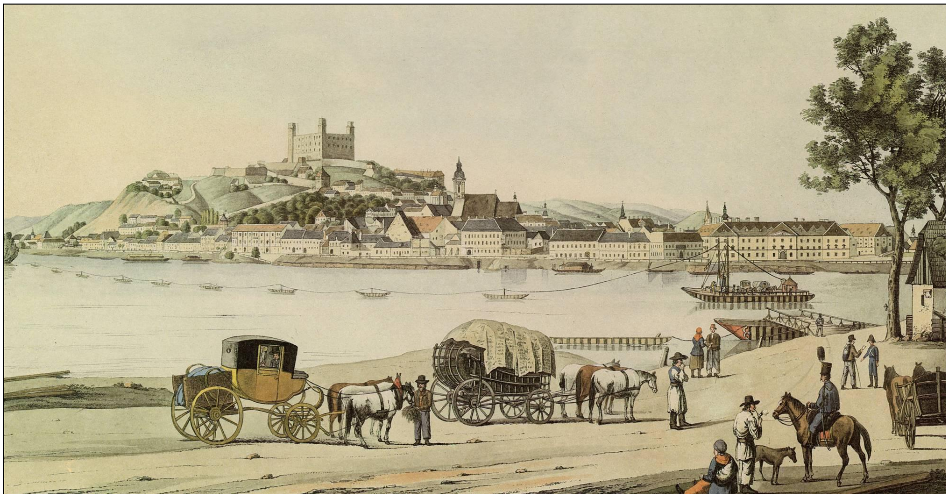
Bratislava z juhu, kolorovaný lept C. Bschora 1815, MMB Bratislava