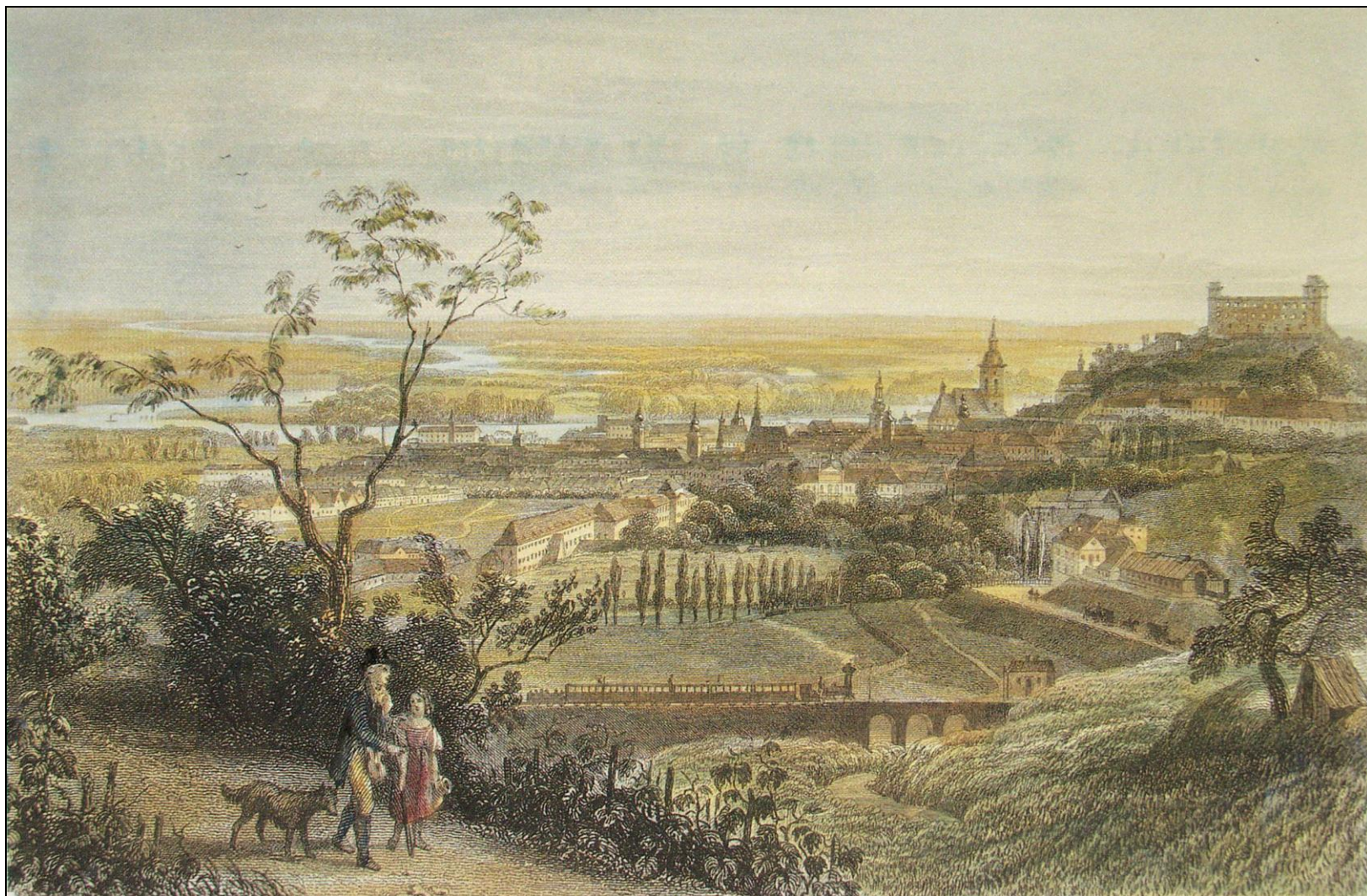
Bratislava od severu, oceľorytina L. Rohbocka 1856, GMB Bratislava