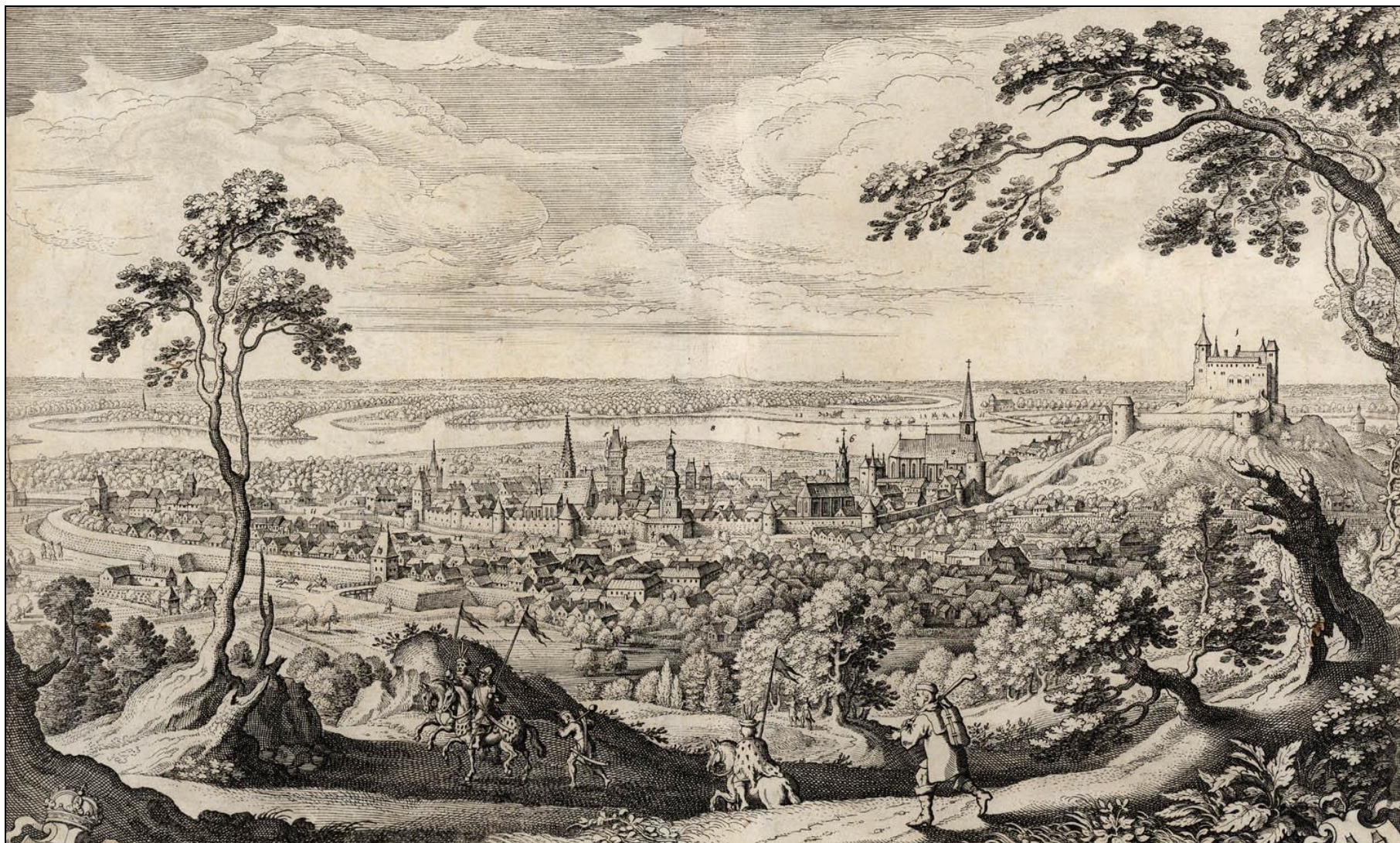
Bratislava od severu, medirytina M. Meriana 1638