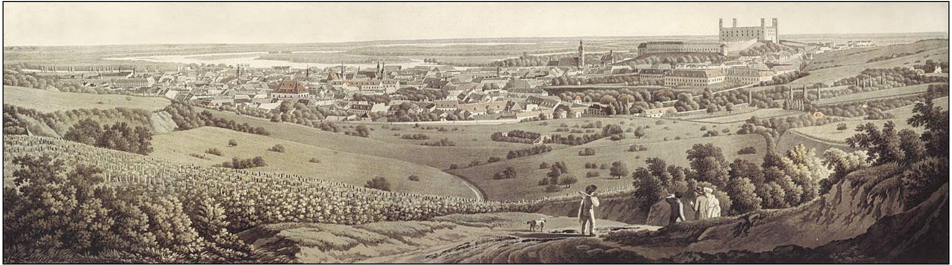
Bratislava od severu, litografia J.A. Lántza 1817, MMB Bratislava