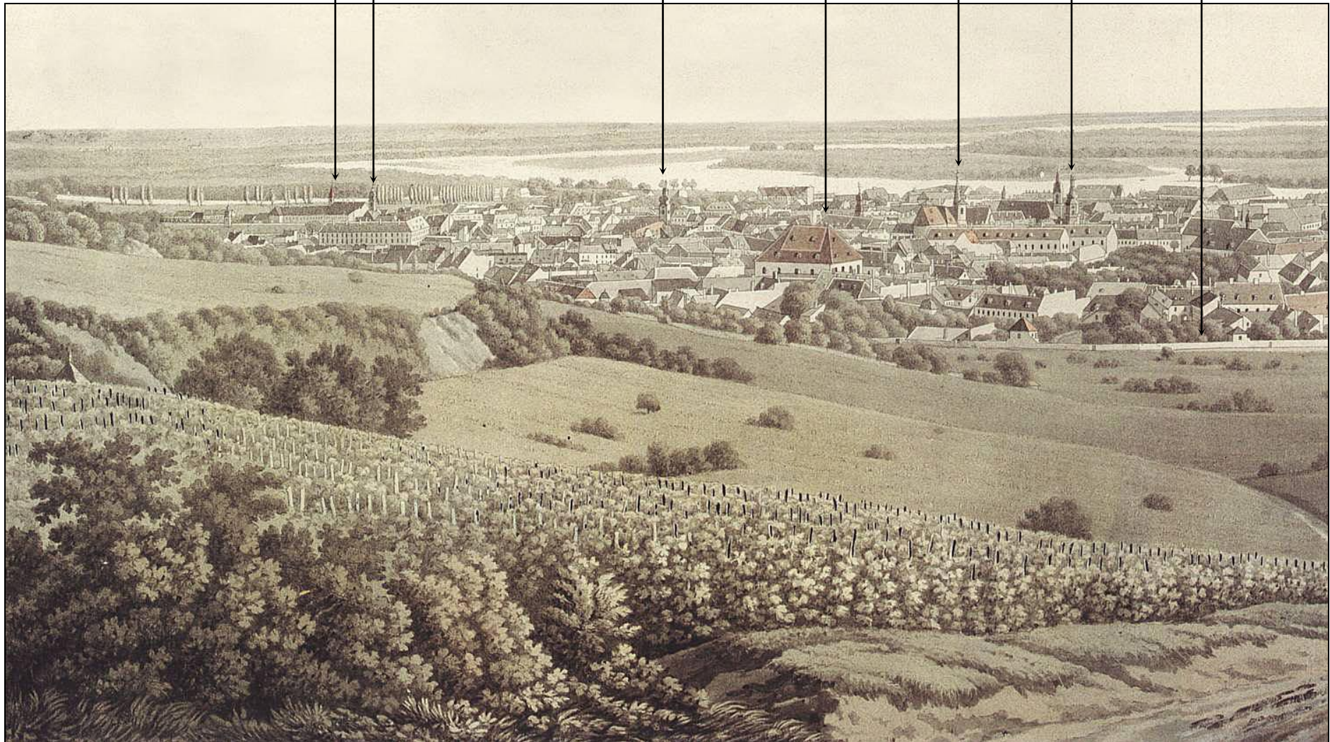
Bratislava od severu, výrez, litografia J.A. Lántza 1817, MMB Bratislava