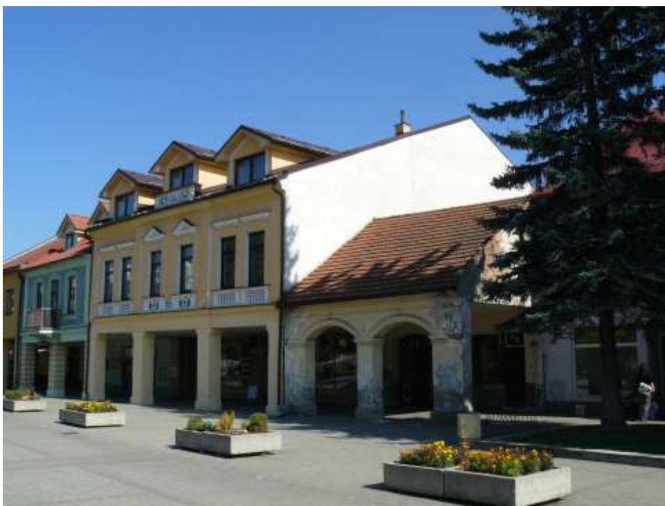
76. Námestie slobody, juhozápadné fasády, rok 2010