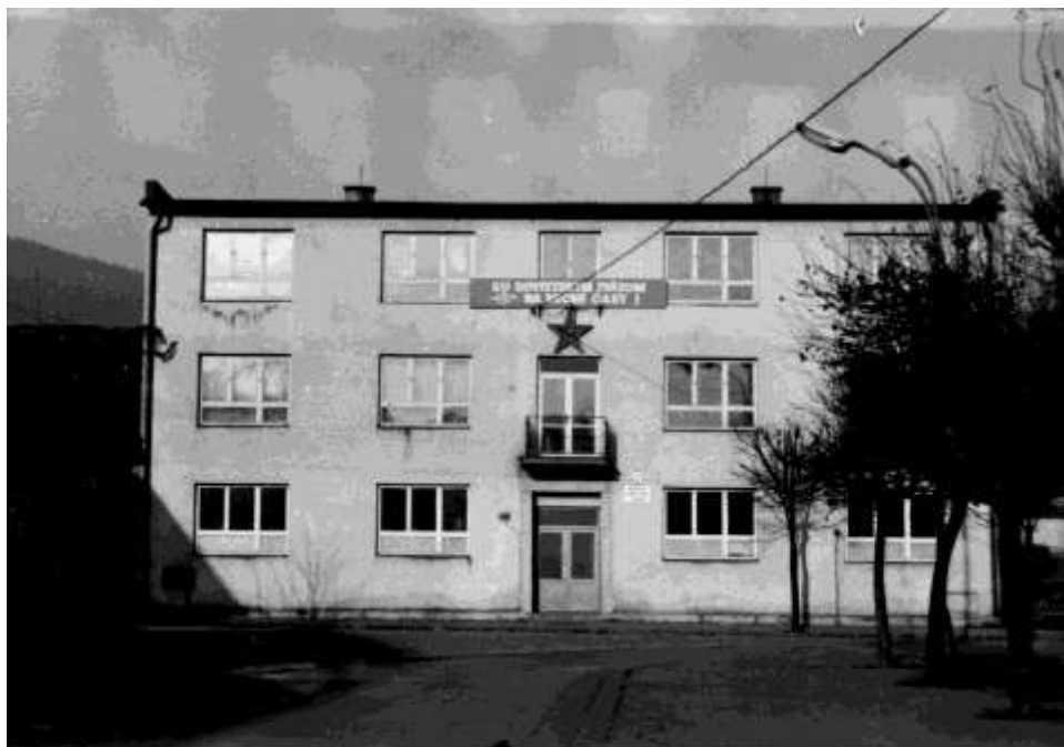
79. Námestie, Budova mestského úradu – „po obnove“ (r. 1980)