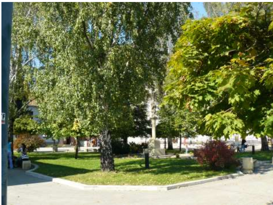
78. Námestie slobody, socha sv. Jána Nepomuckého, rok 2010