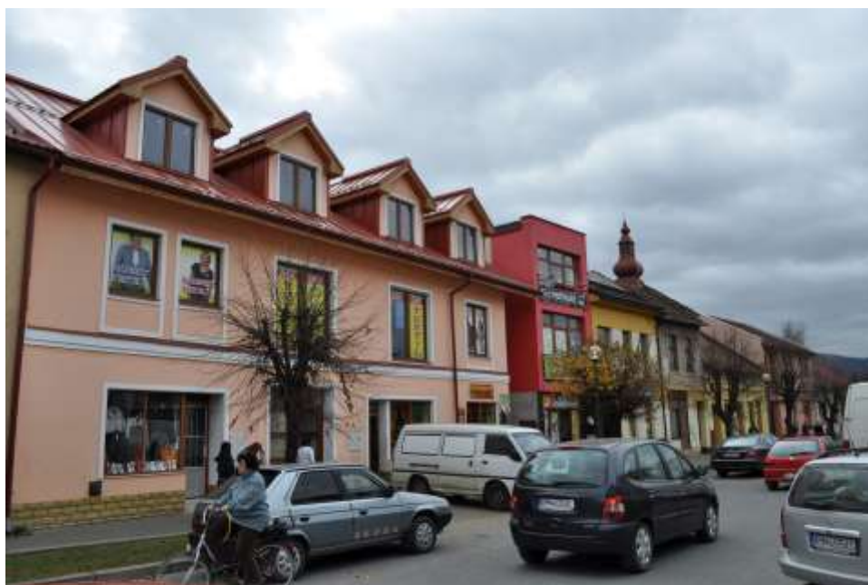
53. Pohľad na severozápadné fasády, rok 2010