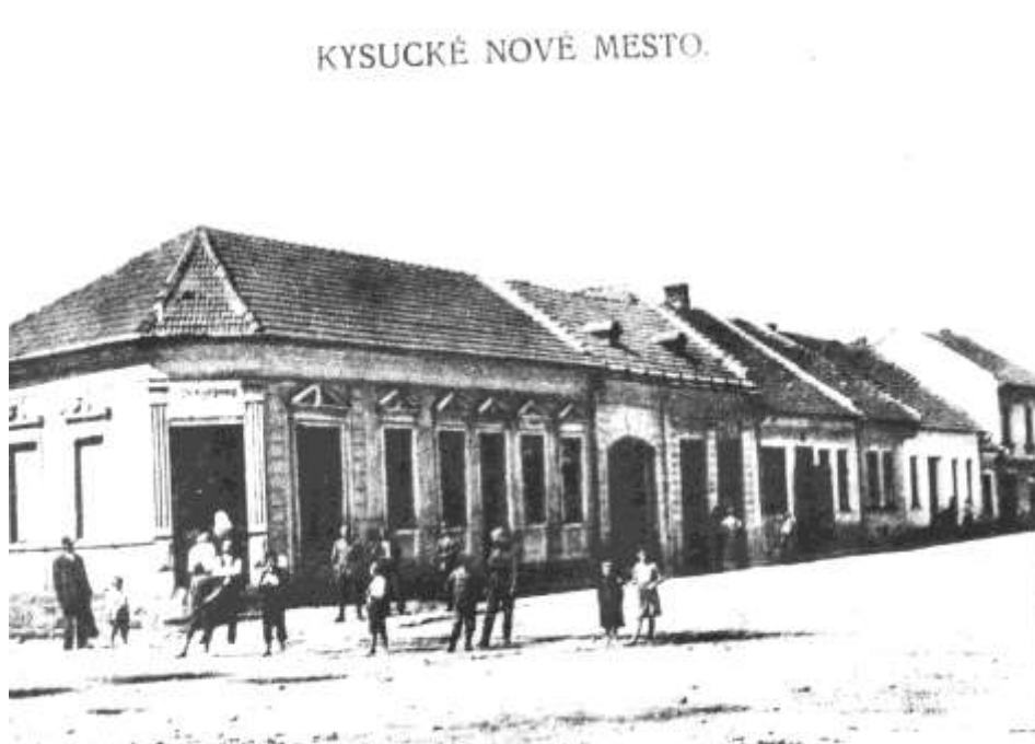
13. Námestie, južná časť ( r. 1930)