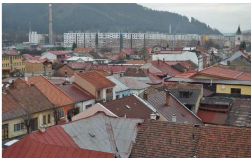
44. Súčasný pohľad, rok 2010, Pohľad z veže kostola Panny Márie – Belanského ulica