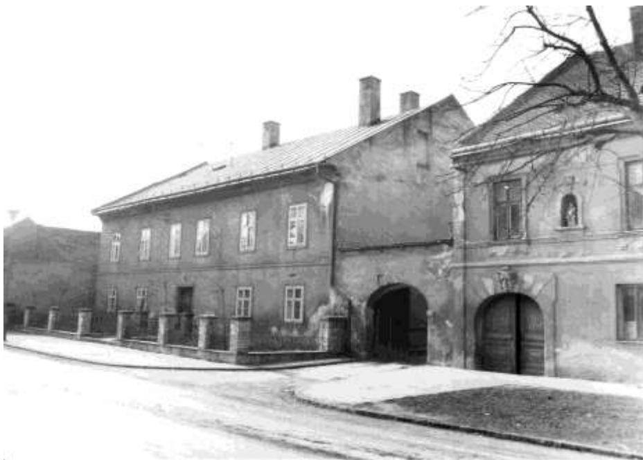
89. Meštiansky dom – „Stará fara“, č. ÚZPF 10697/0 (r. 1974)