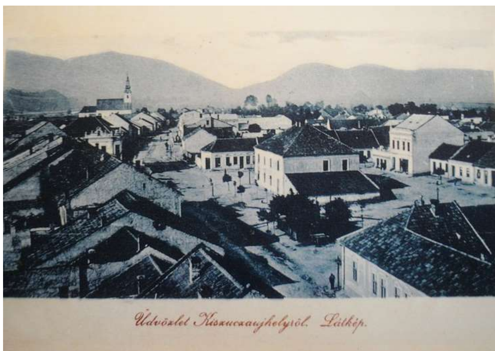
38. Pohľad z veže kostola sv. Jakuba – námestie (r. 1930)