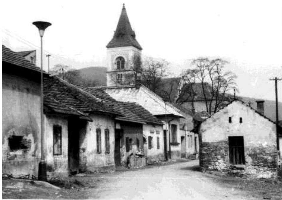
92. Zástavba pod kostolom sv. Jakuba, súčasná Jesenského ul. (r.1963)