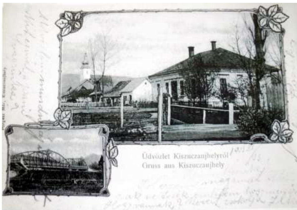
86. Meštiansky dom č. 75