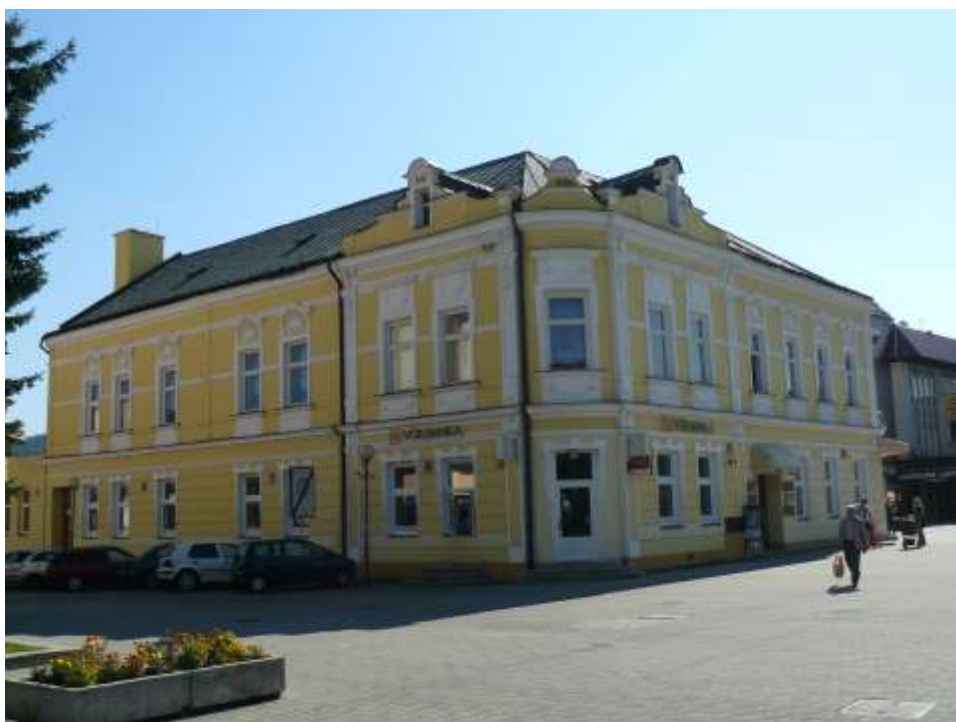
72. Námestie, Hotel Mýto č. ÚZPF 10723, rok 2010