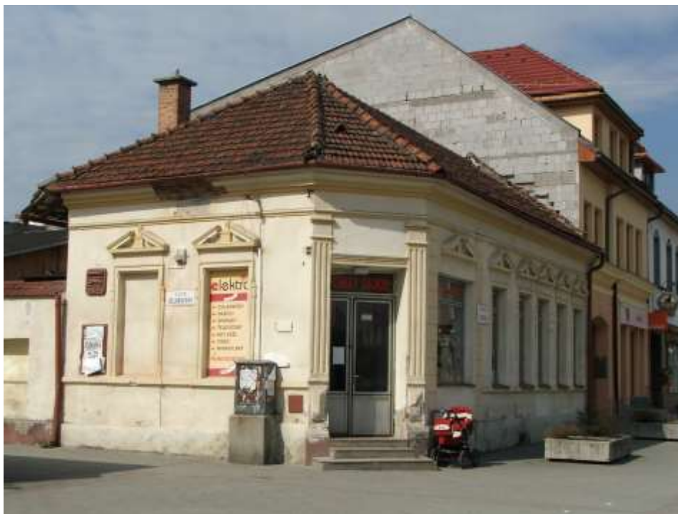
14. Súčasný pohľad, rok 2010, Námestie slobody, južná časť