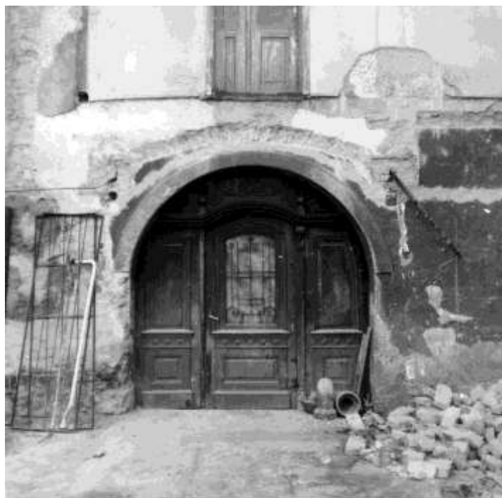
56. Pohľad na dvorový vstup, Meštiansky dom č.ÚZPF 3609/0 (r. 1965)