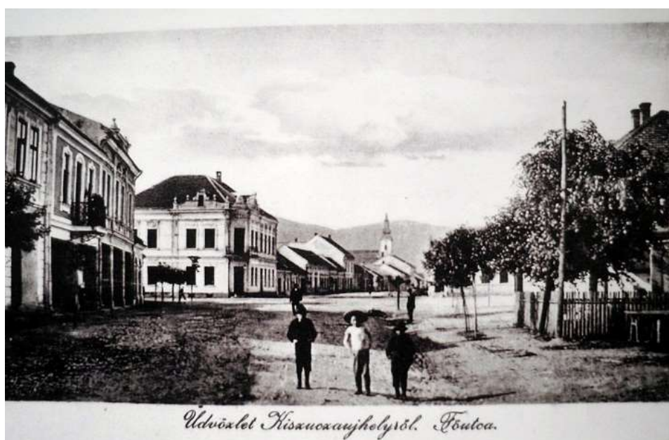
21. Námestie, pohľad na severozápadné fasády Dolnej ulice (1930)