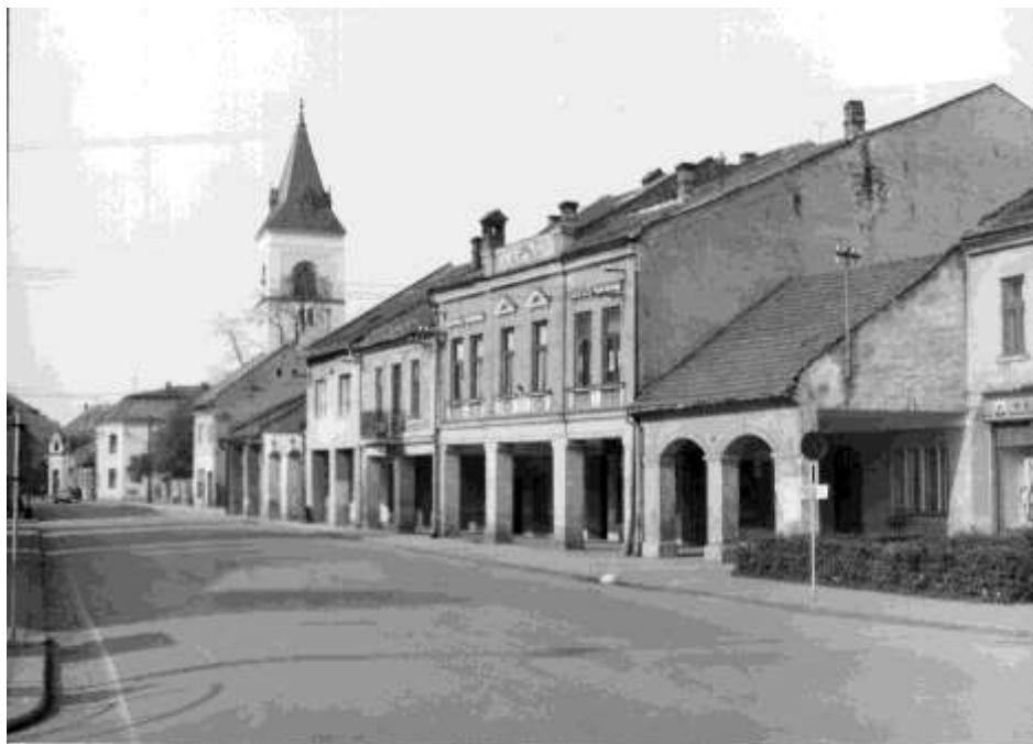
7. Námestie, pohľad na západné fasády (r. 1971)