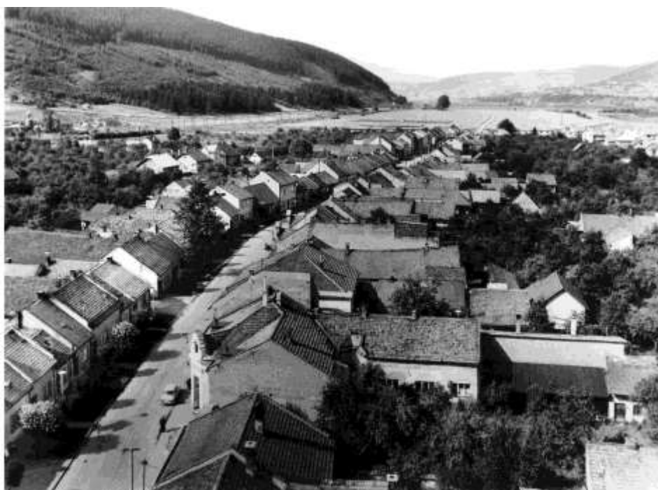
76. Horná ulica, pohľad z veže kostola sv. Jakuba (r. 1974)