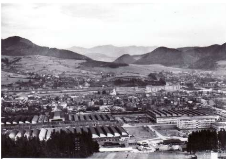
32. Kysucké Nové Město - celkový pohľad (r. 1966)