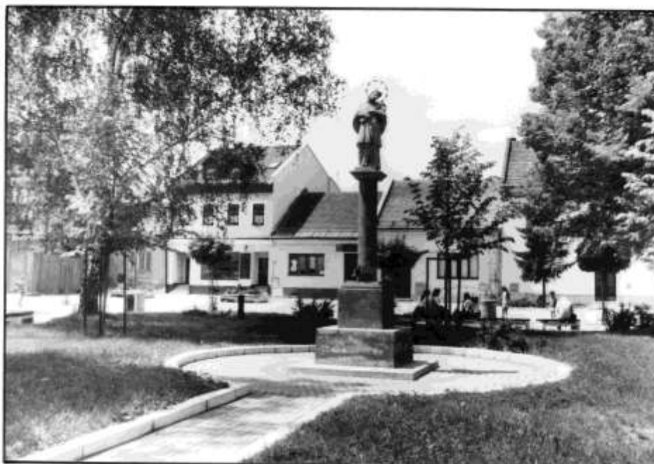
77. Námestie, socha sv. Jána Nepomuckého (r. 1997)