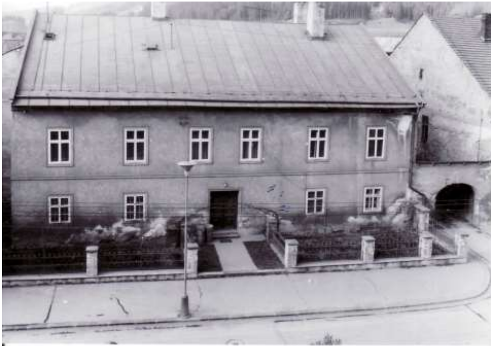
88. Meštiansky dom – „Stará fara“, č. ÚZPF 10697/0 (r. 1970)