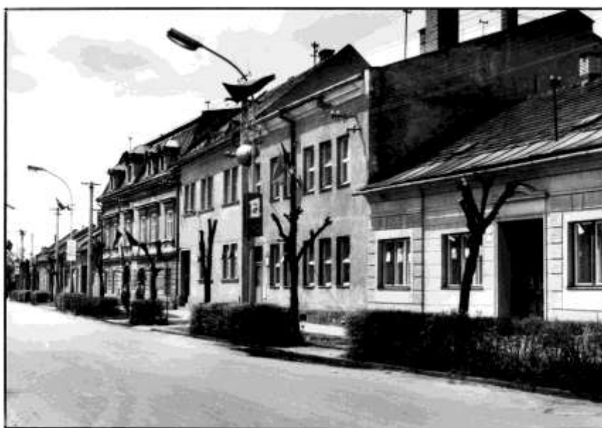
62. Dolná ulica – severovýchodné fasády (r.1985)