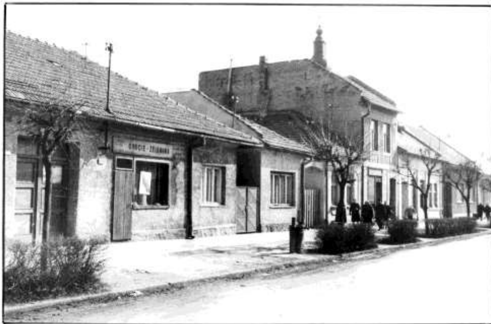
52. Dolná ulica – severozápadné fasády (r. 1965)