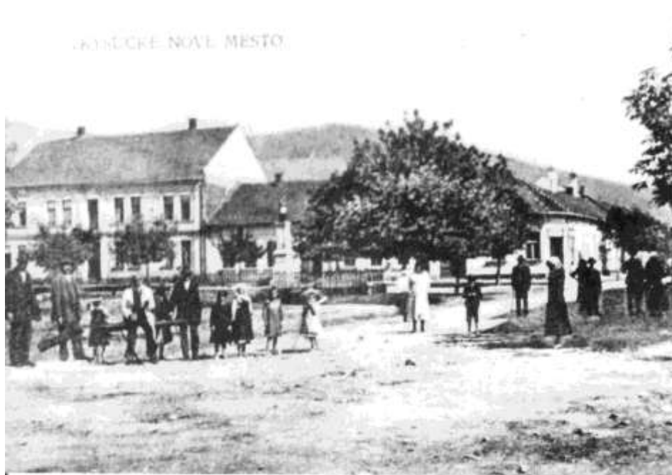
10. Námestie, severná časť (r. 1925)