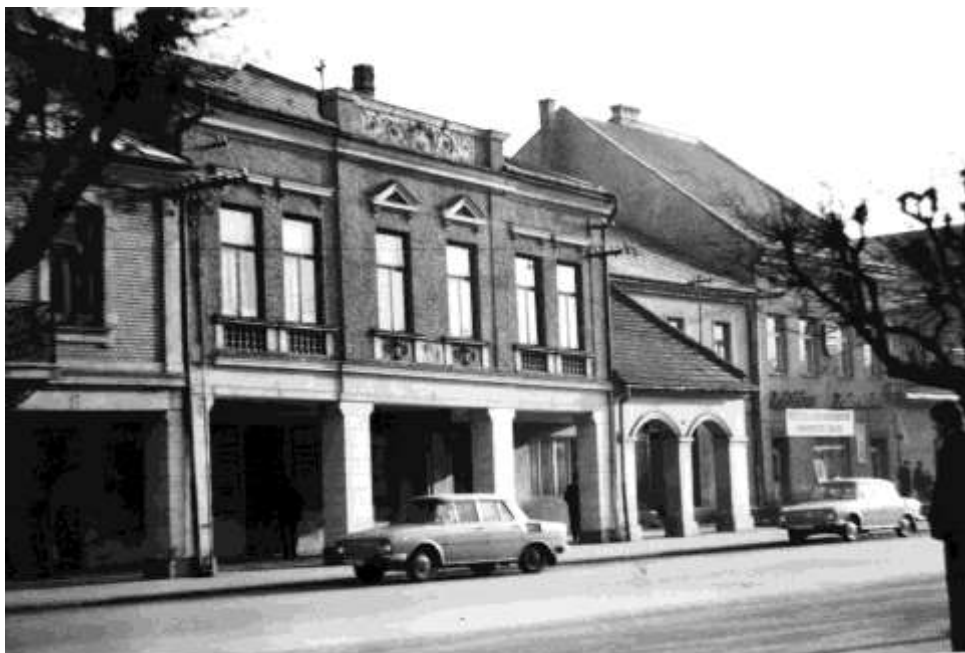
75. Námestie, juhozápadné fasády (r. 1970)