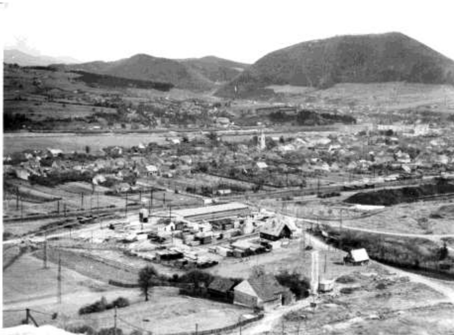
31. Kysucké Nové Město - celkový pohľad, severná časť (r. 1964)