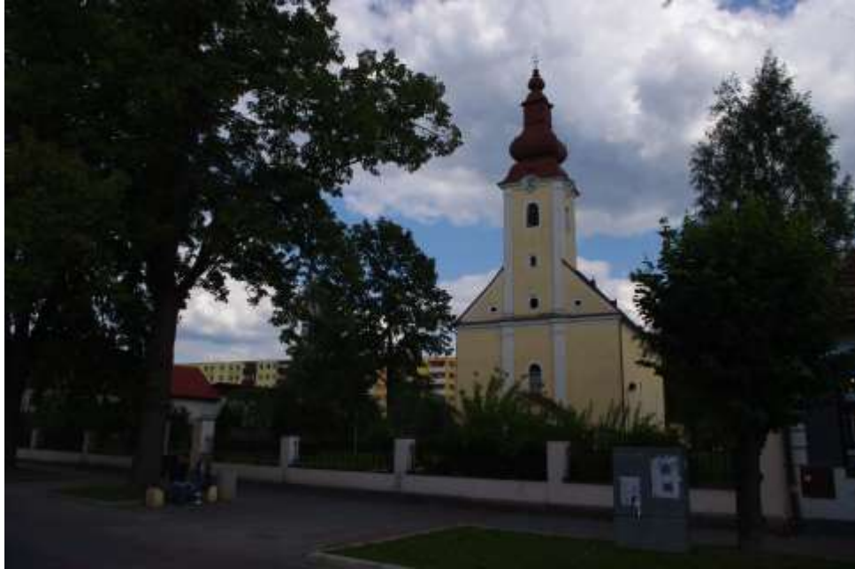
51. Kostol Panny Márie, rok 2010