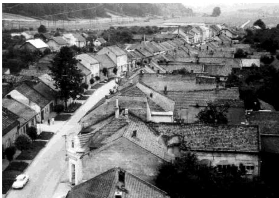
82. Horná ulica, pohľad z kostola sv. Jakuba (r.1974)