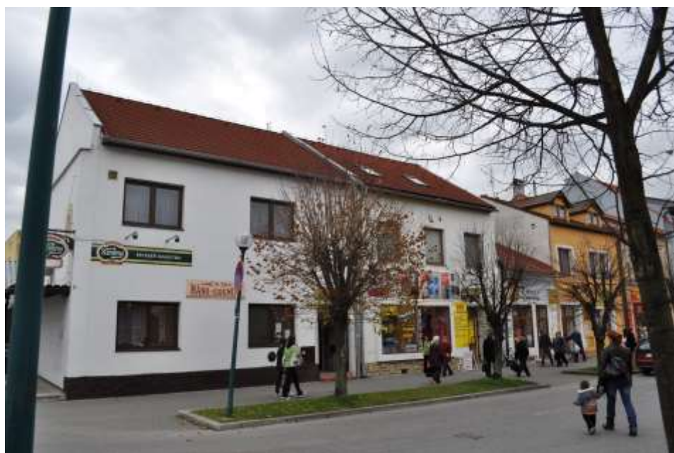
60. Belanského ulica, severozápadné fasády, rok 2010