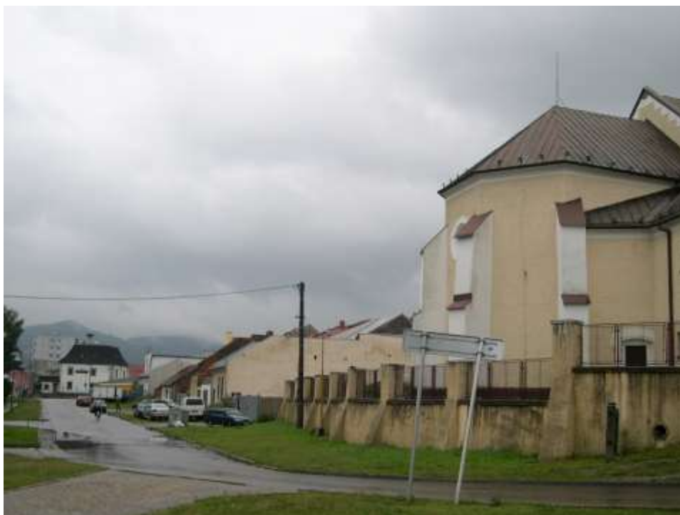
97. Pohľad na Jesenského ulicu, rok 2010