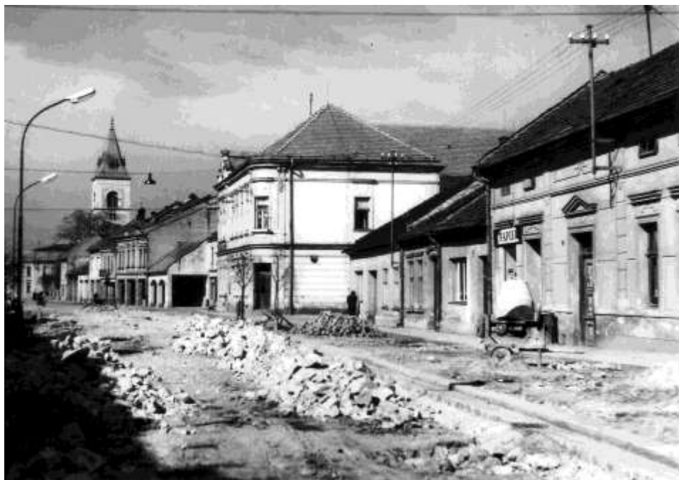
22. Námestie, pohľad na severozápadné fasády Dolnej ulice (r. 1965)