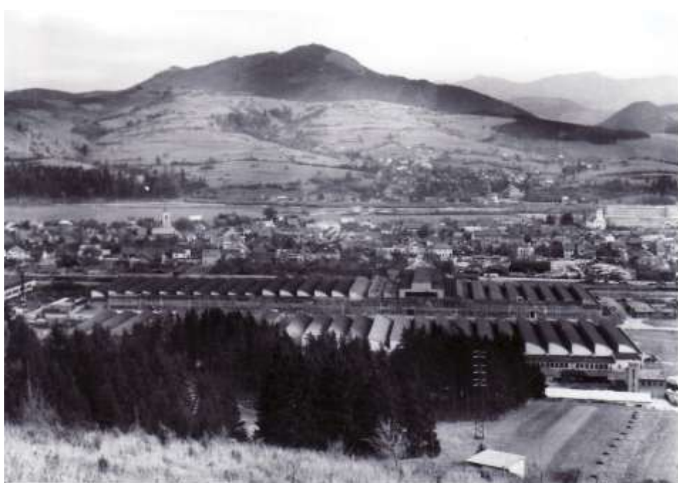
30. Kysucké Nové Mesto - celkový pohľad – stredná časť mesta (r. 1963)