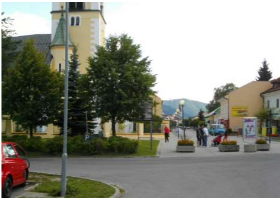
98. Severovýchodný pohľad, rok 2010