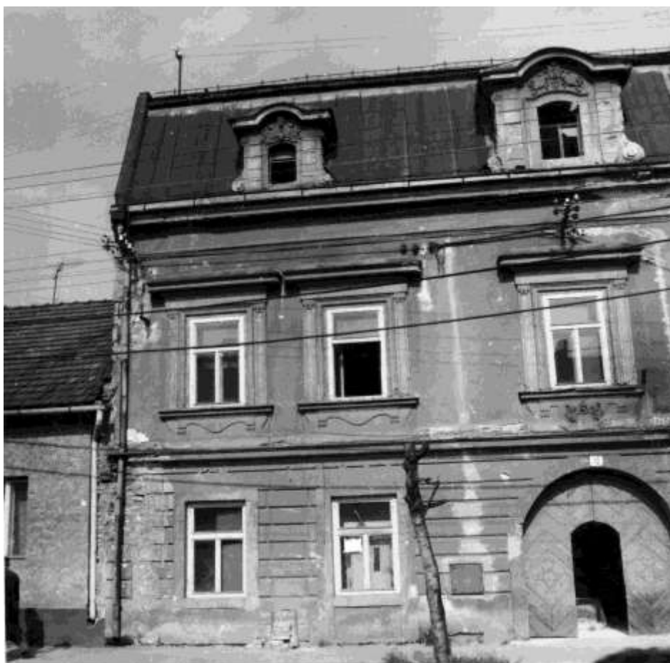
67. Dolná ulica – Meštiansky dom č.ÚZPF 3609/0, Dom Čelkocov