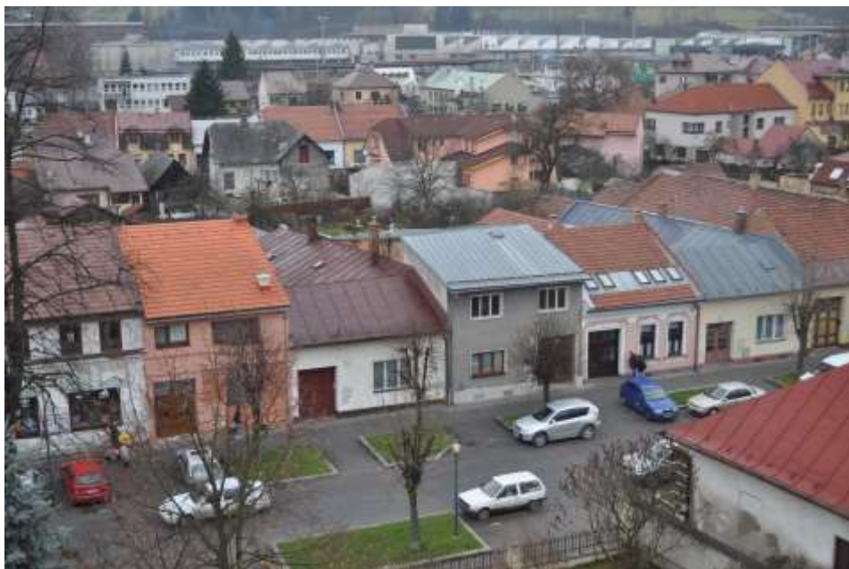
47. Súčasný pohľad, rok 2010, pohľad z veže kostola Panny Márie – Belanského ulica