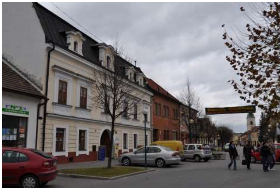
66. Belanského ulica, severovýchodné fasády, veža kostola sv. Jakuba, rok 2010