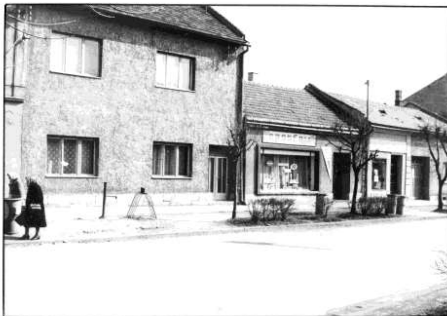
58. Dolná ulica – severozápadné fasády (r. 1965)