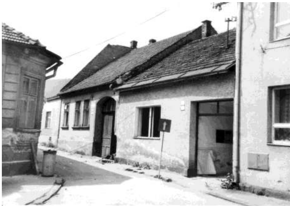
82. Námestie, zástavba v severozápadnom nároží, v súčasnosti asanovaná (r. 1985)