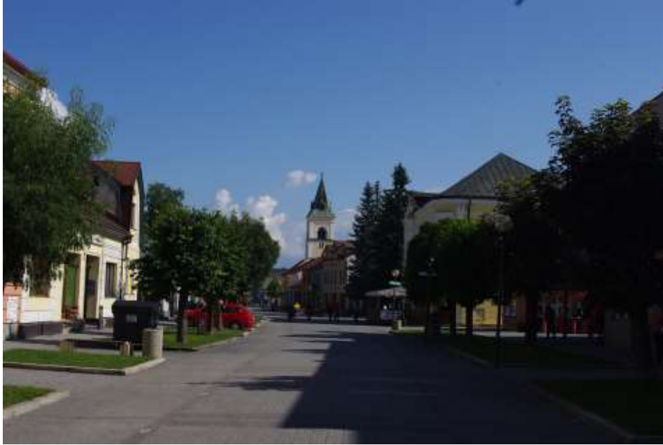
24. Súčasný pohľad, rok 2010, časť Belanského ulice a Námestia slobody