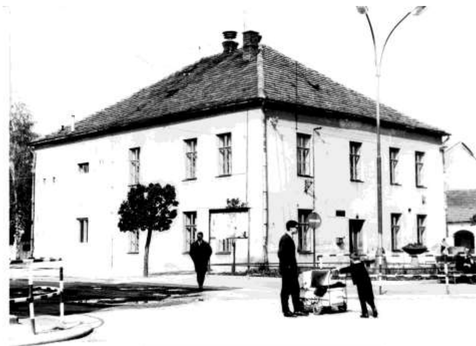
84. Námestie, dom v strede námestia – „Radnica“ (r. 1965)