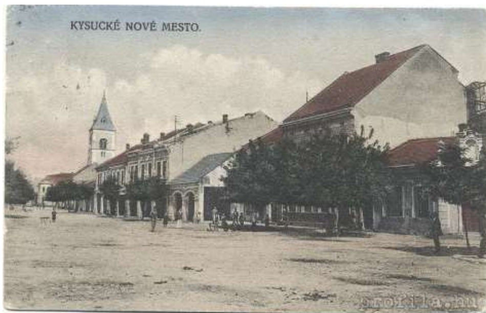
20. Námestie, reprodukcia pohľadnice (r. 1930)