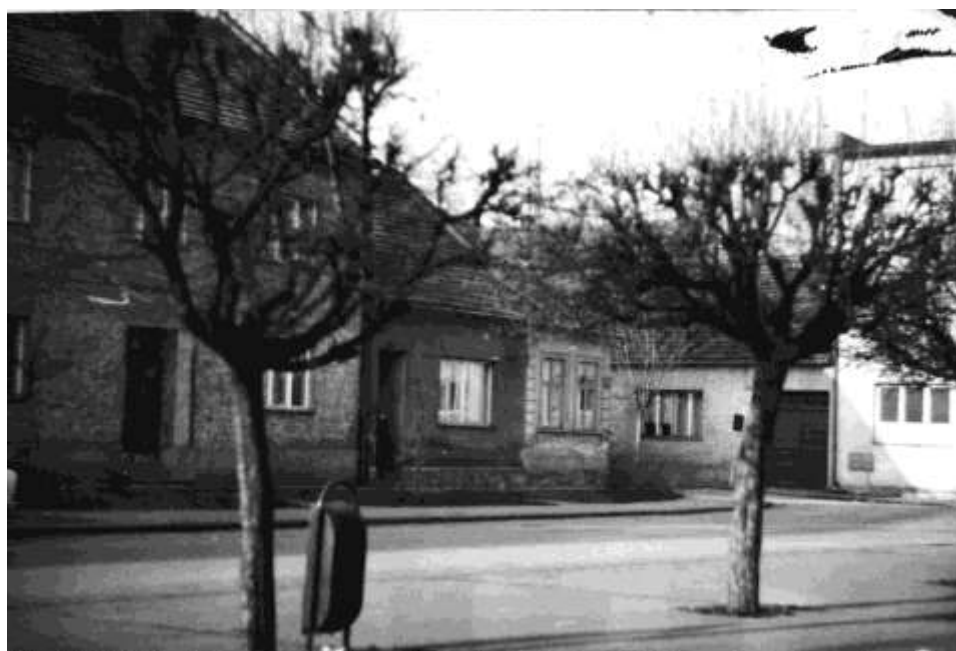
81. Námestie, severozápadné nárožie (r. 1985)