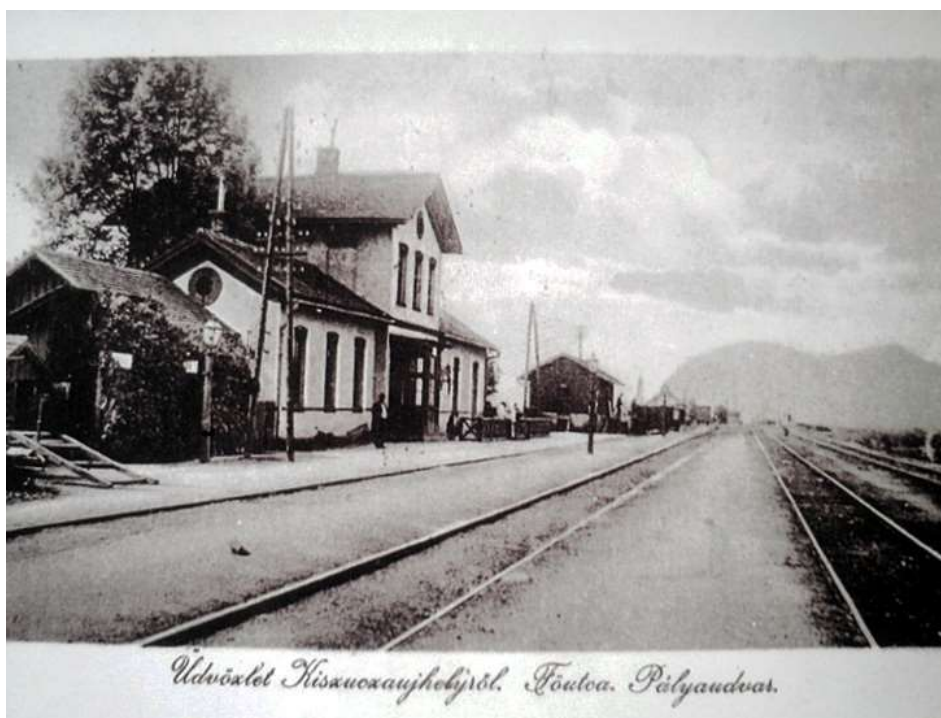
4. Pohľad na železničnú stanicu (r. 1909)