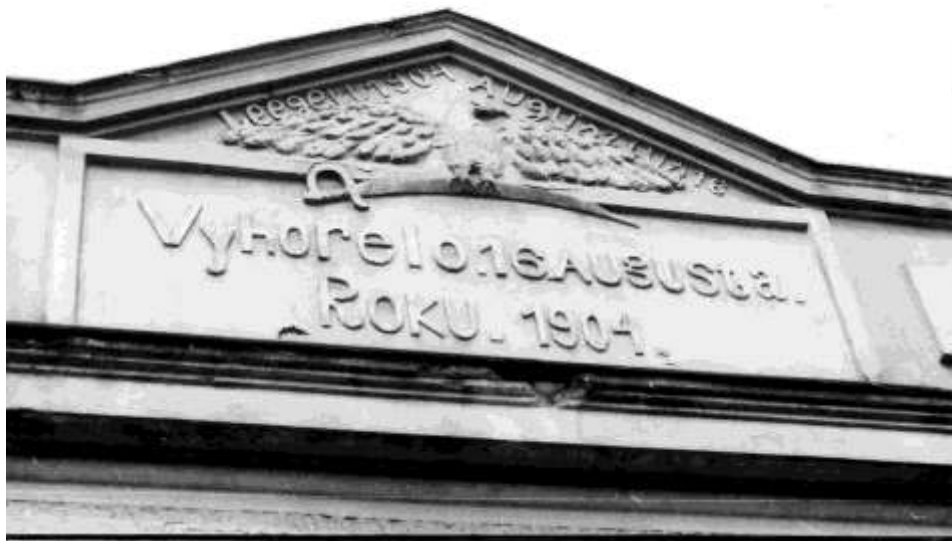
49. Pamätný nápis, Dolná ulica (1958)

KNM-DOLNÁ ULICA-PAMÄTNÝ NÁPIS.