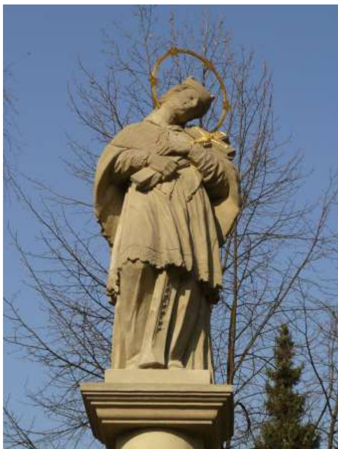
79. Socha sv. Jána Nepomuckého, rok 2010