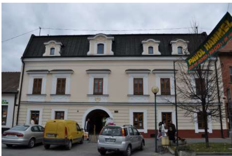
68. Belanského ulica, Meštiansky dom č. ÚZPF 3609/0, rok 2010