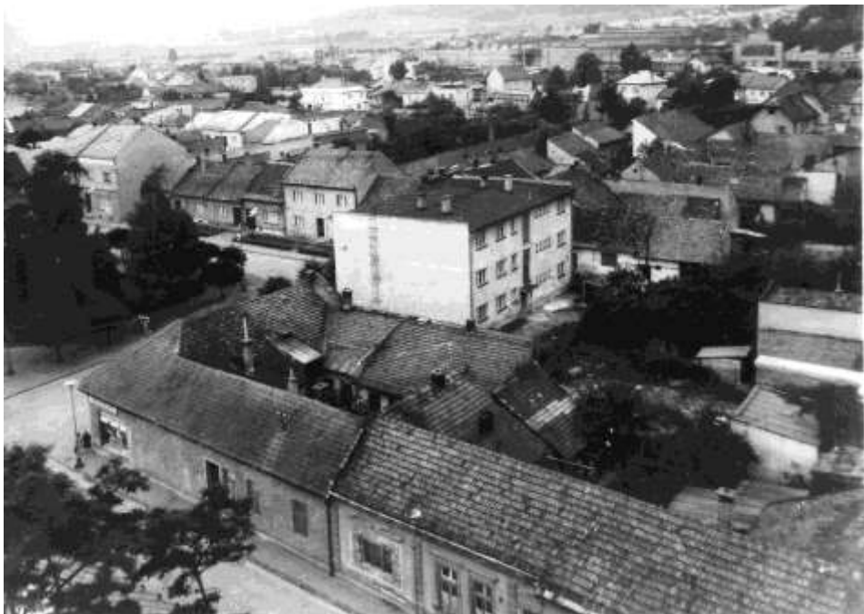
42. Pohľad z veže kostola sv. Jakuba – Mestský úrad, námestie (r. 1974)