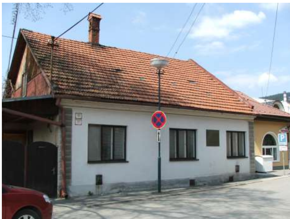
75. Dom Dlhomíra Poľského, rok 2010