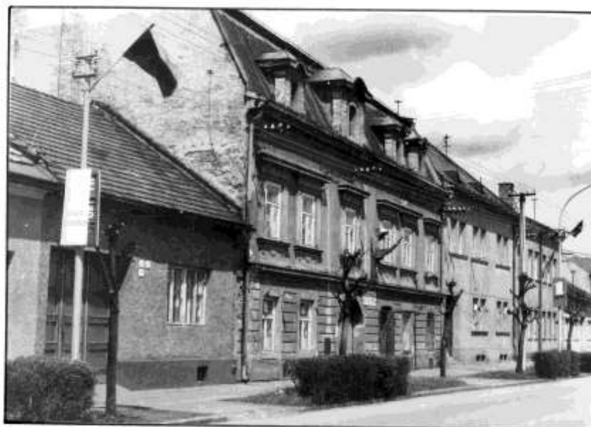
63. Dolná ulica – severovýchodné fasády (r.1985)