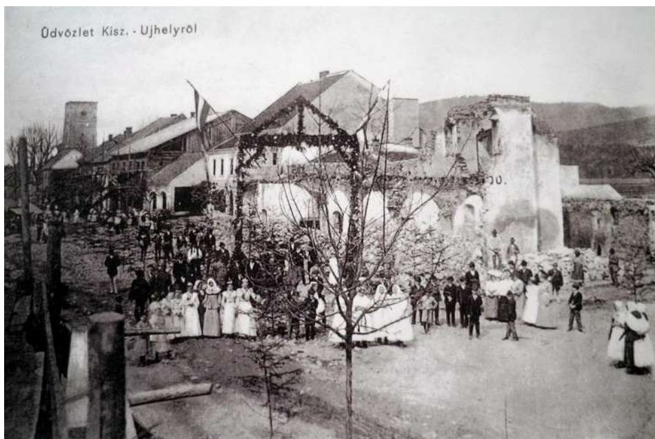
19. Námestie, časť Dolnej ulice po požiari v roku 1904