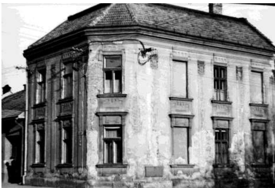
84. Horná ulica r. (1982)