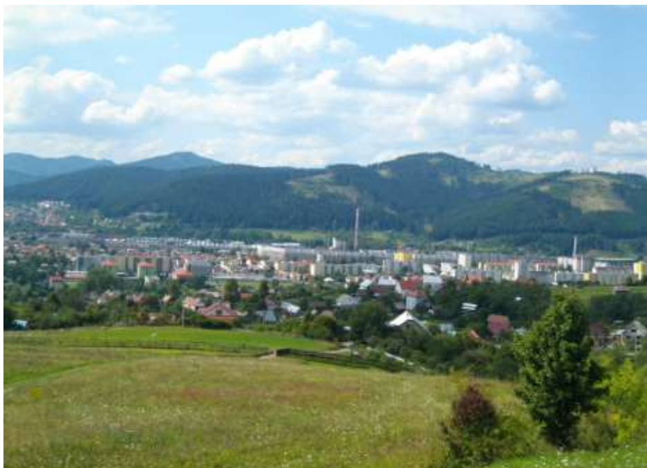
3. Súčasný pohľad, rok 2010, pohľad z Budatínskej Lehoty