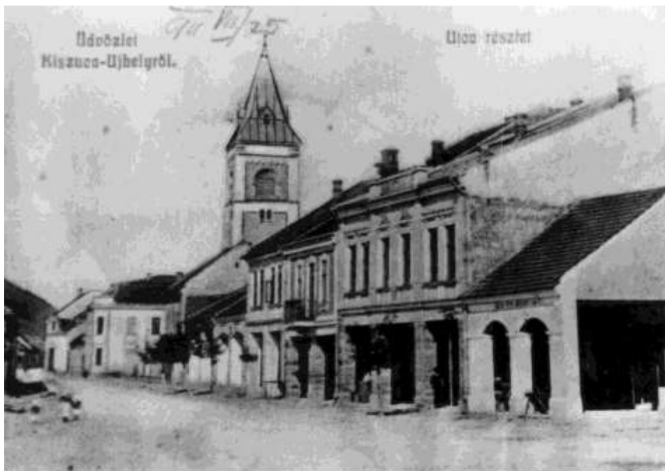
6. Námestie, východná časť, pohľad na vežu kostola sv. Jakuba (r. 1911)