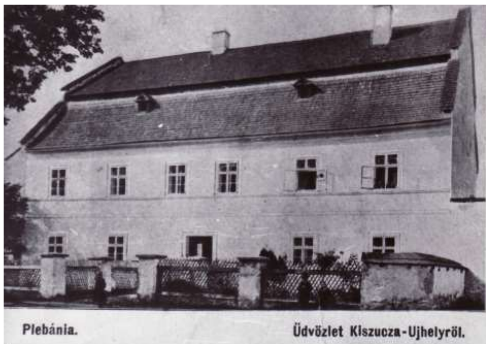
87. Pohľad na Starú faru (r. 1906)