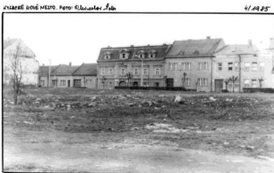
64. Dolná ulica – severovýchodné fasády, asanovaná východná časť, Meštiansky dom č.ÚZPF 3609/0 (r.1985)