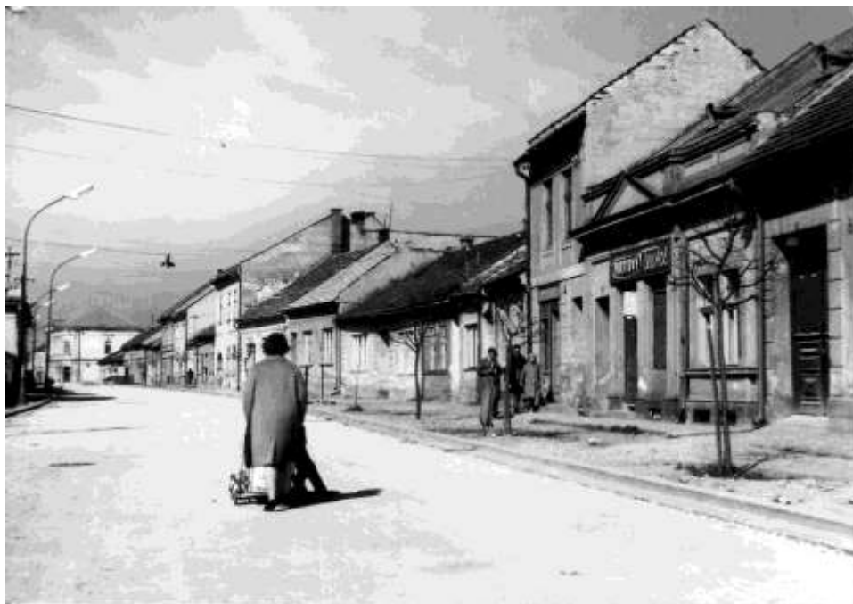
57. Dolná ulica – severozápadné fasády (r. 1965)