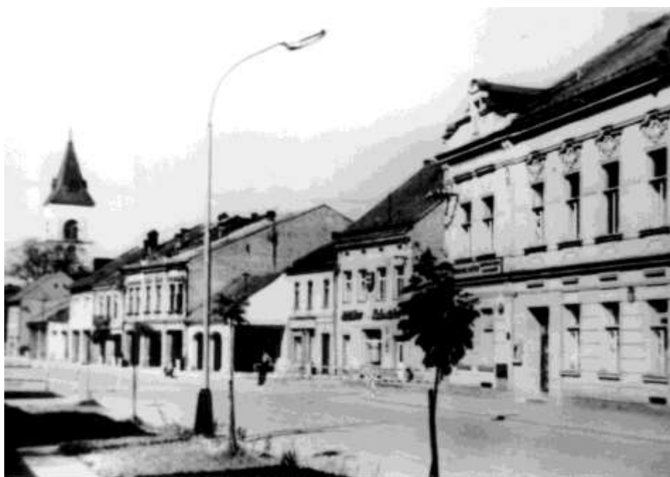
23. Námestie, Hotel Mýto č. ÚZPF 10723 (r. 1970)