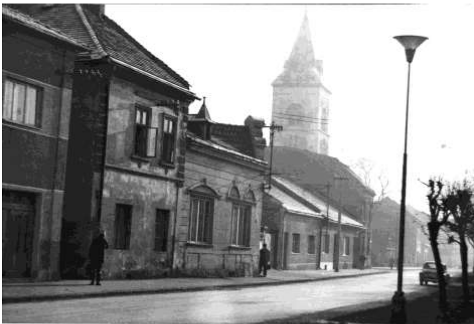
86. Horná ulica r. (1982)