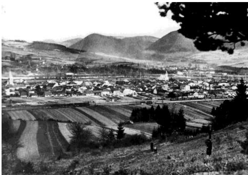
28. Dálkový pohľad, pohľad na veže kostol sv. Jakuba a Panny Márie