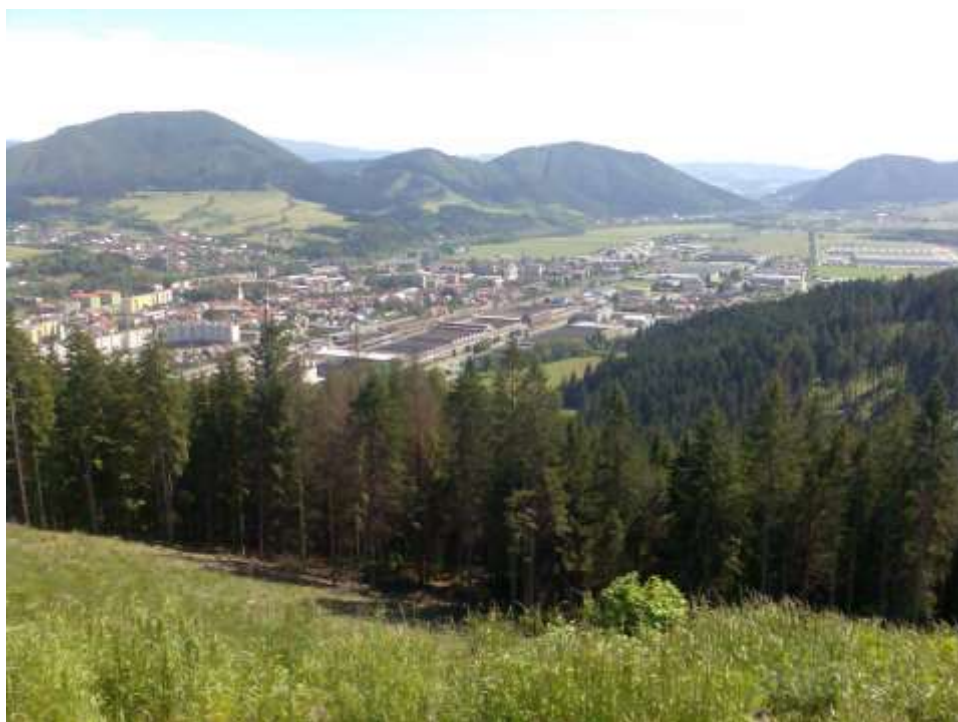
35. Súčasný pohľad, rok 2010, Kysucké Nové Mesto - celkový pohľad z Kopca