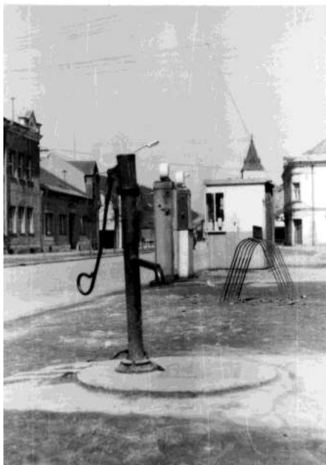
61. Dolná ulica – severozápadná časť – vodná pumpa, benzínová čerpacia stanica (r.1970)