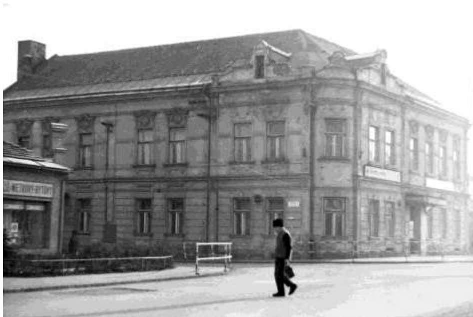
71. Námestie, Hotel Mýto č. ÚZPF 10723 (r. 1970)