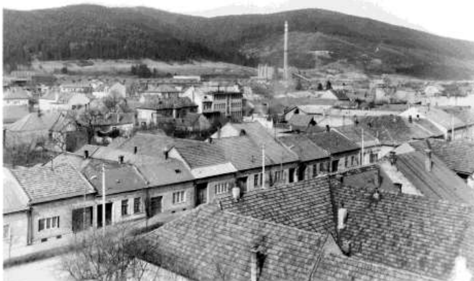
43. Pohľad z veže kostola Panny Márie – Dolná ulica (r. 1973)