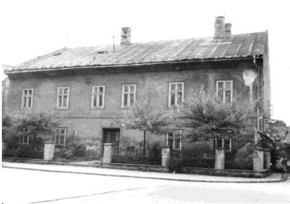
90. Meštiansky dom – „Stará fara“, č. ÚZPF 10697/0 (r. 1982)