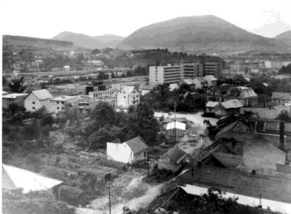
100. Zástavba pod kostolom sv. Jakuba, v pozadí Pivovar, Synagóga. (r.1974)