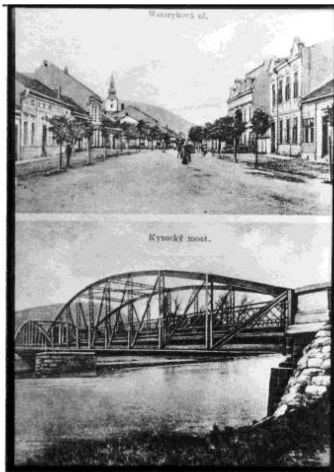
27. Kysucké Nové Město (r. 1932)