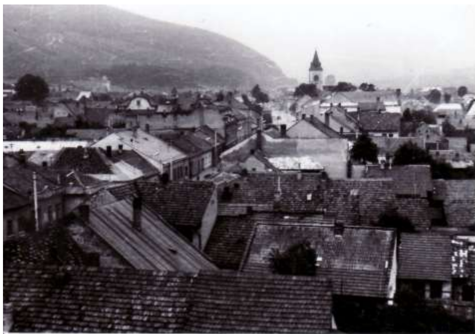
48. Pohľad z veže kostola Panny Márie – Dolná ulica, Námestie, veža kostola sv. Jakuba (r. 1974)