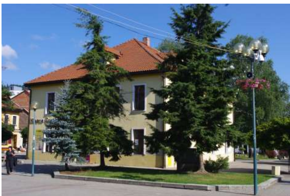
85. Námestie, dom v strede námestia, rok 2010