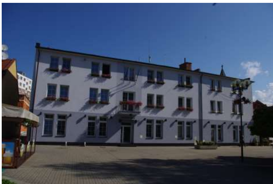
80. Námestie slobody, Budova mestského úradu, rok 2010