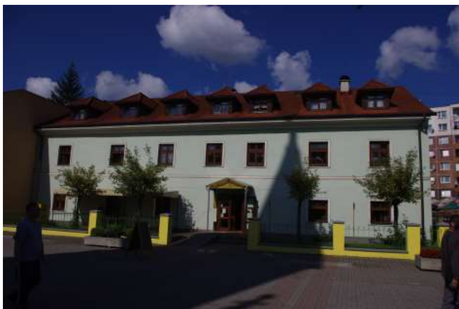
91. Meštiansky dom – „Stará fara“, č. ÚZPF 10697/0, rok 2010