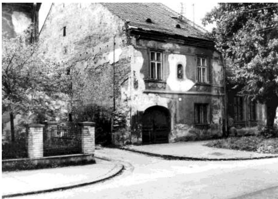
78. Horná ulica (r. 1975)