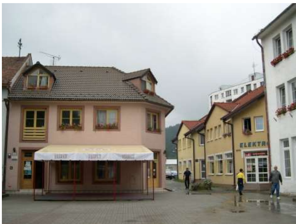
83. Námestie slobody, zástavba v severozápadnom nároží, rok 2010