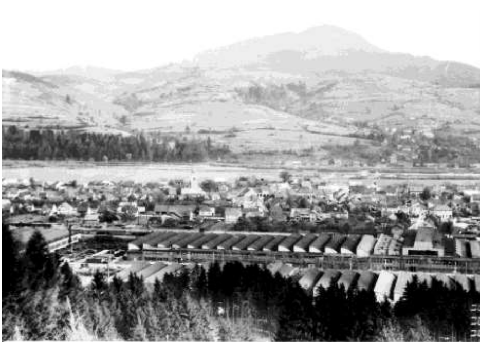
33. Kysucké Nové Mesto - celkový pohľad (r. 1966)