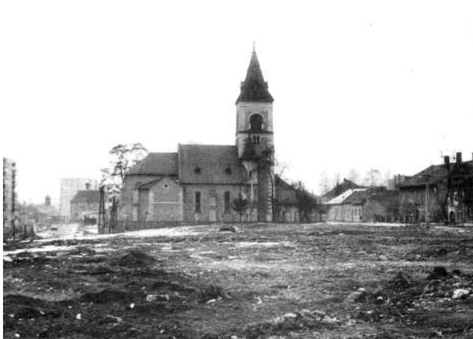
96. Čiastočne asanovaná Horná ulica, pohľad na kostol sv. Jakuba (1985)