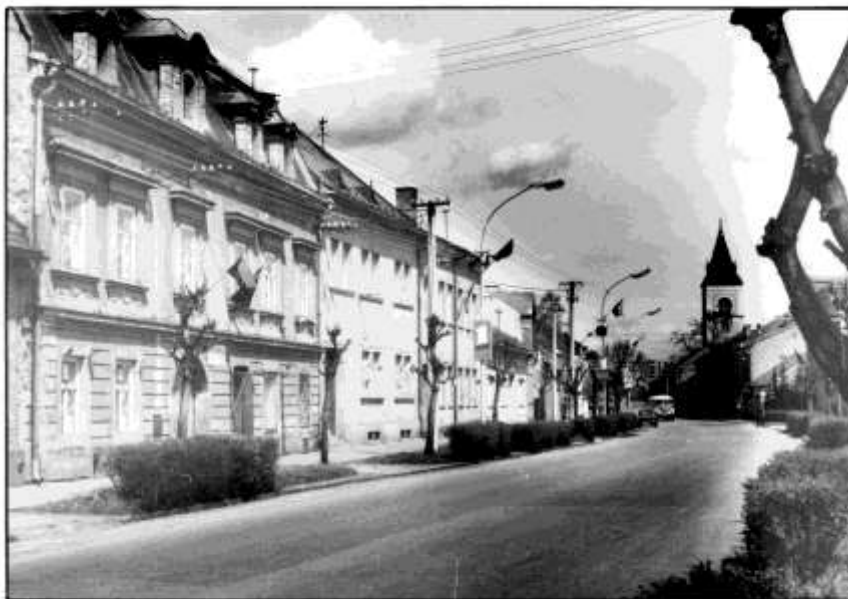
65. Dolná ulica – severovýchodné fasády, veža kostola sv. Jakuba (r.1985)