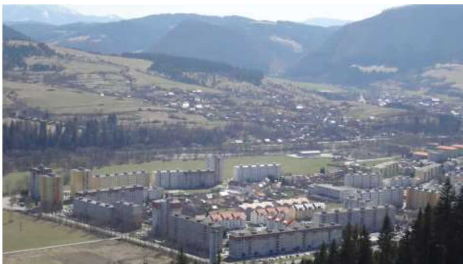
37. Súčasný pohľad, rok 2010, Kysucké Nové Mesto - celkový pohľad z Kopca, severná časť