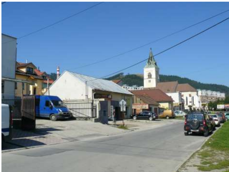
94. Zástavba pod kostolom sv. Jakuba, Jesenského ul., r. 2010