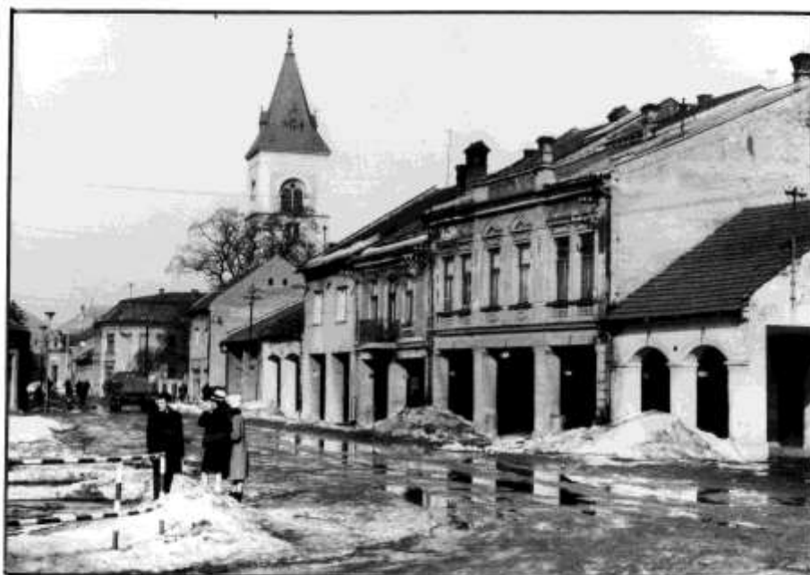
5. Námestie, pohľad na západné fasády (r. 1970)