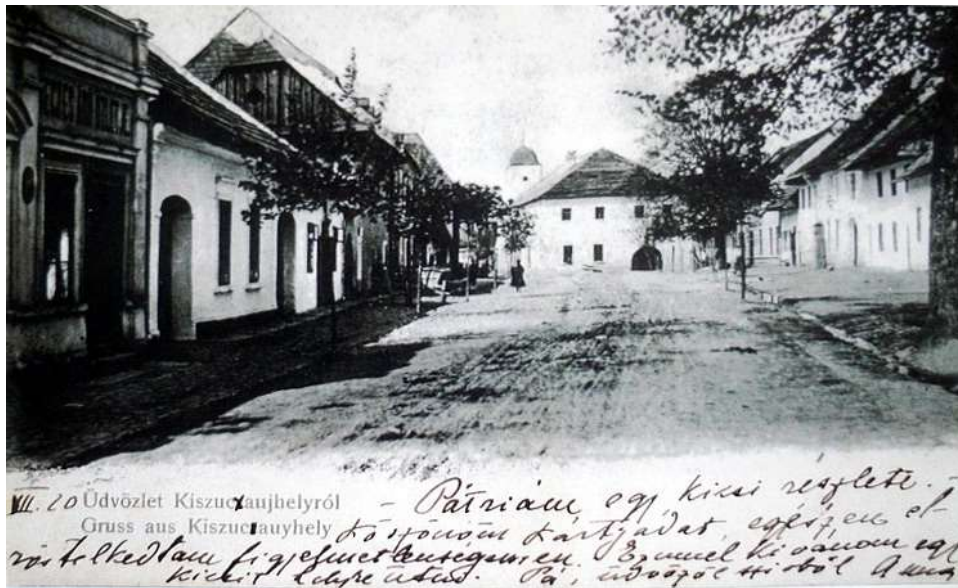
25. Dolná ulica (Belanského ul.), pohľad na panský dom pred rokom 1904