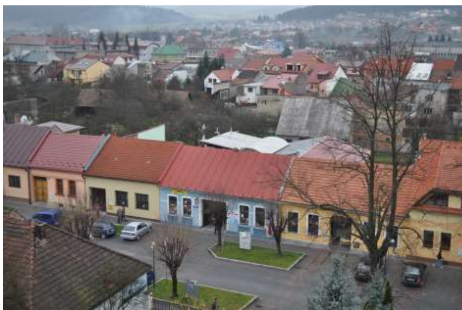
46. Súčasný pohľad, rok 2010, pohľad z veže kostola Panny Márie – Belanského ulica