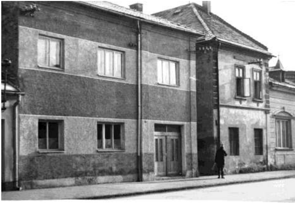
85. Horná ulica r. (1982)