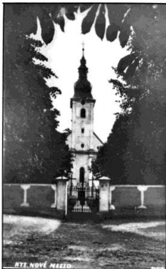
50. Kostol Panny Márie