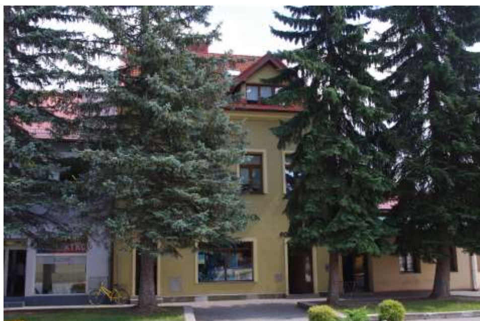
74. Náměstie slobody, juhozápadné fasády, rok 2010