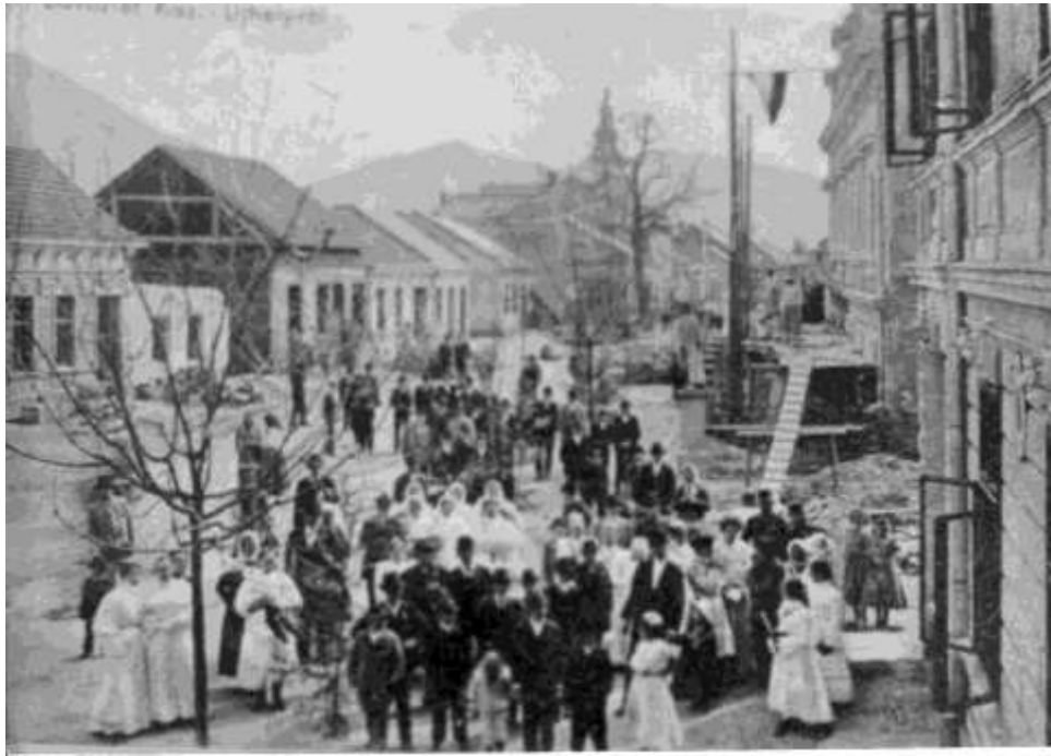
26. Dolná ulica (Belanského ul.)