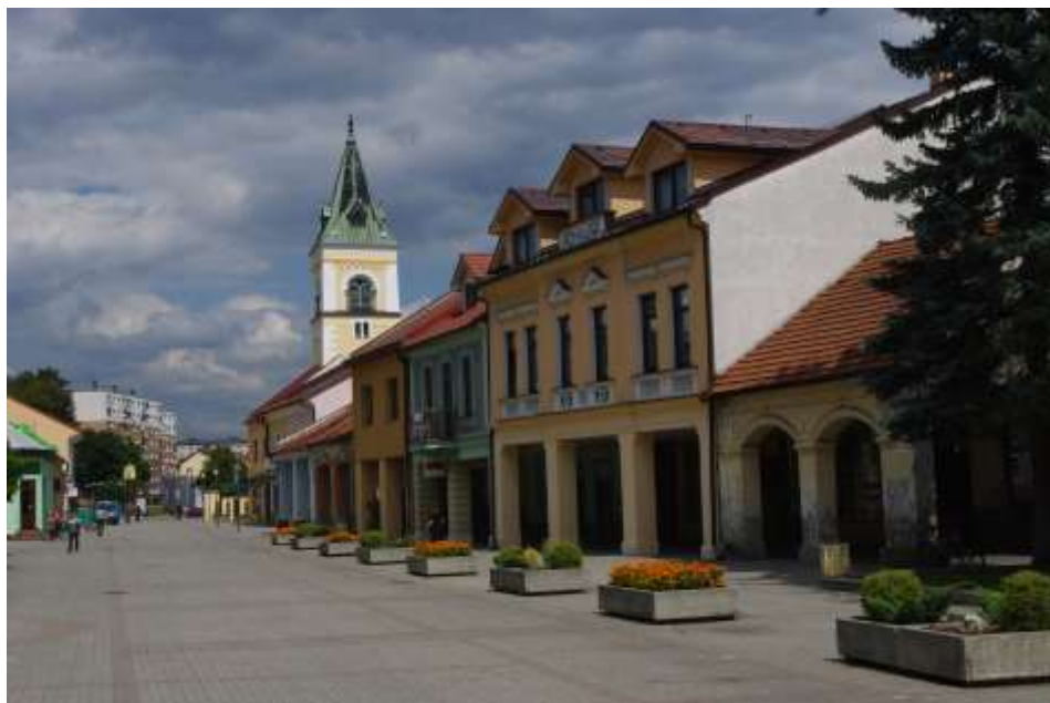
8. Súčasný pohľad, rok 2010, Námestie slobody, pohľad na západné fasády