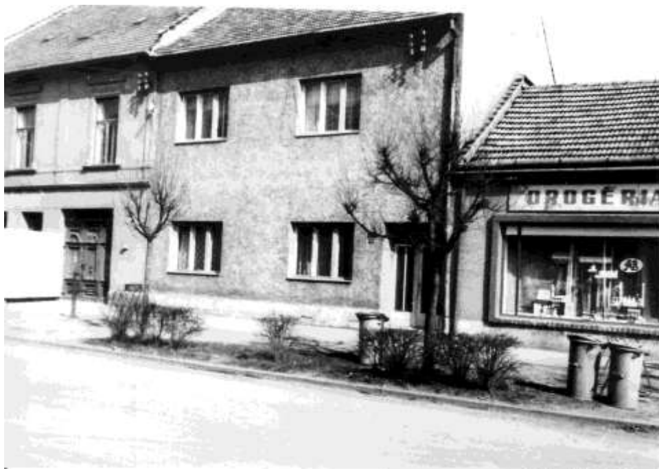
59. Dolná ulica – severozápadné fasády (r. 1965)