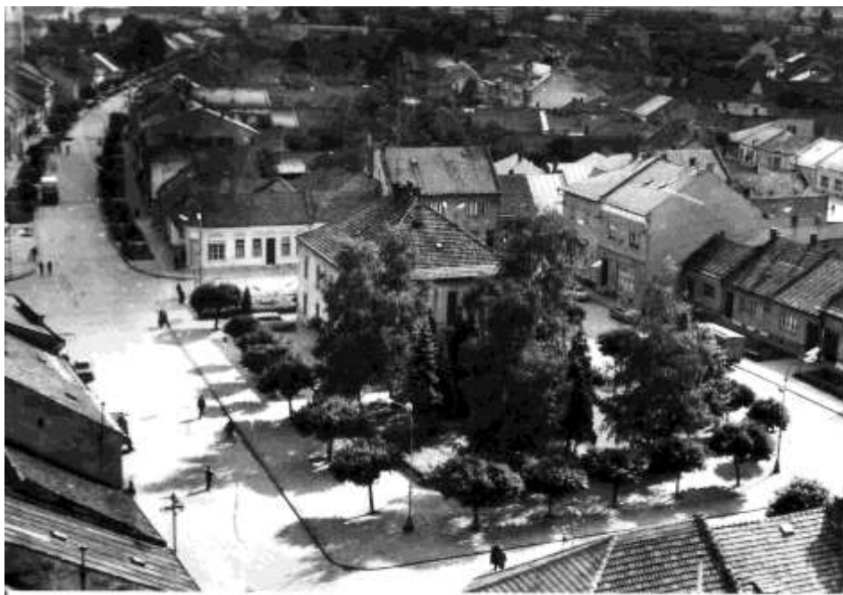
39. Pohľad z veže kostola sv. Jakuba – námestie (r. 1974)