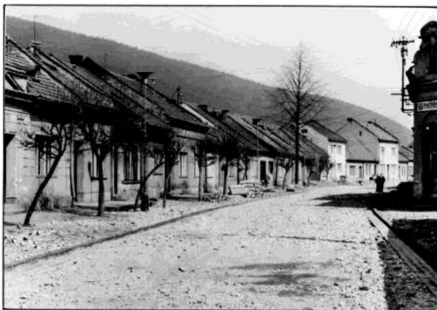
77. Horná ulica (r. 1968)