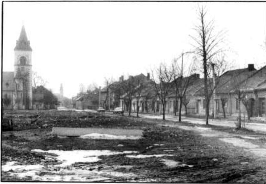
87. Čiastočne asanovaná Horná ulica (1985)