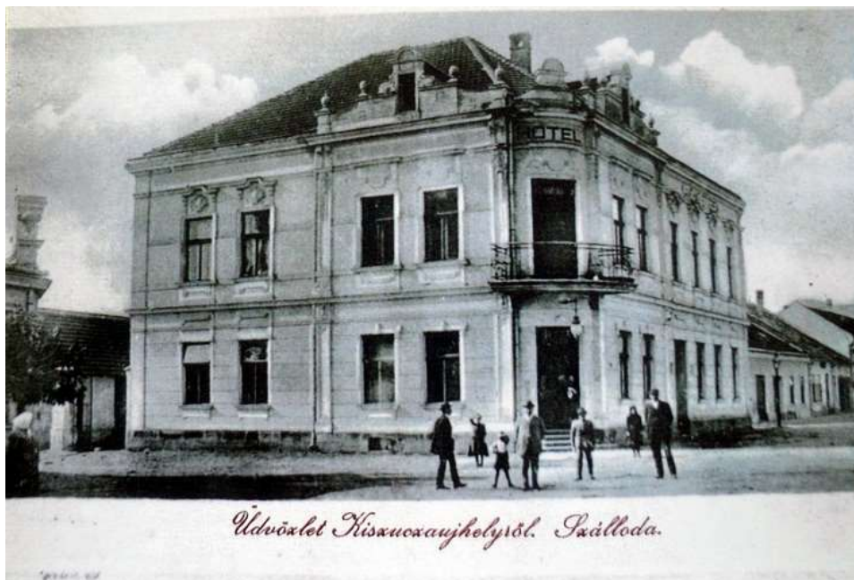
69. Námestie, Hotel Mýto č. ÚZPF 10723 (r. 1909)