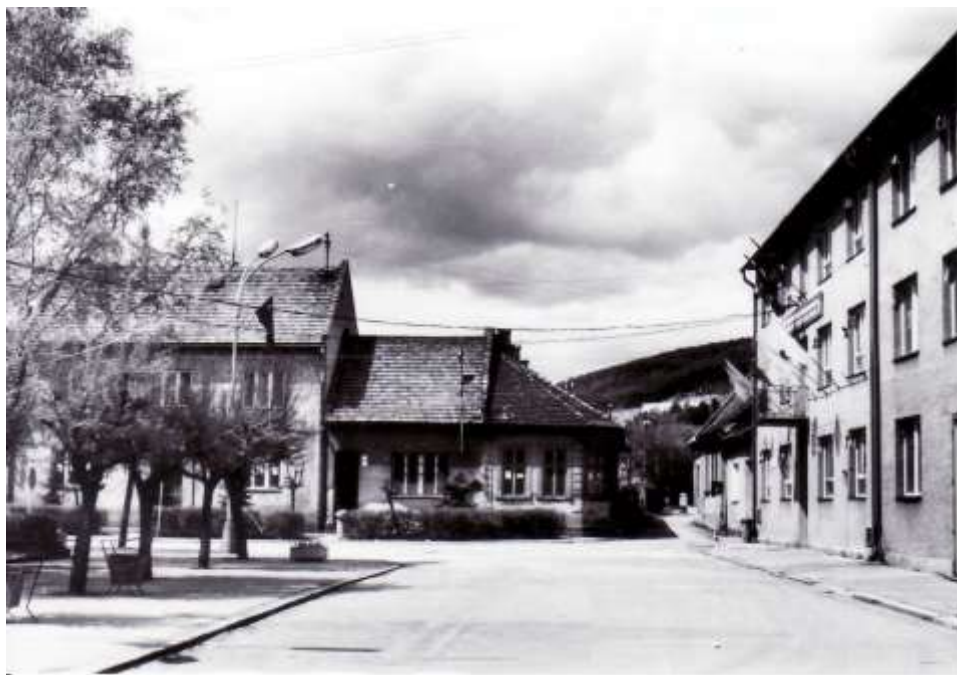
80. Námestie, severozápadné nárožie (r. 1985)