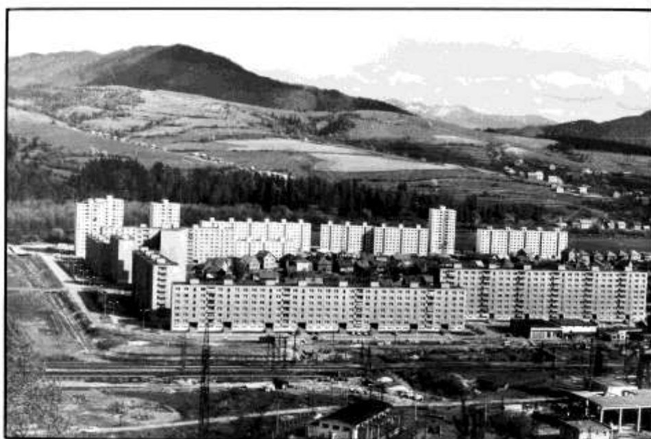
36. Kysucké Nové Mesto - celkový pohľad, severná časť, nová výstavba