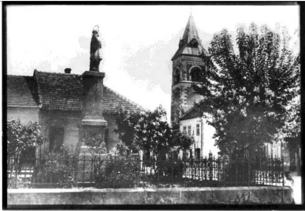
74. Socha sv. Jána Nepomuckého na námestí, Kostol sv. Jakuba