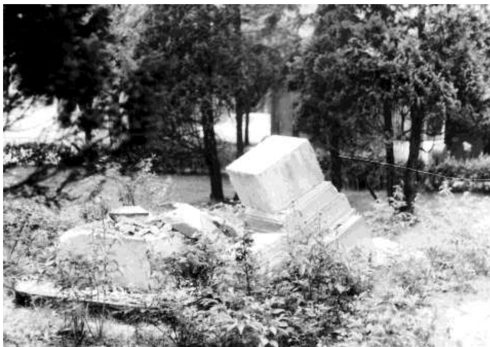
76. Námestie, zbortenie podstavca sochy sv. Jána Nepomuckého (r. 1975)