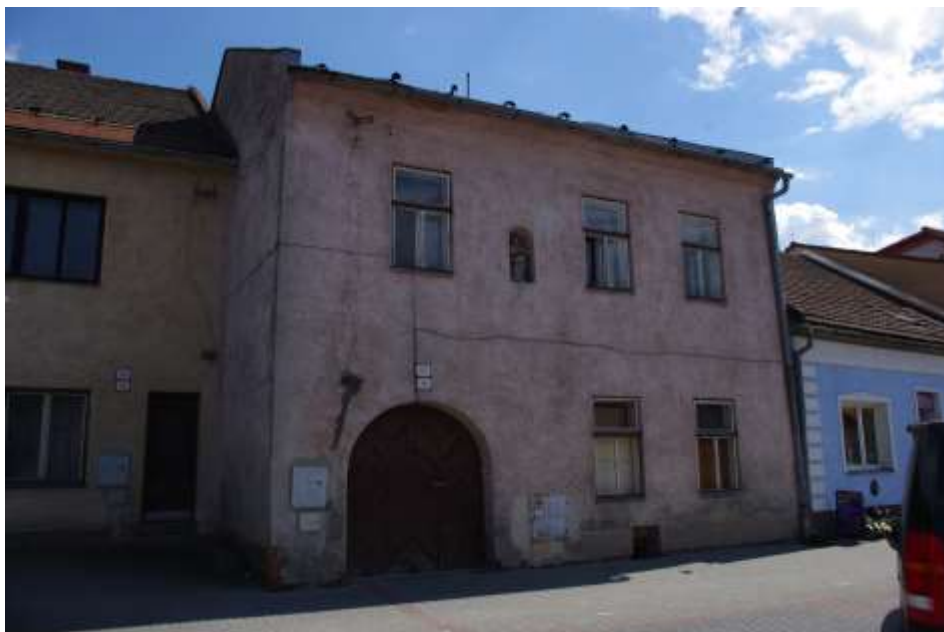
55. Belanského ulica – Meštiansky dom č.ÚZPF 10724/0, rok 2010