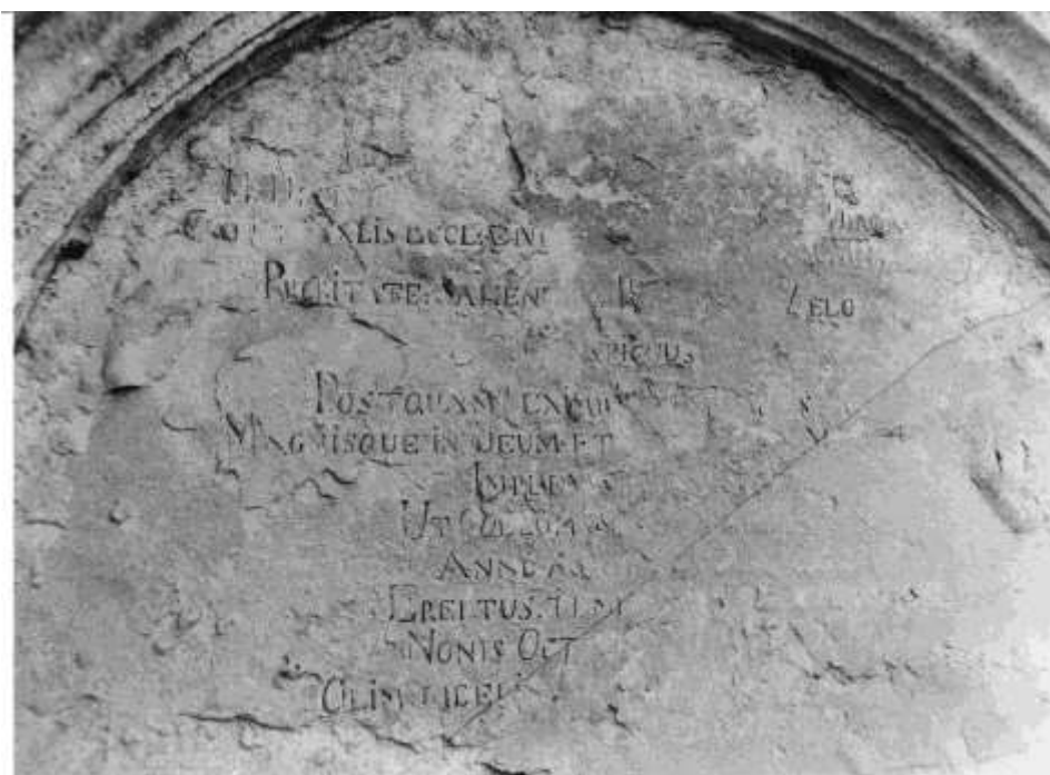
95. Nápis na kostole sv. Jakuba (r.1974)