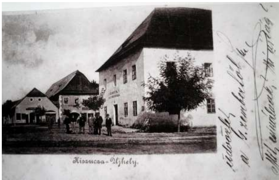
16. Námestie, stred a severovýchodná časť ( pred rokom 1904)