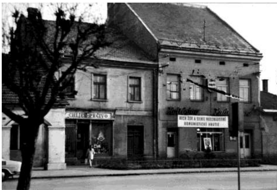
73. Náměstie, juhozápadné fasády (r. 1970)