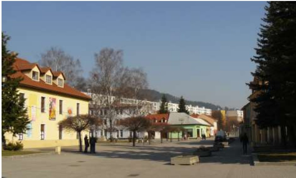
12. Súčasný pohľad, rok 2010, Námestie slobody, východná časť