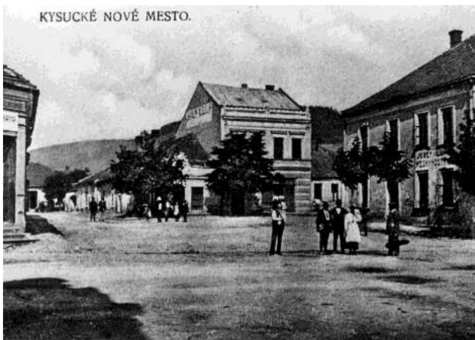
17. Námestie, západná časť ( r. 1925)