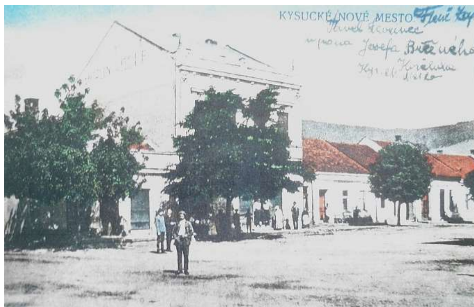
15. Námestie, západná časť (r. 1925)