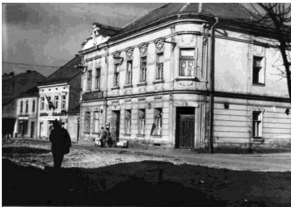
70. Námestie, Hotel Mýto č. ÚZPF 10723 (r. 1965)