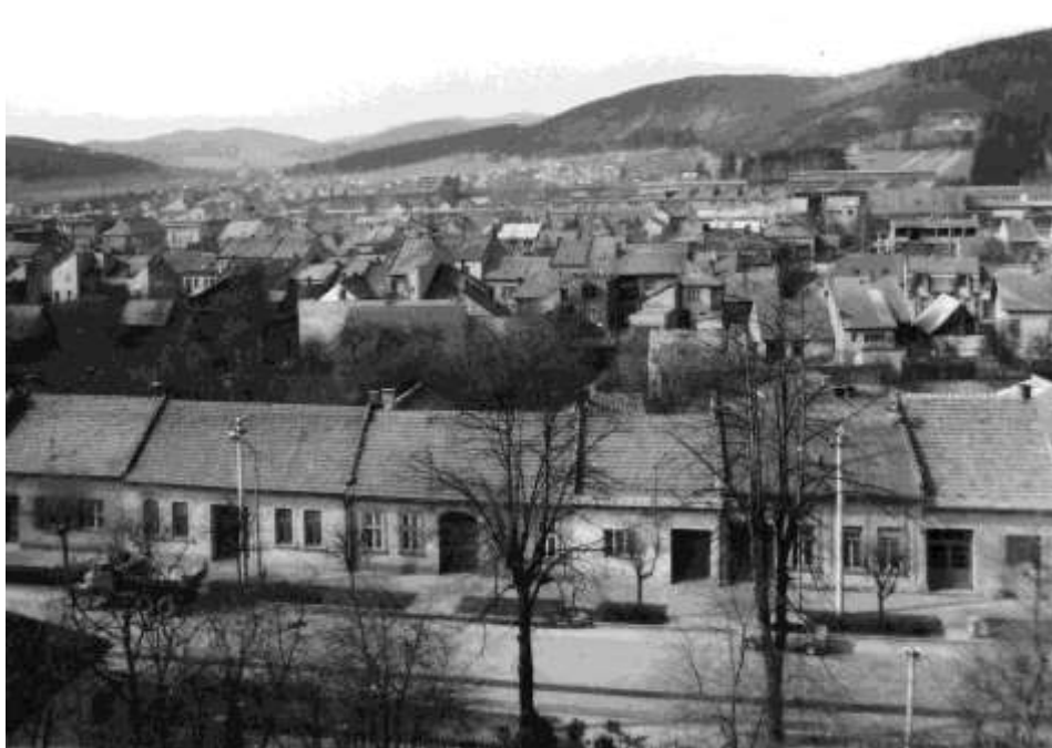
45. Pohľad z veže kostola Panny Márie – Dolná ulica (r. 1973)