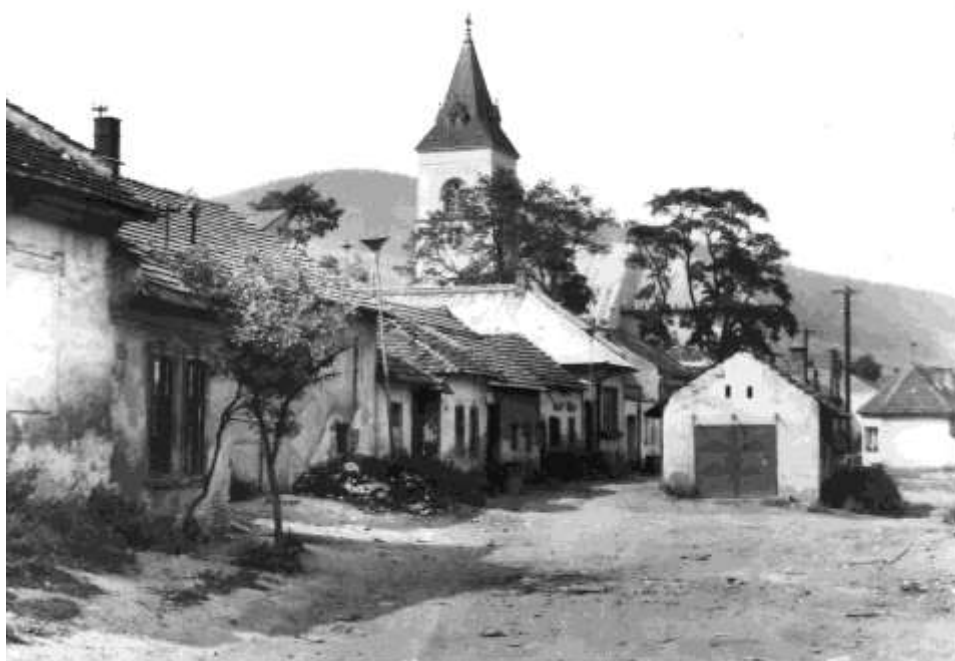
93. Zástavba pod kostolom sv. Jakuba, súčasná Jesenského ul. (r.1982)