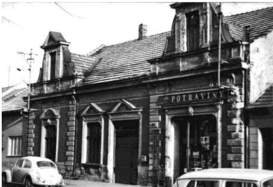
80. Horná ulica