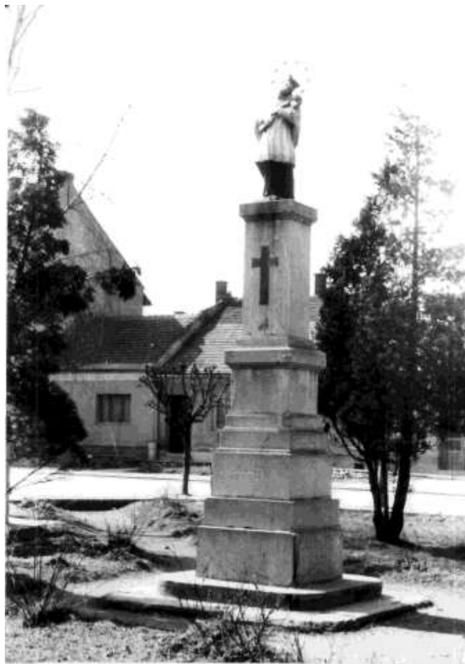
75. Námestie, socha sv. Jána Nepomuckého (r. 1956)