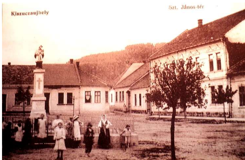
9. Námestie, severozápadná časť (r. 1925)