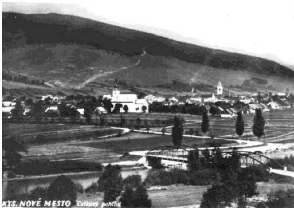
KYS. NOVÉ MESTO Celkový pohľad