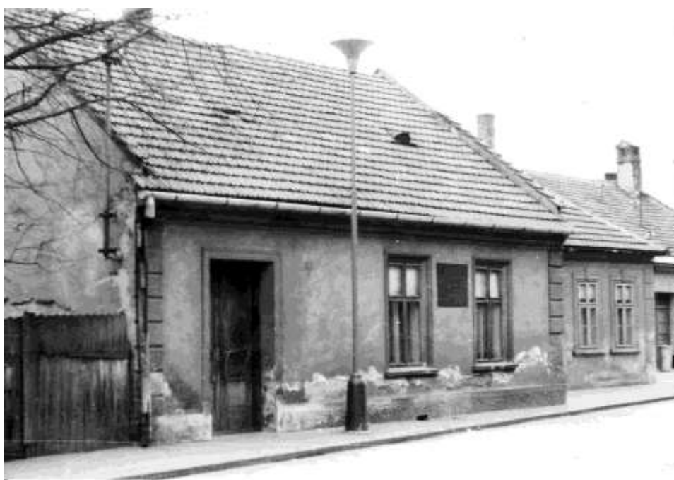
101. Dom Dlhomíra Poľského