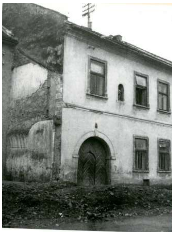
54. Dolná ulica – Meštiansky dom č.ÚZPF 10724/0 (r.1953)