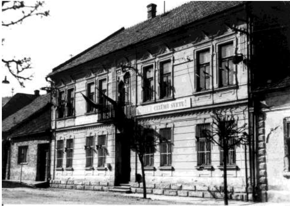
77. Námestie, Budova mestského úradu (r. 1956)