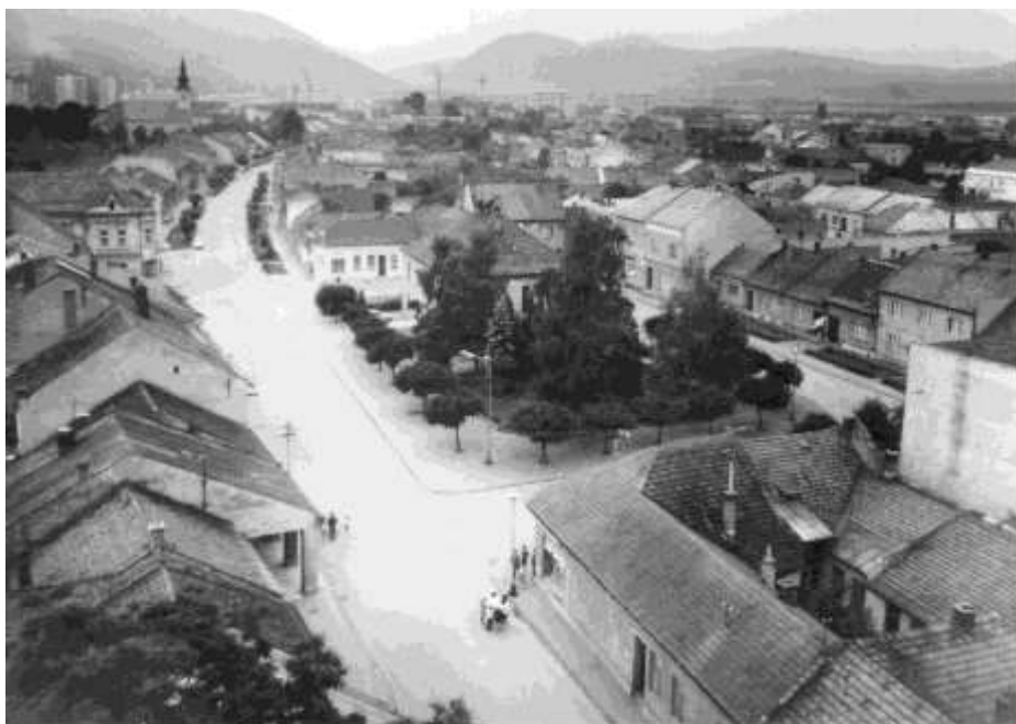
40. Pohľad z veže kostola sv. Jakuba – námestie, dolná ulica (r. 1974)