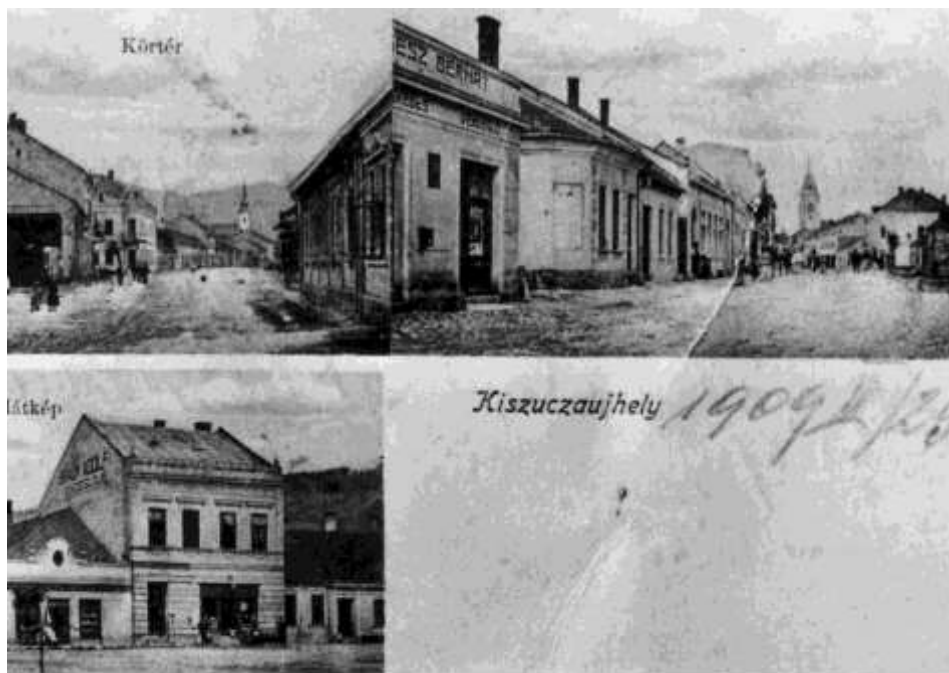
5. Pohľad z námestia na Dolnú ulicu (r. 1909)