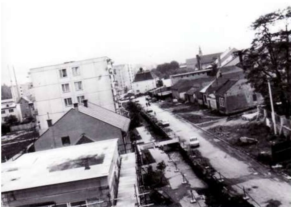
99. Zástavba pod kostolom sv. Jakuba, súčasná Jesenského ul. (r.1986)