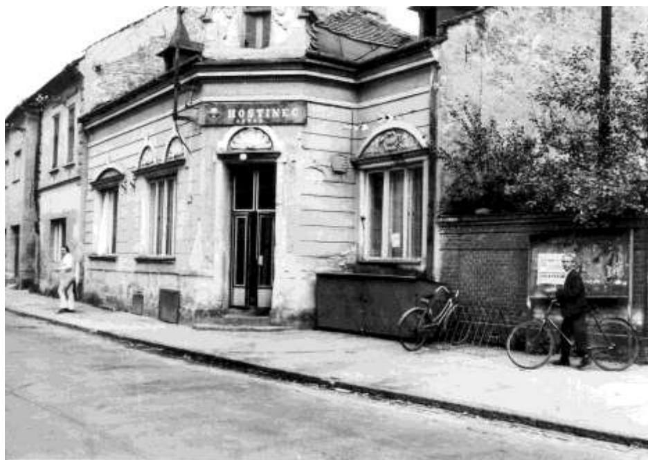
83. Horná ulica r. (1982)