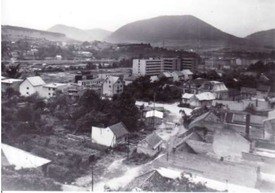
41. Pohľad z veže kostola sv. Jakuba – Pivovar, židovská synagóga (r. 1974)