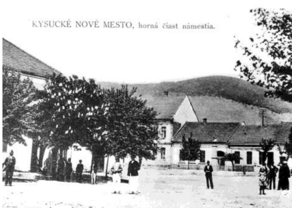
11. Námestie, východná časť (r. 1929)