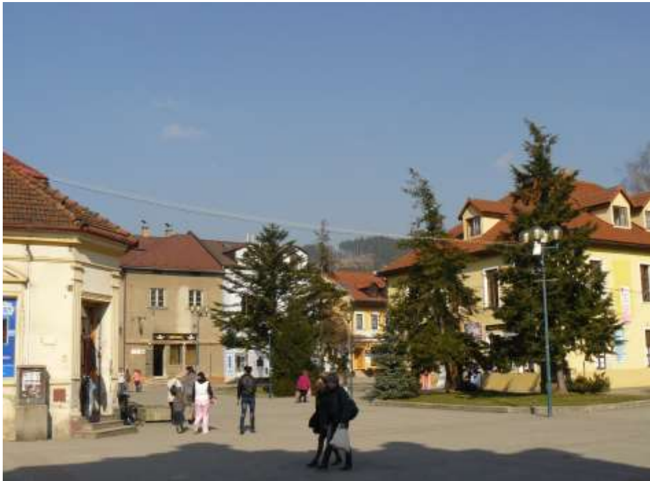
18. Súčasný pohľad, rok 2010, Námestie slobody, západná časť