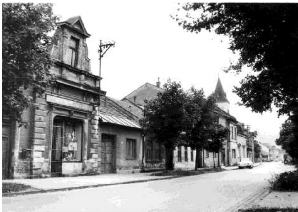
81. Horná ulica (r. 1982)