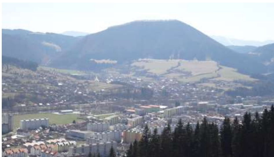
34. Súčasný pohľad, rok 2010, Kysucké Nové Mesto - celkový pohľad z Kopca