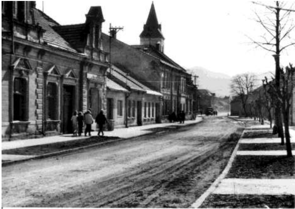
79. Horná ulica (r. 1969)