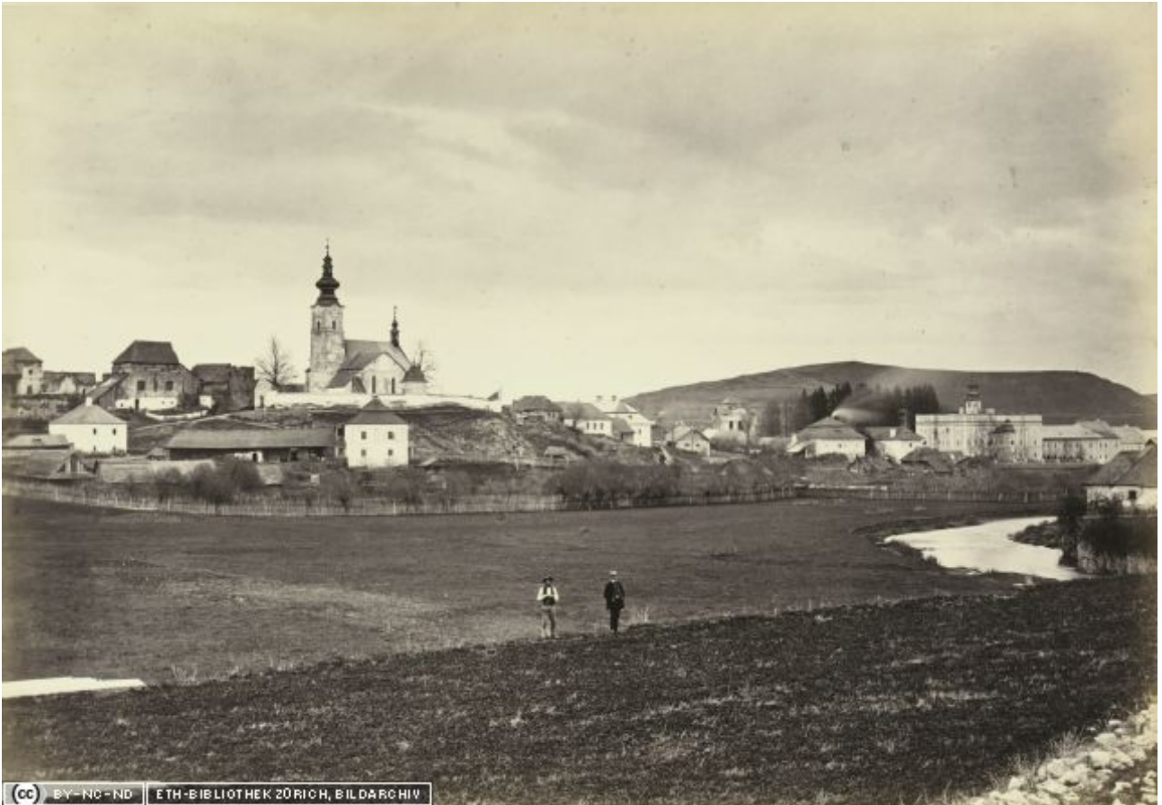
Najstaršia fotografia Markušoviec z roku 1871. Obrázok zo série dokumentujúcej železničnú trať Košice—Bohumín. Veža kostola je tu zachytená ešte vo svojej barokovej podobe. http://www.e-pics.ethz.ch/