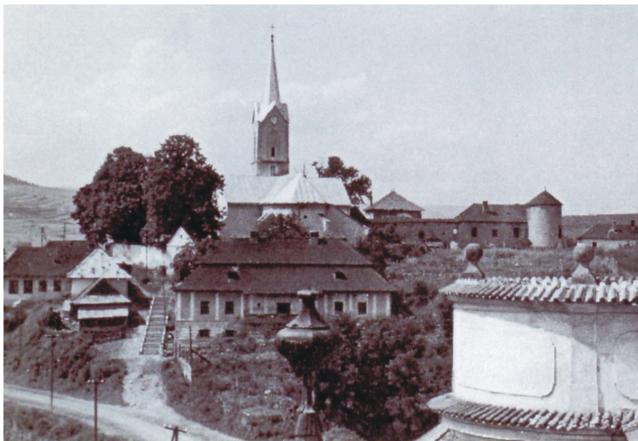
Pohľad na hradný kopec s kostolom z veže kaštieľa (rok 1954).