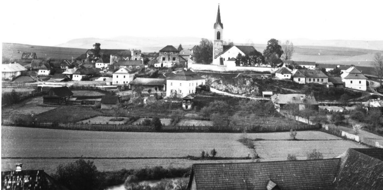
Pohľad na hradný kopec od juhu na začiatku 20. stor. Hrad a kostol obci dominujú.