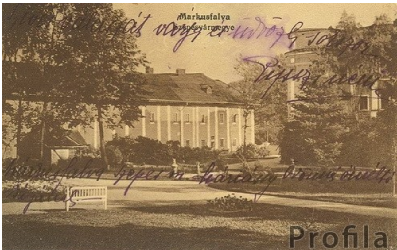
Dobové pohľadnice z prelomu 19. a 20. stor., zobrazujúce najreprezentatívnejší objekt v Markušovciach—renesančný kaštieľ a park.