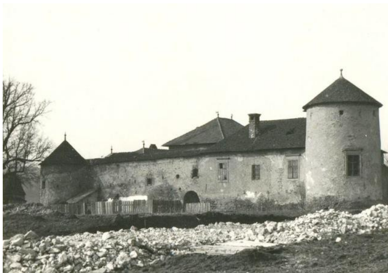
Markušovský hrad v polovici 20. storočia.