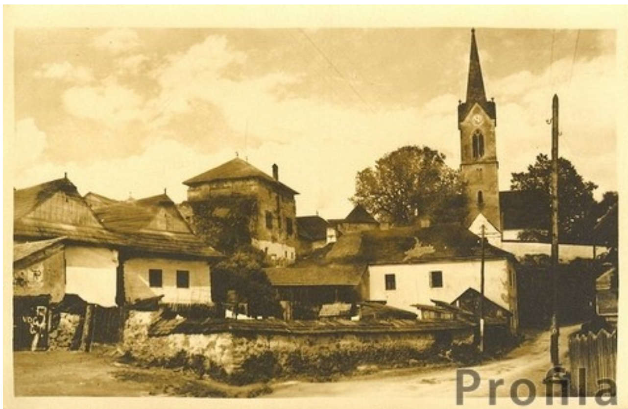
Pohľad na hradný kopec s kostolom pri príchode od Spišskej Novej Vsi na pohľadnici zo začiatku 20. storočia. Pohľadnica zachytáva i dnes už nezachovanú drevenú ľudovú architektúru.