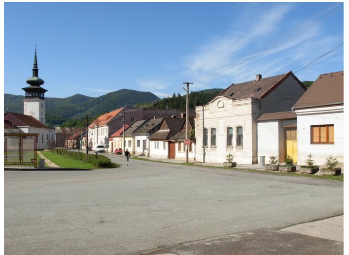
8. 9. Zachovaná kompaktná zástavba mestského typu na Mariánskom námestí