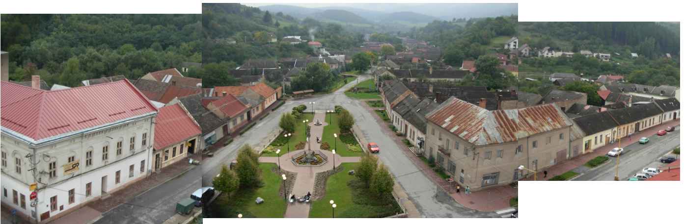
19. Zachovaná objektová skladba s dvojpodlažnými verejnými budovami na námestí a s prízemnou zástavbou meštianskych domov v uliciach