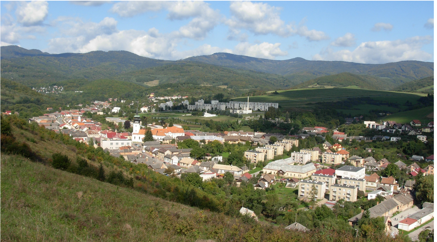
1. Hodnotný obraz krajiny v okolí Medzeva tvorený vrchovinovým chotárom