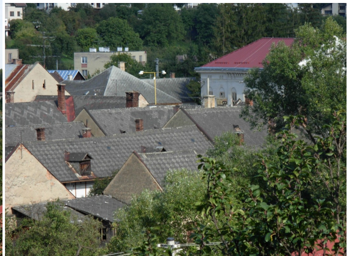
16. 17. Tradičná strešná krytina — sivé eternitové šablóny ukladané do geometrických vzorov