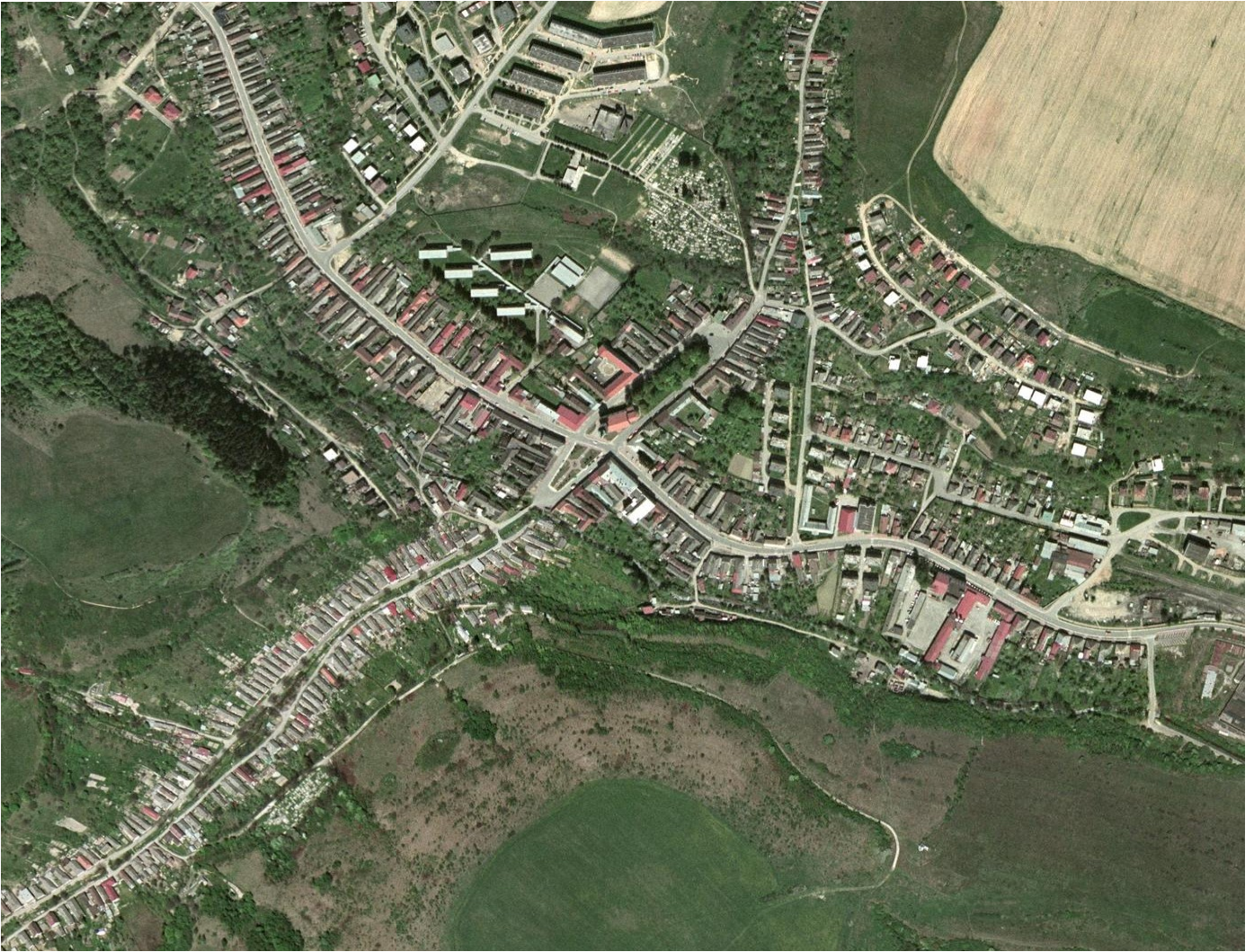
18. Historický pôdorys kríža so šošovkovitým námestím a zachovaná parcelácia sú zreteľne čitateľné i v pôdoryse súčasného mesta.