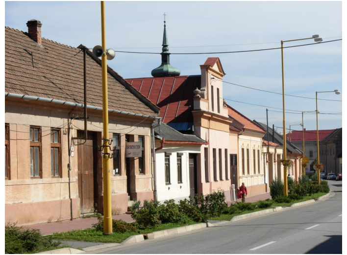
6. 7. Zachovaná kompaktná zástavba mestského typu na Štóskej ulici