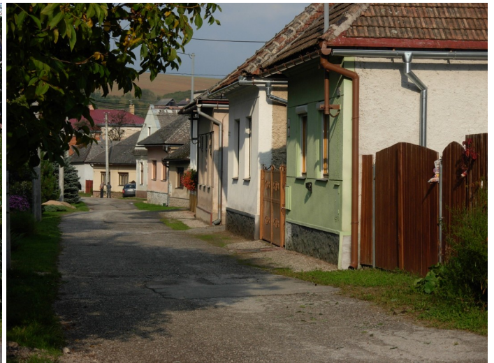
12. 13. 14. 15. Zachovaná potočná radová zástavba vidieckeho typu na ulici Grunt