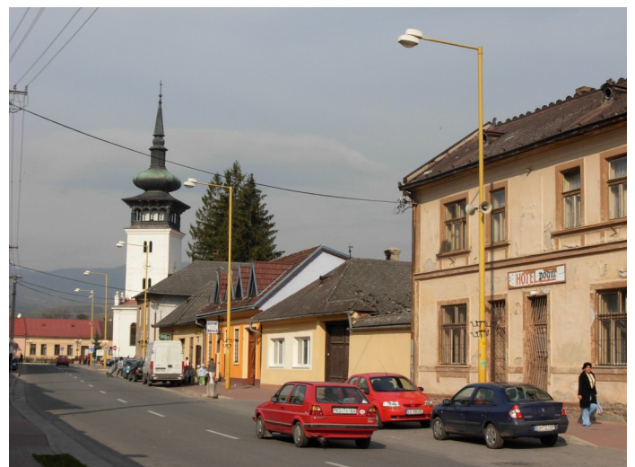
10. 11. Zachovaná kompaktná zástavba mestského typu na Kováčskej ulici