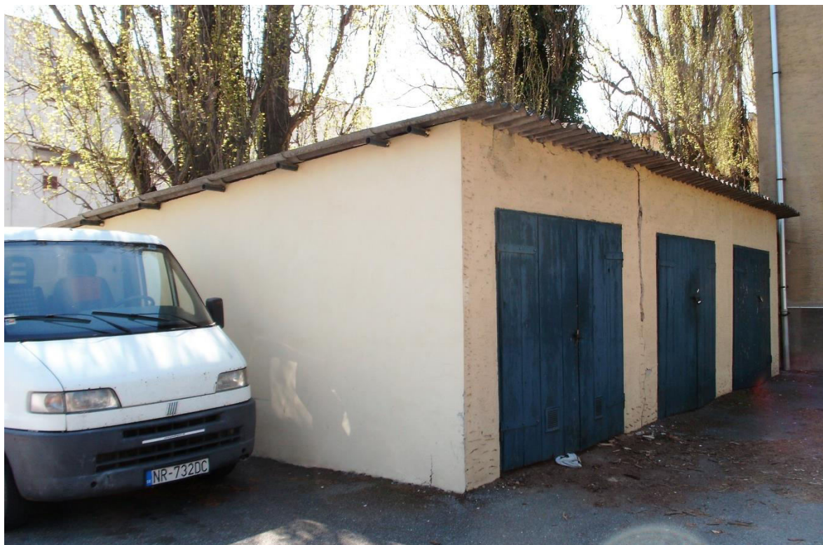
pohľad zo severu