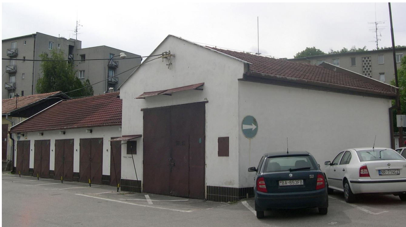
pohľad zo severozápadu