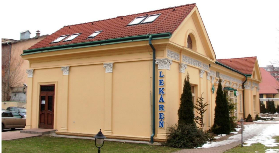
pohľad na bočnú a uličnú fasádu

SPRACOVAL: Ing. arch. Rudolf Viršík, PhD., KPÚ Nitra, 04/2015