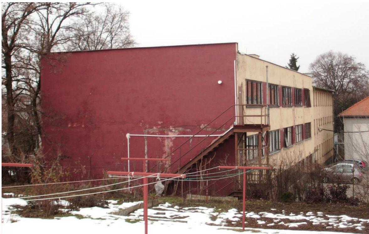
pohľad z juhovýchodu