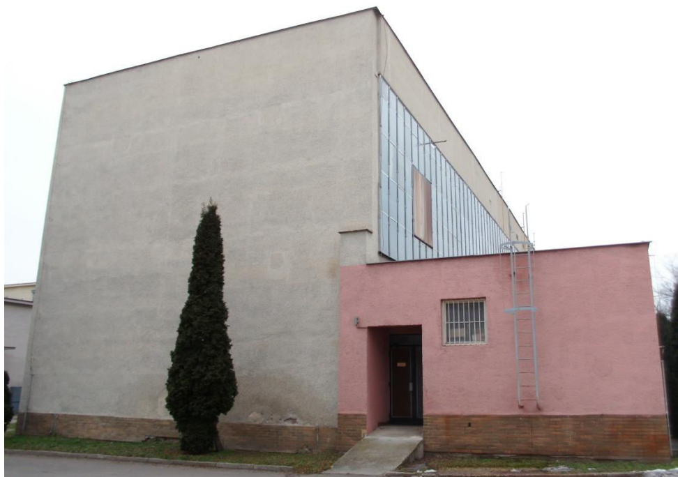
pohľad zo severovýchodu