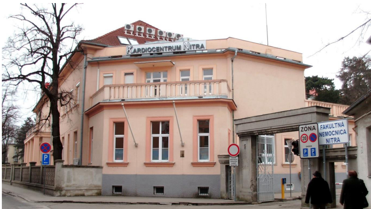
pohľad zo severu