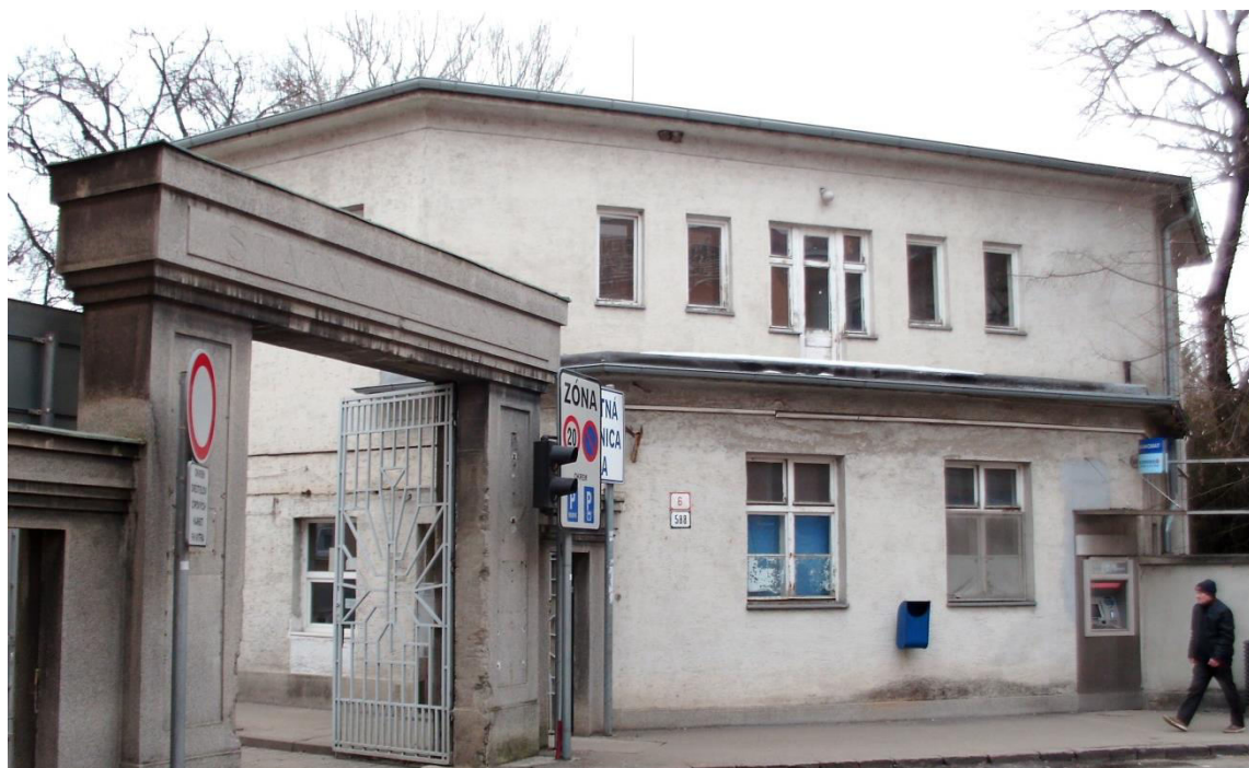
pohľad z východu