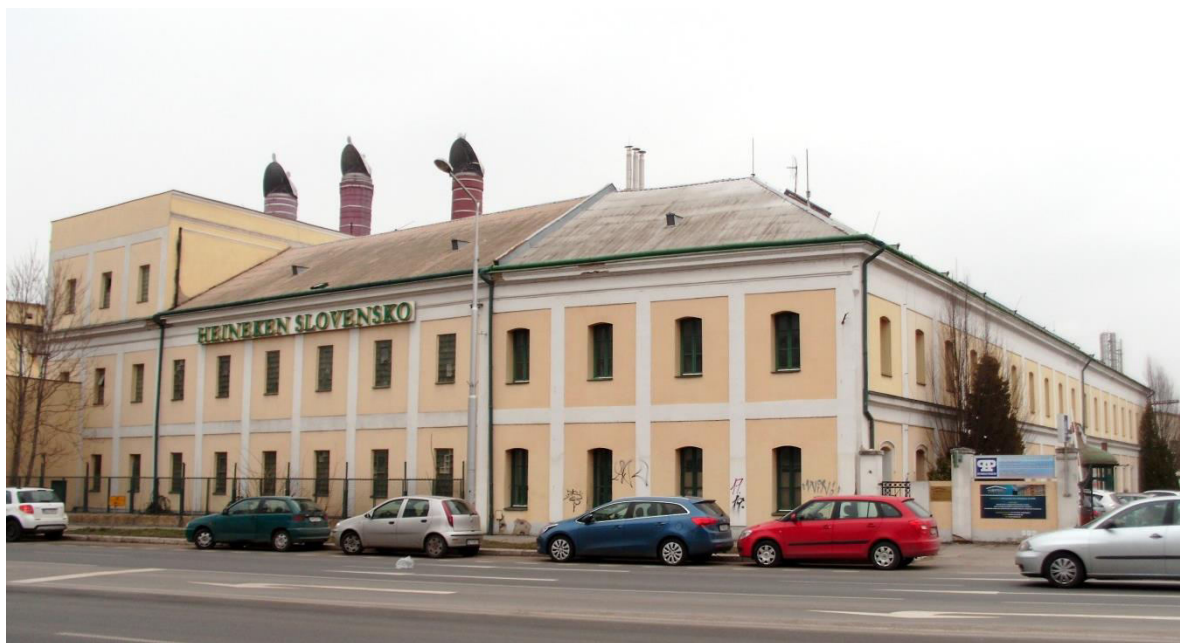
pohľad zo západu, zo Štefánikovej triedy