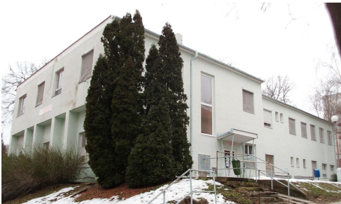
pohľad zo severu