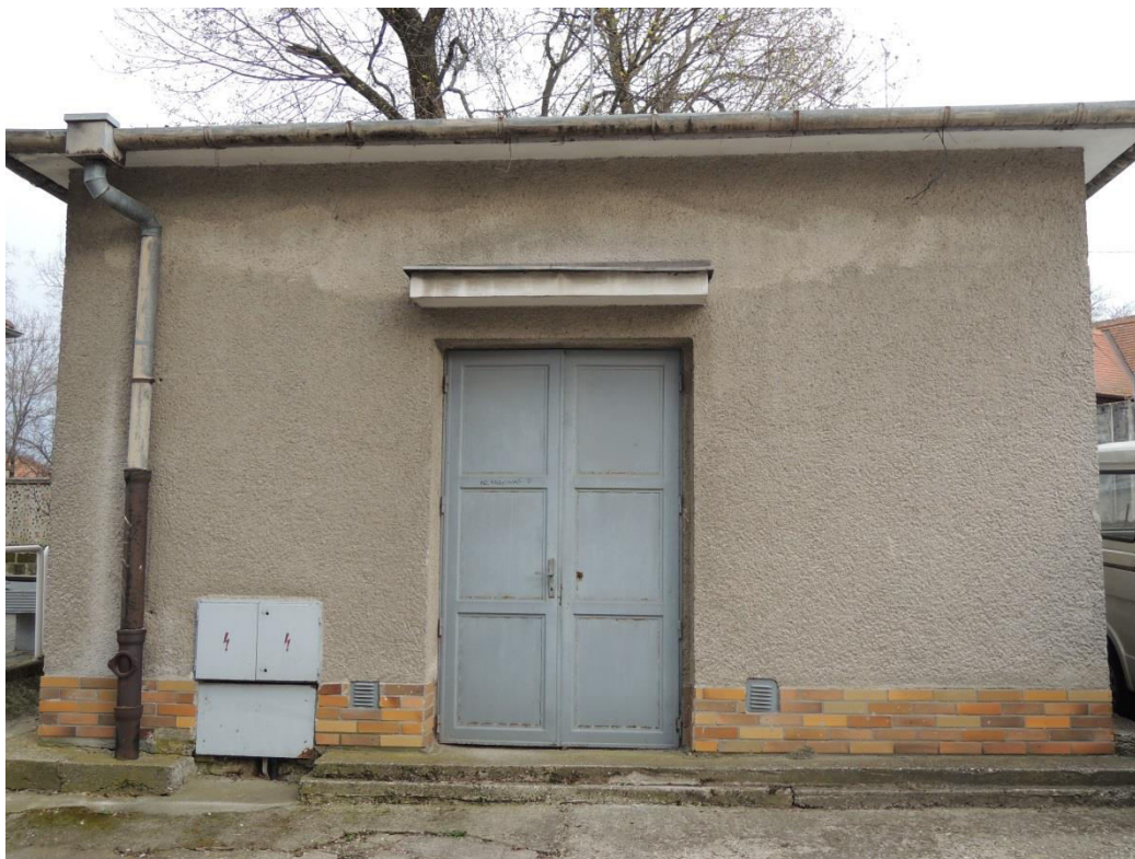
pohľad na severozápadnú fasádu