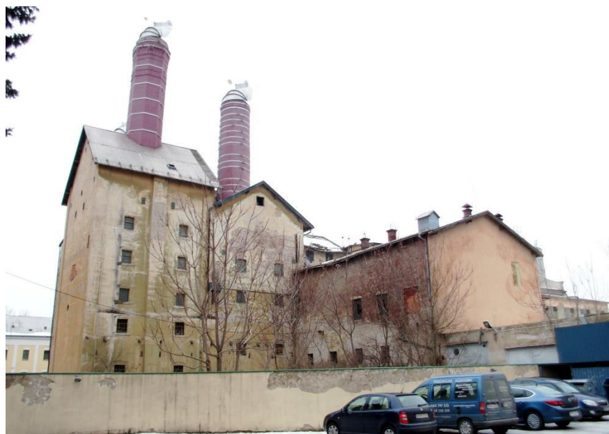
pohľad z východu