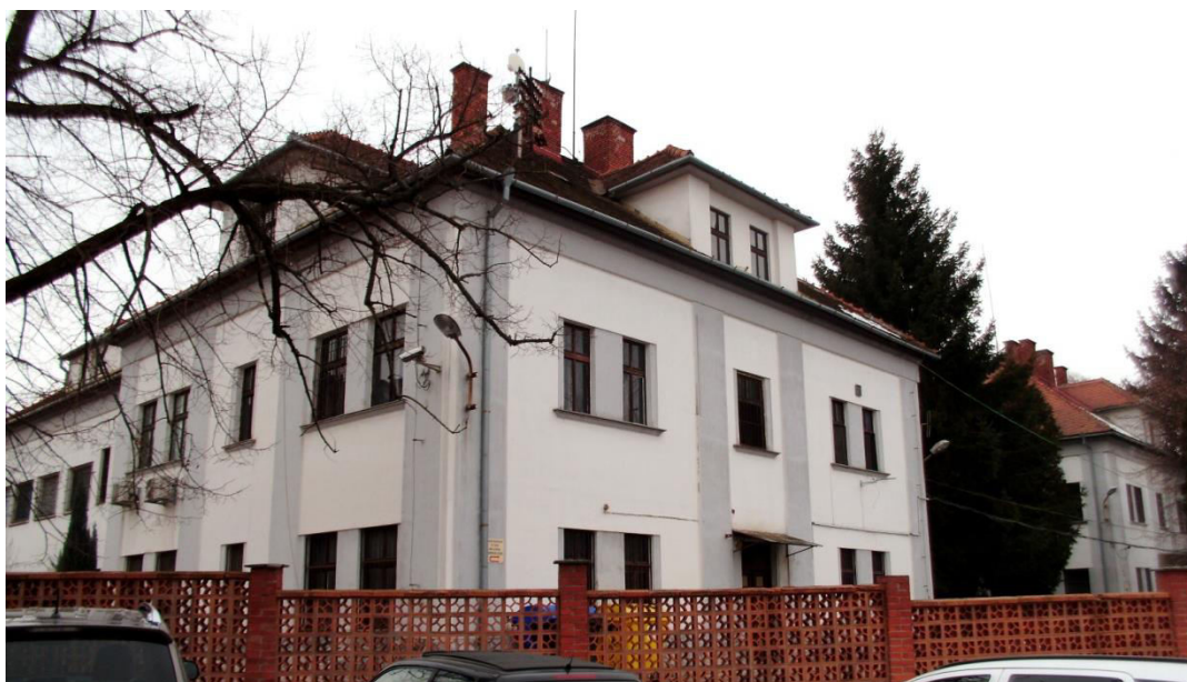
pohľad z východu z Kalvárskej ulice