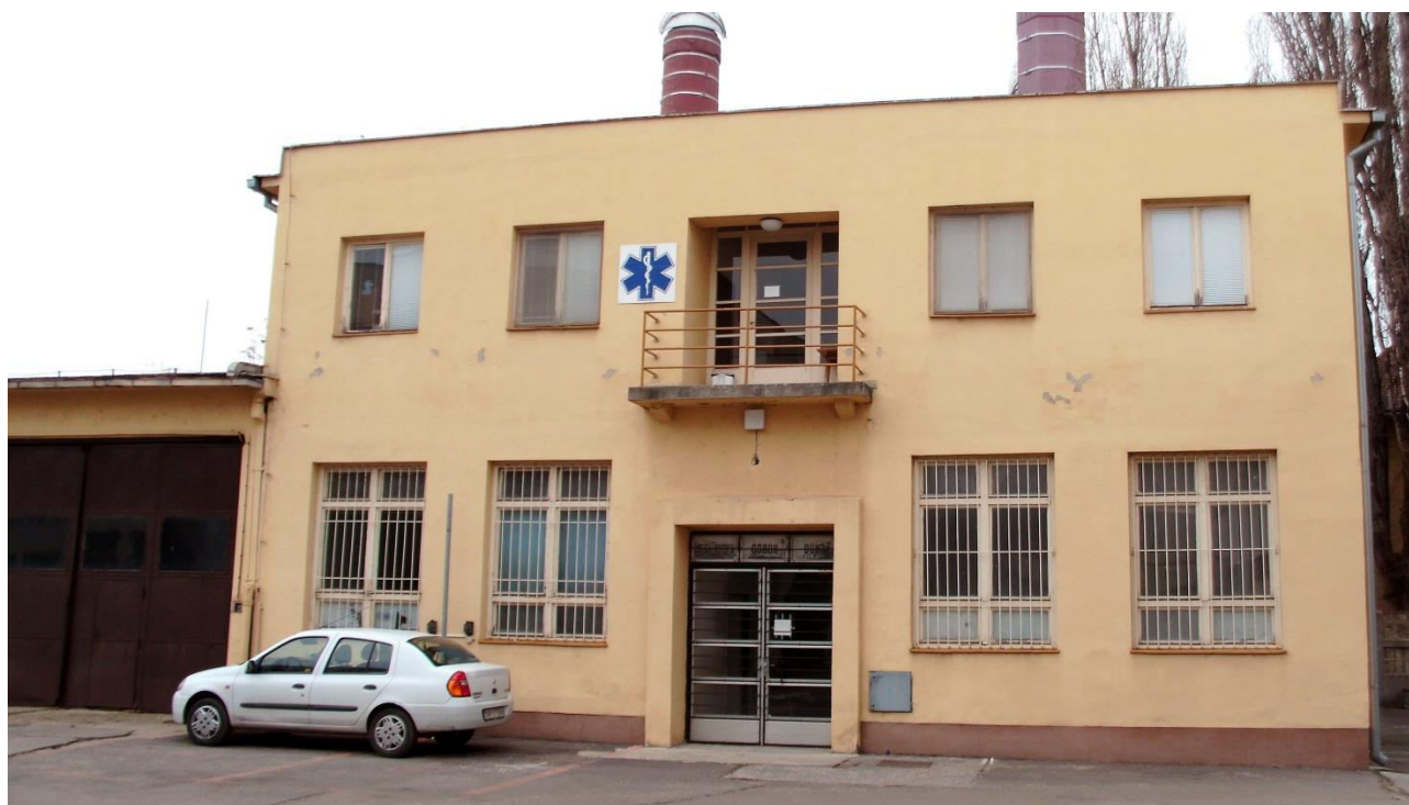
pohľad na hlavnú (východnú) fasádu