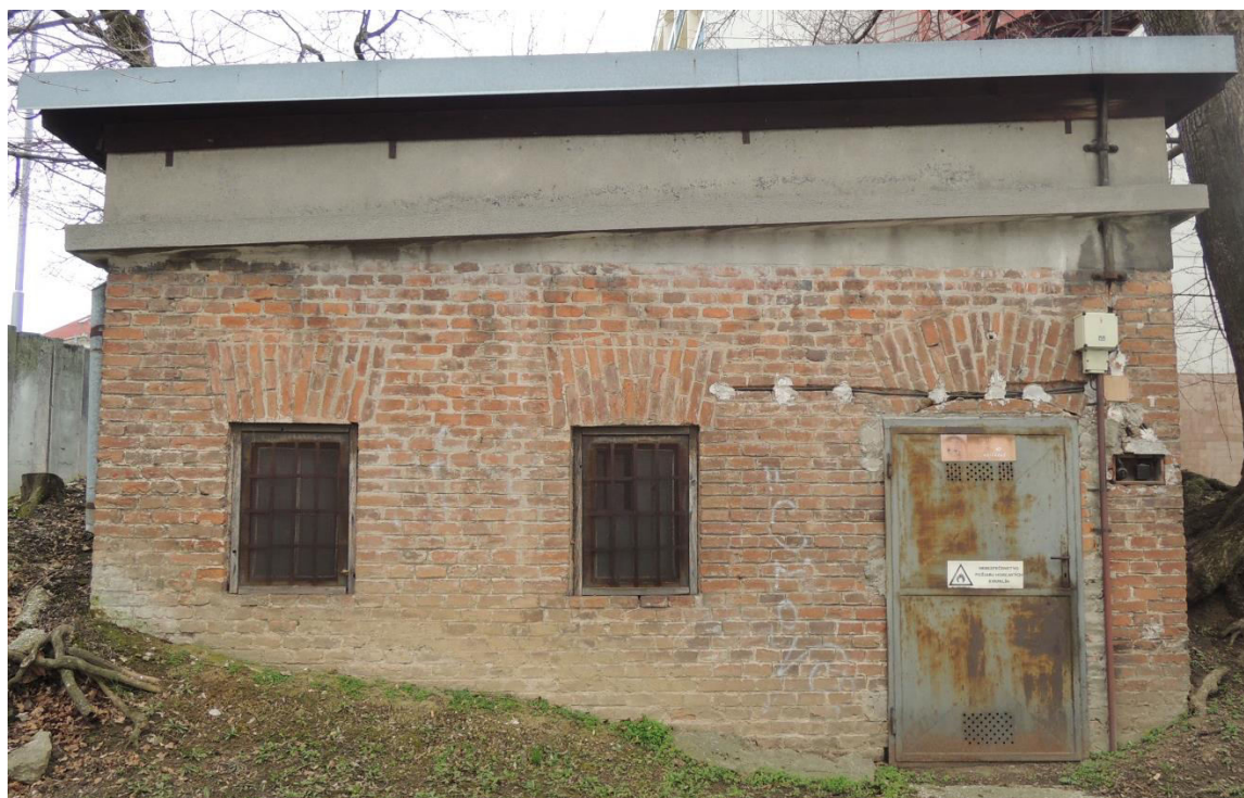
pohľad zo severovýchodu