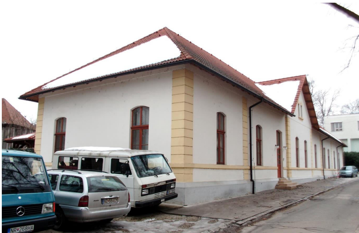
pohľad na severovýchodnú bočnú a severozápadnú hlavnú fasádu

SPRACOVAL: Ing. arch. Rudolf Viršík, PhD., KPÚ Nitra, 04/2015