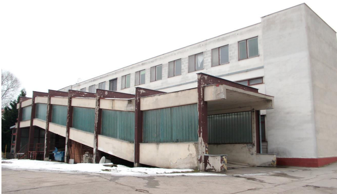
pohľad na severovýchodnú fasádu orientovanú k Špitálskej ulici