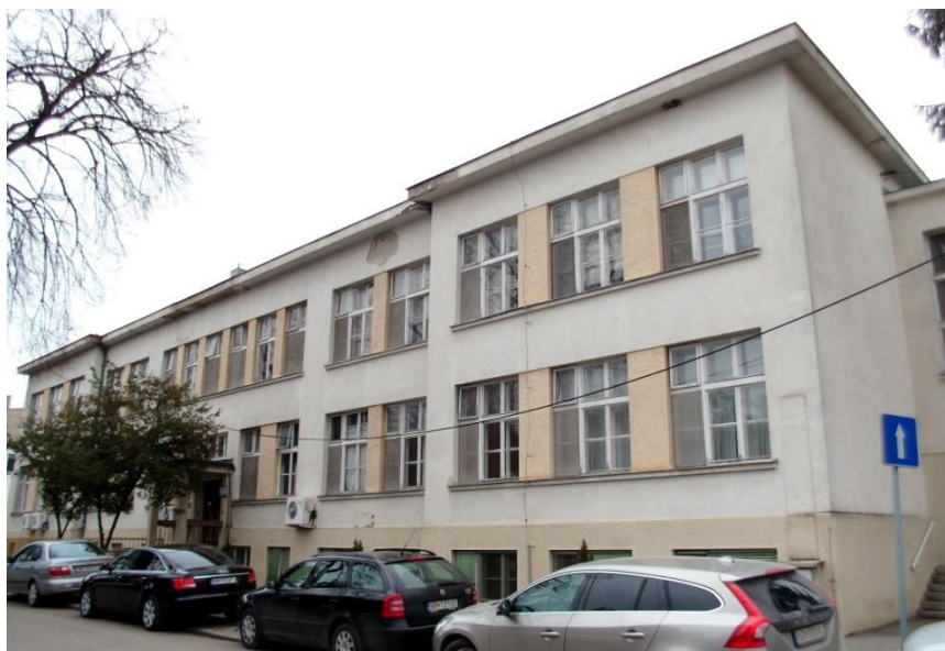
pohľad na hlavnú (juhovýchodnú) fasádu

SPRACOVAL: Ing. arch. Rudolf Viršík, PhD., KPÚ Nitra, 04/2015