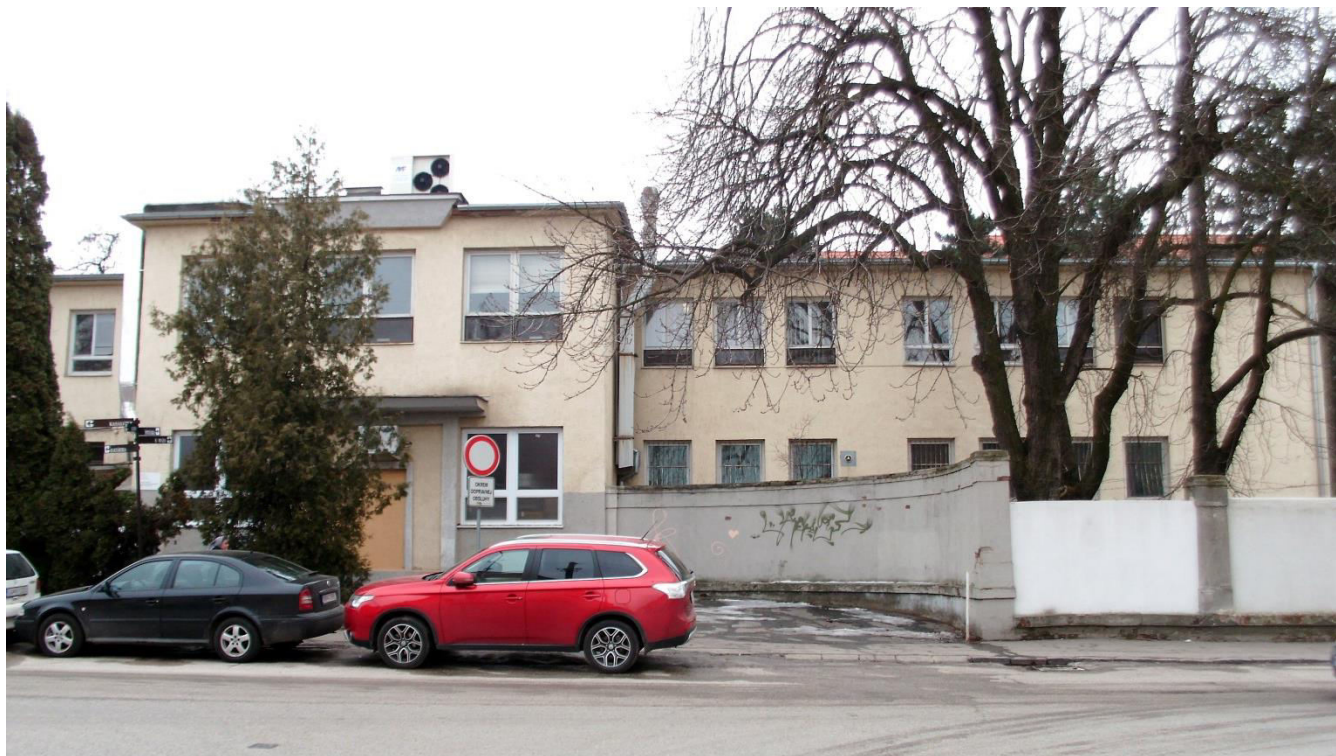
pohľad na sevrovýchodnú fasádu