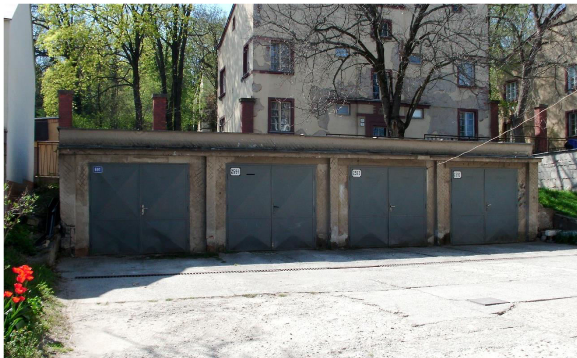
pohľad zo severu