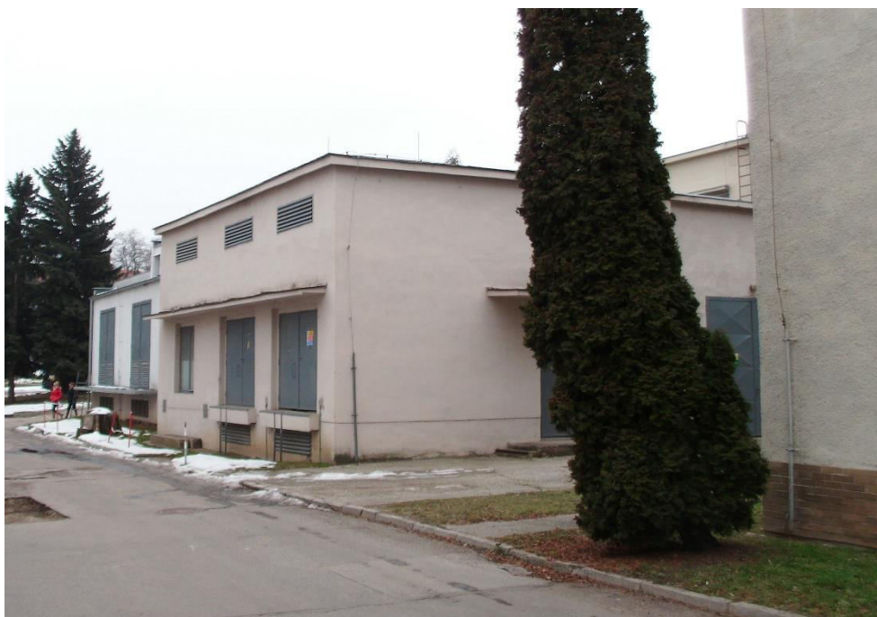
pohľad zo severu