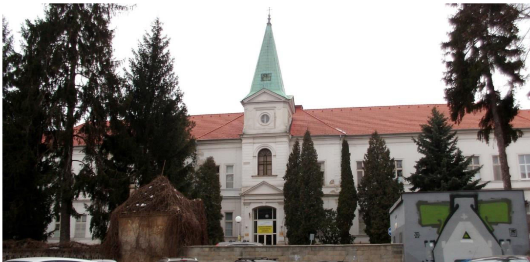
pohľad na priečelie zo Špitálskej ulice