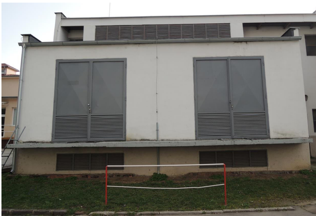
pohľad zo severovýchodu