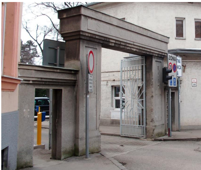
pohľad zo Špitálskej ulice