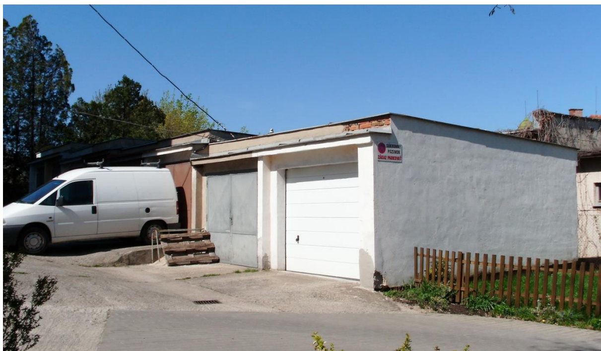
pohľad z východu