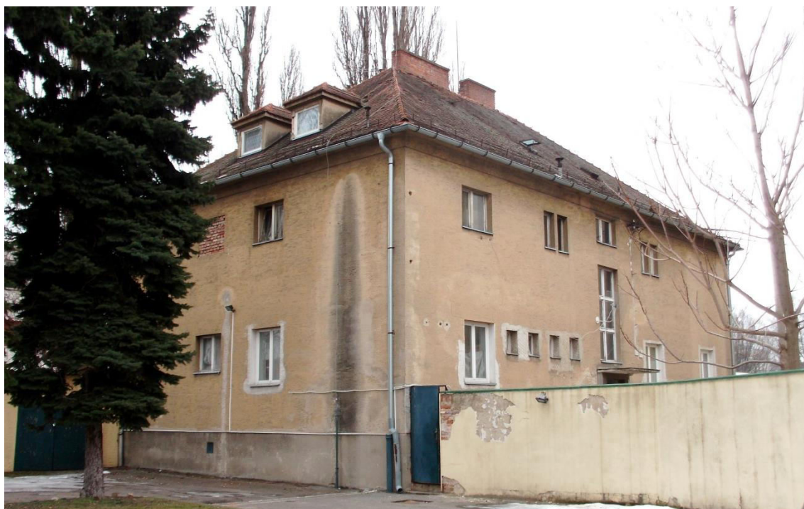
pohľad zo severu