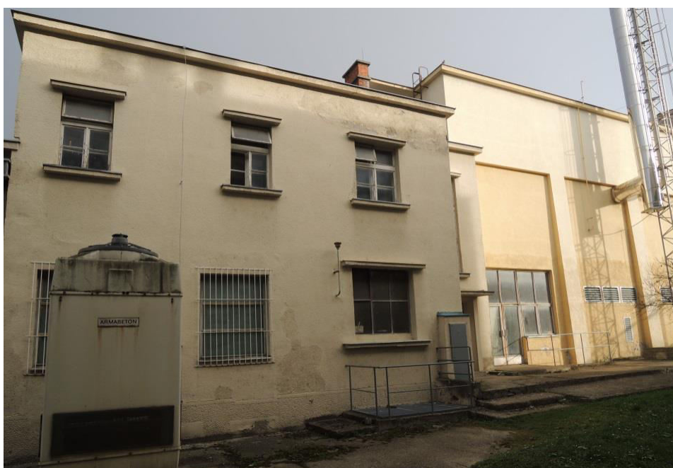
pohľad na hlavnú (západnú) fasádu

SPRACOVAL: Ing. arch. Rudolf Viršík, PhD., KPÚ Nitra, 04/2015