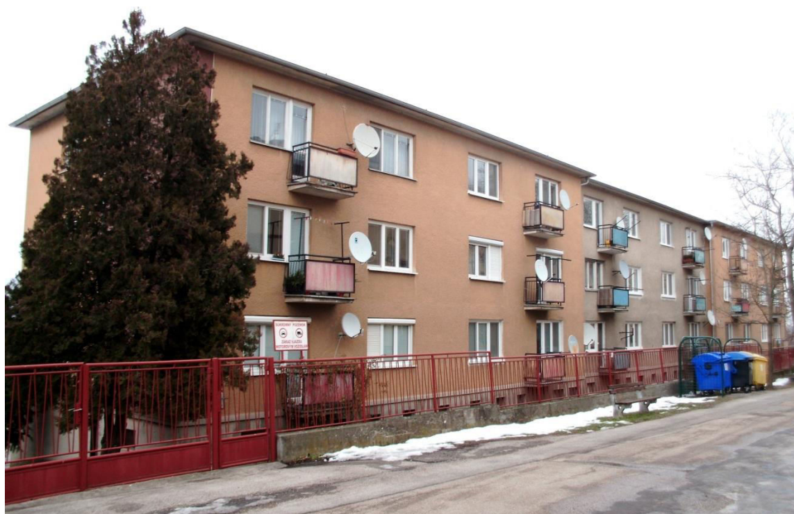
pohľad na uličné fasády z juhozápadu