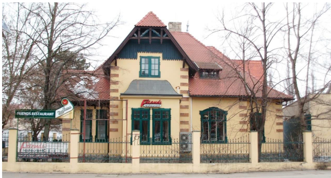
pohľad na uličnú fasádu zo Štefánikovej triedy