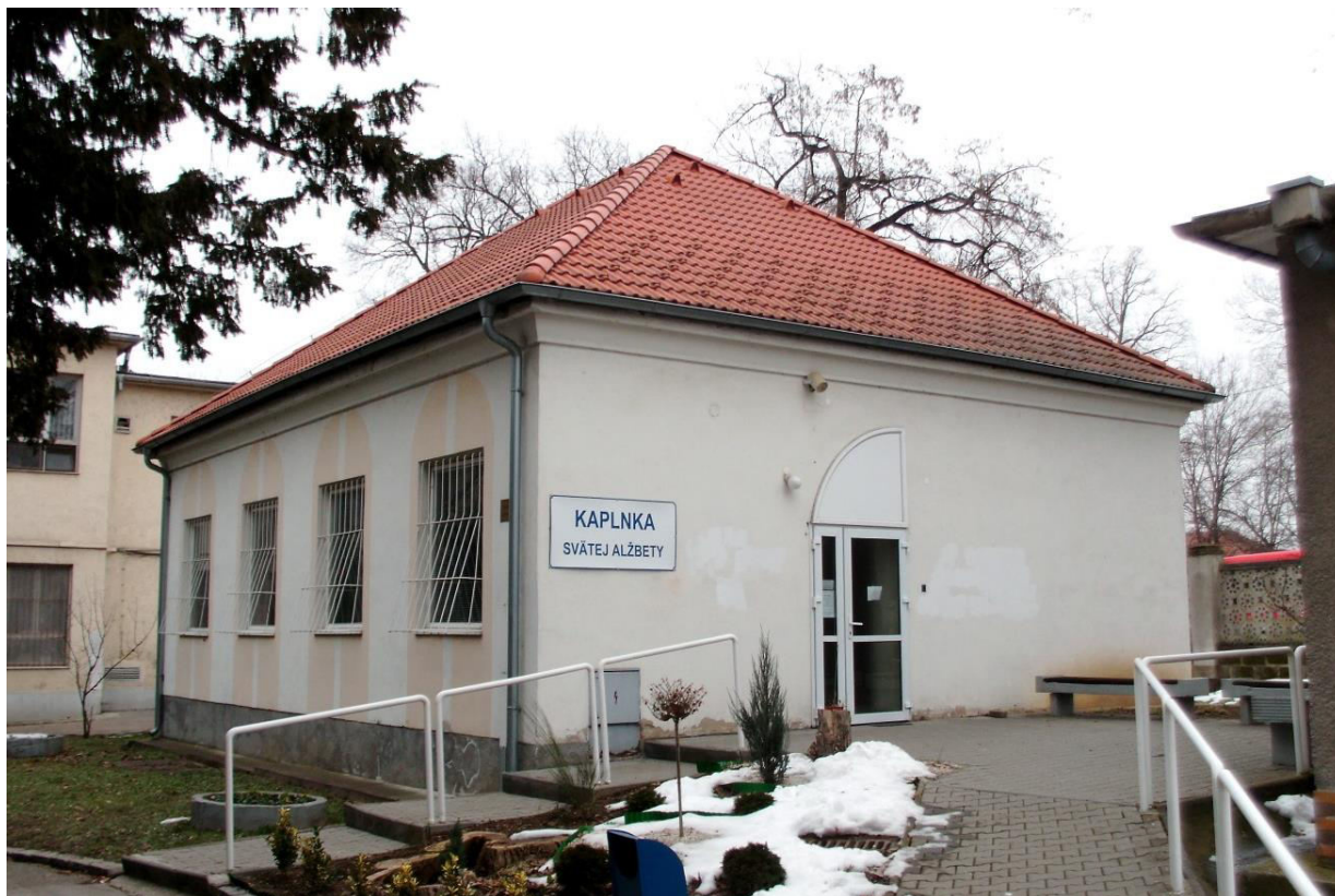
pohľad na objekt zo západu