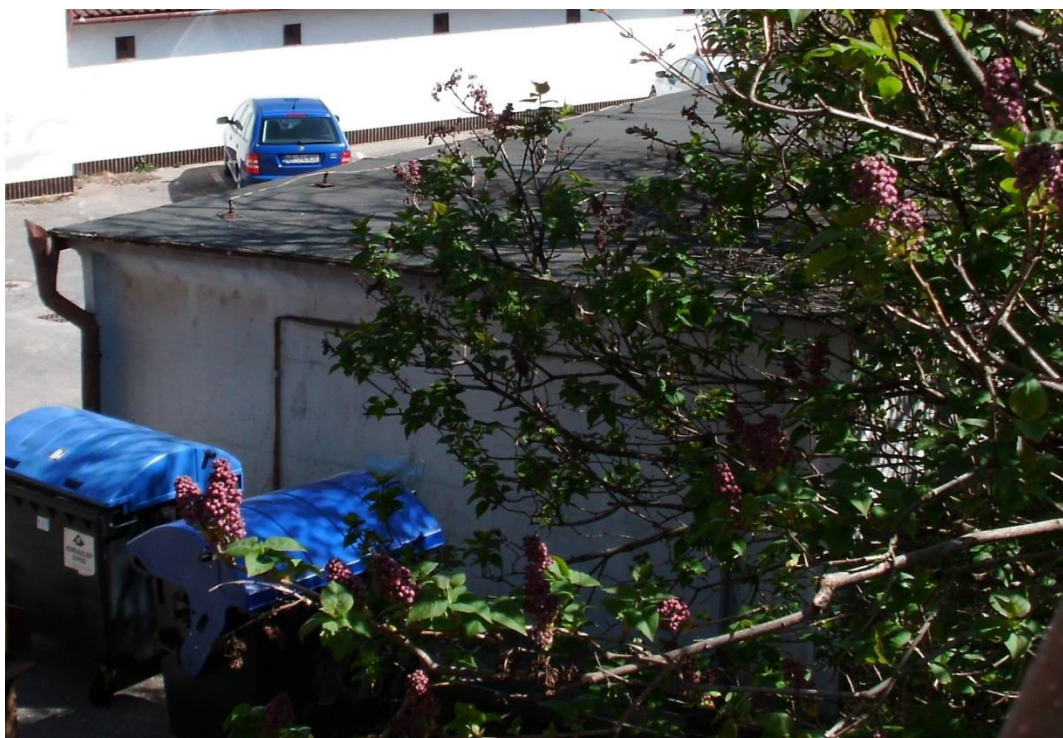
pohľad z juhozápadu