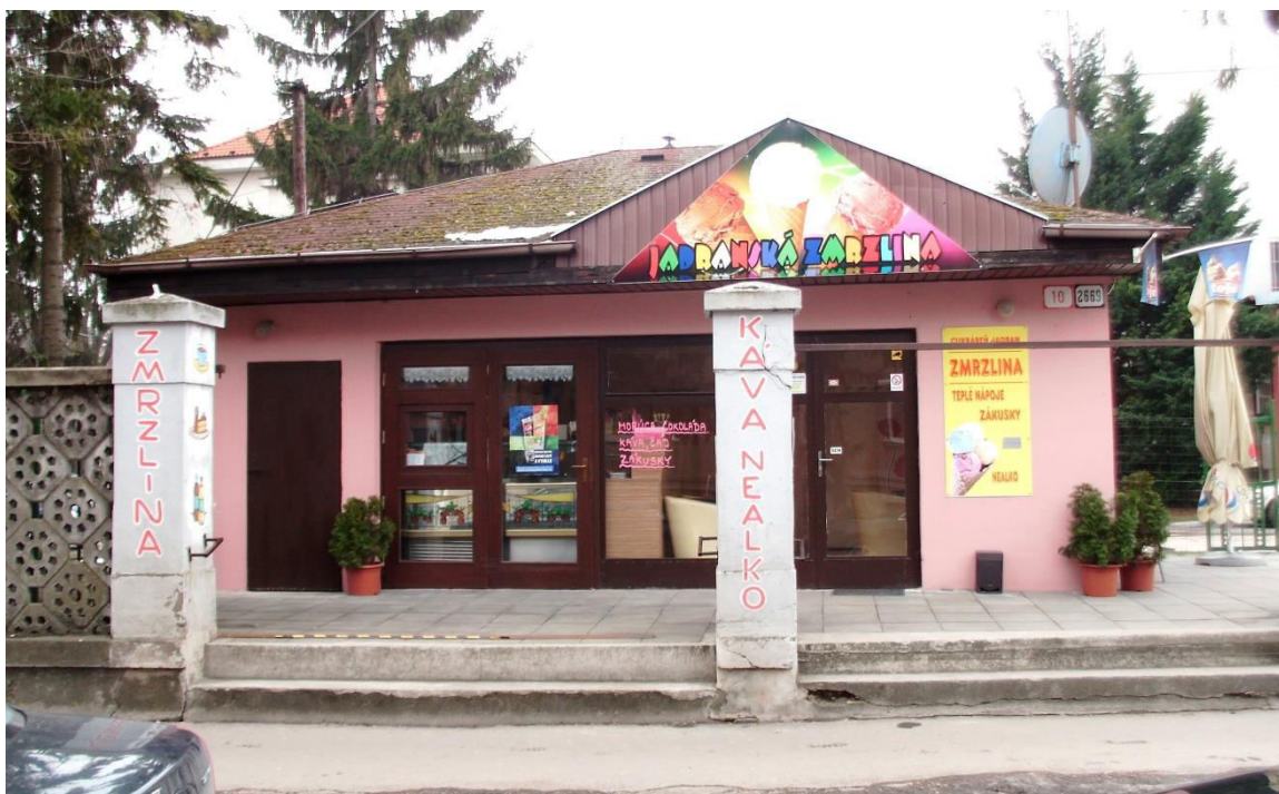
pohľad na uličnú fasádu zo Špitálskej ulice

SPRACOVAL: Ing. arch. Rudolf Viršík, PhD., KPÚ Nitra, 04/2015