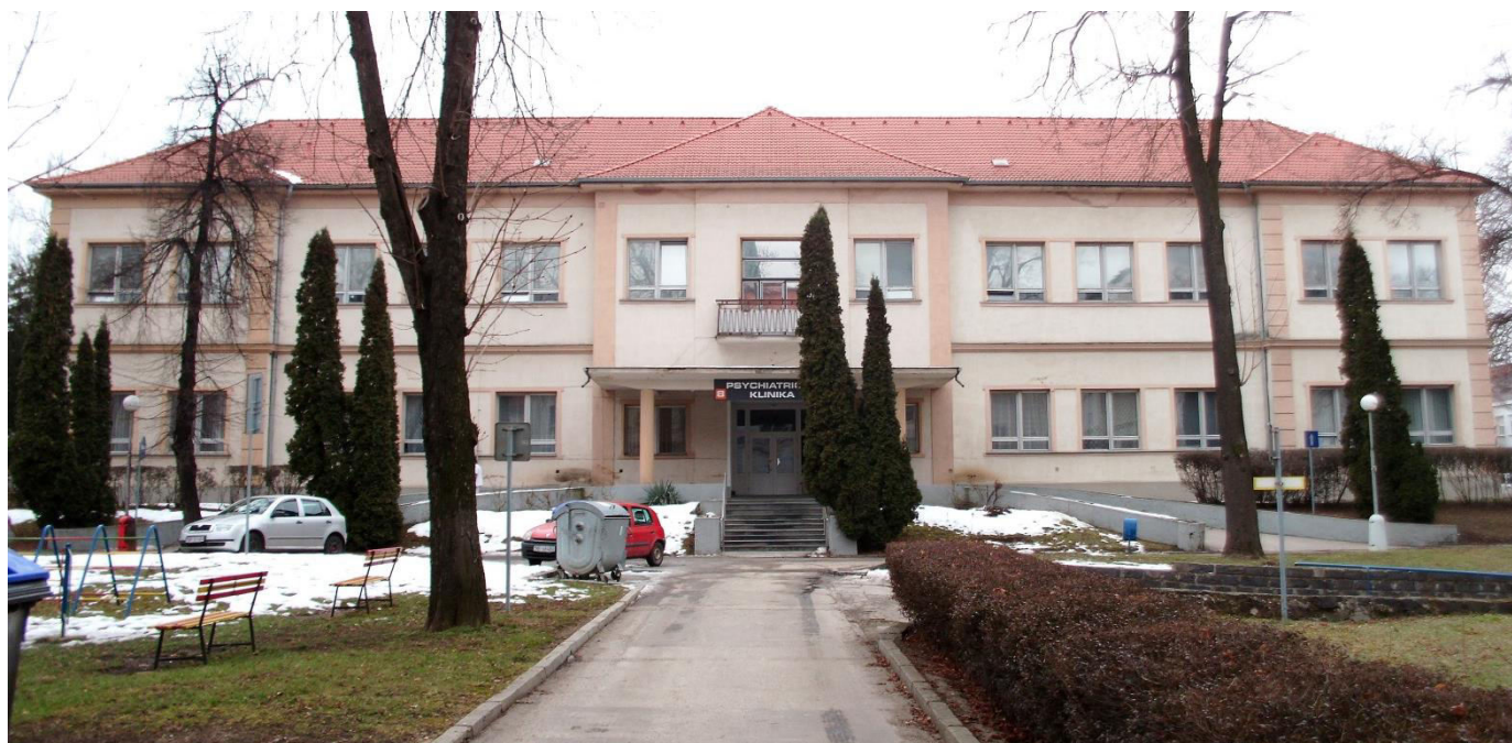
pohľad na hlavnú fasádu zo severovýchodu