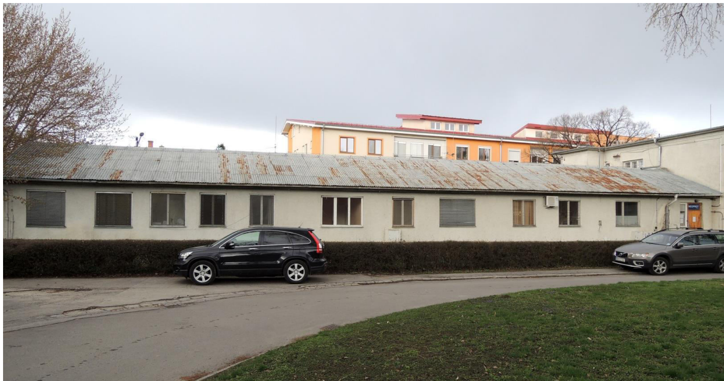
pohľad z juhozápadu, z areálu nemocnice