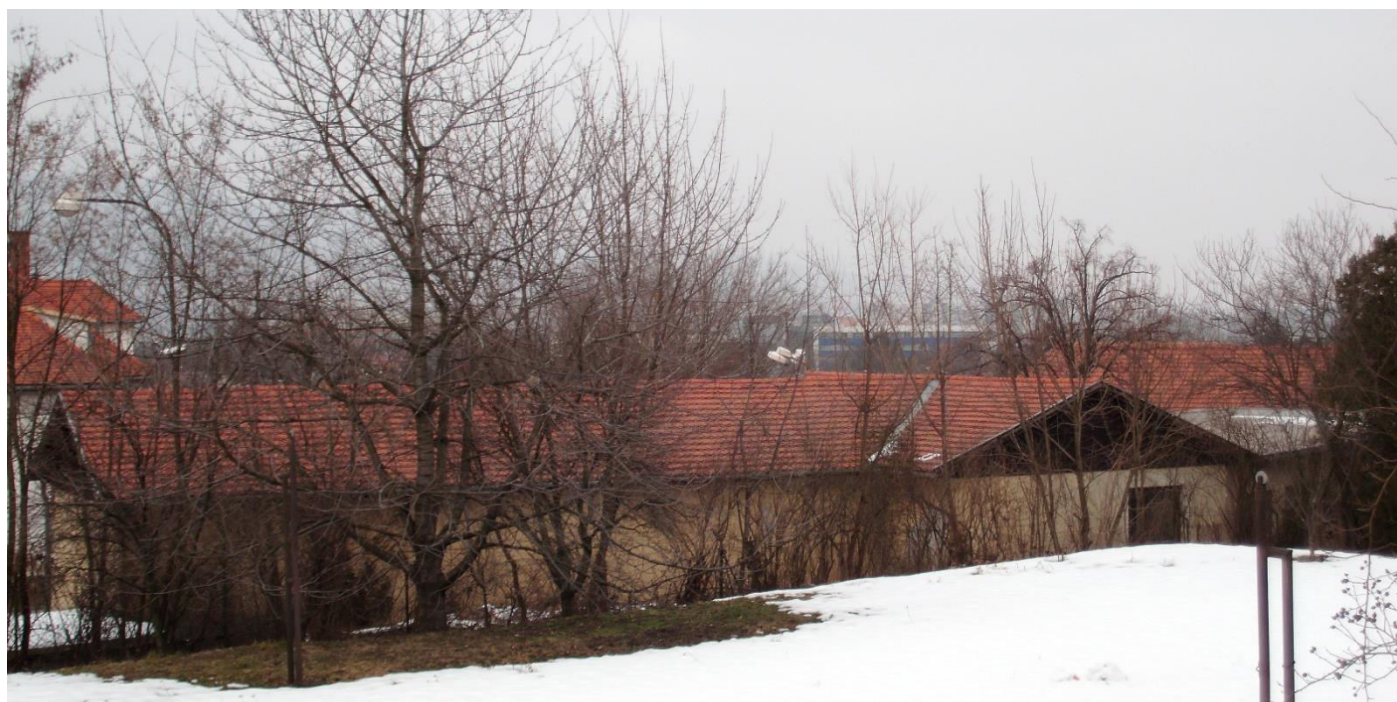
pohľad na južnú fasádu

SPRACOVAL: Ing. arch. Rudolf Viršík, PhD., KPÚ Nitra, 04/2015