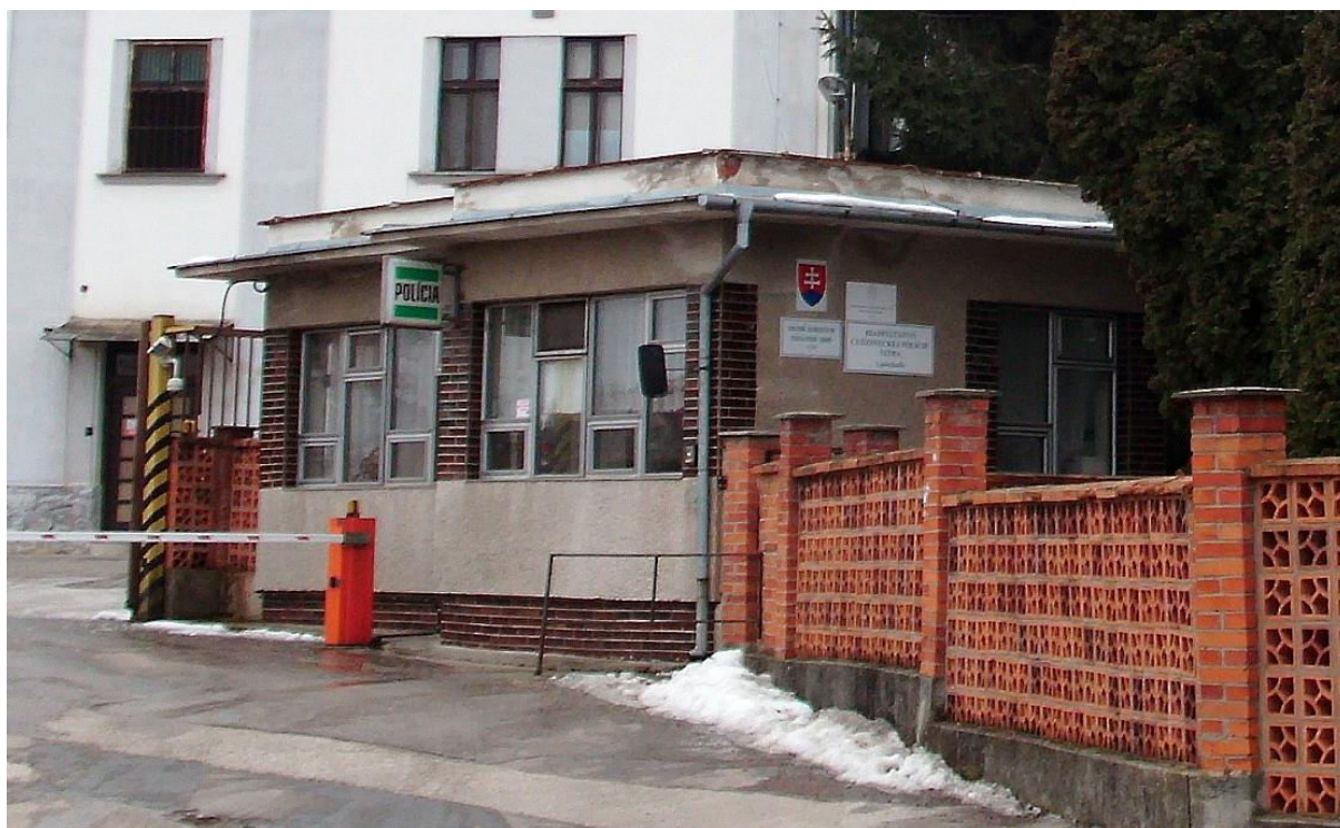
pohľad zo severu