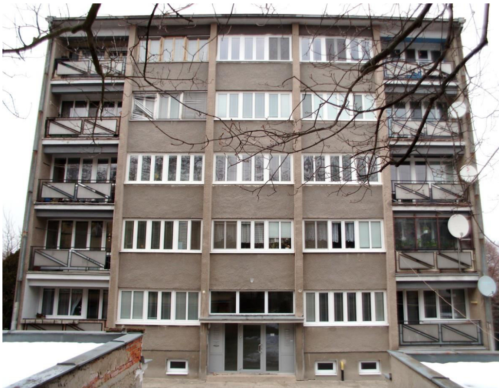
pohľad na južnú fasádu z Misionárskej ulice