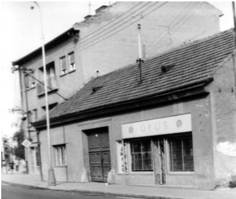
85. Pohľad na priečelia objektov Mostná č. 44, 46 (parc. č. 318, 319), 70. roky 20. storočia (sektor B)