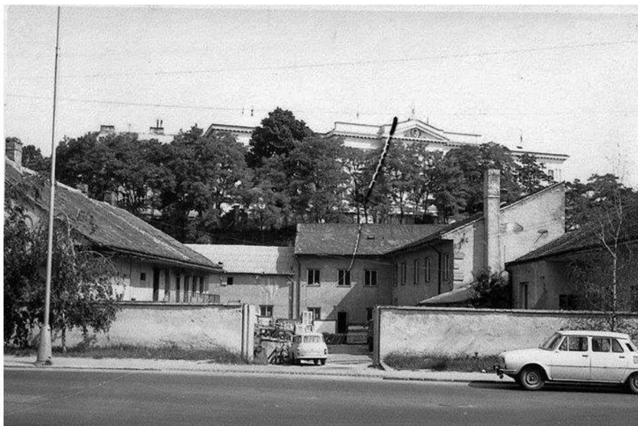
79. Pohľad na asanovanú zástavbu ulice Mostná, v súčasnosti prieluka, 70. roky 20. storočia (sektor B)