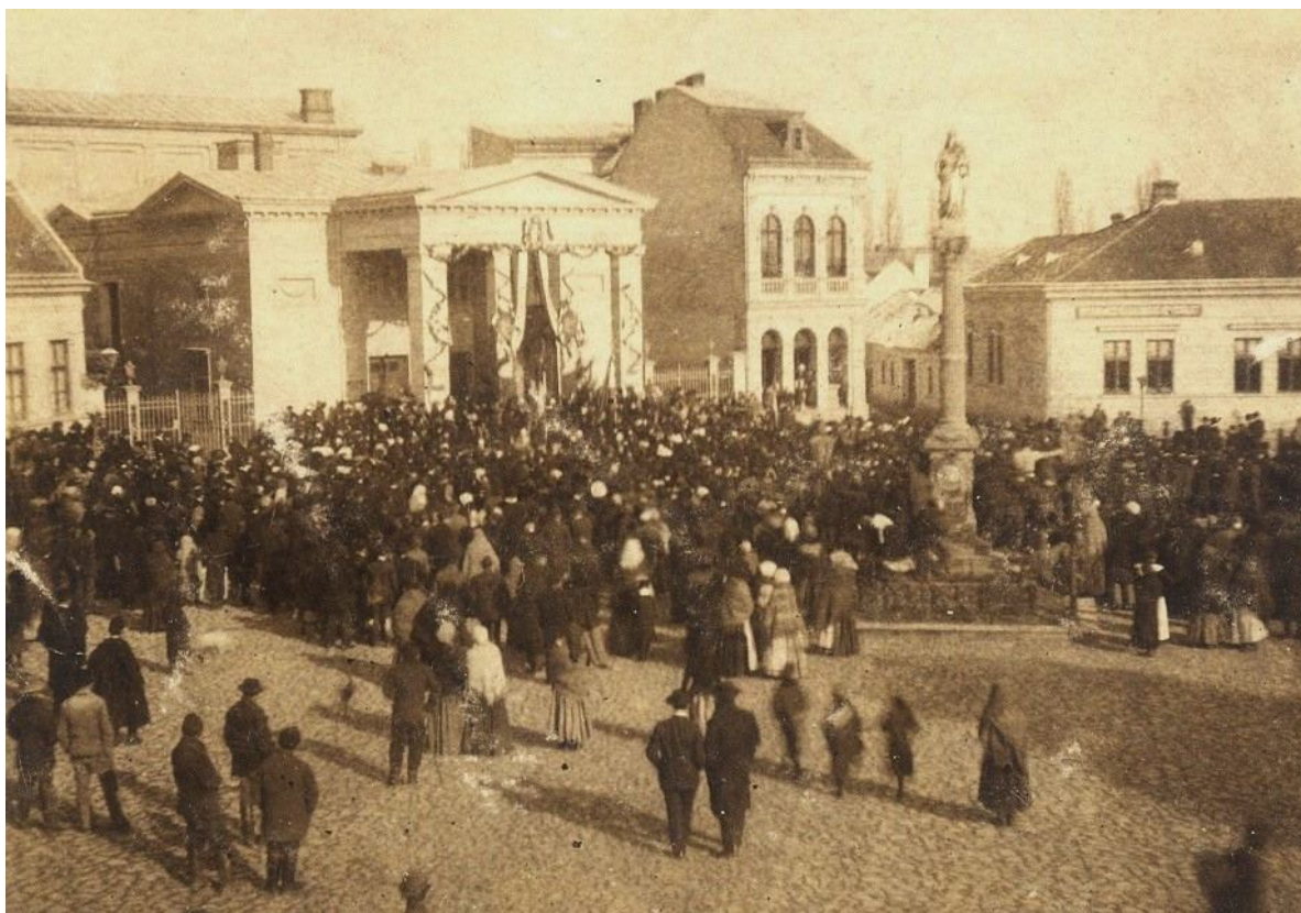
57. Pohľad na dnešné Svätoplukovo námestie (bývalé Štefánikovo námestie) s asanovaným starým divadlom v klasicistickom štýle, uprostred Mariánsky stĺp, rok 1914 (sektor B)