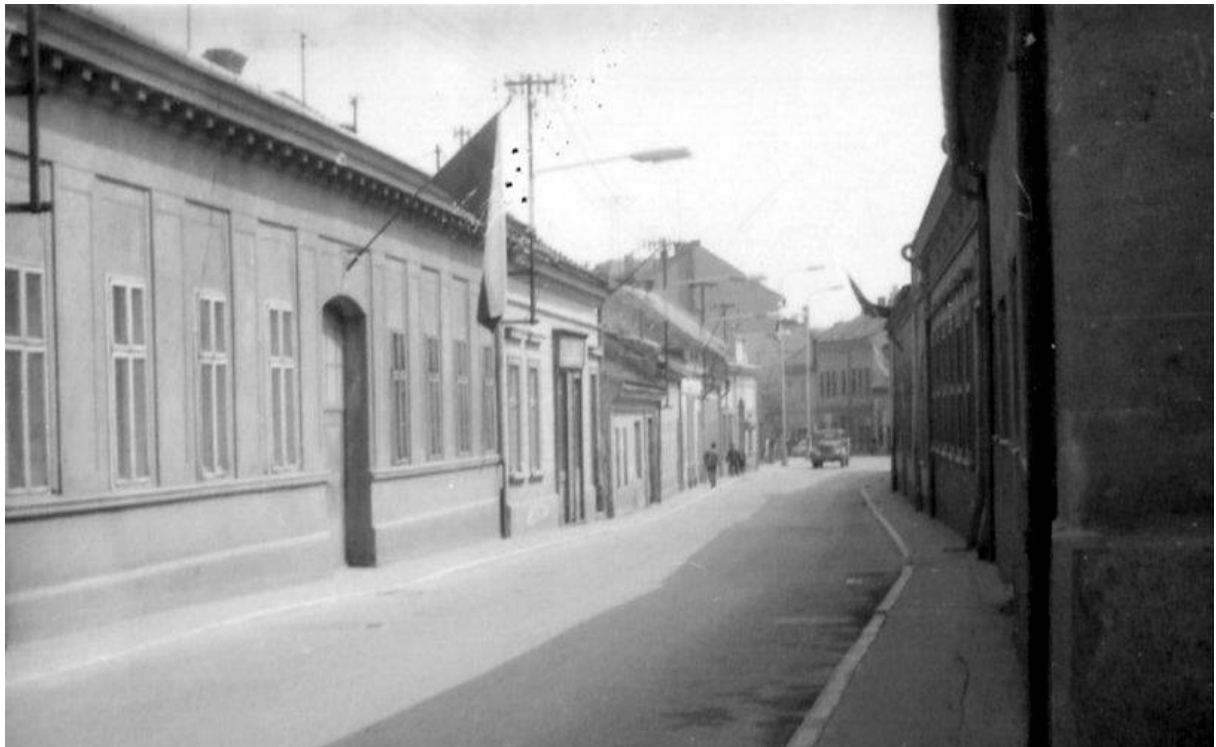
90. Zaniknutá zástavba na ulici Mostná, pohľad smerom od ulice Ďurkova, 70. roky 20. storočia (sektor B)