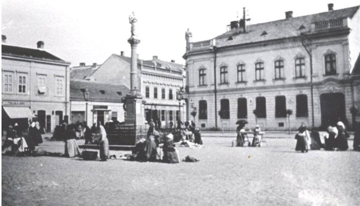
66. Pohľad na dnešné Svätoplukovo námestie s vyústením zaniknutej ulice Malošpitálska (Telegdyho), vpravo už asanovaná budova bývalej Hlavnej pošty, začiatok 20. storočia (sektor B)