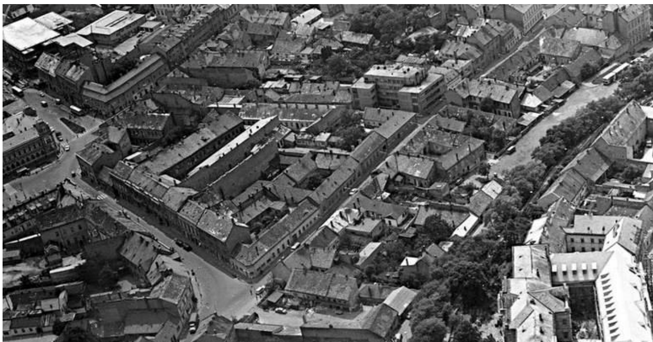
83. Letecký pohľad na územie, pôvodná štruktúra ulice Mostná a dnešného Svätoplukovho námestia (asanovaný kompaktný mestský blok), 70. roky 20. storočia (sektor B)