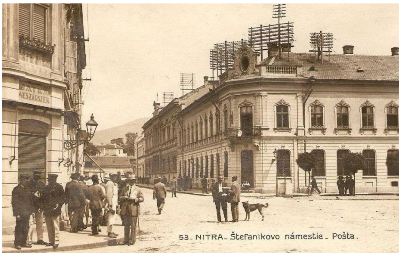
73. Pohľad na zaniknutú ulicu Malošpitálska, napravo bývalá Hlavná pošta (asanovaná), na fotografii je čitateľná valúnová dlažba, ktorou boli upravené komunikácie na námestí, začiatok 20. storočia (sektor B)