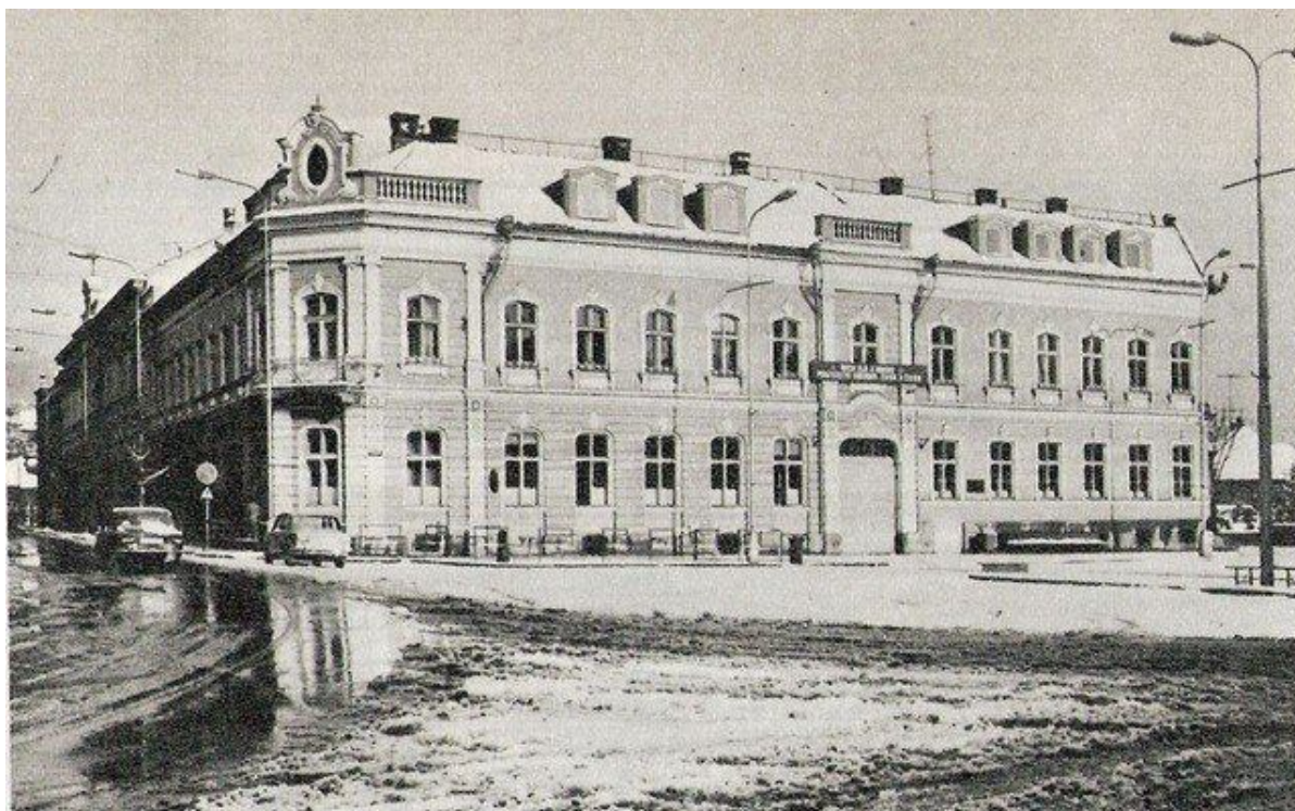
74. Pohľad na budovu bývalej Hlavnej pošty pred asanáciou, 60. roky 20. storočia (sektor B)