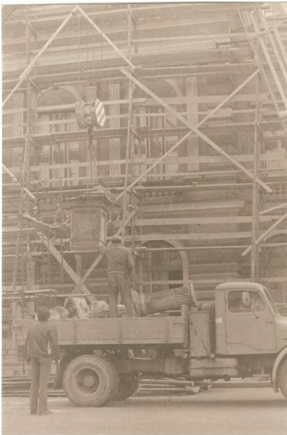
71. Pohľad na rozoberanie a deponovanie Mariánskeho stúpa (Immaculata) zo Svätoplukovho námestia v 70. rokoch 20. storočia, od roku 1989 stojí opäť na Svätoplukovom námestí (sektor B)