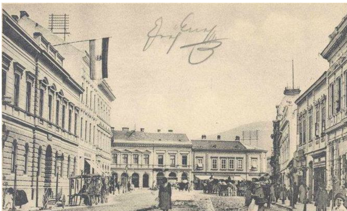
77. Pohľad na priečelia asanovanej kompaktnej zástavby vo vyústení dnešnej Štefánikovej triedy, začiatok 20. storočia (sektor B)