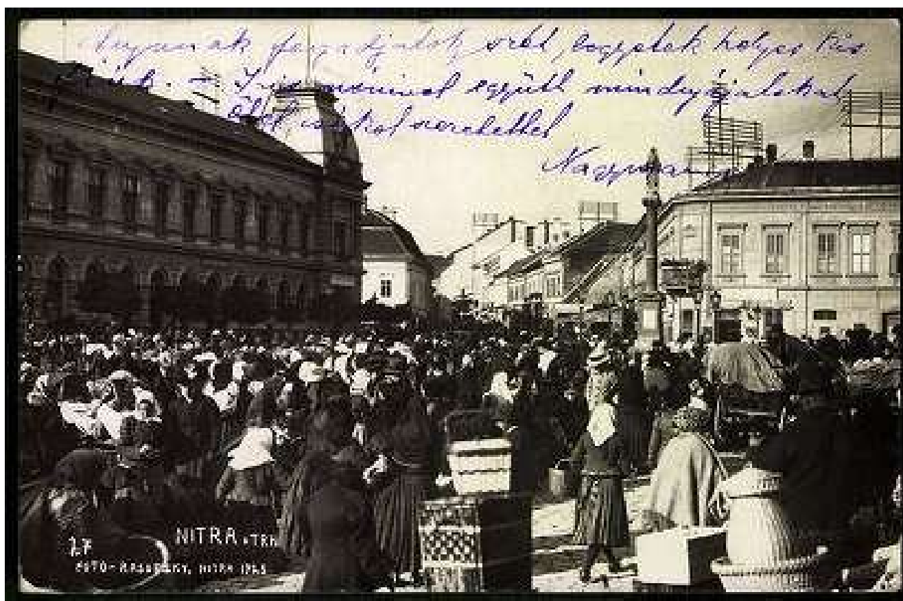
62. Mariánský stĺp (Immaculata), rok 1923, dnešné Svätoplukovo námestie (sektor B)