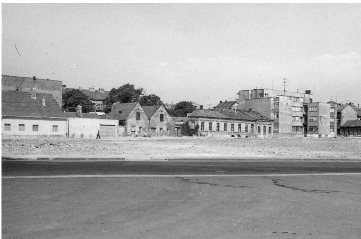
89. Zaniknutá ulica Križna, naľavo objekt Kupecká 2 a územie po asanácii mestského bloku (dnešné Svätoplukovo námestie), 70. roky 20. storočia (sektor B)