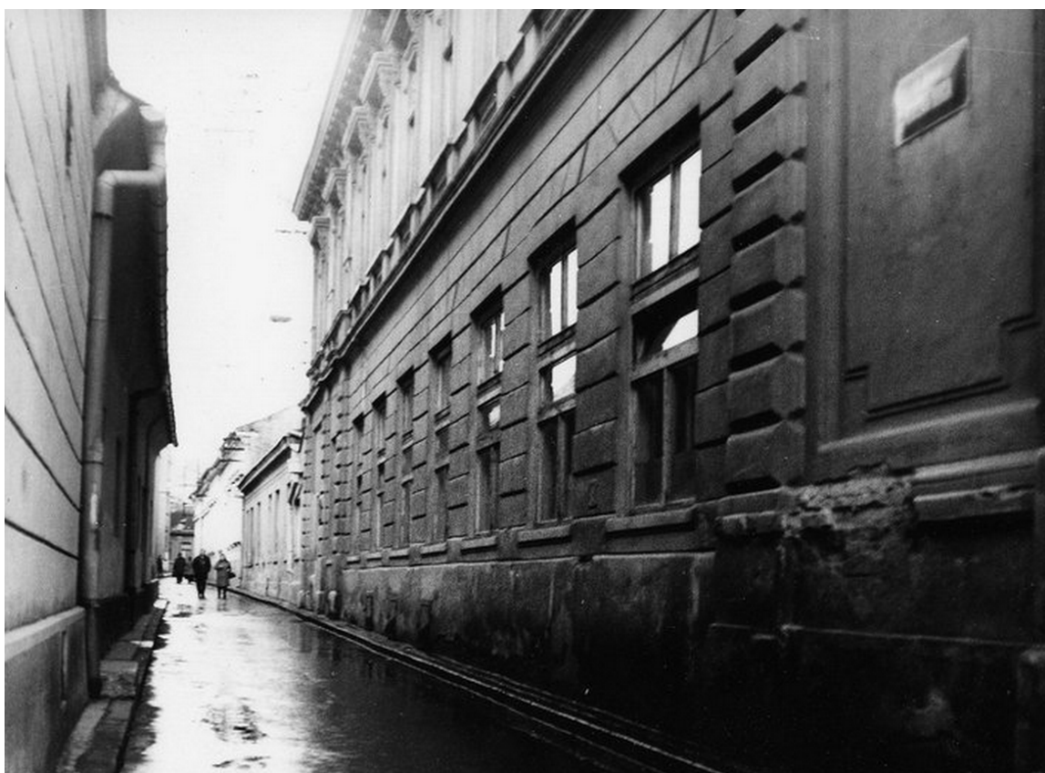
75. Zaniknutá ulica Križna, zástavba napravo bola asanovaná, vľavo objekt Kupecká 2, 60. roky 20. storočia (sektor B)