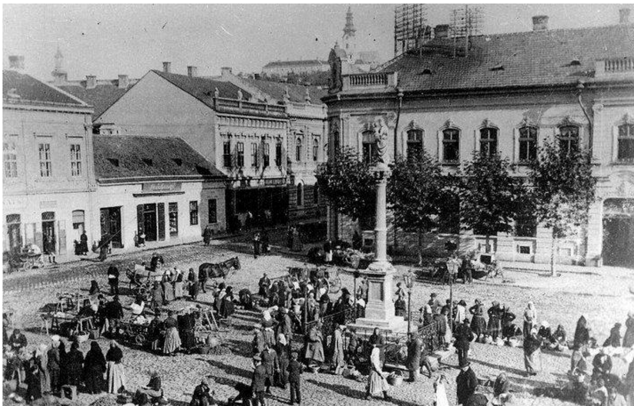
65. Pohľad na dnešné Svätoplukovo námestie s vyústením zaniknutej ulice Malošpitálska (Telegdyho), uprostred Mariánsky stĺp, začiatok 20. storočia (sektor B)