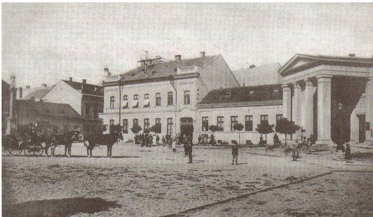
59. Pohľad na dnešné Svätoplukovo námestie s asanovanou zástavbou meštianskych domov, rok 1900 (sektor B)