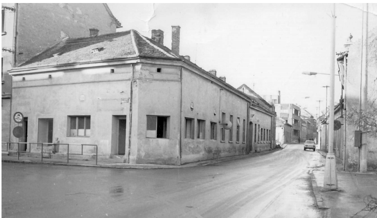
87. Križovatka zaniknutej ulice Malošpitálska s ulicou Mostná s už neexistujúcimi objektmi, 70. roky 20. storočia (sektor B)