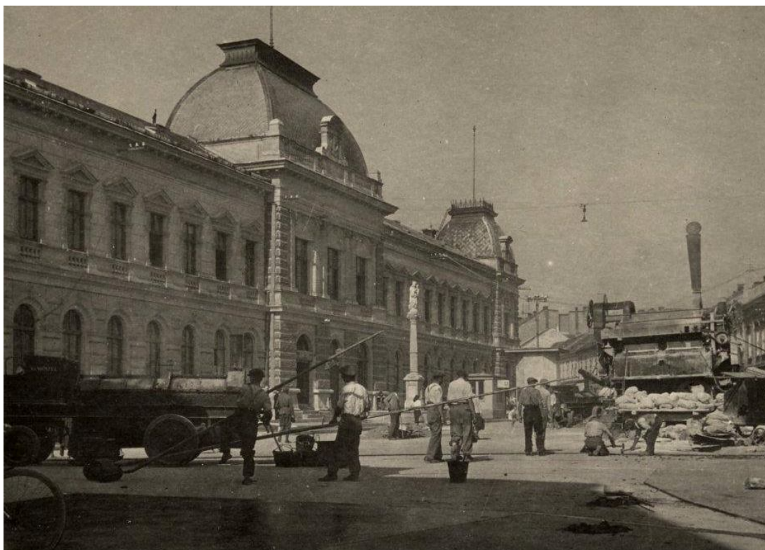
69. Mariánsky stĺp (Immaculata), prvá polovica 20. storočia, dnešné Svätoplukovo námestie (sektor B)