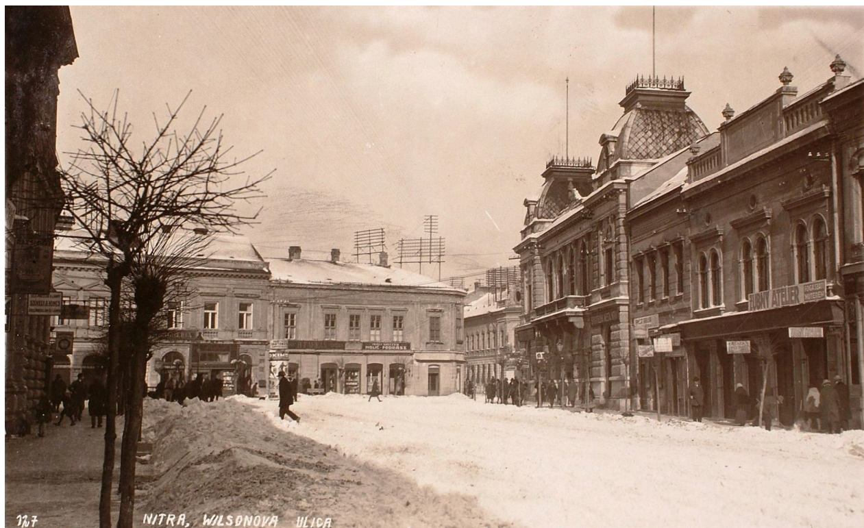
78. Pohľad na priečelia asanovanej zástavby vo vyústení dnešnej Štefánikovej triedy (bývalá Wilsonova ulica), vpravo budova radnice, pol. 20. storočia (sektor B)