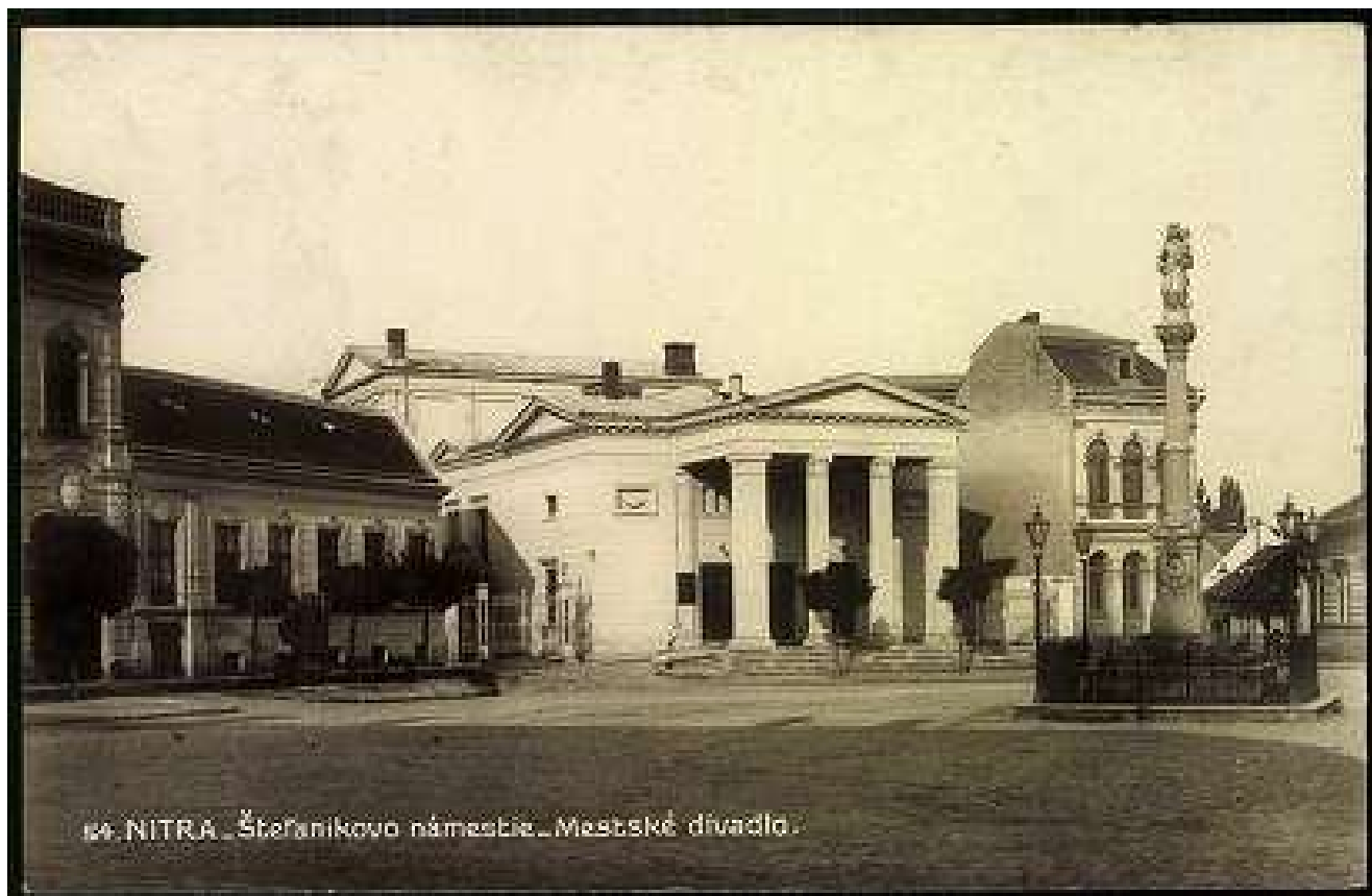
64. NITRA. Štefanikovo námestie. Mestské divadlo.