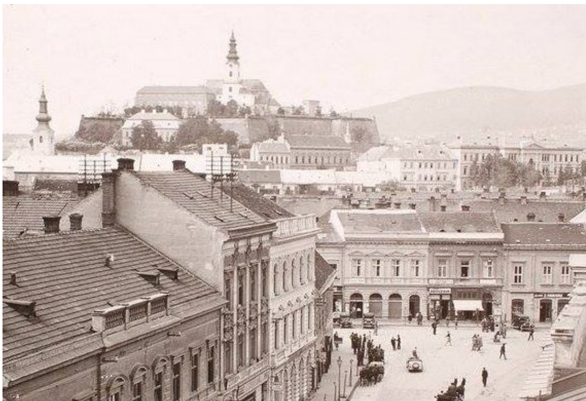
76. Pohľad na časť asanovanej kompaktnej zástavby v križovatke dnešnej Štefánikovej triedy a ulice Kupecká, v pozadí silueta Horného mesta, 30. roky 20. storočia (sektor B)