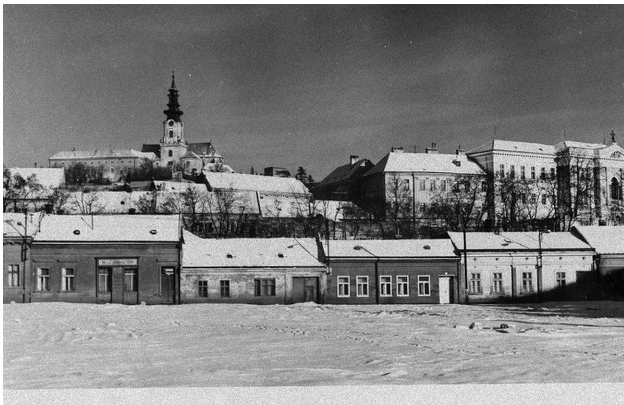
86. Pohľad na priečelia asanovaných nízkopodlažných objektov na ulici Mostná tvoriaca podnož Horného mesta, silueta Horného mesta hierarchicky nadradená a jasne vnímateľná, 70. roky 20. storočia (sektor B)