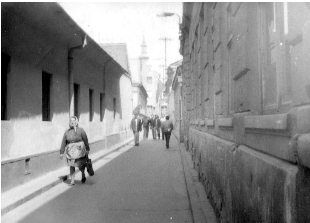
88. Zaniknutá ulica Križna, naľavo Kupecká 2, napravo asanovaná zástavba (dnešné Svätoplukovo námestie), vľavo objekt Kupecká 2, 70. roky 20. storočia (sektor B)