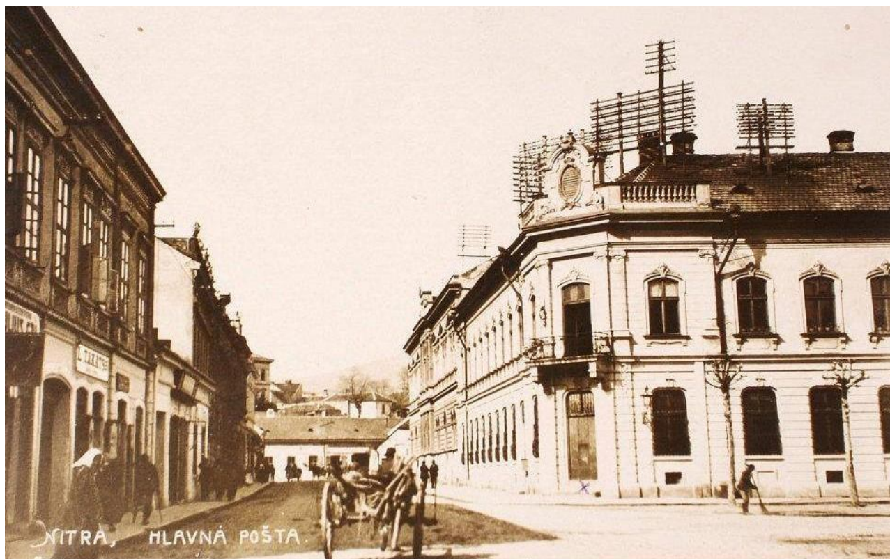
72. Pohľad na zaniknutú ulicu Malošpitálska, napravo bývalá Hlavná pošta (asanovaná), priehľad na zaniknutú nízkopodlažnú zástavbu ulice Mostná, 20. – 30. roky 20. storočia (sektor B)