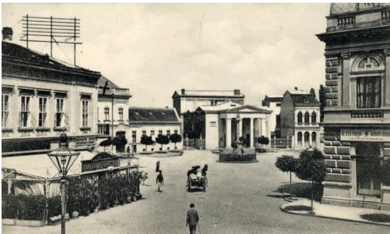
60. Pohľad na dnešné Svätoplukovo námestie smerom od ulice Kupecká, začiatok 20. storočia (sektor B)