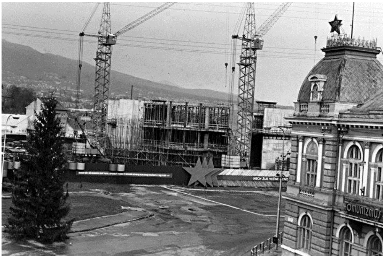
84. Výstavba nového divadla (Divadlo Andreja Bagara) na dnešnom Svätoplukovom námestí, 80. roky 20. storočia (sektor B)