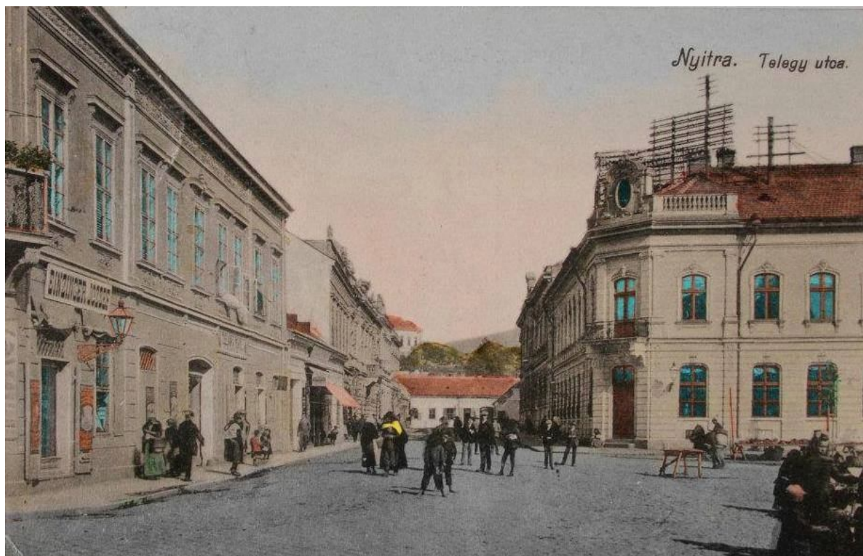
64. Pohľad na už neexistujúcu ulicu Malošpitálska (Telegdyho) s priehľadom na ulicu Mostná a Horné mesto, začiatok 20. storočia (sektor B)