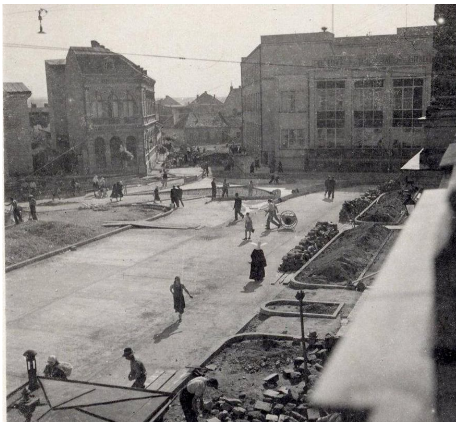
70. Dnešné Svätoplukovo námestie, napravo nová budova Hlavnej pošty vo funkcionalistickom štýle, 40. roky 20. storočia (sektor B)