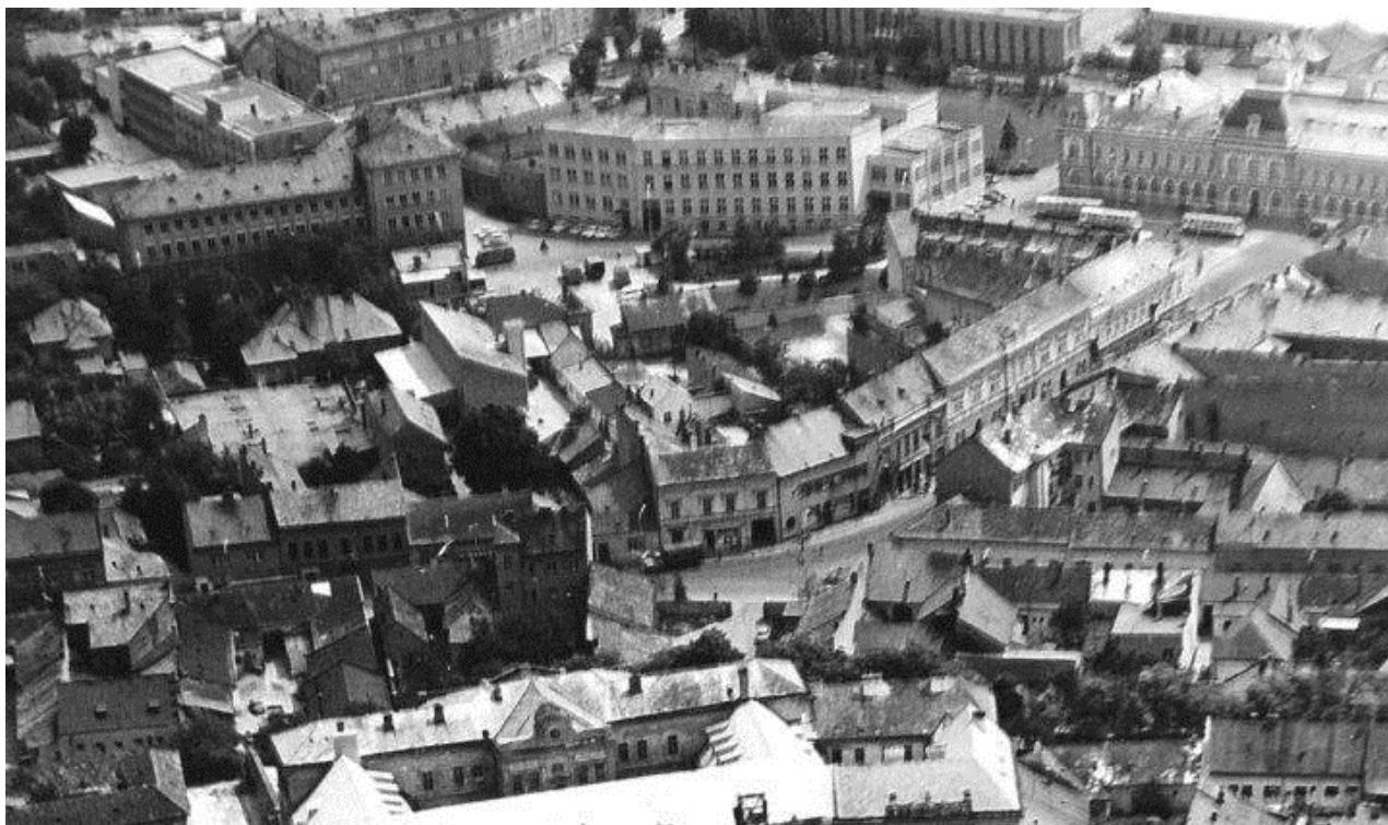
82. Letecký pohľad na územie, pôvodná štruktúra ulice Mostná a dnešného Svätoplukovho námestia, 70. roky 20. storočia (sektor B)