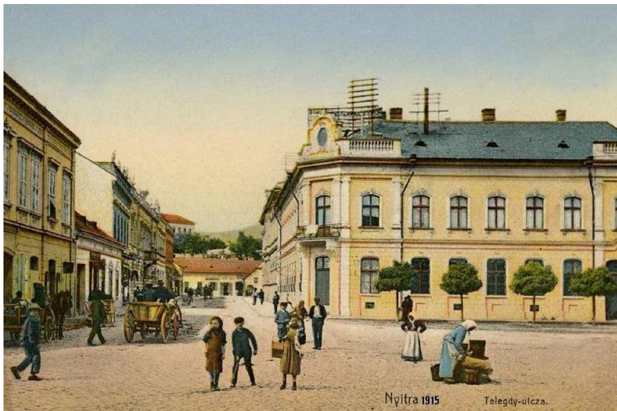
63. Pohľad na už neexistujúcu ulicu Malošpitálska (Telegdyho), dnes Svätoplukovo námestie, vpravo budova bývalej pošty, na mieste ktorej sa dnes nachádza budova Divadlo Andreja Bagara v Nitre, rok 1915 (sektor B)