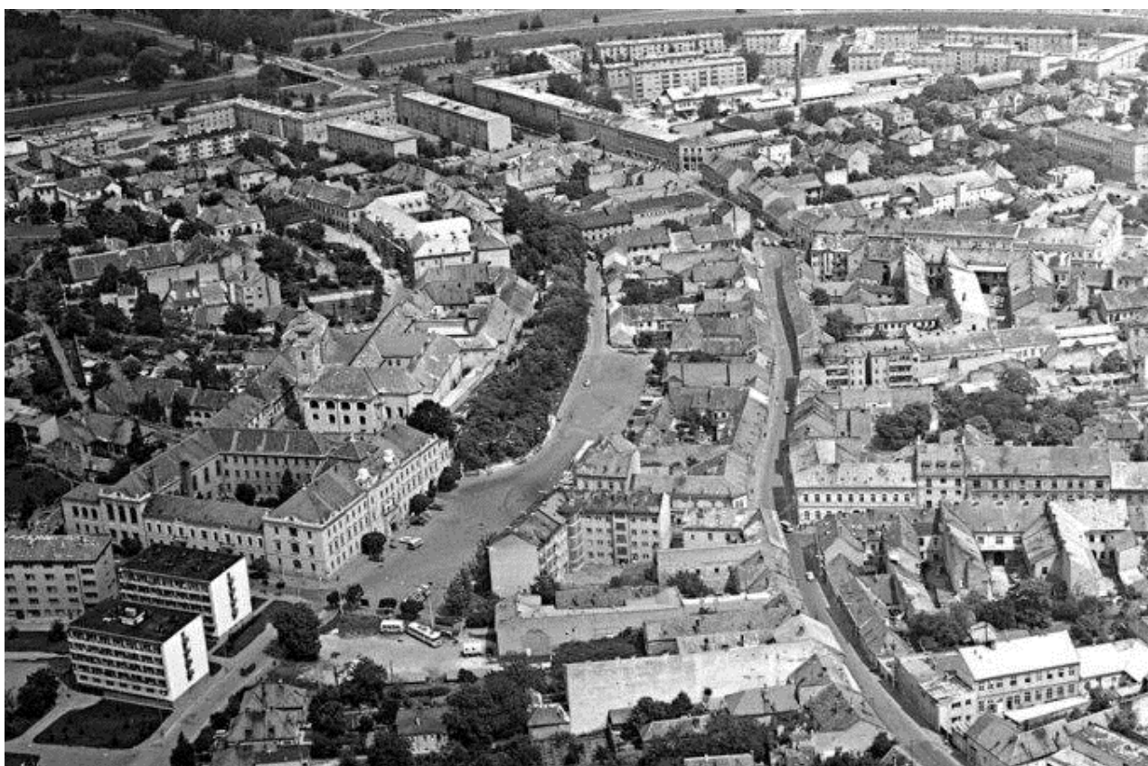
81. Letecký pohľad na územie, vpravo pôvodná štruktúra esovite formovanej ulice Mostná a dnešného Svätoplukovho námestia, 70. roky 20. storočia (sektor B)