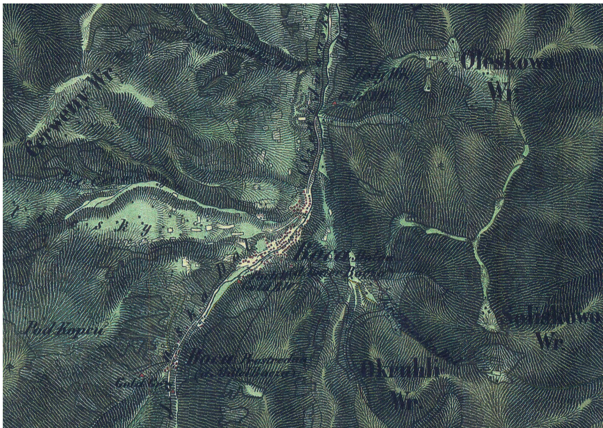
XXXV-37, Nižná Boca, 2. vojenské mapovanie, r. 1847