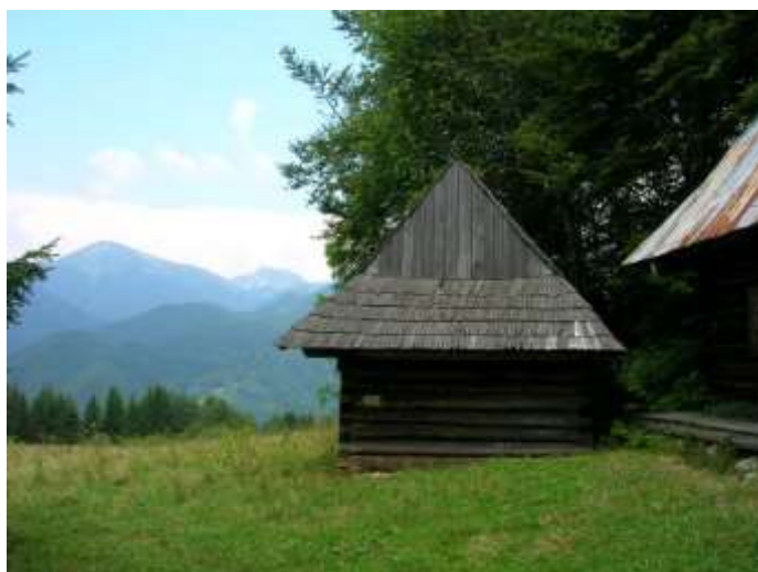
24 pôvodne hospodársky objekt č. 11, južná fasáda – pohľad na masív Malej Fatry