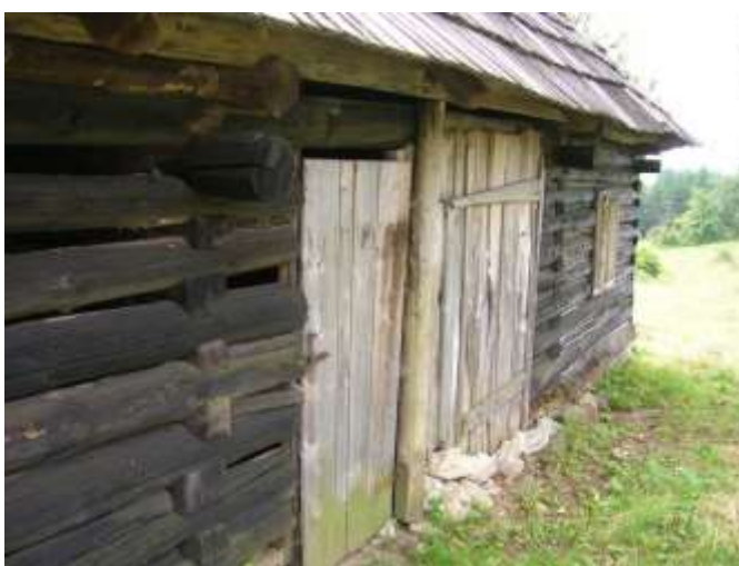
31 tvaroslovie hospodárskeho objektu č. 7