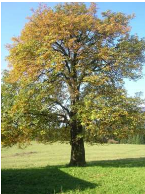
solitérna stromová zeleň – pagaštan konský

Urbanizované územie je organicky prepojené s prírodnou a krajinnou zložkou. V sídle, resp. v dotyku s ním sa nachádzajú pôvodné dreviny a stromy, ako i stromy vysadené pôvodnými obyvateľmi sídla : listnaté stromy – Lipa malolistá ( Tilia cordata ), Pagaštan konský ( Aesculus hippocastanum ), Hrab obyčajný ( Carpinus betulis ), Buk lesný ( Fagus sylvatica ), Jarabina mukyňová ( Sorbus aria ), Kalina siripútková ( Viburnum lantana ), Jablň planá ( Malus sylvestris ), Hruška planá ( pyrus pyraster ), Lieska obyčajná ( Corylus avellana ) ihličnaté stromy – Borievka obyčajná ( Juniperus communis )