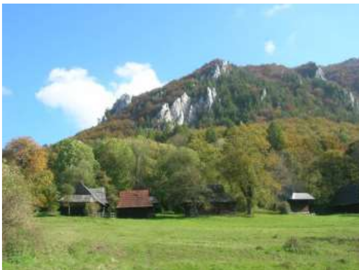
diaľkový pohľadový uhol č. 1

chránené pohľadové uhly na pamiatkové územie, ktoré je nutné zachovať (poloha vyznačená v grafickej časti, výkres č.4 územný priemet zásady ochrany pamiatkového územia)