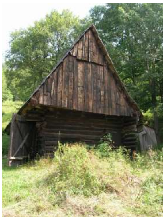
5 hospodársky objekt č.1, pohľad na juhozápadnú fasádu