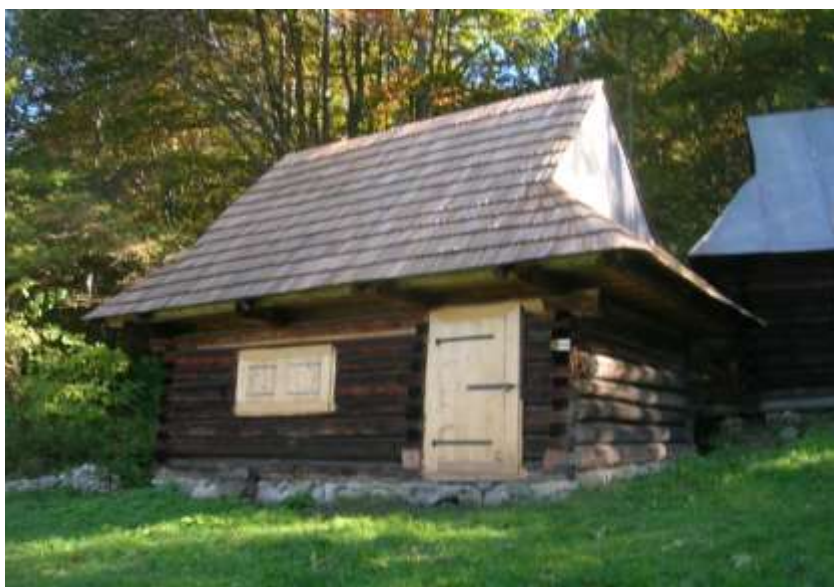
pôvodne hospodársky objekt – senník, parcelné číslo KN 2361, stavebne upravený na rekreačný objekt

Súčasnú využívanie väčšiny objektov zachováva pôvodné konštrukčné a materiálové riešenie ľudového staviteľstva vrátane architektonického detailu. Zachované sú pôvodné resp. obnovené sú : drevené trámové stropy, drevené doskové podlahy, drevené výplne okenných a dverových otvorov v pôvodnom výraze a tvarosloví. Strešnú krytinu na všetkých objektoch tvorí drevený šindeľ. Použitie iných stavebných materiálov sa v lokalite nevyskytuje.