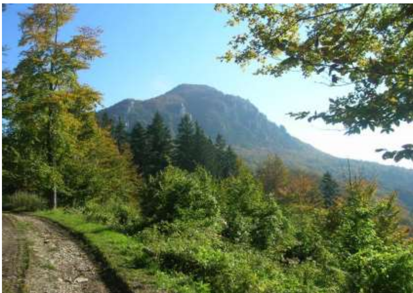
dialkový pohľad na skalný masív Zadný Šíp (1143 m.n.m) z prístupovej komunikácie vedenej do sídla Stankovany – Podšíp zo západnej strany