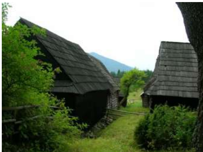
17 obytný dom č. 6 v kontexte zástavby