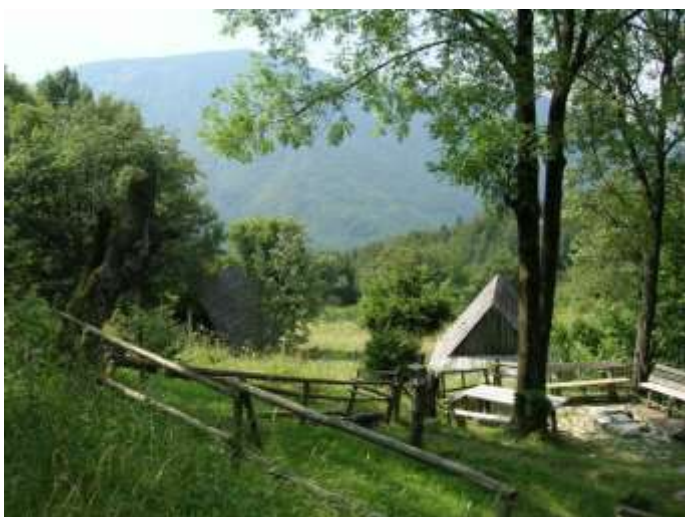
10 zástavba, hosp. objekt č. 1 a obytný dom č. 2, pohľad severovýchodný