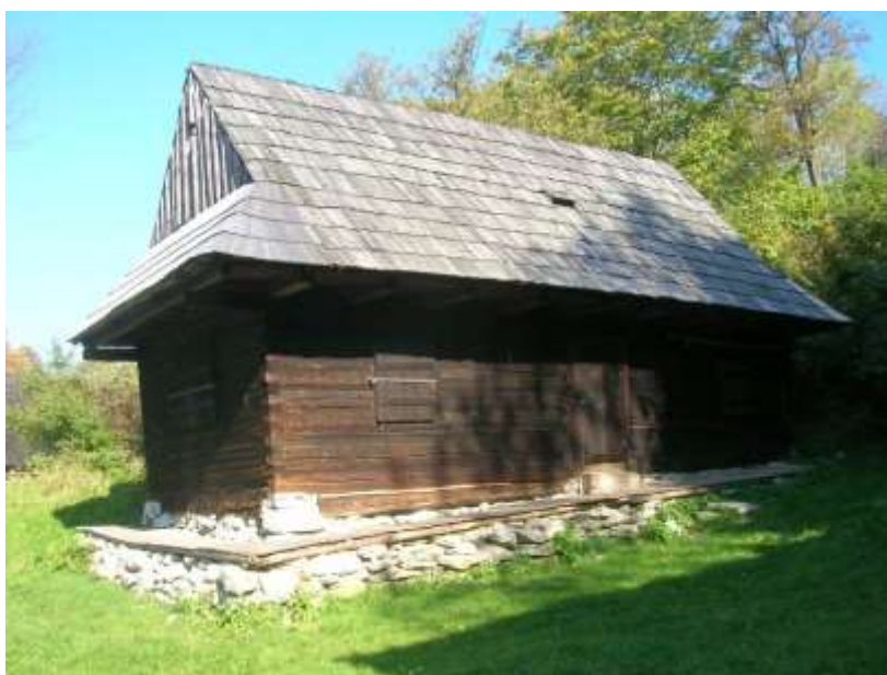
dom ľudový zrubový na parcele č. KN 2370, pohľad juhovýchodný