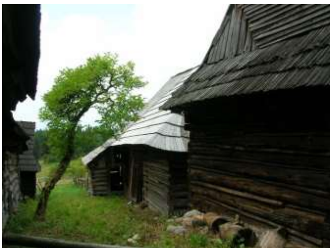
16 priestor medzi domami č.5, 8 a 7