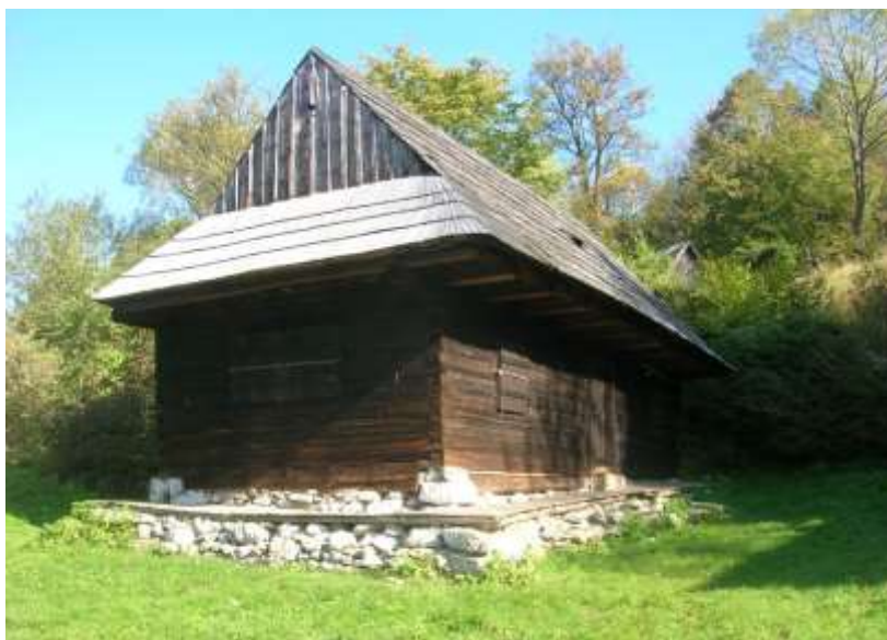
dom ľudový zrubový na parcele č. KN 2370, pohľad juhozápadný

Súčasný stav zachovania pamiatkovej substancie predurčuje uvedený objekt vyhlásiť za národnú kultúrnu pamiatku.