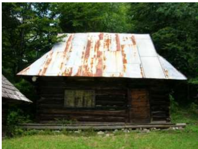
22 pôvodne hosp. objekt č. 10, západná fasáda