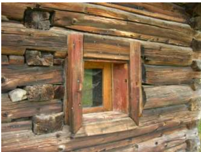
29 obytný dvojdom č. 5, detail okna