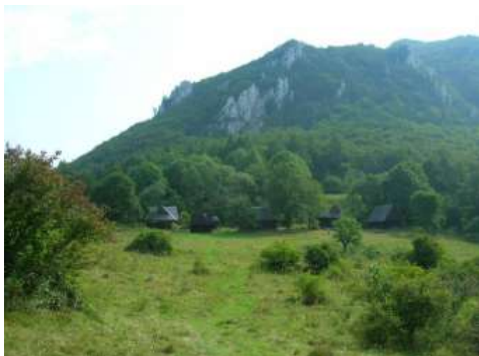
1 panoramatický pohľad, západný I.