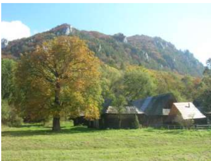
dialkový pohľadový uhol č. 3