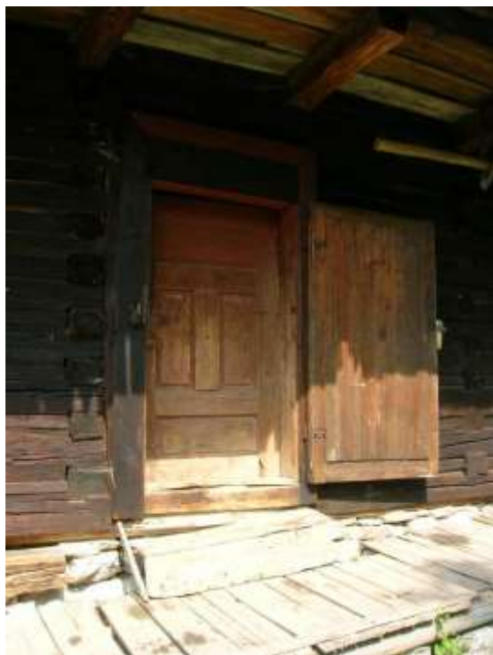
34 detail dverí a drevenej podlahy podsteny