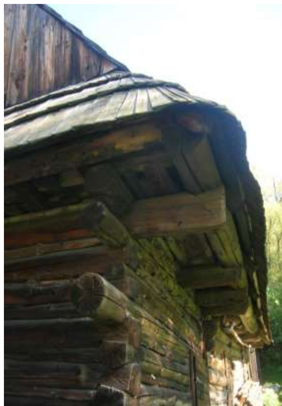
detail väzby nárožia a trámového stropu, dom na parcele č. KN 2365

Požiadavka použitia tradičných stavebných materiálov pri obnove objektov vychádza z potreby zachovania autenticity, jedinečnosti a typickosti objektov