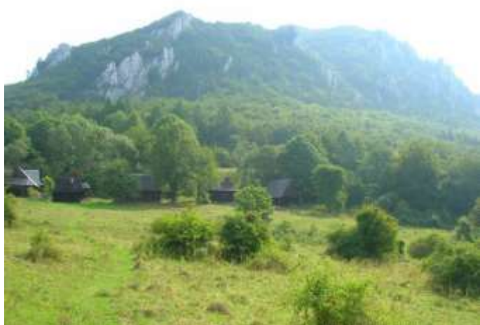
3 panoramatický pohľad, západný II.