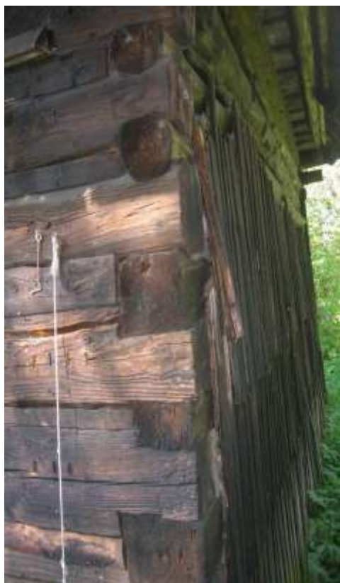
detail väzby zrubovej steny domu

Pri uplatnení konzervačnej metódy, ktorej cieľom je zastavenie resp. spomalenie prirodzeného procesu chátrania historického diela, je možné použiť jedine prírodný stavebný materiál ekologicky nezávadný, opracovaný a pre stavebnú obnovu pripravený tradičnými stavebnými technológiami.