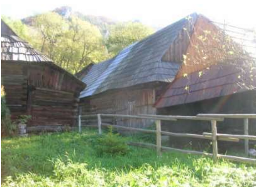
jednoduché drevené oplotenie s horizontálnym členením – centrálna časť PZ