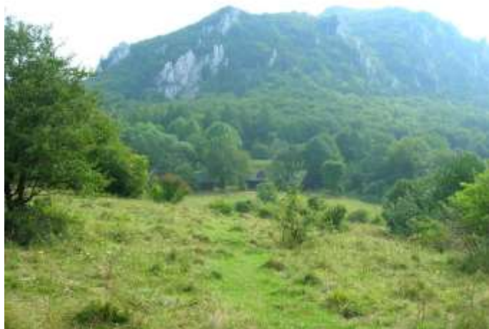
2 panoramatický pohľad, západný v pozadí skalný masív Šípu