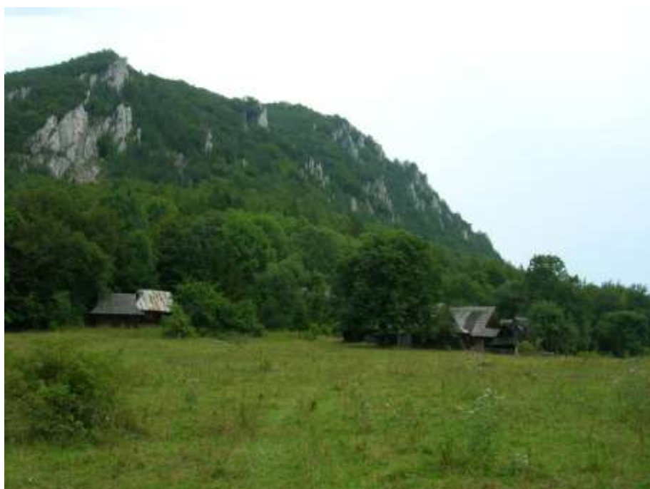
4 panoramatický pohľad juhozápadný