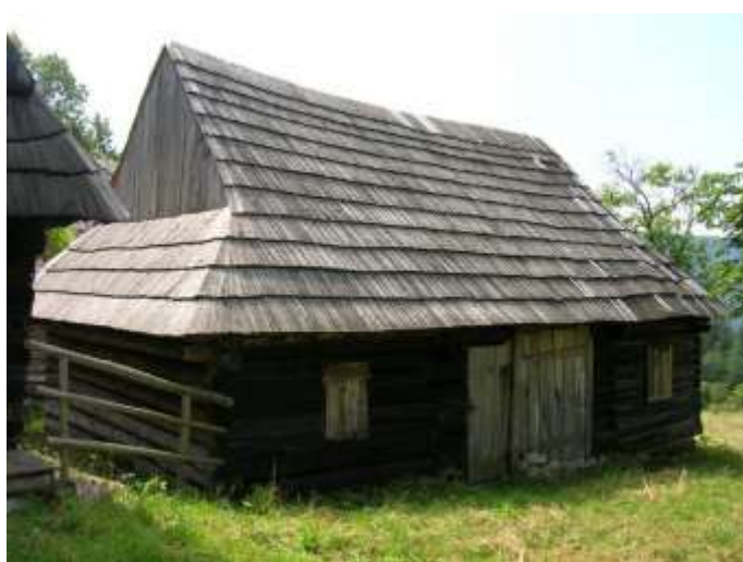
18 obytný dom č. 7, severozápadná fasáda