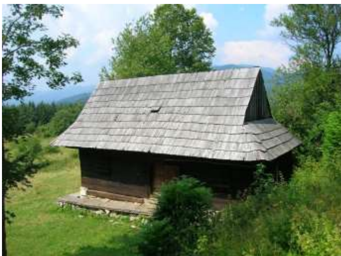
9 obytný dom č. 2, východná fasáda