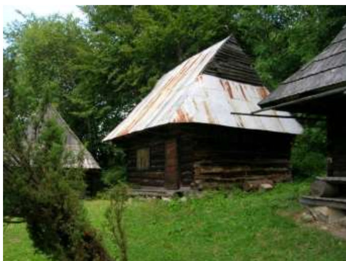
23 pôvodne hospodárske objekty č. 10 a 11