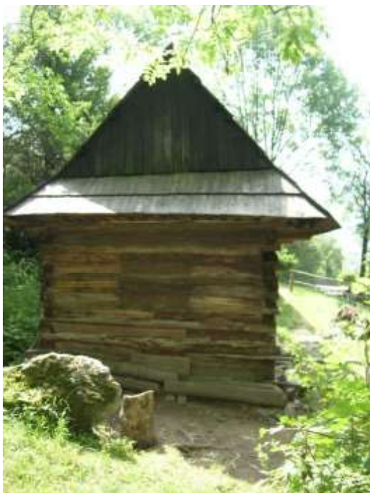
27 pôvodne hospodársky objekt č. 12, stavebne upravený