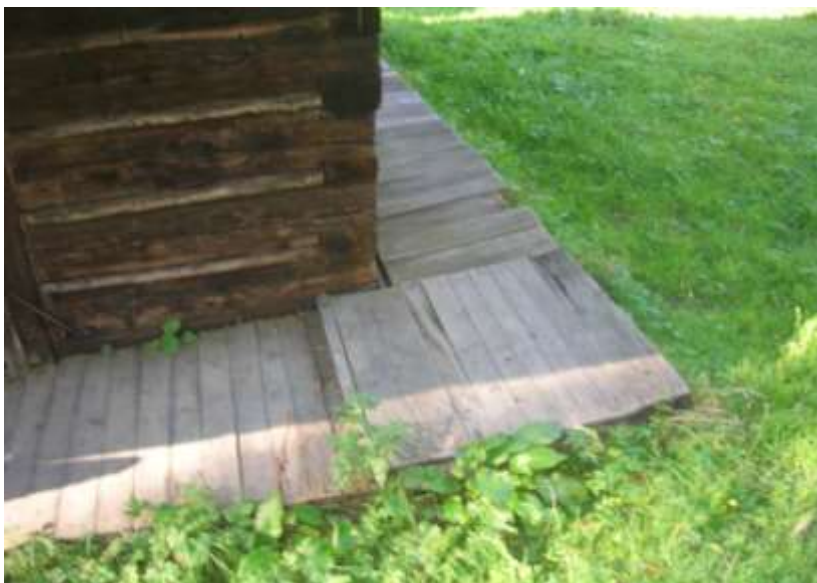
charakteristická úprava podsteny s drevenou doskovou podlahou – dom č.8