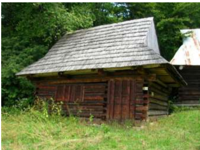
25 pôvodne hosp. objekt č.11, západná fasáda