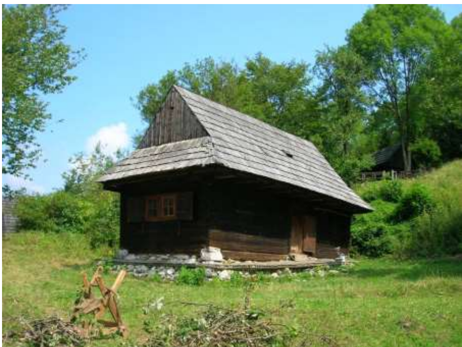
12 obytný dom č. 2, juhozápadná fasáda - objekt navrhovaný na zápis do ÚZPF