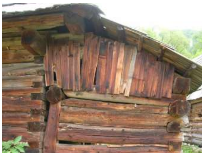
33 konštrukčný detail a úprava zrubovej steny