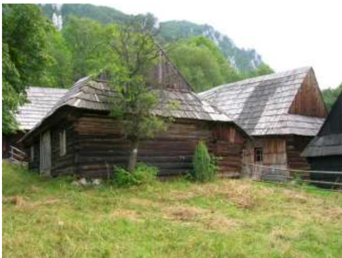
20 zástavba centrálnej časti sídla, obytné domy č. 7 a 5