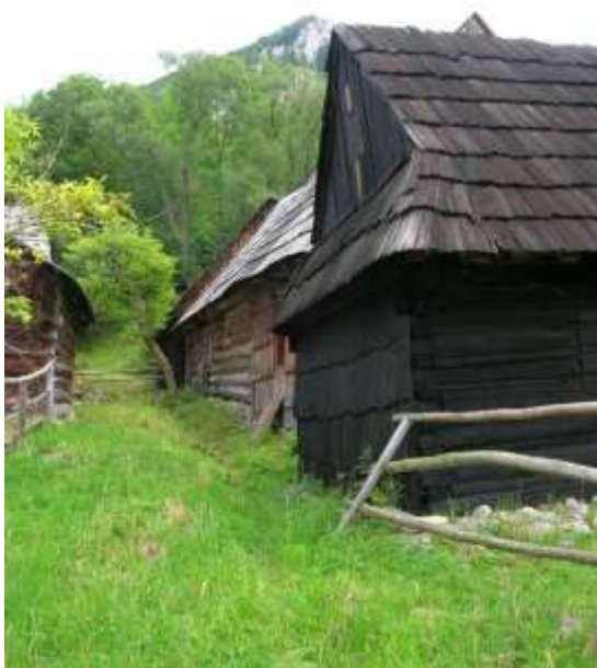
21 obytný dom č. 7 s komorou, centrálna časť zastavaného územia