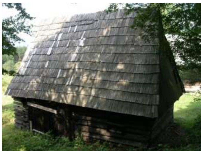
6 hosp. objekt č.1, pohľad na východnú fasádu