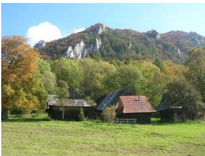
dialkový pohľadový uhol č. 2