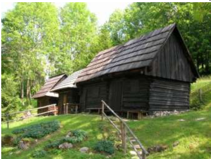
26 pôvodne hospodárske objekty č.14,13 a 12 južné fasády