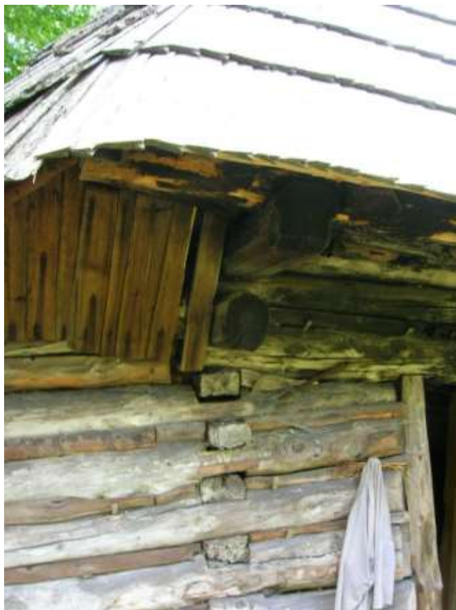
32 konštrukčný detail