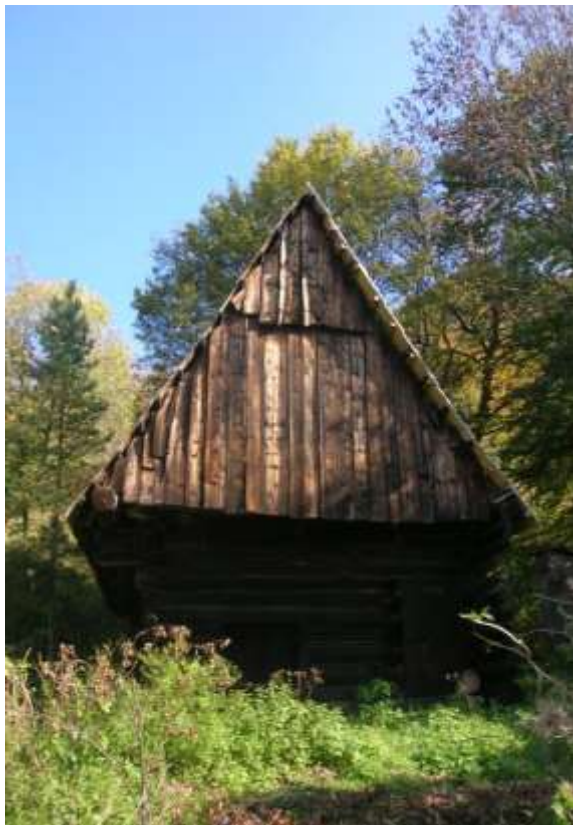
pôvodný hospodársky objekt na parcele č. KN 2370