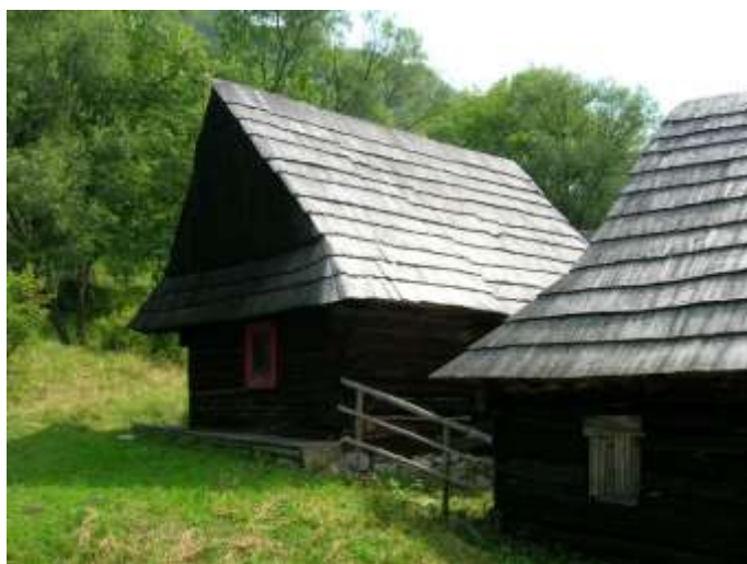
19 obytný dom č.8, západná fasáda