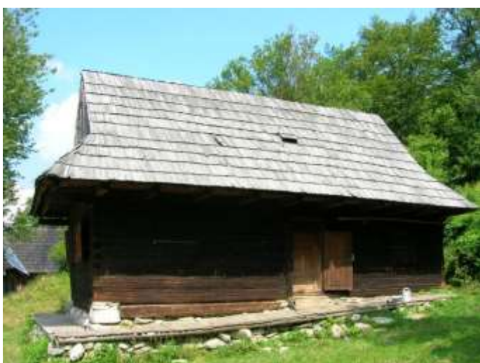
11 obytný dom č. 2, juhovýchodná fasáda