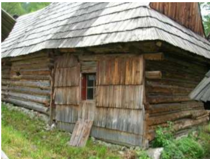
30 detail úpravy zrubovej steny domu č. 5