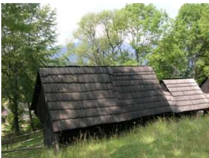
28 pôvodne hosp. objekt č. 14, sedlová strecha