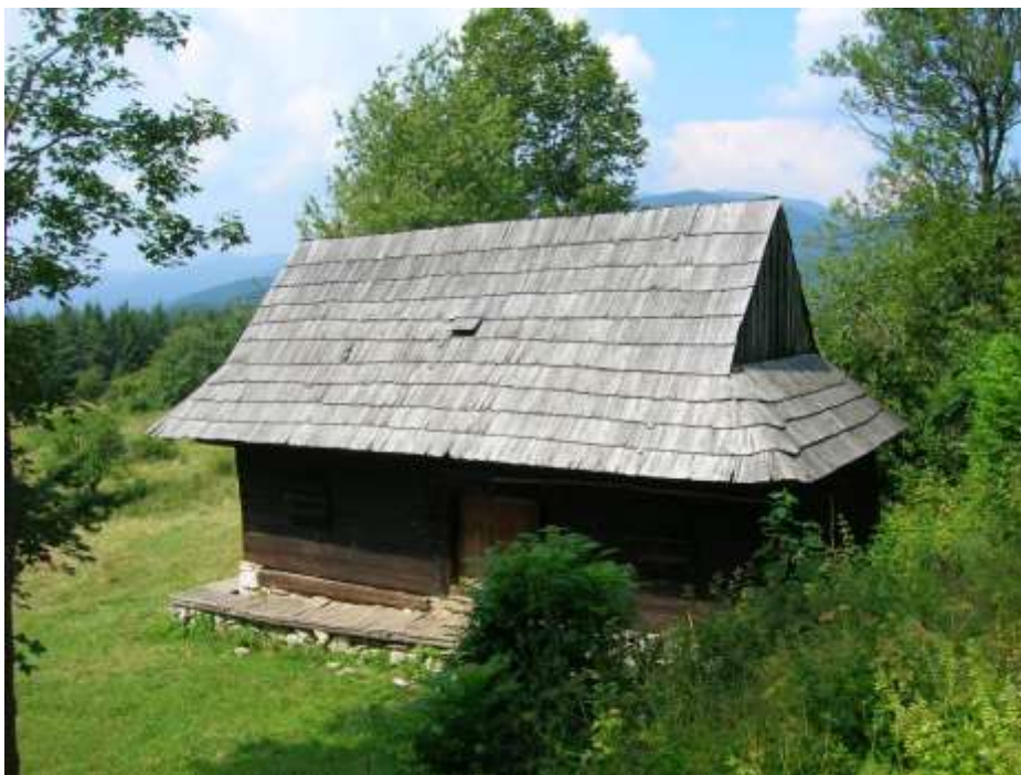
14 obytný dom č. 2, juhovýchodná fasáda