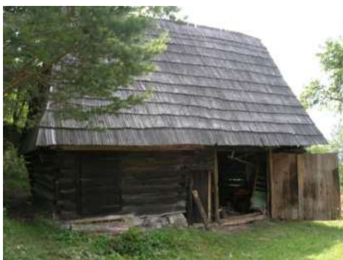
8 hosp. objekt č.1, severozápadná fasáda