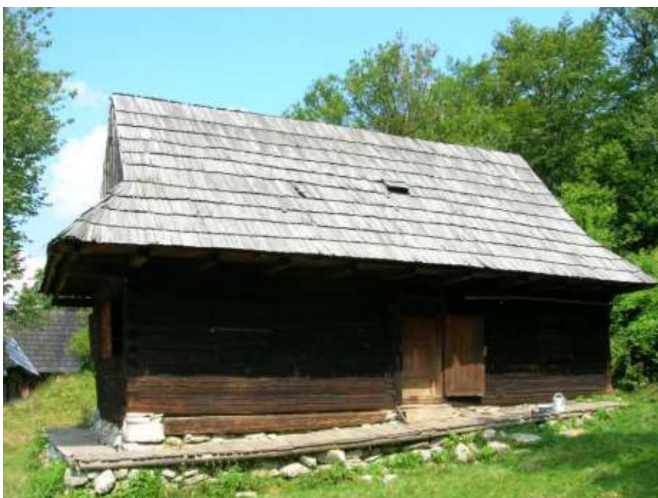
13 obytný dom č. 2, južná fasáda