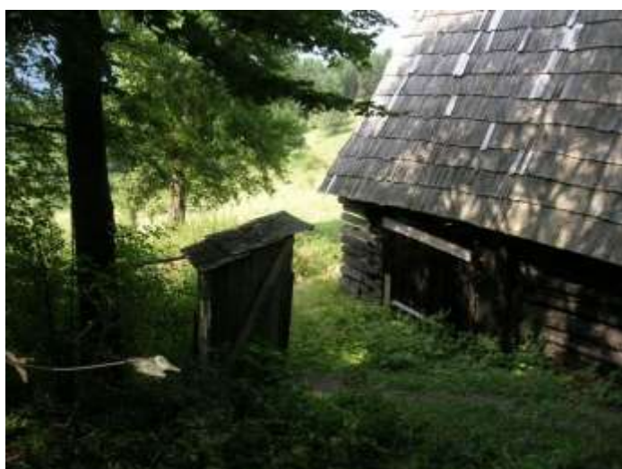
7 hosp. objekt č.1, pohľad juhovýchodná fasáda