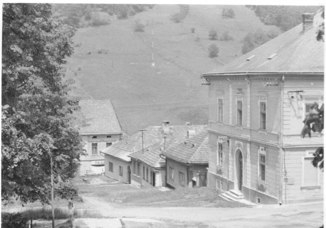
Námestie a časť Dolnej ulice, v prvej štvrtine 20. storočia