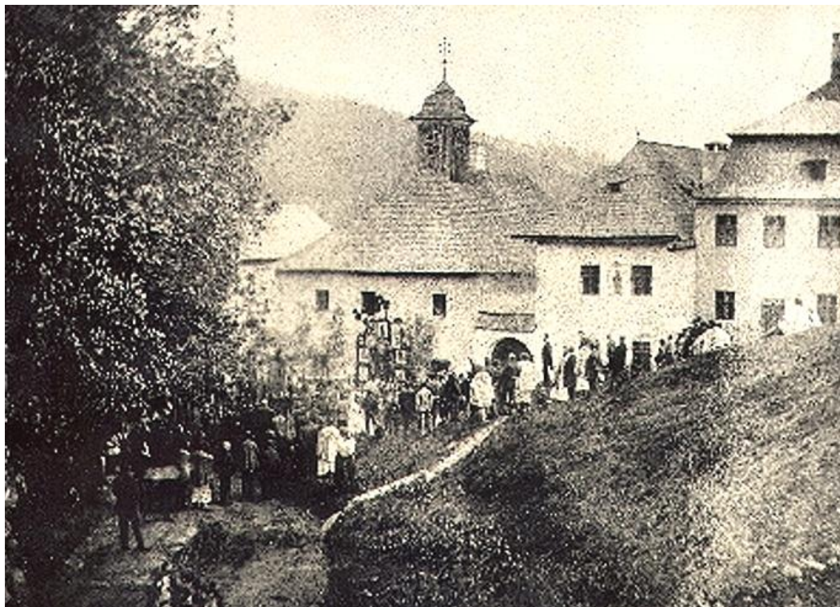
Sídlo pred požiarom v roku 1905, stará škola