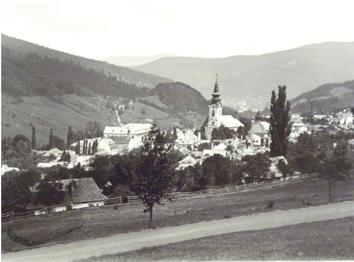
Diaľkový pohľad na sídlo pri príchode od Štósu pred rokom 1905