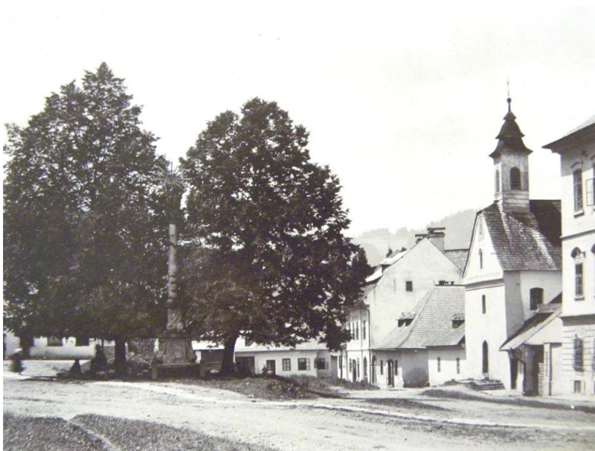
Námestie , pred požiarom v roku 1905