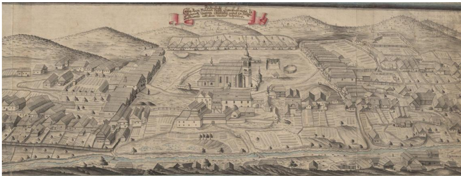
Sídlo na dobových obrazoch, kresba z roku 1748 na záhlaví banskej mapy