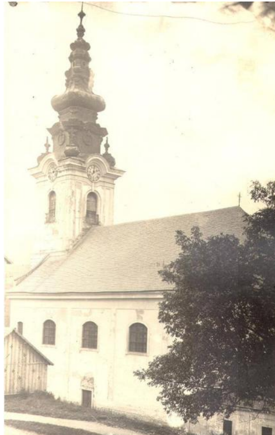
Sídlo pred požiarom v roku 1905, rímskokatolícky kostol