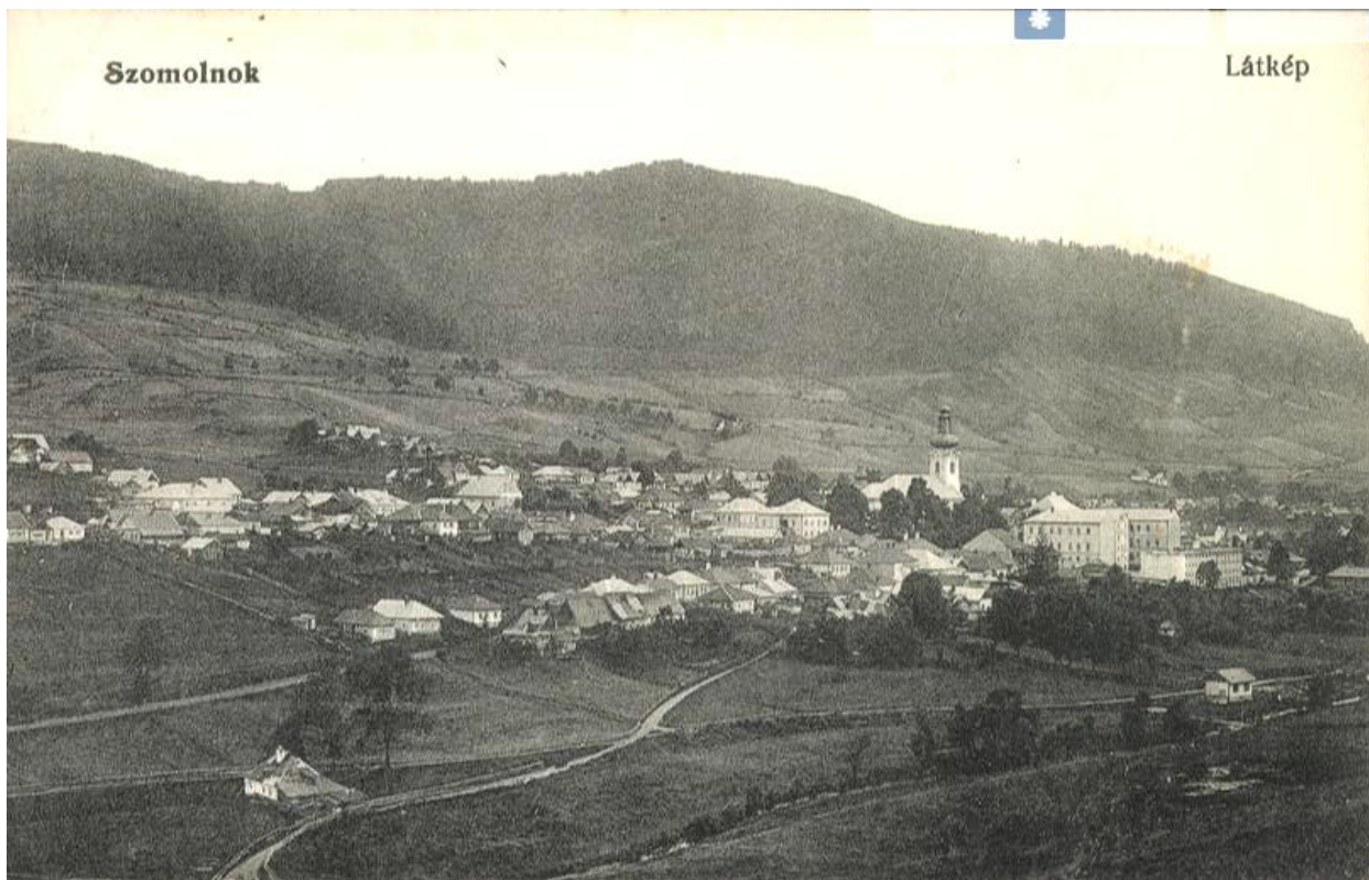
Diaľkový pohľad na sídlo od Rotenbergu z roku 1916