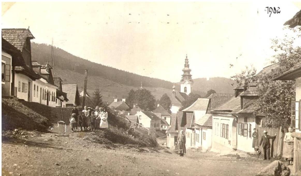
Banská ulica , v prvej štvrtine 20. storočia