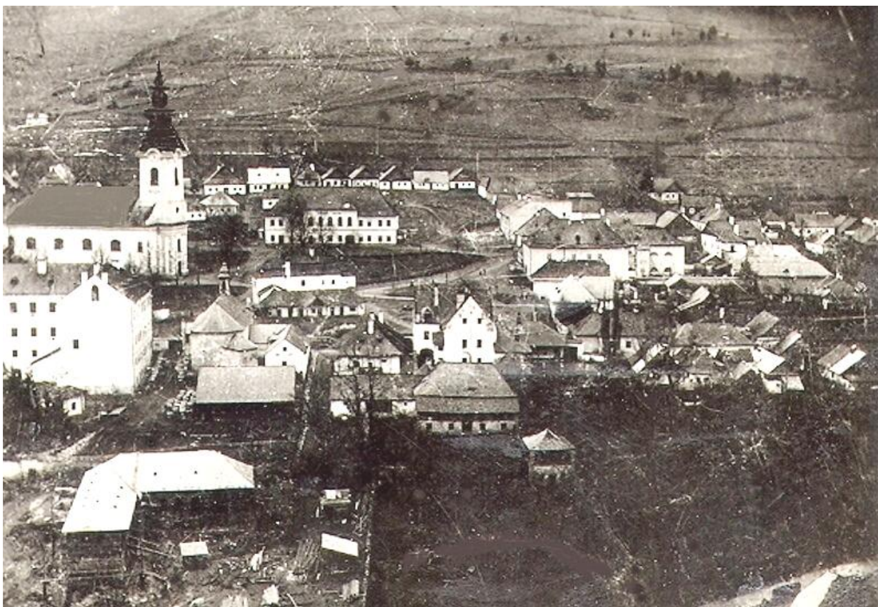
Sídlo pred požiarom v roku 1905, pohľad zo severu