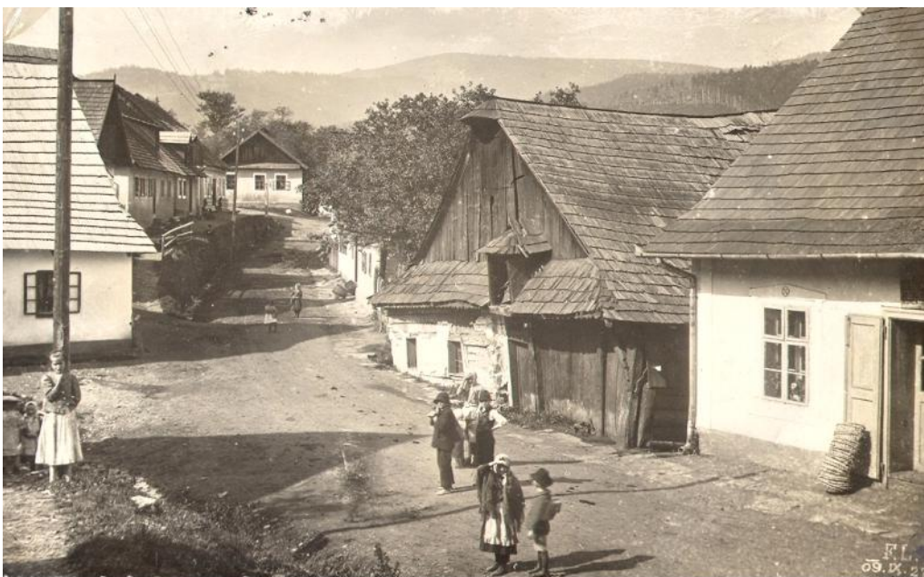
Rožňavská ulica, v prvej štvrtine 20. storočia