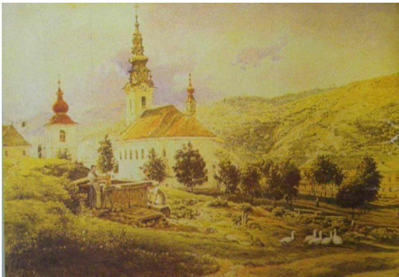
Sídlo na dobových obrazoch, olejomaľba námestia z roku 1840