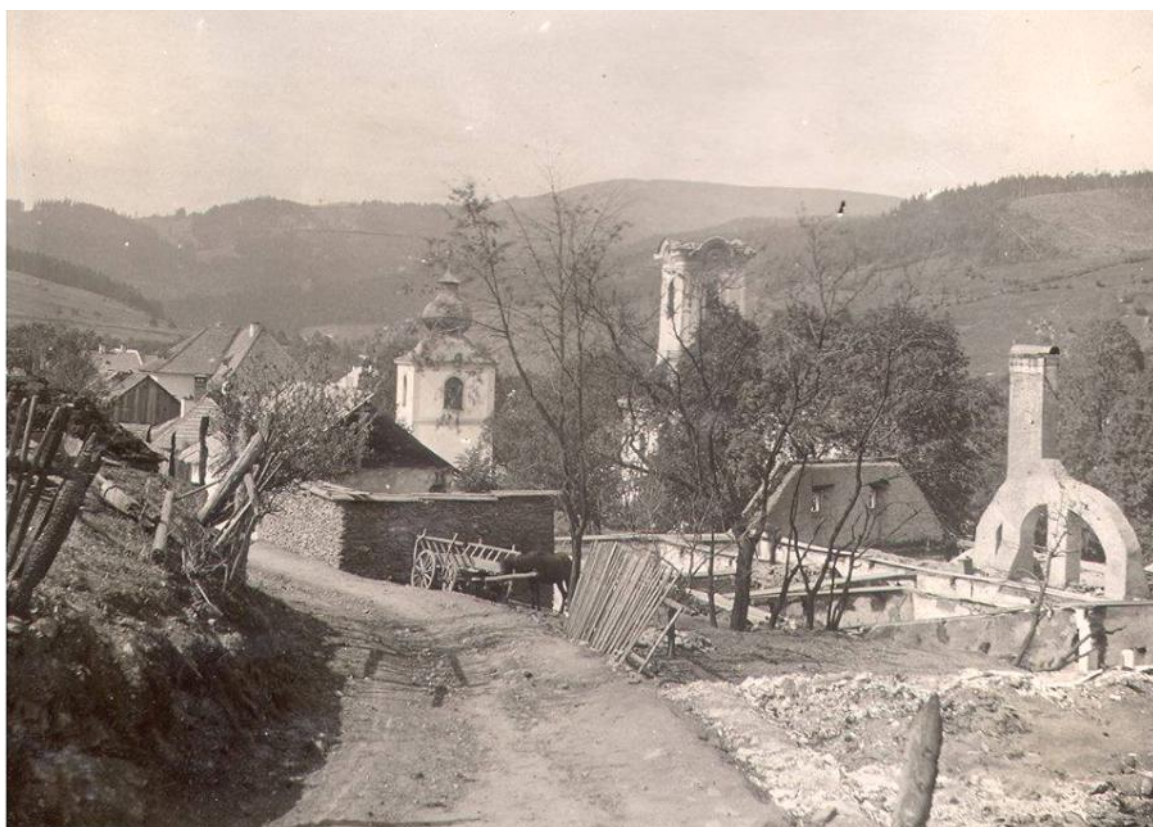
Požiar v roku 1905, hore budova Tabakovej továrne a kaplnky Sv. Ducha, Dole pohľad na kostol od Štóskeho mýta