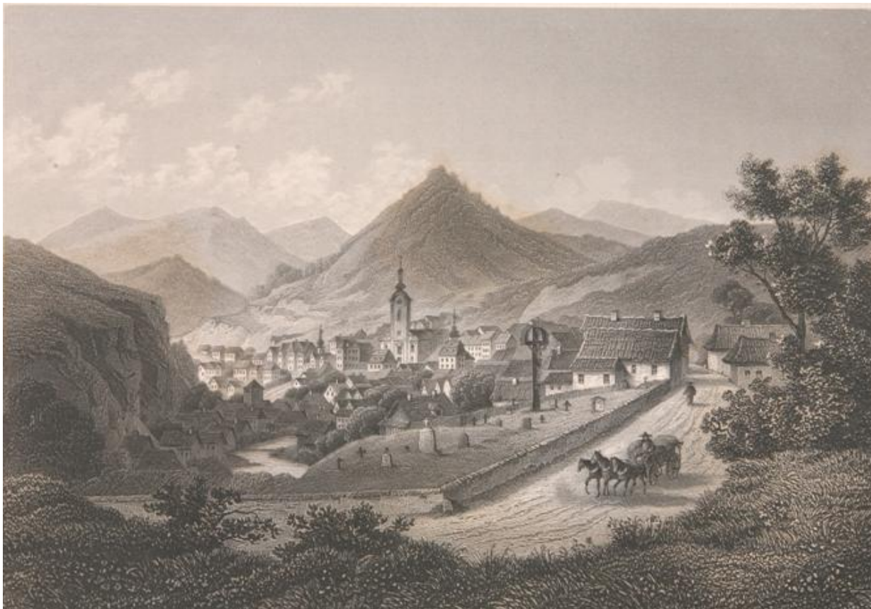
Sídlo na dobových obrazoch— rytina z roku 1845