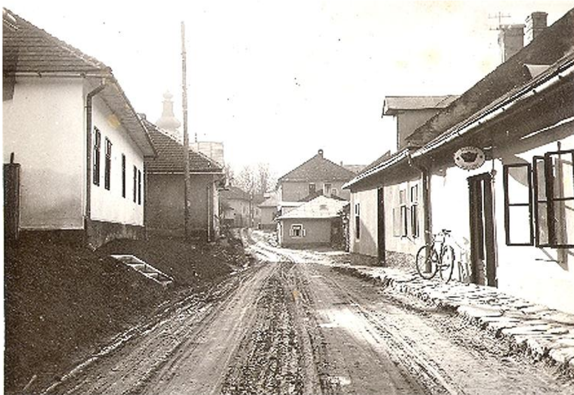
Dolná ulica , v prvej štvrtine 20. storočia