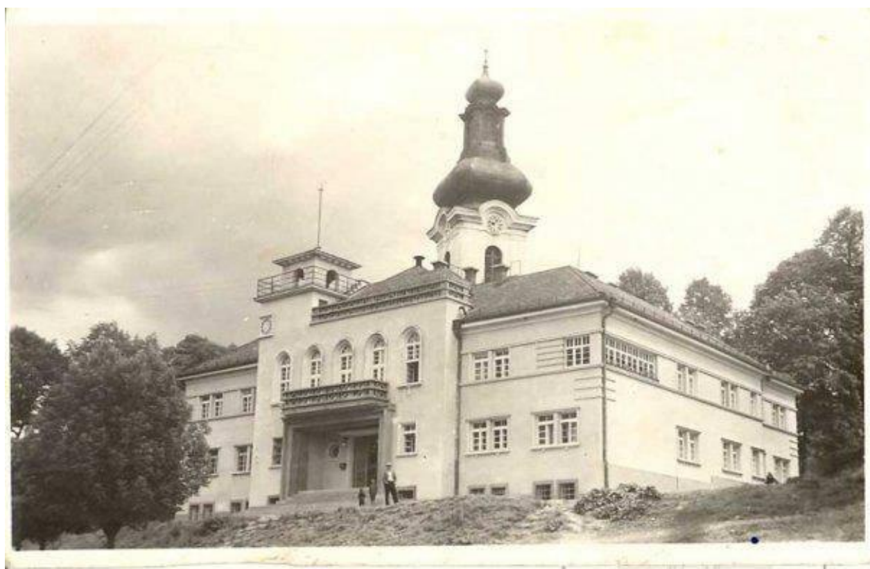
Radnica pred prestavbou a po prestavbe v roku 1930