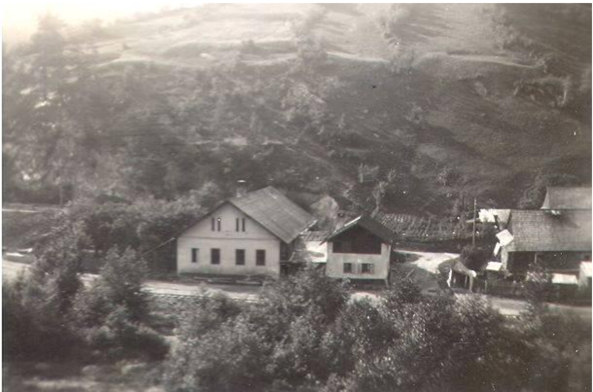
Predmestie v 1. štvrtine 20. storočia