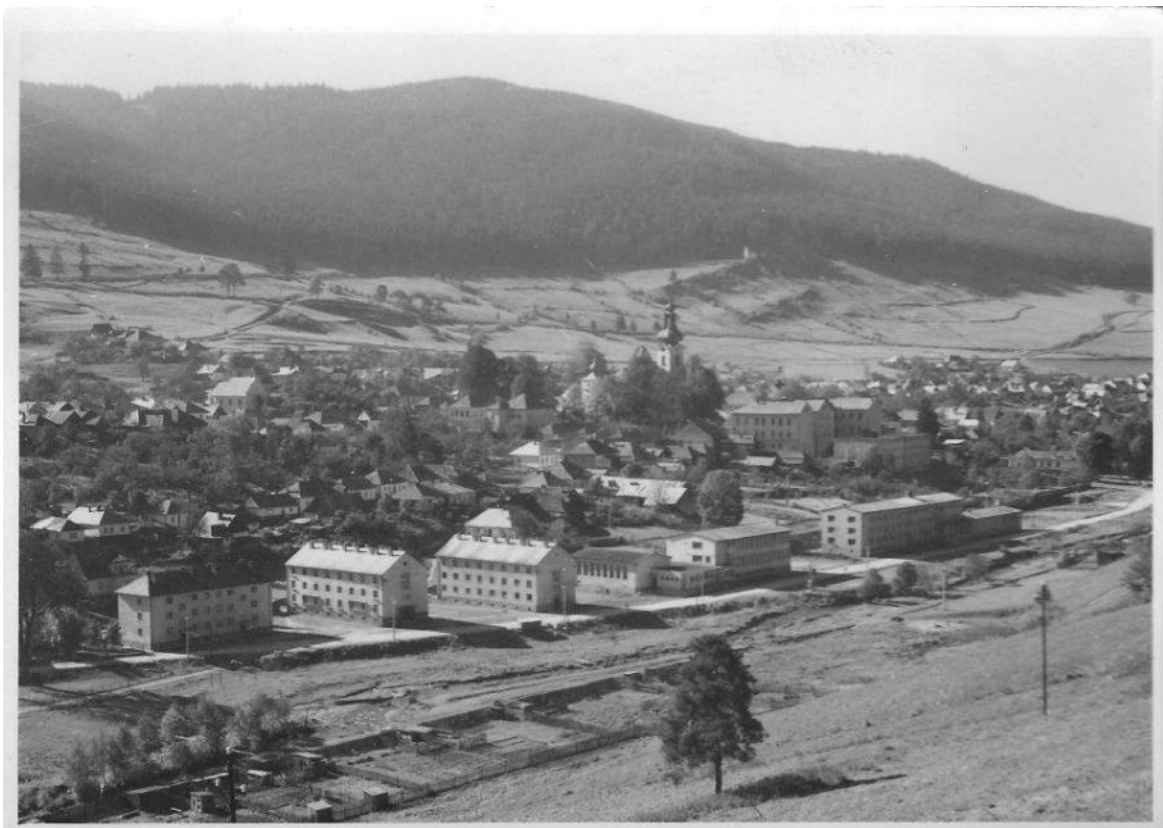
Dostavba sídla v polovici 20. storočia