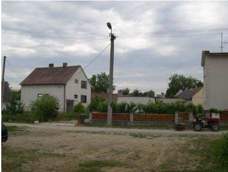
3. Rušivú zástavbu na južnej strane centrálneho priestranstva PZ - pohľad od severu.