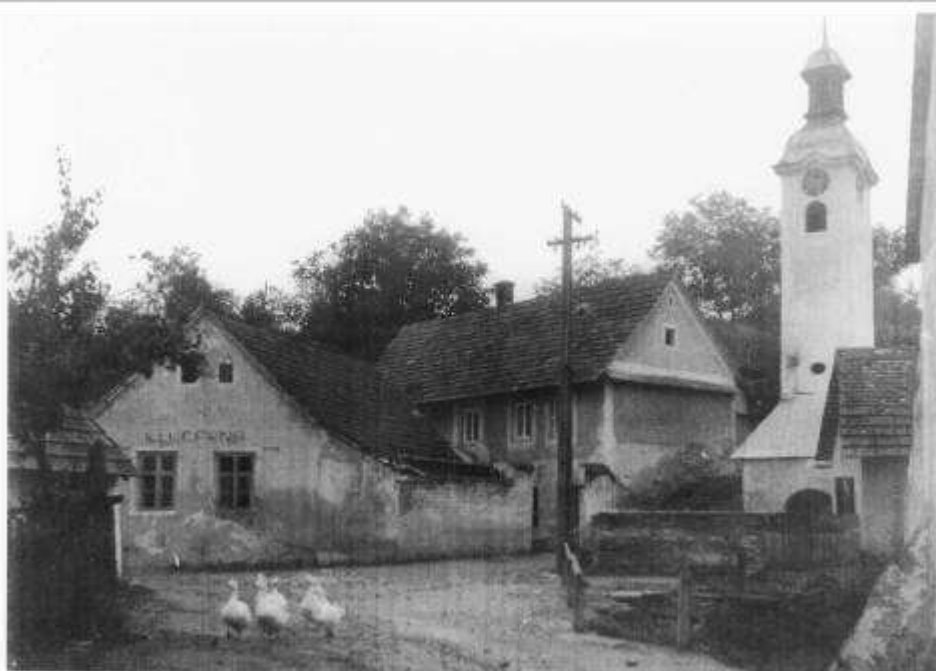
60. Pohľad na zástavbu v západnej časti centrálneho priestranstva. (r. 1958)