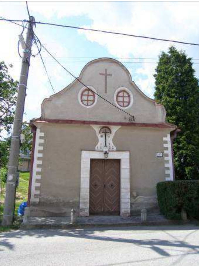
51. Východná fasáda kaplnky (objekt vytypovaný na vyhlásenie za NKP) na západnej strane hlavnej cestnej komunikácie – pohľad od východu.