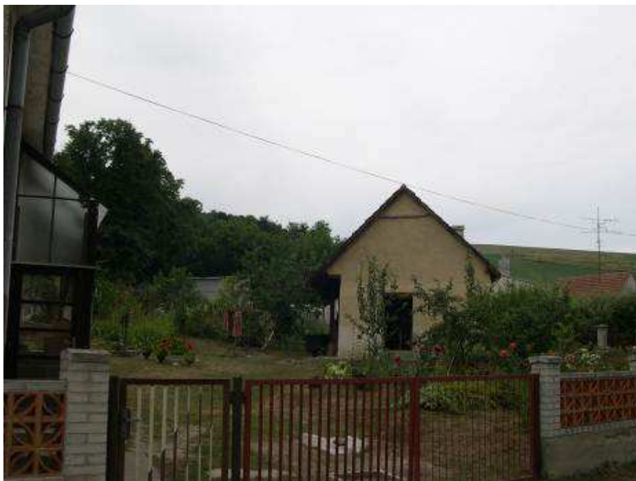
47. Rezervná plocha pred pozostatkom pôvodného ľudového domu pri dome súp. č. 411 – pohľad od východu.