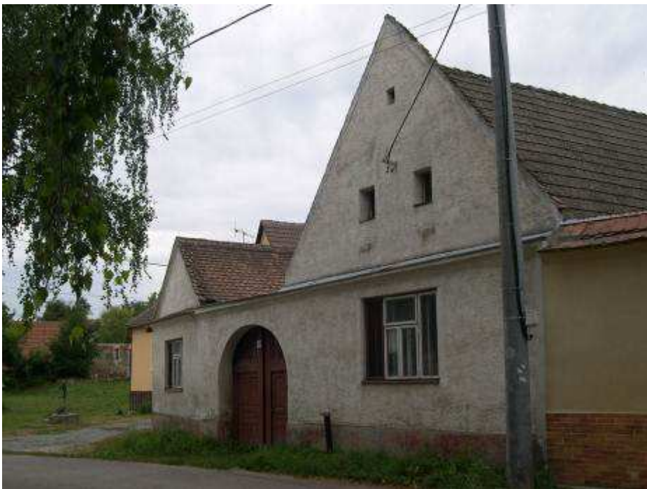
28. Dom súp č. 397 na západnej strane hlavnej cestnej komunikácie – pohľad od severovýchodu.