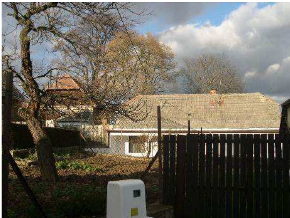
44. Dom súp č. 494 pri severnej hranici PZ – pohľad od juhu.