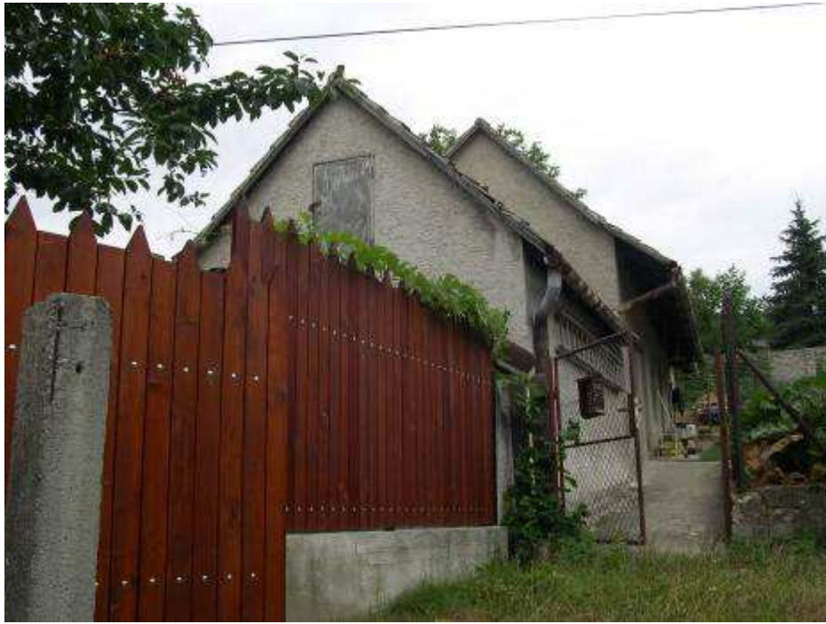
59. Hospodárske objekty medzi domami súp. č. 401 a 683 – pohľad od severovýchodu.