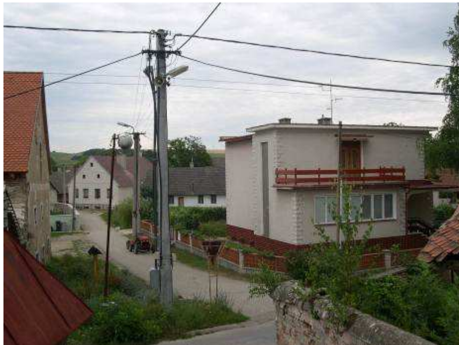
2. Zástavba rušivými objektmi, v popredí dom súp. č. 502 – pohľad od západu.