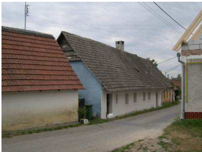
25. Objekty so súp. č. 484, 483 a 482 na východnej strane hlavnej cestnej komunikácie – pohľad od severozápadu.