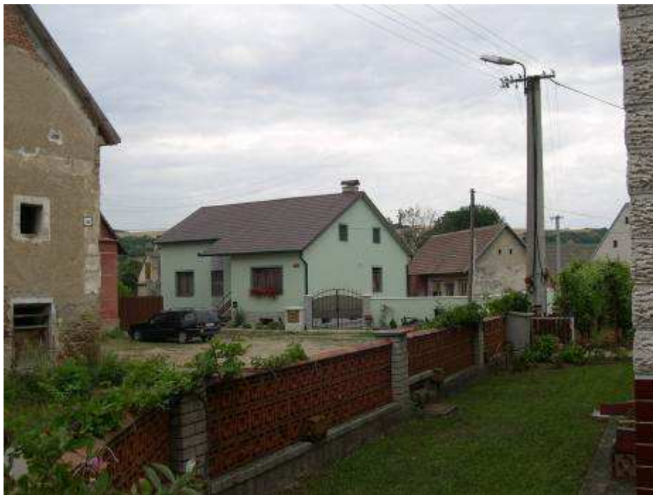
20. Časť malého námestia pred „Radnicou“ s rušivým objektom rodinného domu súp. č. 492 – pohľad od juhozápadu.