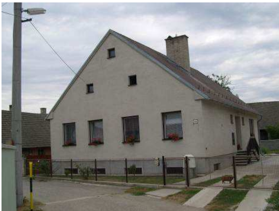
38. Rušivý rodinný dom súp. č. 500 – pohľad od západu.