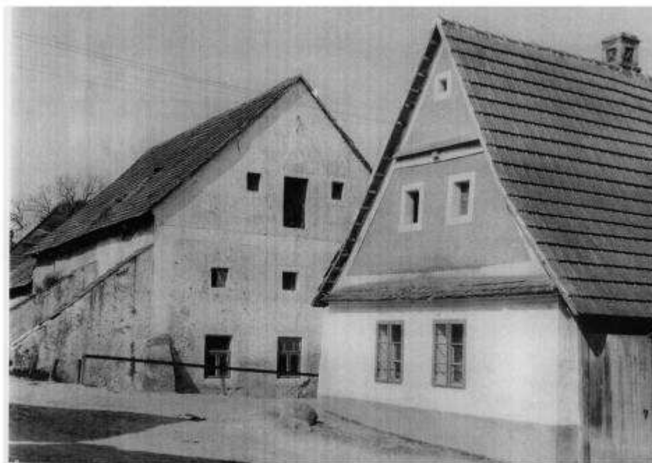
61. Pohľad na mlyn a habánsky dom na mieste súčasného rodinného domu súp. č. 502. (r. 1959)