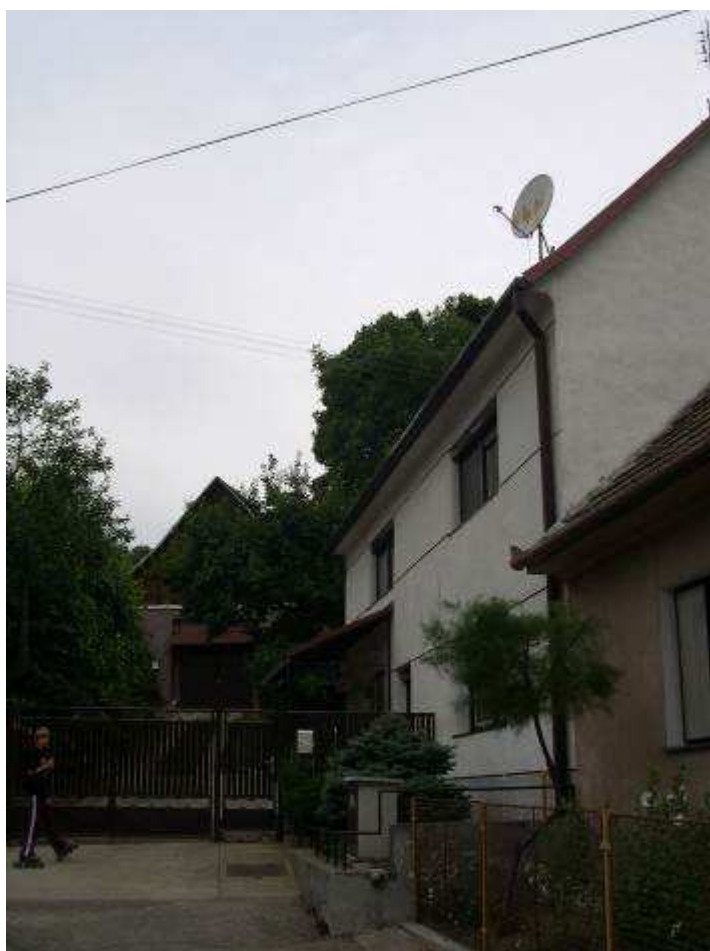
50. Dom súp. č. 409 západne od objektu pôvodnej habánskej školy – pohľad od západu.