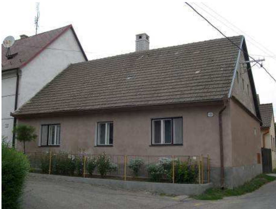
49. Dom súp. č. 410 pôvodne habánska škola na západnej strane hlavnej cestnej komunikácie - pohľad od juhozápadu.