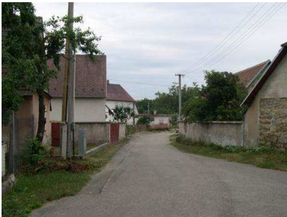
11. Pohľad od habánskych stodôl vo východnej časti PZ na uličku vedúcu z námestíčka pred tzv. habánskou radnicou.