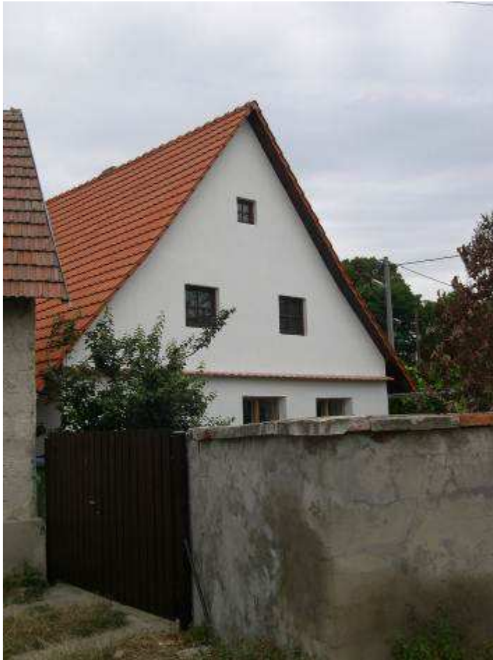
41. Východná fasáda domu súp. č. 493, oproti domu súp. č. 499 – pohľad od juhovýchodu.