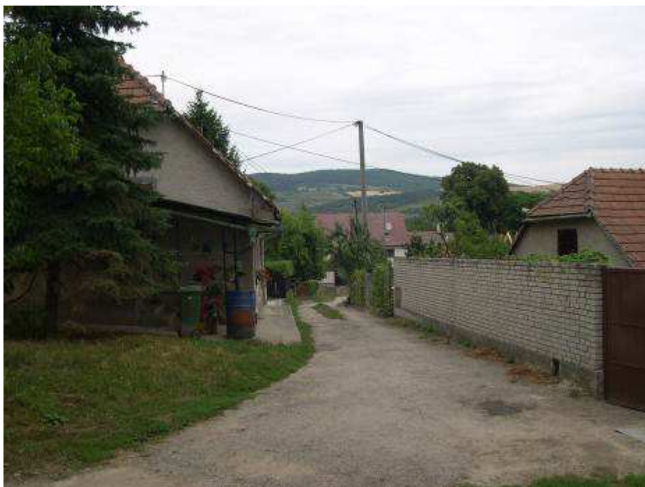
8. Zástavba pozdĺž cesty stúpajúcej juhozápadne od kaplnky – pohľad od juhozápadu.