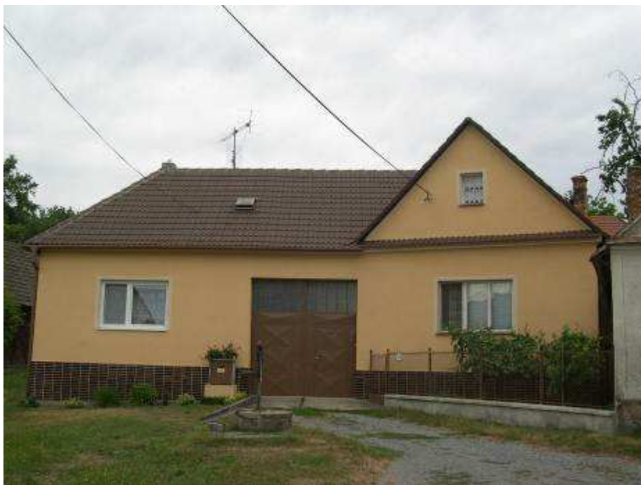
29. Dom súp č. 396 na západnej strane hlavnej cestnej komunikácie – pohľad od východu.