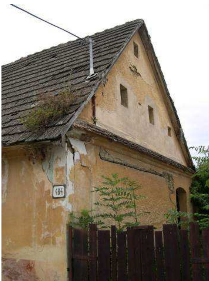
26. Južná fasáda domu súp. č. 484 – pohľad od juhozápadu.