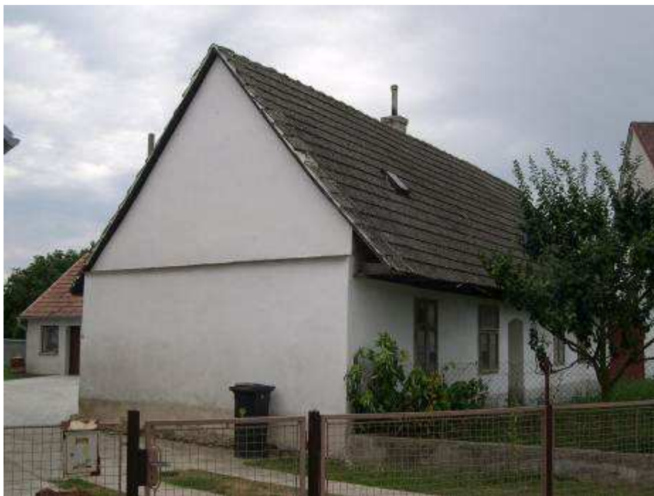
39. Dom ľudový bez súp. č. nachádzajúci sa medzi rušivými domami súp. č. 500 a 501 – pohľad od severu.