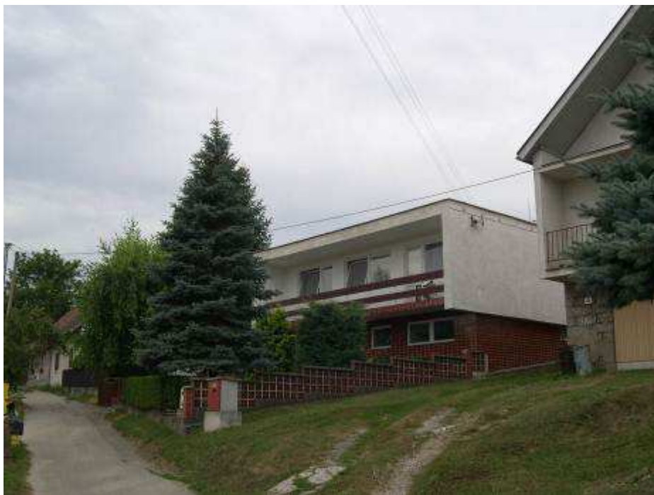
55. Rušivý dom súp. č. 407 na západnej strane uličky stúpajúcej od kaplnky na juhozápad – pohľad od severozápadu.