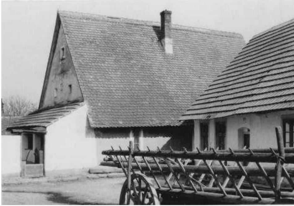
68. Habánsky dom súp. č. 395 – pohľad od západu (r. 1959)