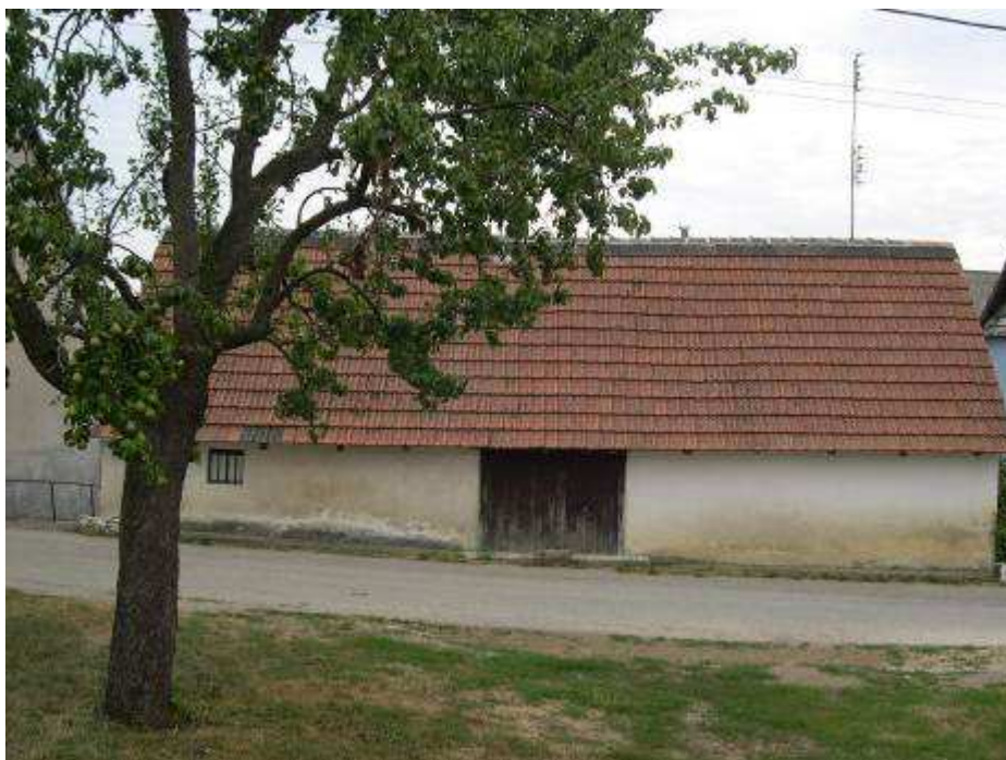
24. Hospodársky objekt pri hlavnej cestnej komunikácii medzi domami súp. č. 481 a 482, oproti kaplnke – pohľad od západu.