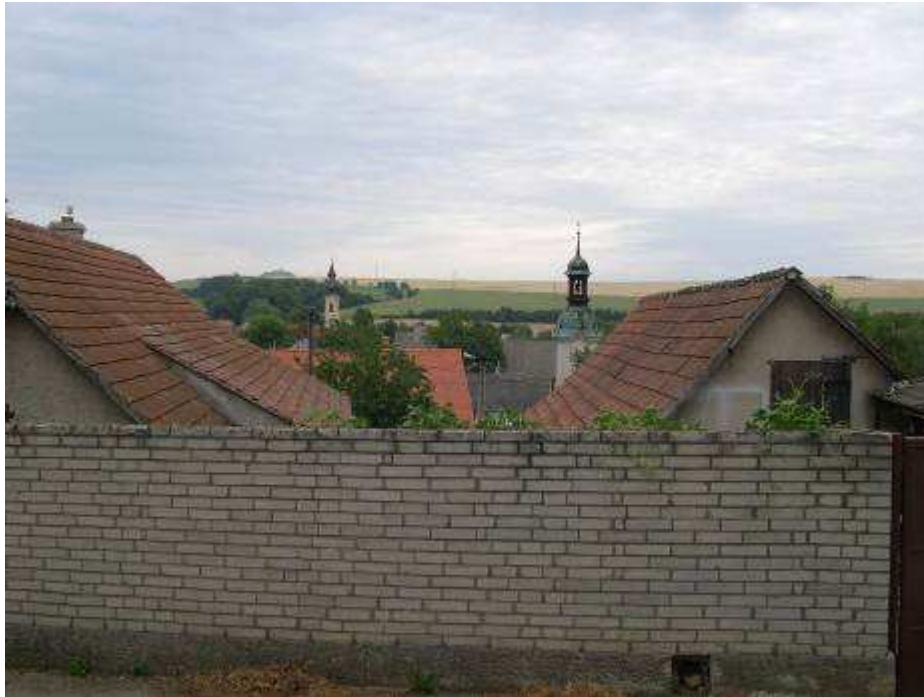
9. Pohľad zo západného okraja PZ na jej centrálnu časť obcou v pozadí.