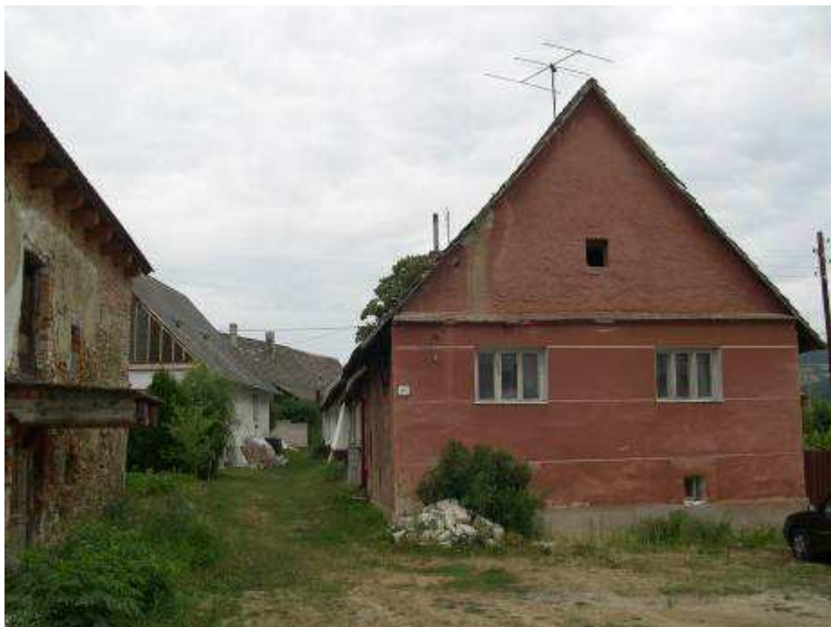
16. Dom súp. č. 491 tzv. „Habánska radnica“ s úzkou prechodnou uličkou po ľavej strane – pohľad od juhu.