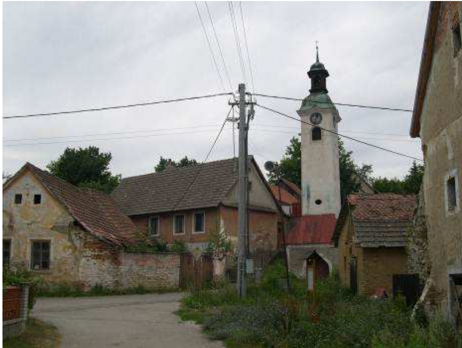
1. Pohľad na zástavbu v západnej časti centrálneho priestranstva PZ.