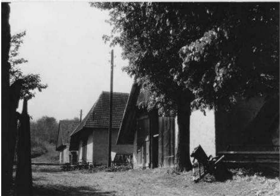
69. Rad stodôl za severnou hranicou pamiatkovej zóny (r. 1959, foto: Jursa)