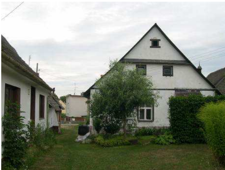
21. Dom súp. č. 487 so spojovacou uličkou medzi mlynom a „Radnicou“ – pohľad od severu.