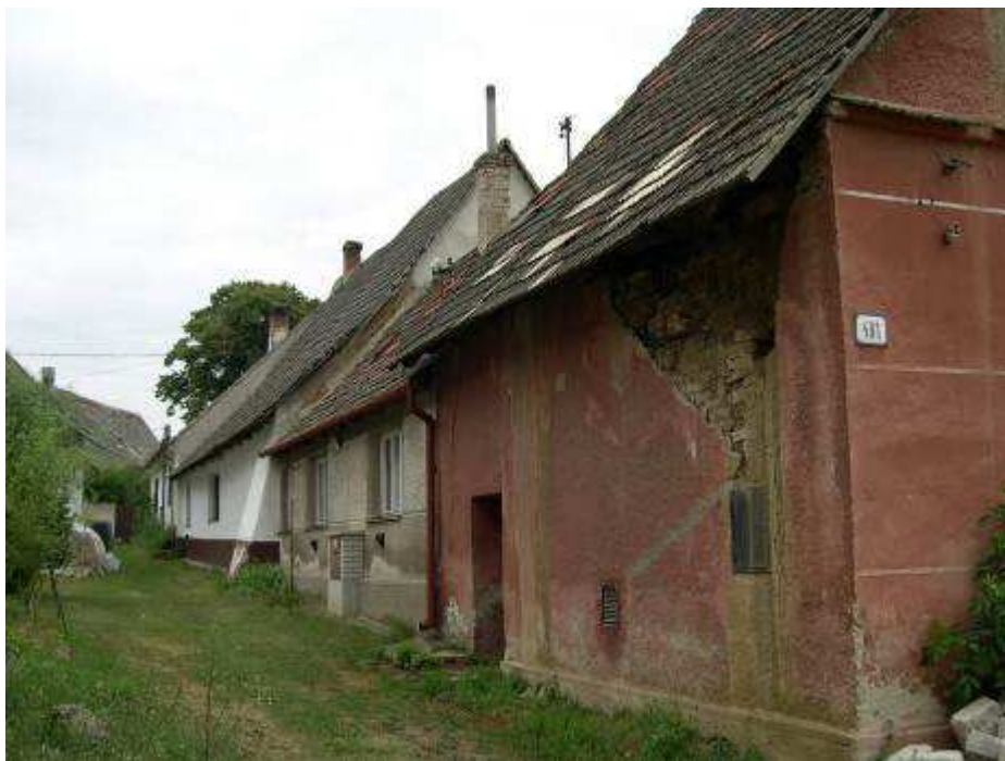
17. Západná fasáda „Radnice“ so zástavbou habánskych domov na sever od nej.