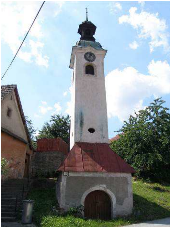
19. Pohľad na zvonicu (NKP č. ÚZPF 746/0) od východu.