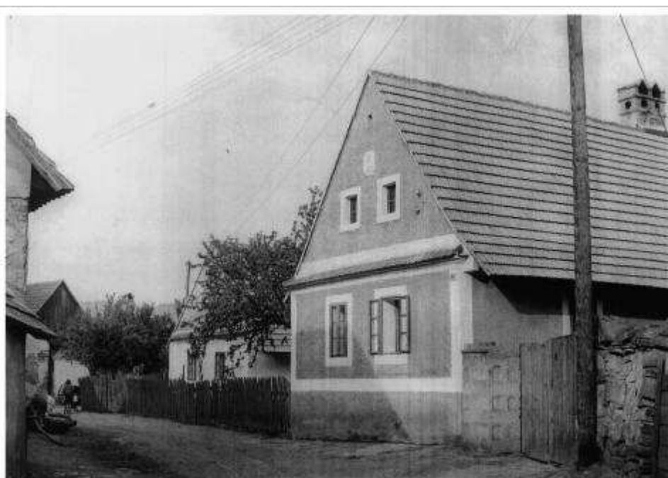
67. Pôvodný ľudový dom, na mieste ktorého v súčasnosti stojí rodinný dom súp. č. 500 (r. 1958)