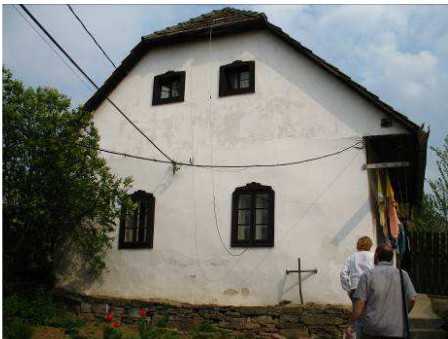
18. Dom súp. č. 485 (NKP č. ÚZPF 2224/0) – pohľad od juhu