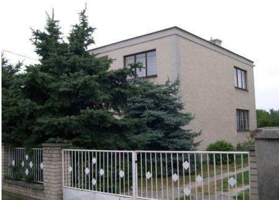
42. Rušivý rodinný dom súp. č. 496 západne od habánskych stodôl – pohľad od juhovýchodu.