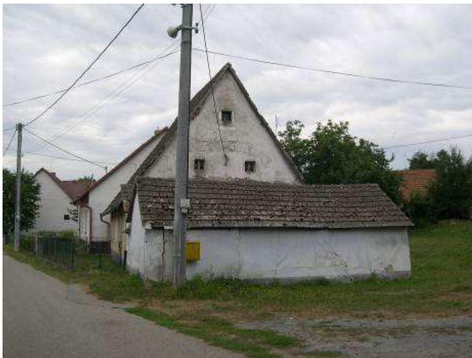
31. Dom súp. č. 395 (vytypovaný na vyhlásenie za NKP) na západnej strane hlavnej cestnej komunikácie – pohľad od severu.