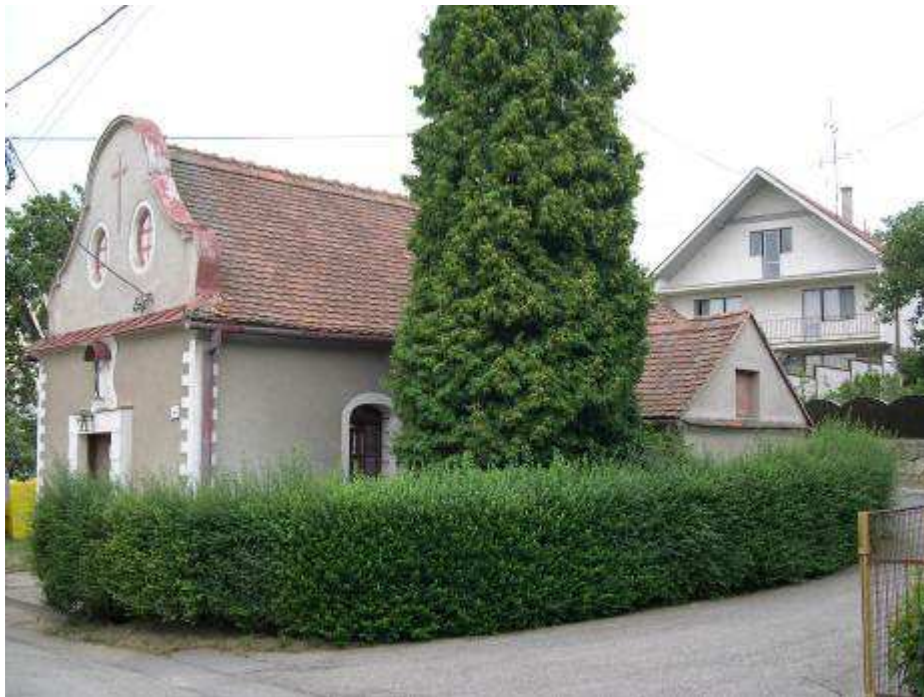
52. Kaplnka na rohu hlavnej cestnej komunikácie a ulice stúpajúcej smerom na juhozápad, s rušivým rodinným domom súp. č. 408 – pohľad od severovýchodu.