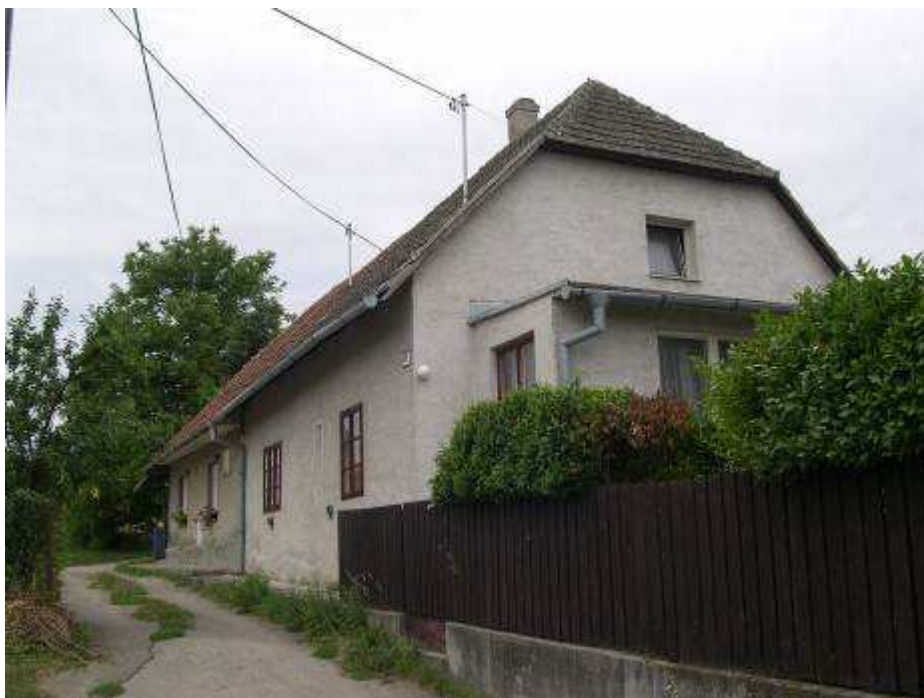
56. Domy súp. č. 406 a 405 na konci uličky stúpajúcej od kaplnky, pri západnej hranici PZ – pohľad od severovýchodu.