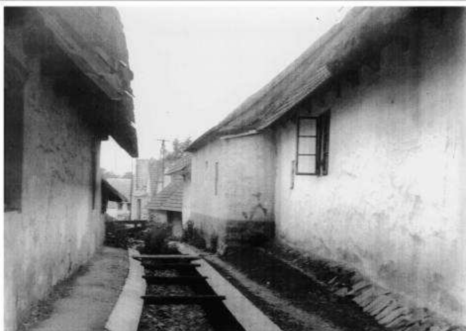
66. Mlynský náhon pri habánskych domoch súp. č. 482, 483 a 487 – pohľad od severu (r. 1957)