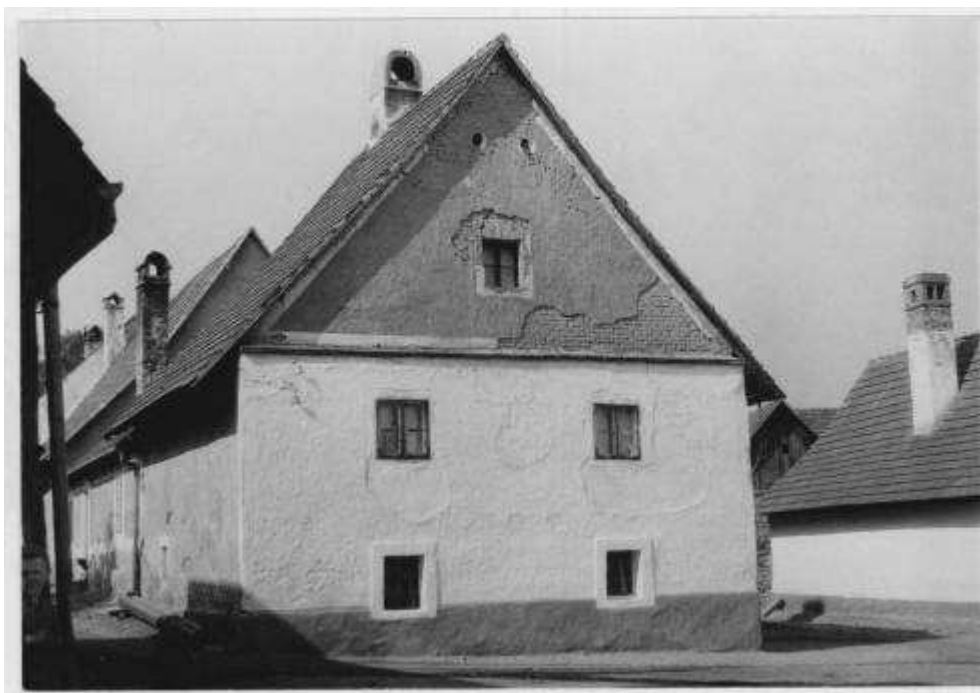
63. Dom súp. č. 491, tzv. „Habánska radnica“ – pohľad od juhu. (r. 1959)