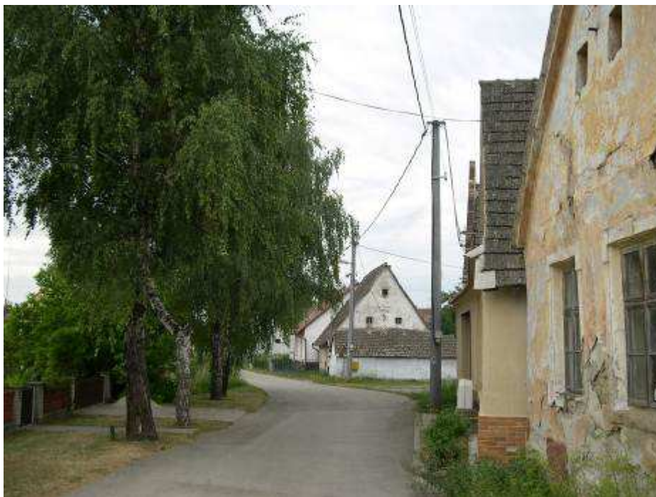
5. Zástavba hlavnej cestnej komunikácie južne od centrálneho priestranstva PZ – pohľad od severu.