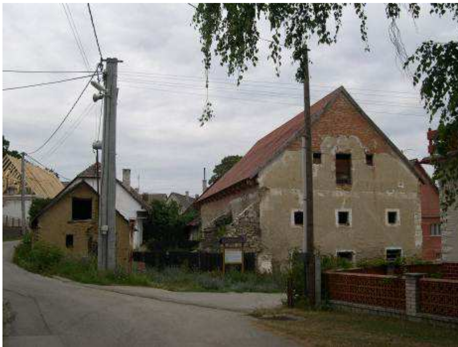
15. Pohľad na mlyn (NKP č. ÚZPF 747/0) od juhu.