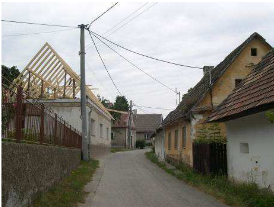
4. Zástavba hlavnej cestnej komunikácie severne od centrálneho priestranstva PZ – pohľad od juhu.