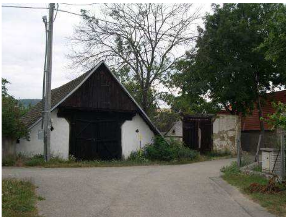
36. Uličné fasády habánskych stodôl NKP č. ÚZPF 2225/0 a 2226/0) pri dome súp. č. 497 – pohľad od juhu.