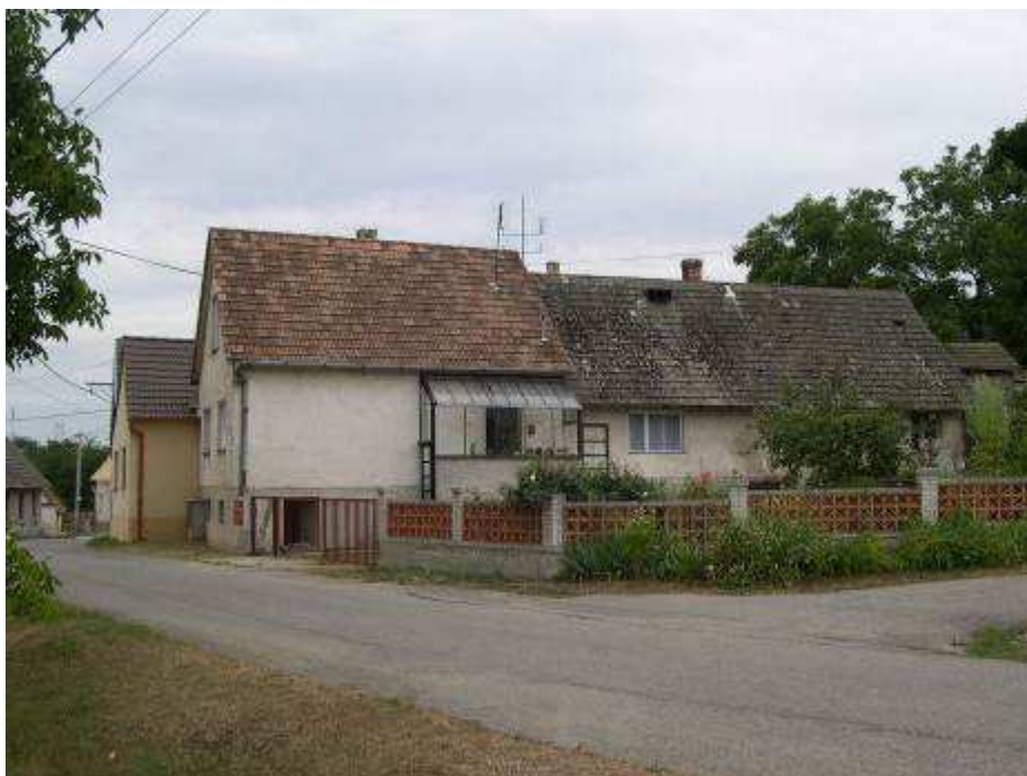
48. Dom súp. č. 411 pri vjazde do územia PZ, na západnej strane hlavnej cestnej komunikácie – pohľad od severu.