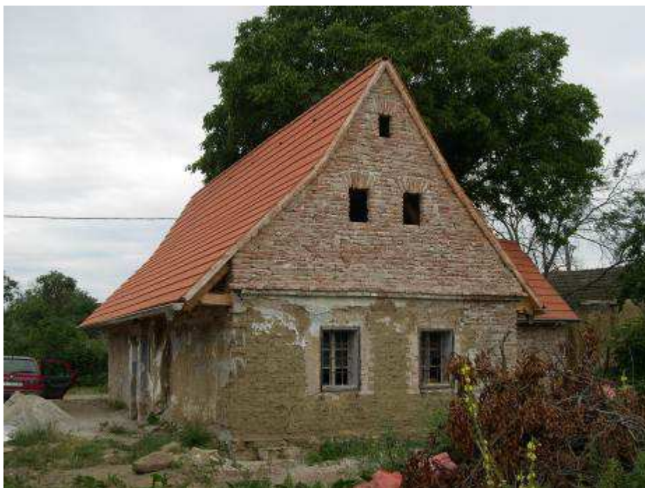
35. Dom súp. č. 497 (NKP č. ÚZPF 2222/0) na východnej hranici PZ – pohľad od severu.