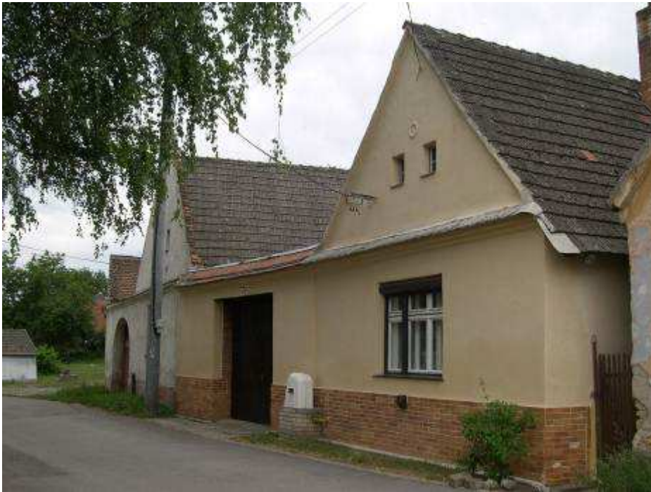
27. Dom súp č. 398 na západnej strane hlavnej cestnej komunikácie – pohľad od severovýchodu.