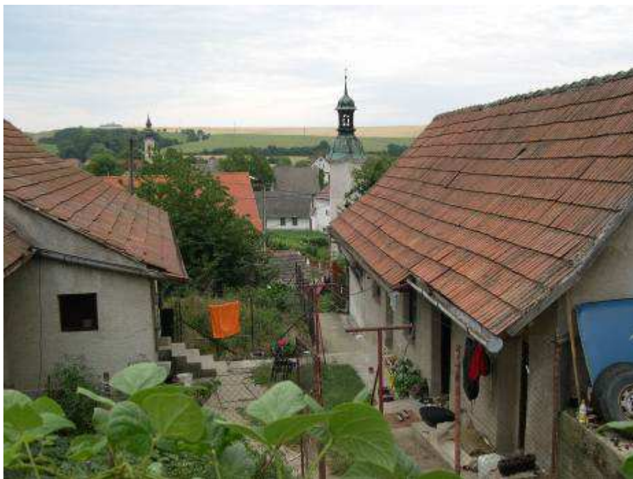
57. Dvor domu súp. č. 401 a hospodársky objekt, s centrálnou časťou PZ v pozadí – pohľad od západu.