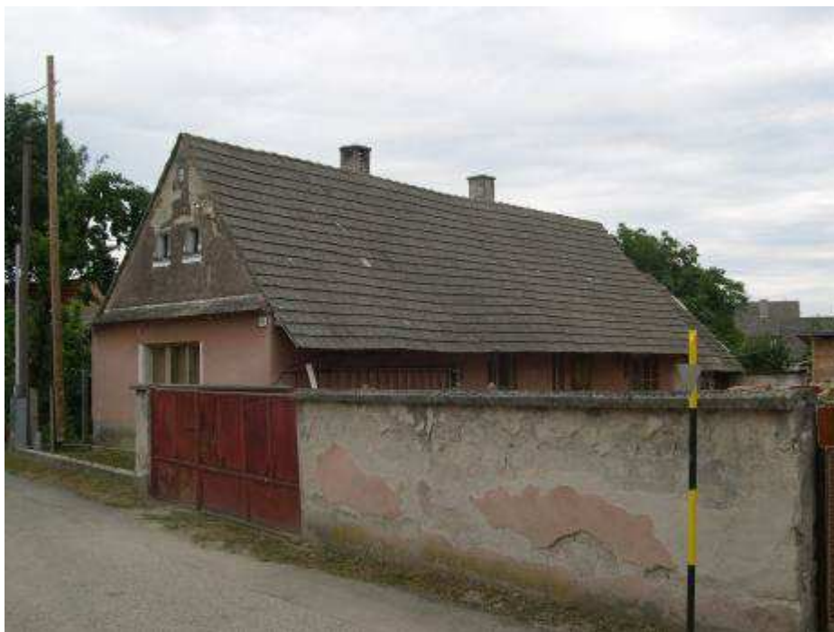
37. Dom súp. č. 499 pri východnej hranici PZ – pohľad od juhozápadu.