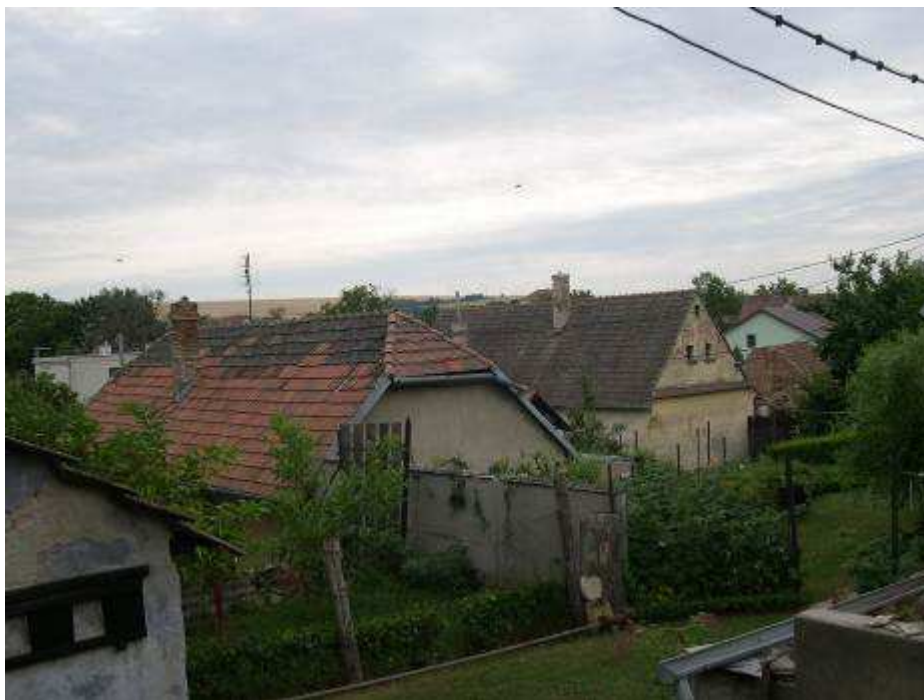
45. Zástavba severne od centrálnej časti PZ, v popredí domy súp č. 494 a 495 – pohľad od severozápadu.