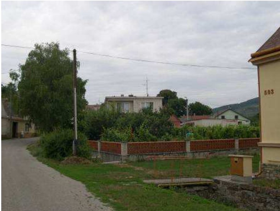
13. Voľná plocha v južnej časti PZ medzi domami súp. č. 502 a 503 – pohľad od juhu.