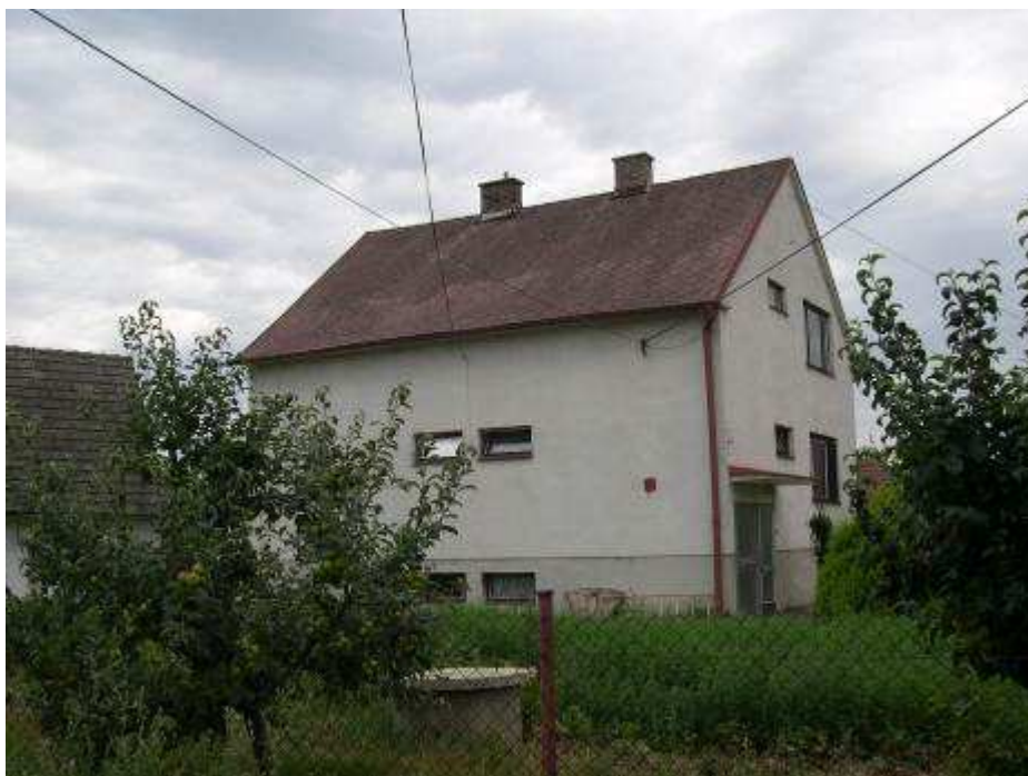
40. Rušivý rodinný dom súp. č. 501 juhovýchodne od malého námestia pred „Radnicou“ – pohľad od severu.