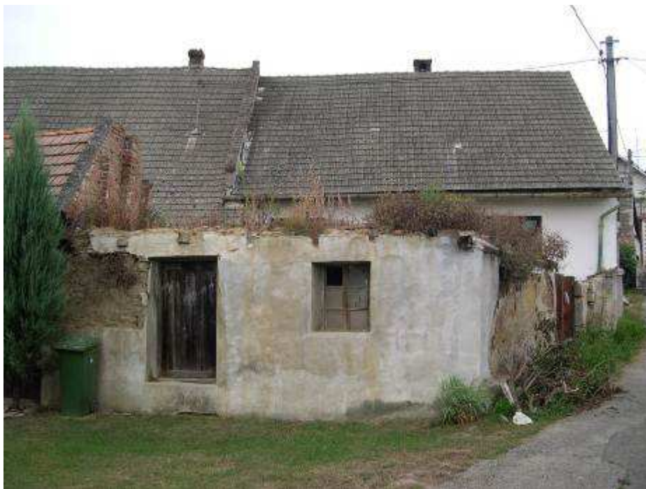
23. Zničený hospodársky objekt pri dome súp. č. 488 – pohľad od východu.