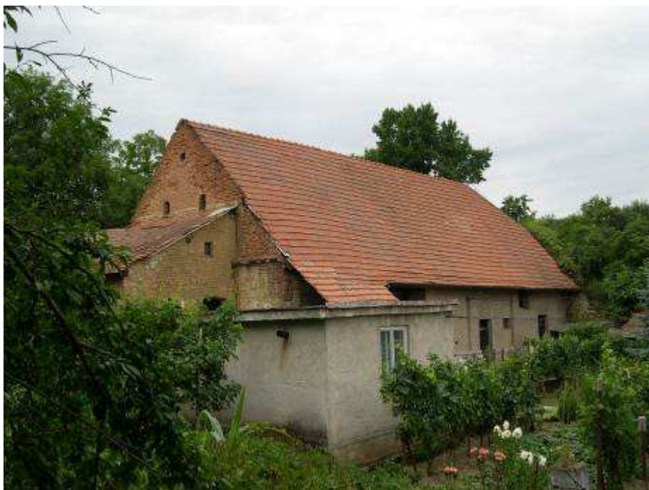
30. Stodola s maštaľou za domom súp. č. 396 – pohľad od juhovýchodu.