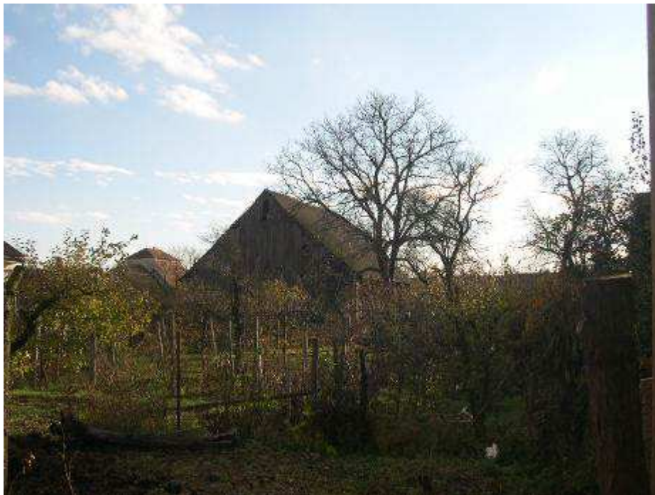
14. Záhrady medzi radovou zástavbou obce a východnou časťou PZ - pohľad od severozápadu.