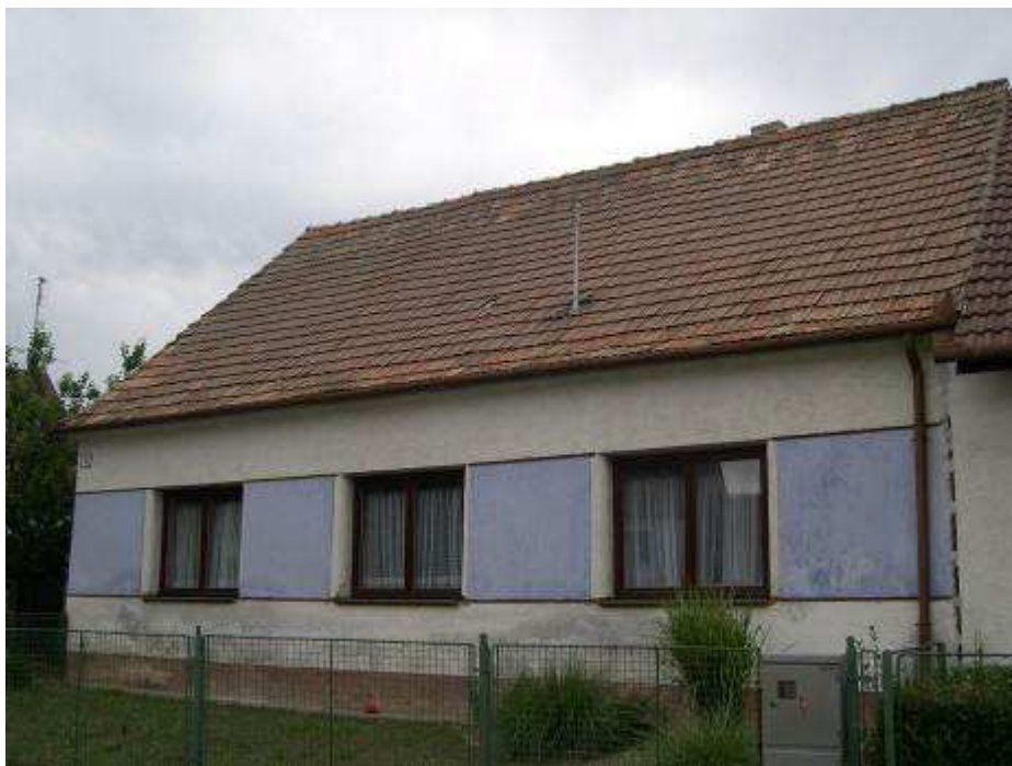
33. Dom súp. č. 393 na západnej strane hlavnej cestnej komunikácie – pohľad od severovýchodu.