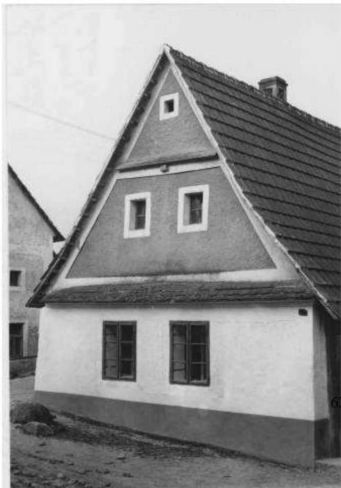
62. Habánsky dom č. 94 , na mieste ktorého stojí v súčasnosti rodinný dom súp. č. 500. (r. 1958)