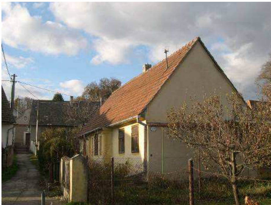
43. Dom súp. č. 495. na severnej strane uličky vedúcej na východ od kaplnky - pohľad od juhovýchodu.