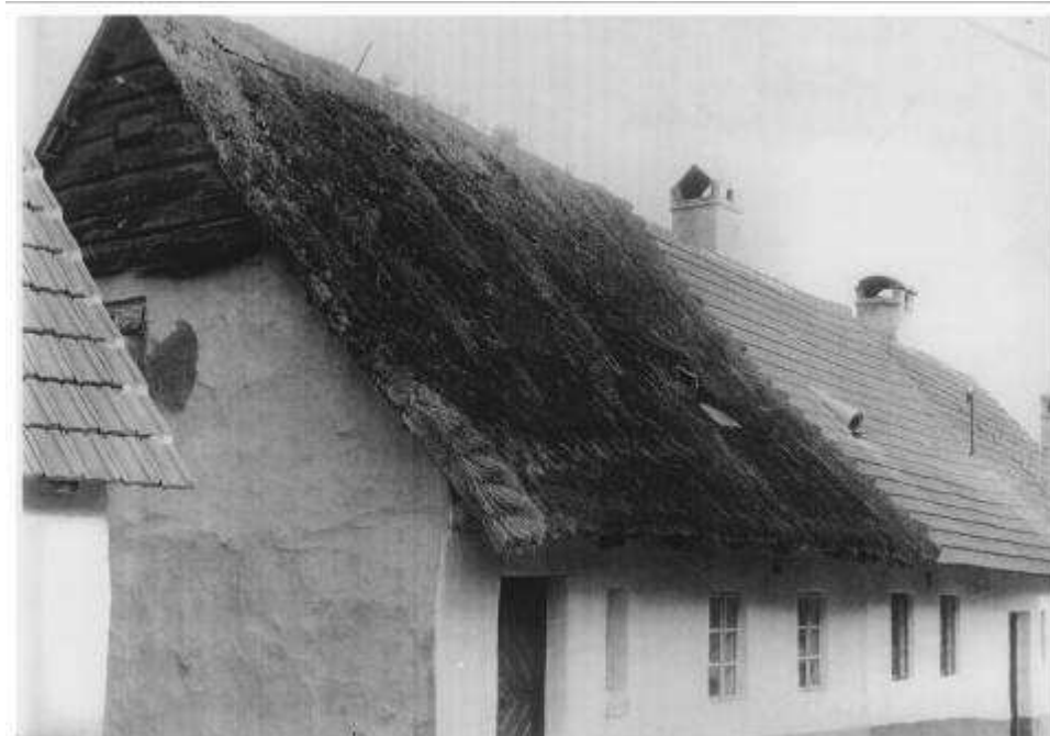
65. Habánske domy súp. č. 482 a 483 – pohľad od severu (r. 1958)