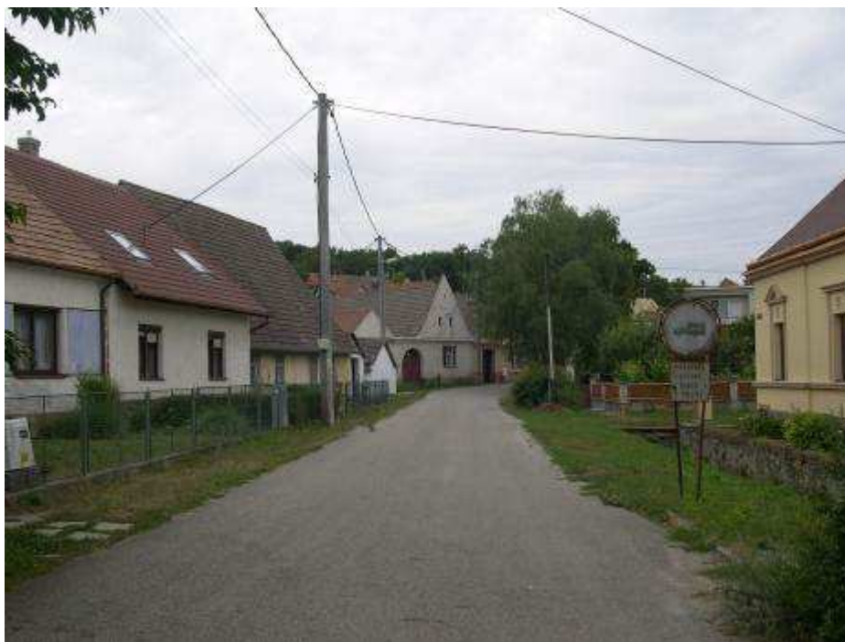
12. Zástavba južnej časti hlavnej cestnej komunikácie – pohľad od juhu z vjazdu do PZ.