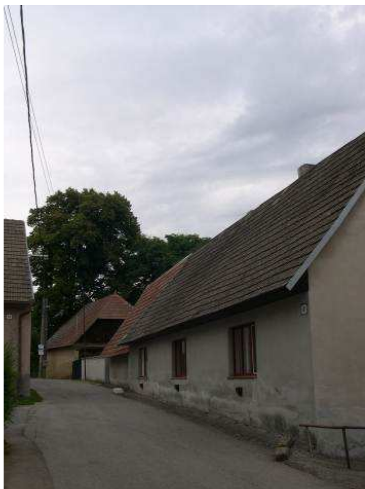
46. Dom súp. č. 481 na východnej strane hlavnej cestnej komunikácie – pohľad od juhozápadu.