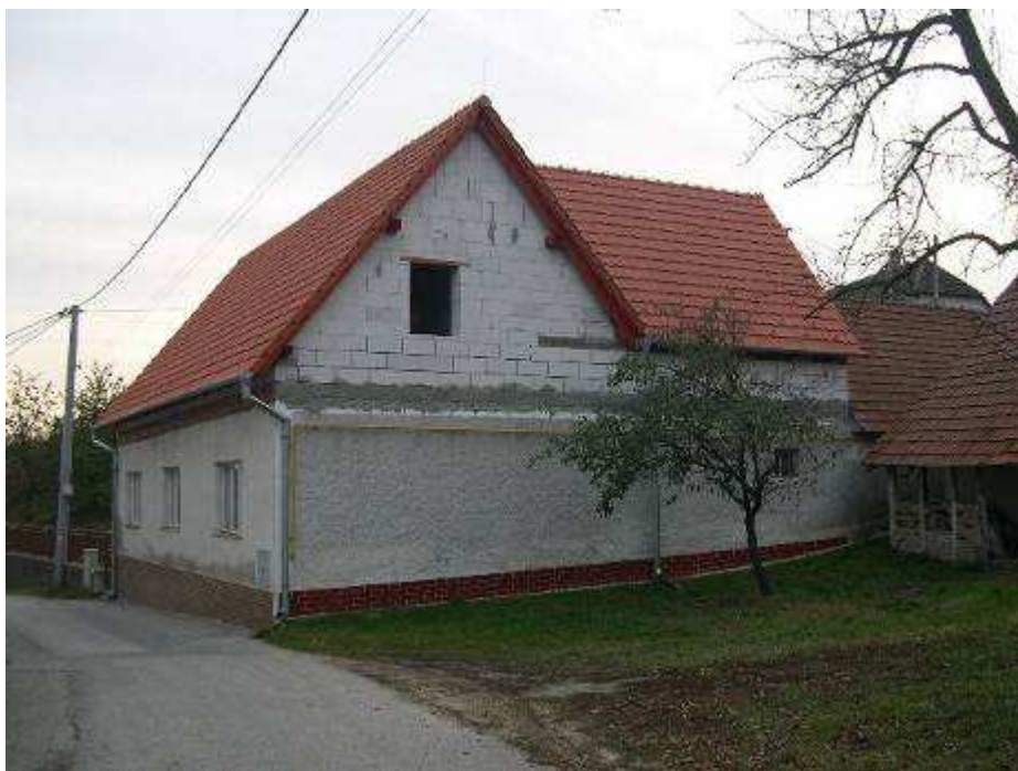
54. Dom súp. č. 403 na západnej strane hlavnej cestnej komunikácie, severne od zvonice – pohľad od severu.