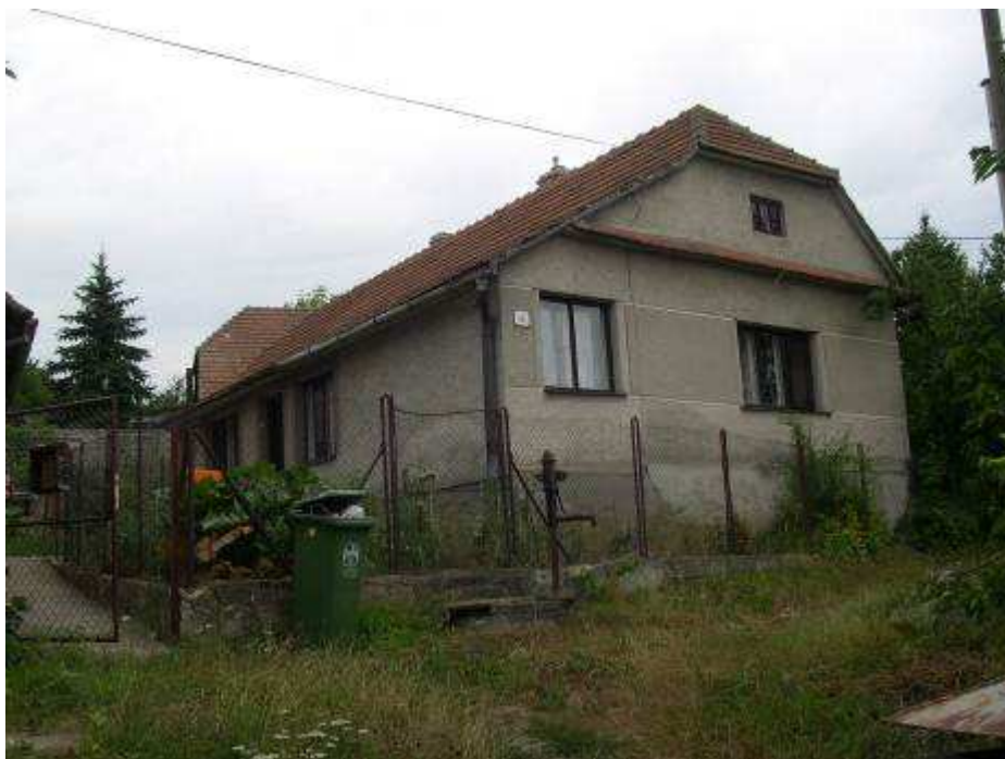
58. Dom súp. č. 401 vo svahu západne nad zvonnicou – pohľad od juhovýchodu.