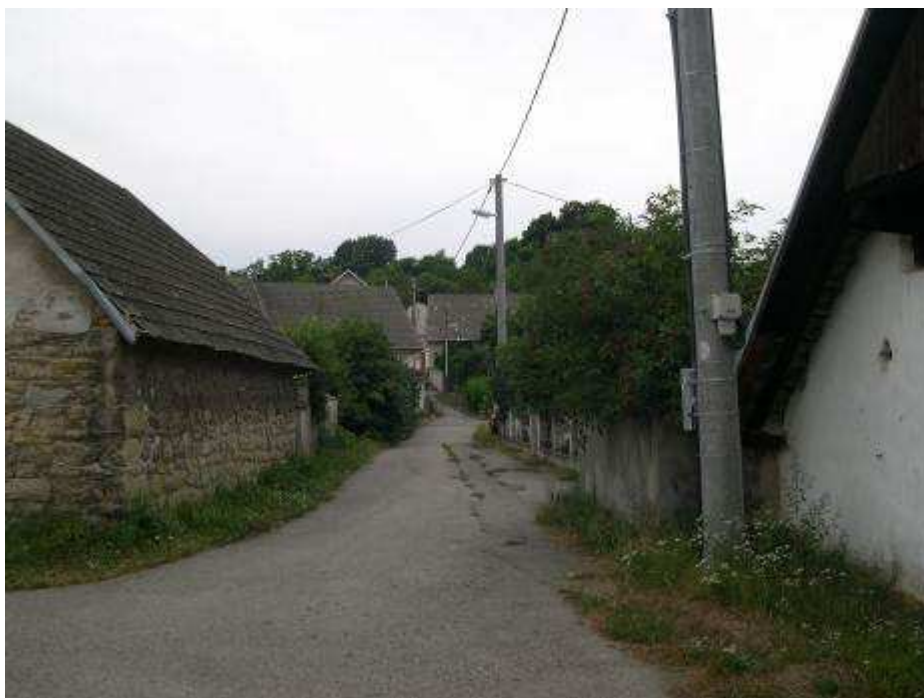
10. Pokračovanie tzv. Habánskej uličky, vedúcej z obce ku habánskej kaplnke – pohľad od východu.