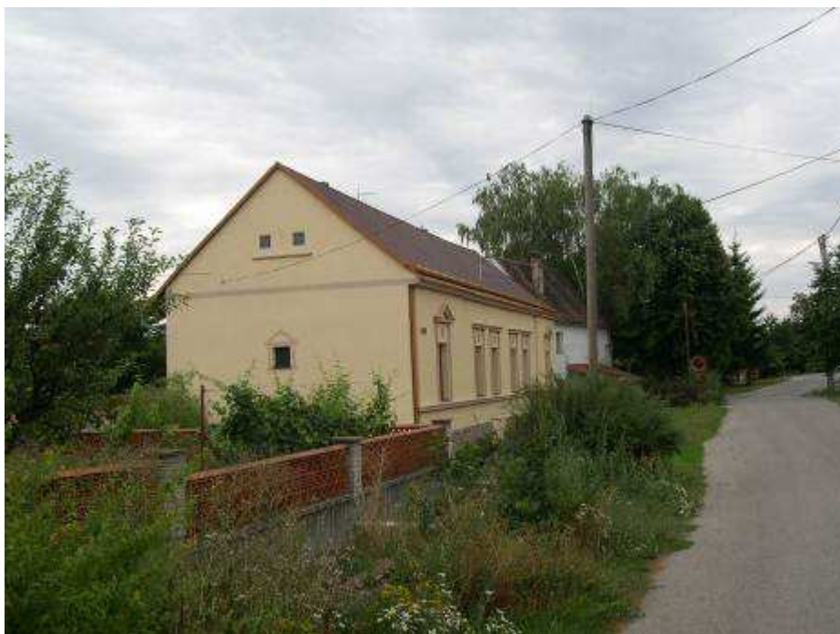
34. Dom súp. č. 503 na východnej strane hlavnej cestnej komunikácie – pohľad od severu.