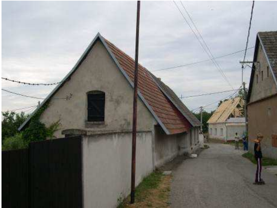
7. Zástavba severnej pozdĺž časti hlavnej cestnej komunikácie s domami súp. č. 410 a 481 - pohľad od severu