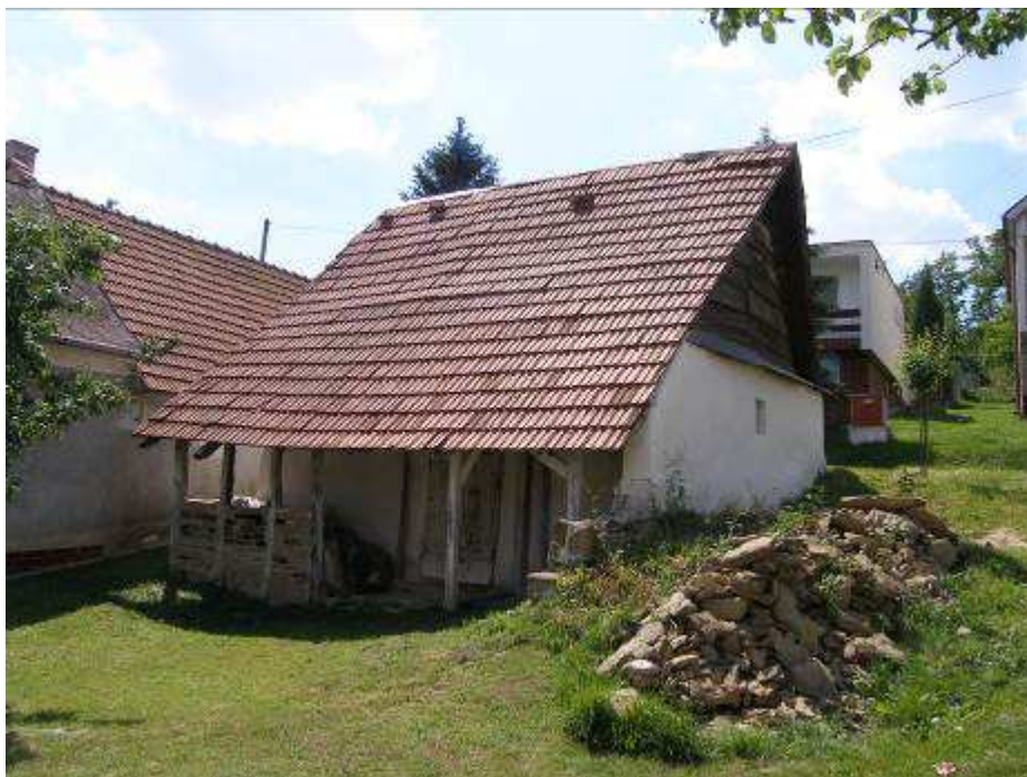
53. Hospodársky objekt – chliev, na západnej strane hlavnej cestnej komunikácie, južne od kaplnky – pohľad od severovýchodu.