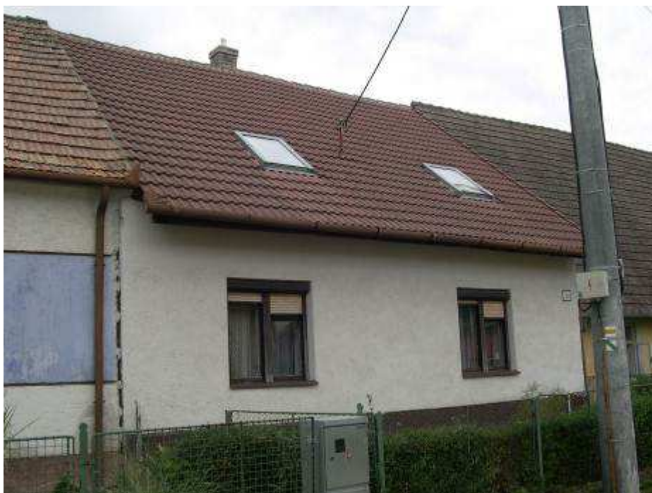
32. Dom súp. č. 394 na západnej strane hlavnej cestnej komunikácie – pohľad od juhovýchodu.