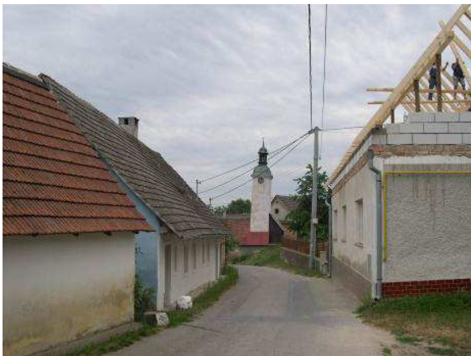
6. Pohľad na západnú časť cez hlavnú cestnú komunikáciu centrálneho priestranstva PZ so zvonickou.