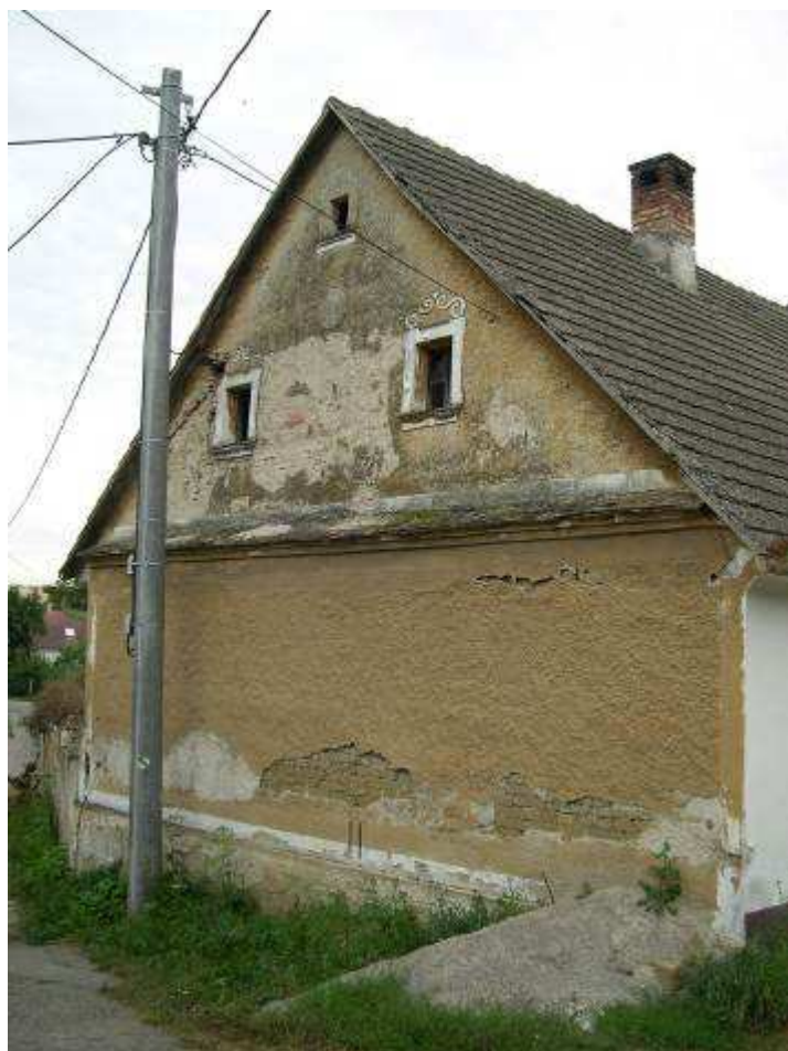
22. Severná fasáda domu súp. č. 488 (vytypovaný na vyhlásenie za NKP) – pohľad odseverozápadu