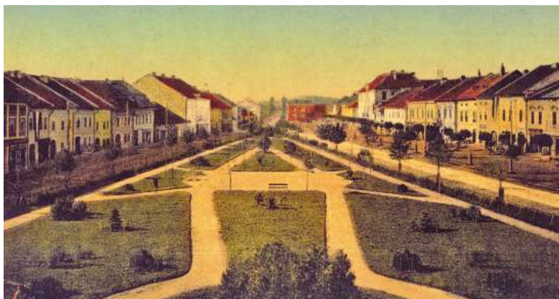
námestie a novozaložená parková úprava pred evanjelickým kostolom - spred r. 1910 (©)