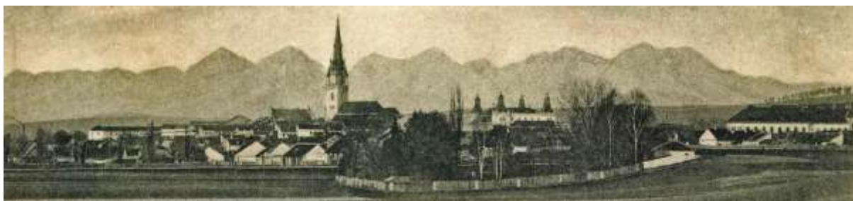
pohľad na mesto s panorámou Tatier - výrez pohľadnice spred r. 1904