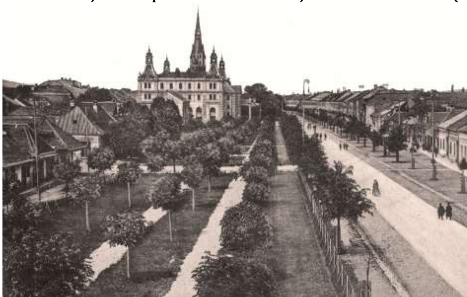
východný záver námestia pred drevopriemyselnou školou - pohľadnica pred r. 1910 (©)