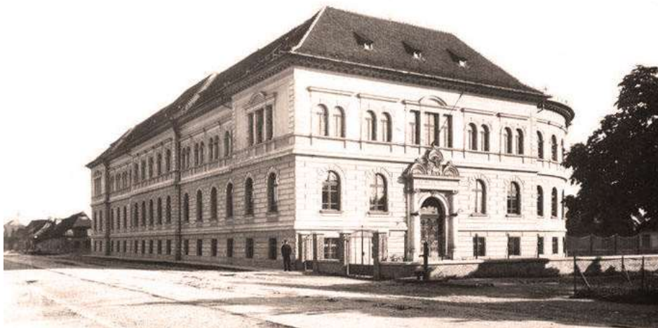
Drevopriemyselná kráľovská škola na fotografii spred r. 1910