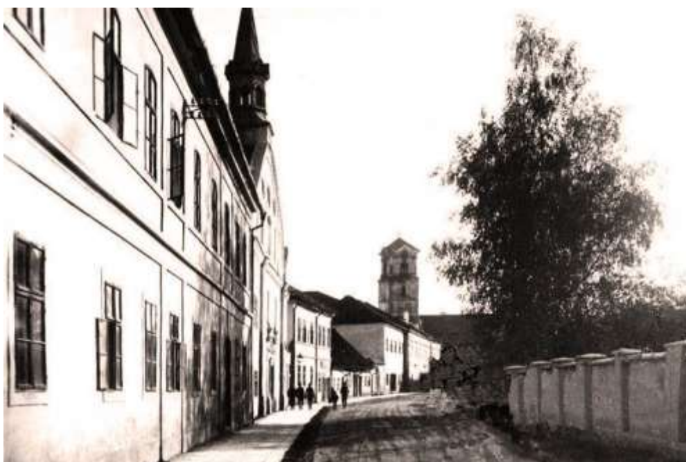
Levočská ulica a veža farského kostola na fotografii spred r. 1892