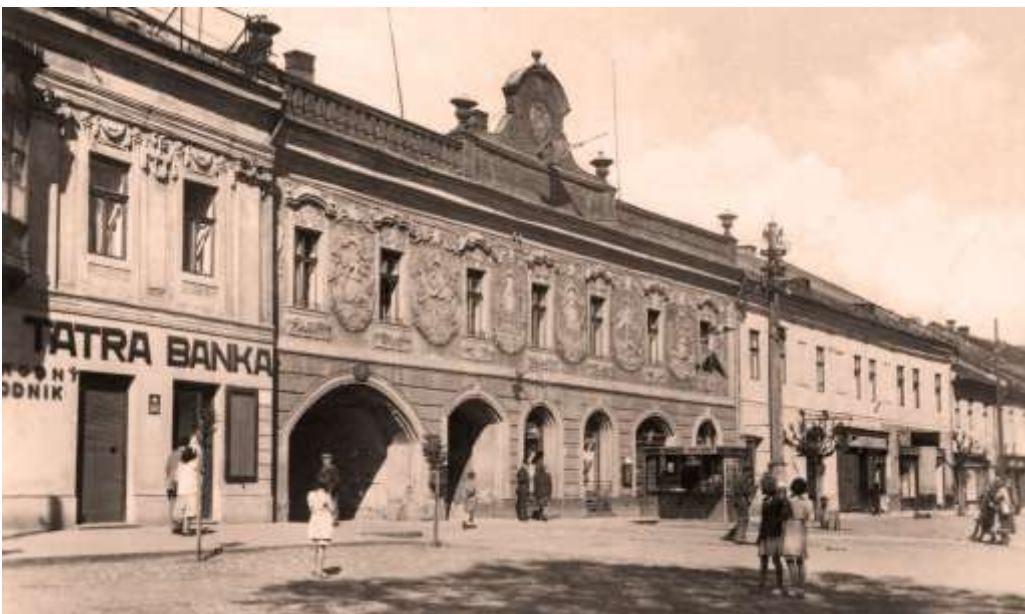
Provinčný dom - Letná 50 - fotografia okolo r. 1950