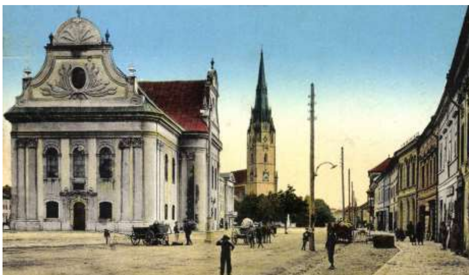
evanjelický kostol a domoradie Zimnej ulice - pohľadnica spred r. 1904