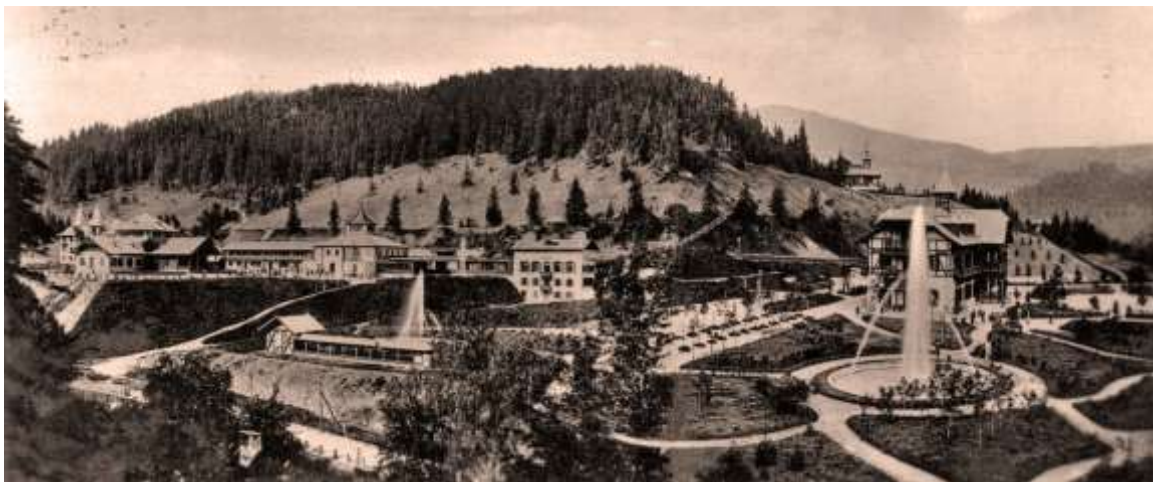
zaniknuté Novoveské kúpele v čase najväčšieho rozmachu