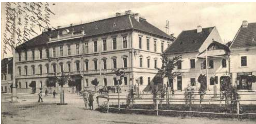
pôvodne evanjelické gymnázium a asanované domy Letnej ulice č. 29, 30, 31 - výrez pohľadnice spred r. 1906