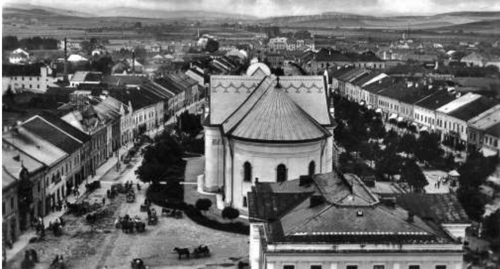
západná polovica námestia z veže farského kostola - v medzivojnovom období