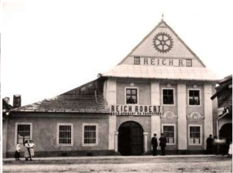
asanovaný objekt kováčstva Reich na Zimnej 113 - pred a po prestavbe z prelomu 19. a 20. st.