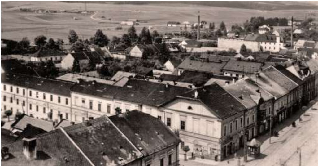
zástavba Zimnej 55 - 50 v pozadí s konzervárňou aj tehelňou - foto z r. 1943 (©)