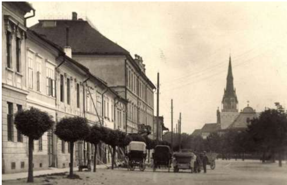
domoradie na Štefánikovom námestí 11 - 21 - fotografia z 20. rokov 20. storočia