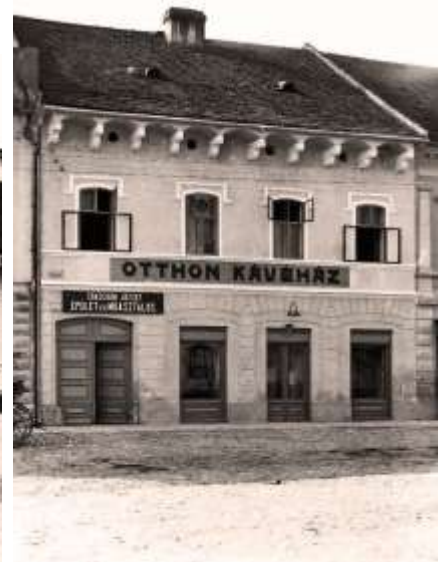
Zimná 53 - spred r. 1918 (©)