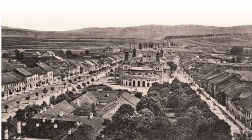
východná časť šošovkového námestia - výrez pohľadnice spred r. 1911