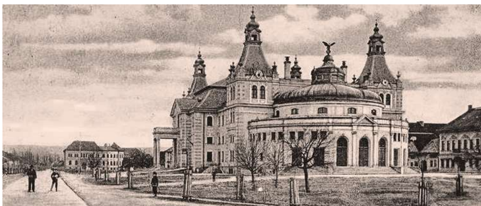
Reduta tesne po dokončení a Matzov dom (v pravom rohu - Zimná 90) pred nadstavbou na pohľadnici spred r. 1904 (©)