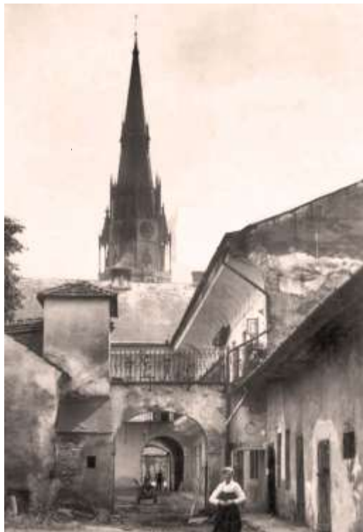
dvor na Letnej 51 (©)