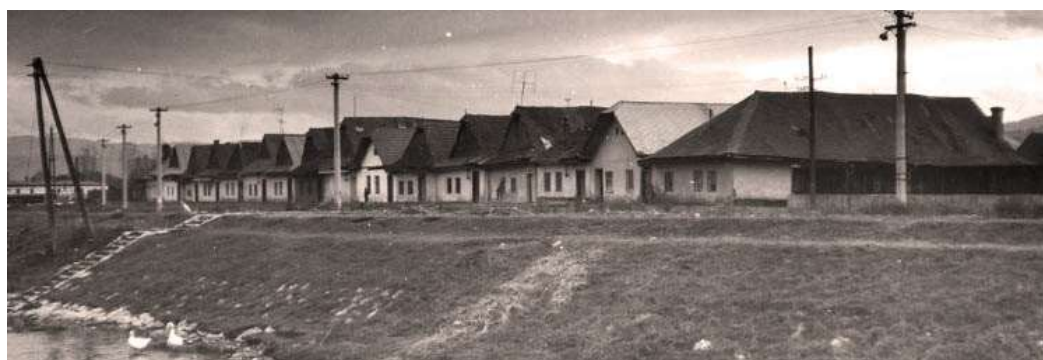
Šestnástka - asanovaná mestská časť za Hornádcom - fotografia z 2. pol. 20. storočia