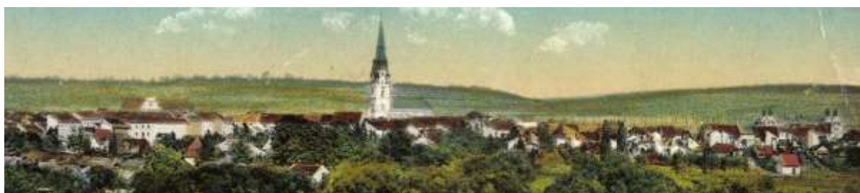
výrez panoramatickej fotografie mesta z juhu (od továrne na krabice) spred r. 1915