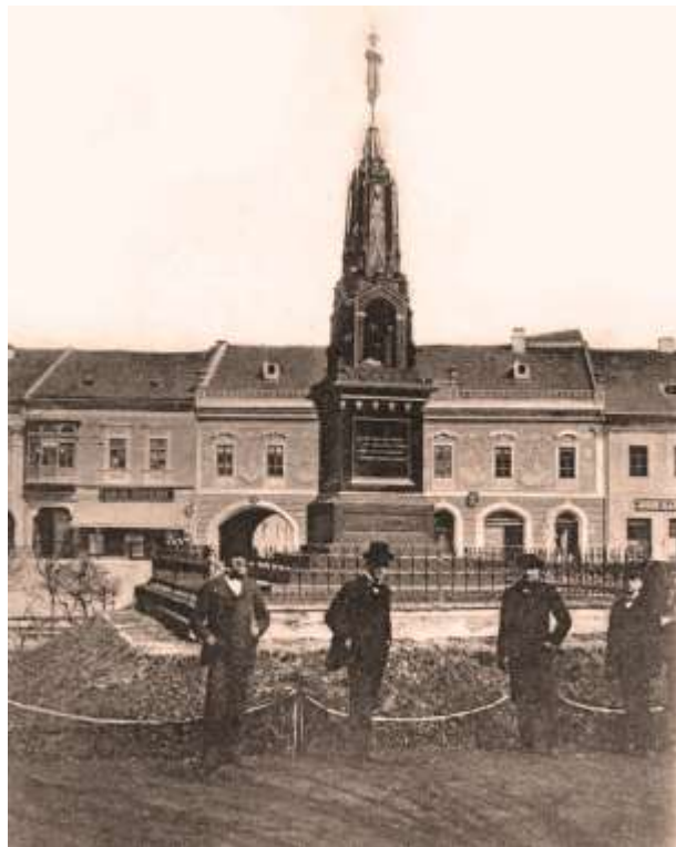
pamätník uhorskej domobrany - foto spred r. 1899