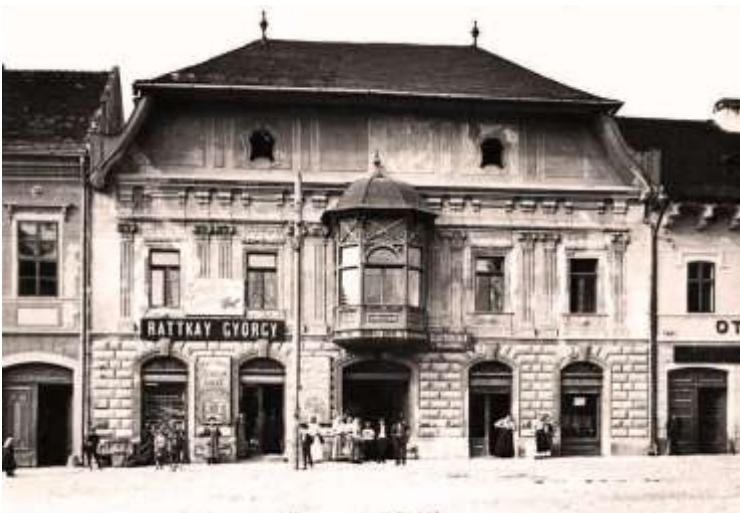
Zimná 54 - spred r. 1918