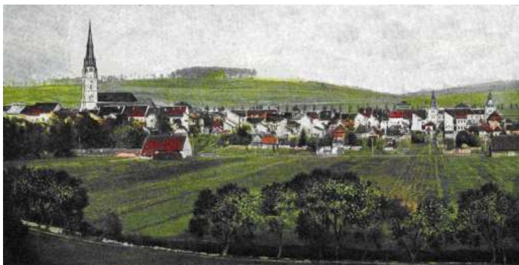
pohľad na zástavbu Zimnej ulice od juhu - výrez kolorovanej pohľadnice spred r. 1904