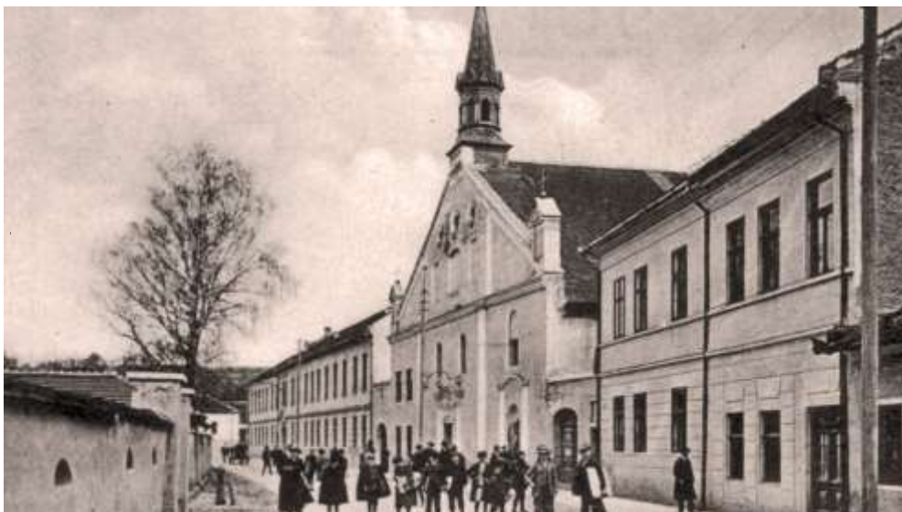
Levočská ulica a Kostol Nepoškvrneného počatie Panny Márie - výrez pohľadnice spred r. 1918