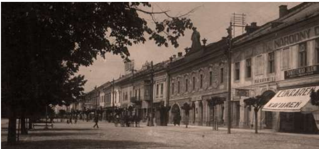
domoradie Letnej ulice 45 - 51 - výrez pohľadnice spred r. 1930