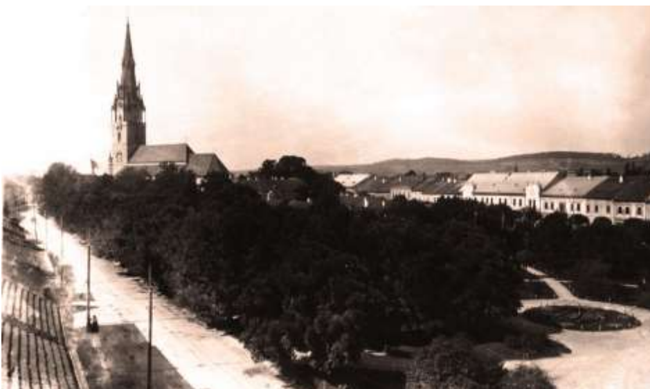
stred námestia s dominantou mesta na začiatku 20. storočia