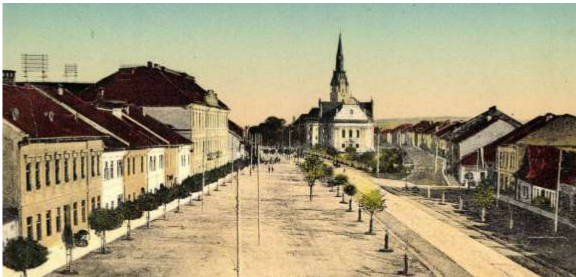
pohľad na šošovkové námestie od západu - výrez pohľadnice spred r. 1910