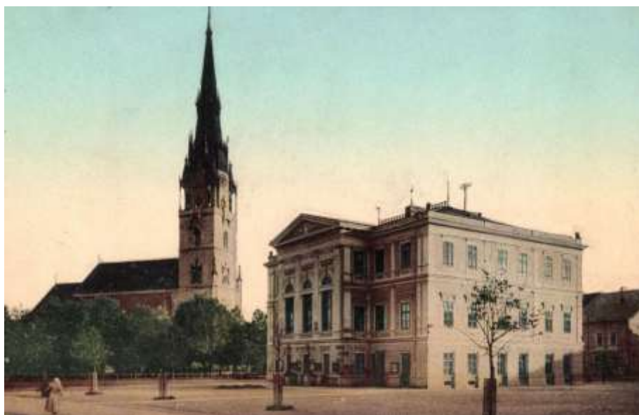
pohľad na radnicu a farský kostol - výrez pohľadnice spred r. 1911