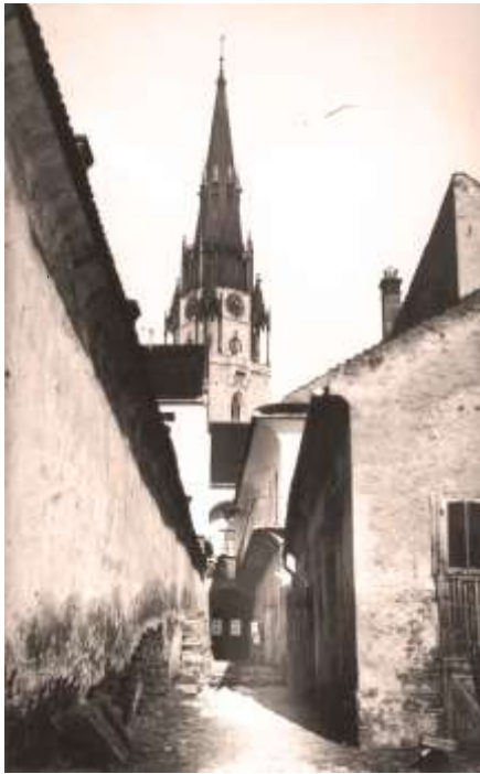
tradičný dvor mešt. domu na Zimnej ul.