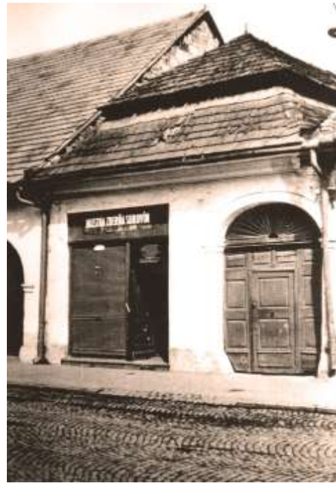
asanovaný dom na Letnej ulici