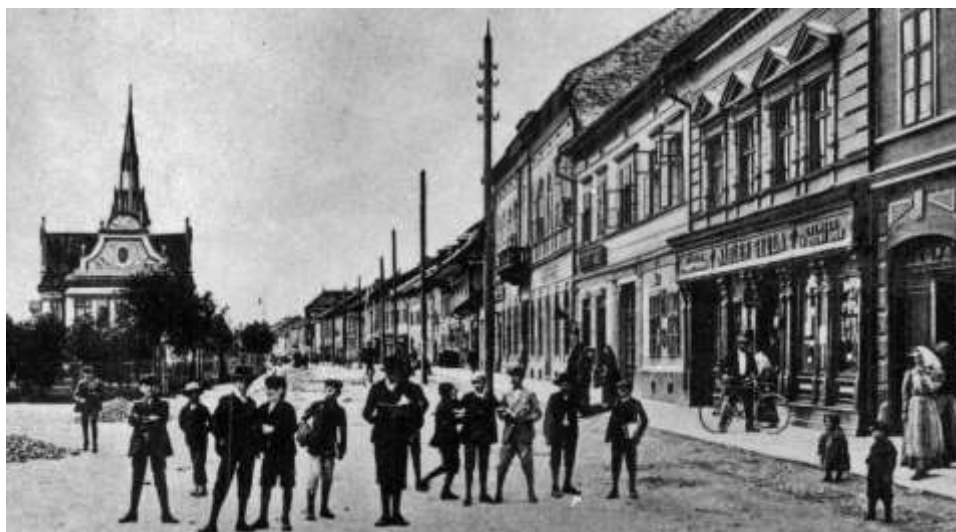
Zimná 31 - 50 na pohľadnici spred r. 1911