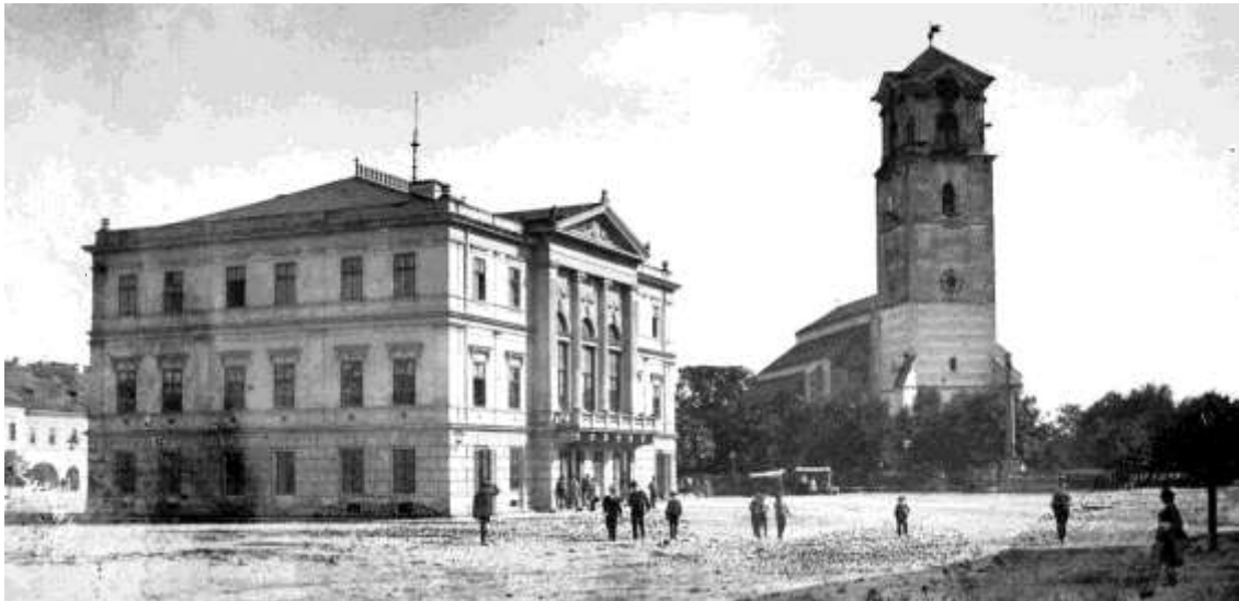
pohľad na radnicu a farský kostol z obdobia pred neogotickou prestavbou kostolnej veže