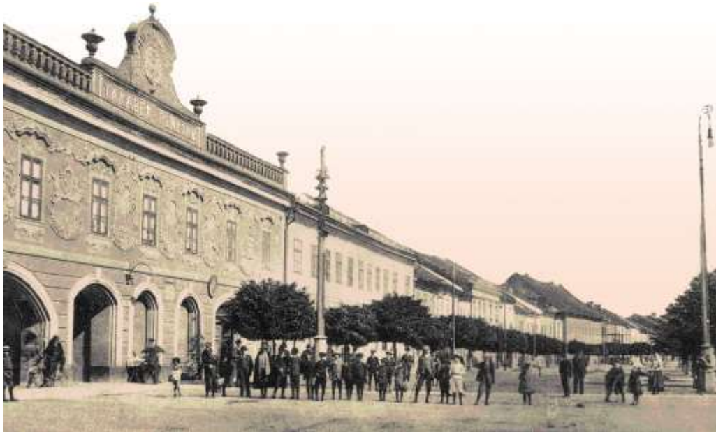
Provinčný dom a domoradie Letnej ulice 51 - 60 - výrez pohľadnice spred r. 1912