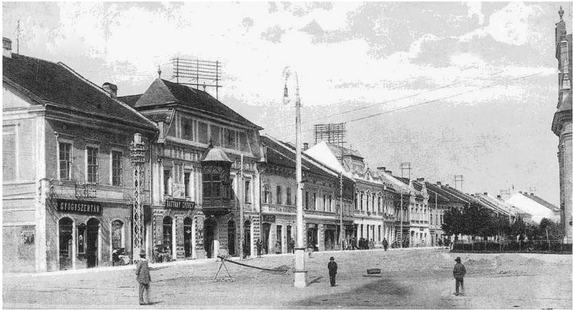
domoradie Zimnej 55 - 47 - výrez pohľadnice spred r. 1914