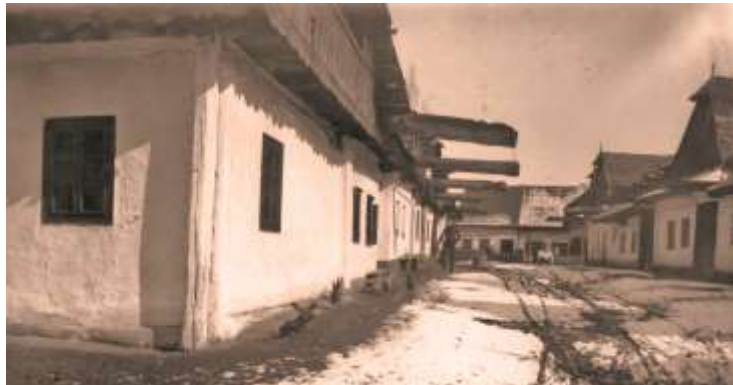
Mlynská ulica pred výstavbou reduty