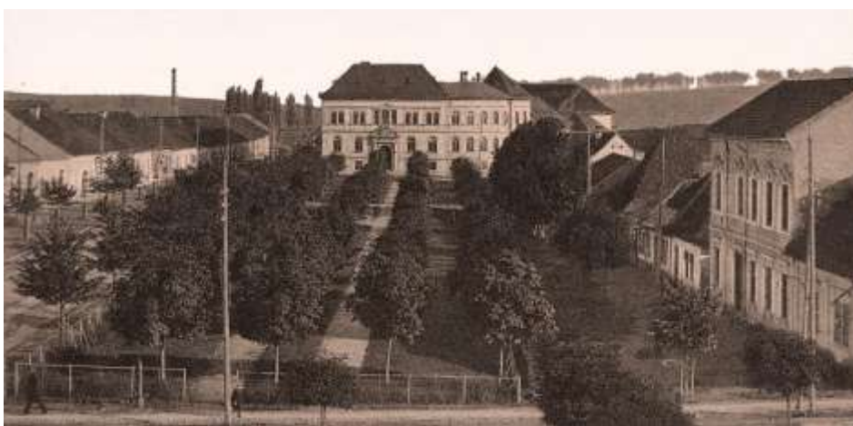
východný záver námestia okolo roku 1910 - vpravo zástavba Stredného riadku