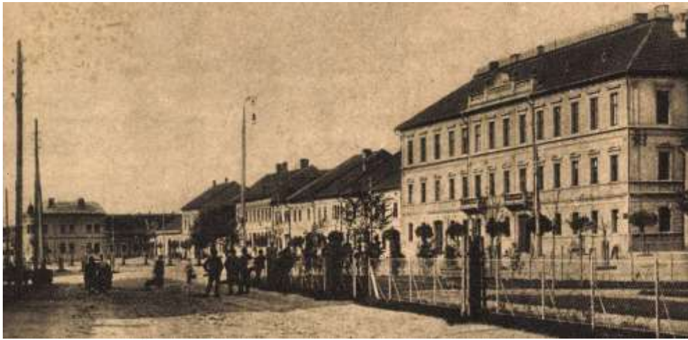
dnešné Štefánikovo námestie a pôvodne evanjelické gymnázium (bývalá banická škola) - výrez pohľadnice spred r. 1921