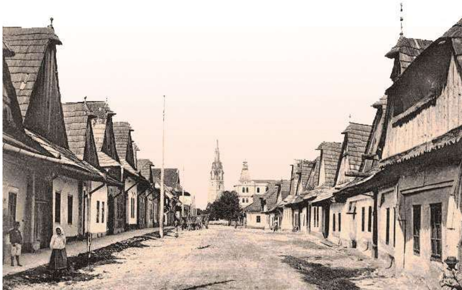
asanovaná zástavba Stredného riadku a východnej časti Zimnej ulice - pohľadnica spreď r. 1902