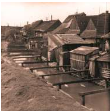
zaniknutá zástavba Na Medzi