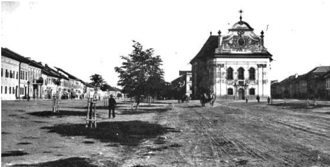
pohľad na námestie a evanjelický kostol z obdobia pred úpravou strechy kostola (©)