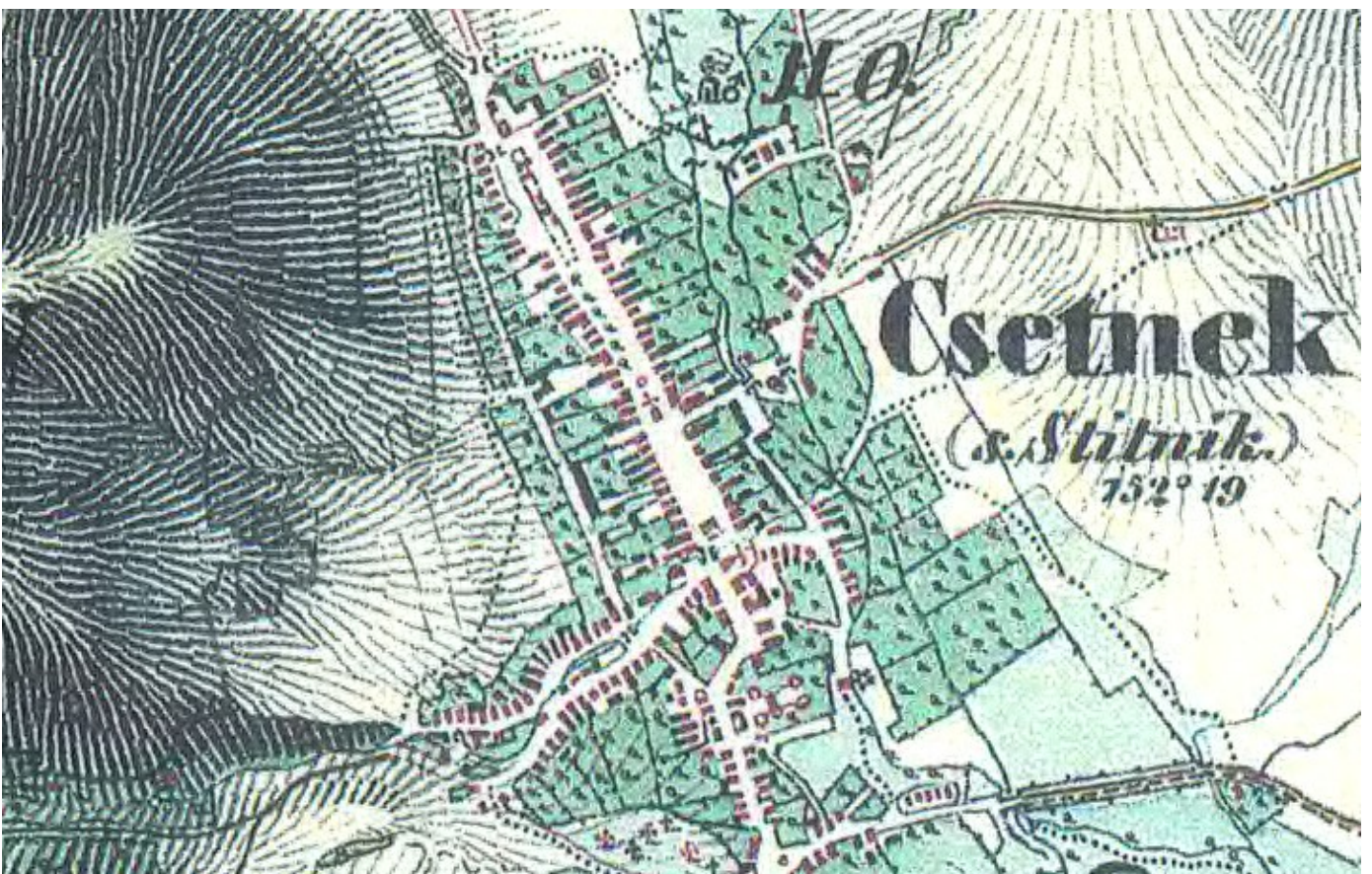
Sídlo na mape z 2. vojenského mapovania (1. pol. 19. stor.)