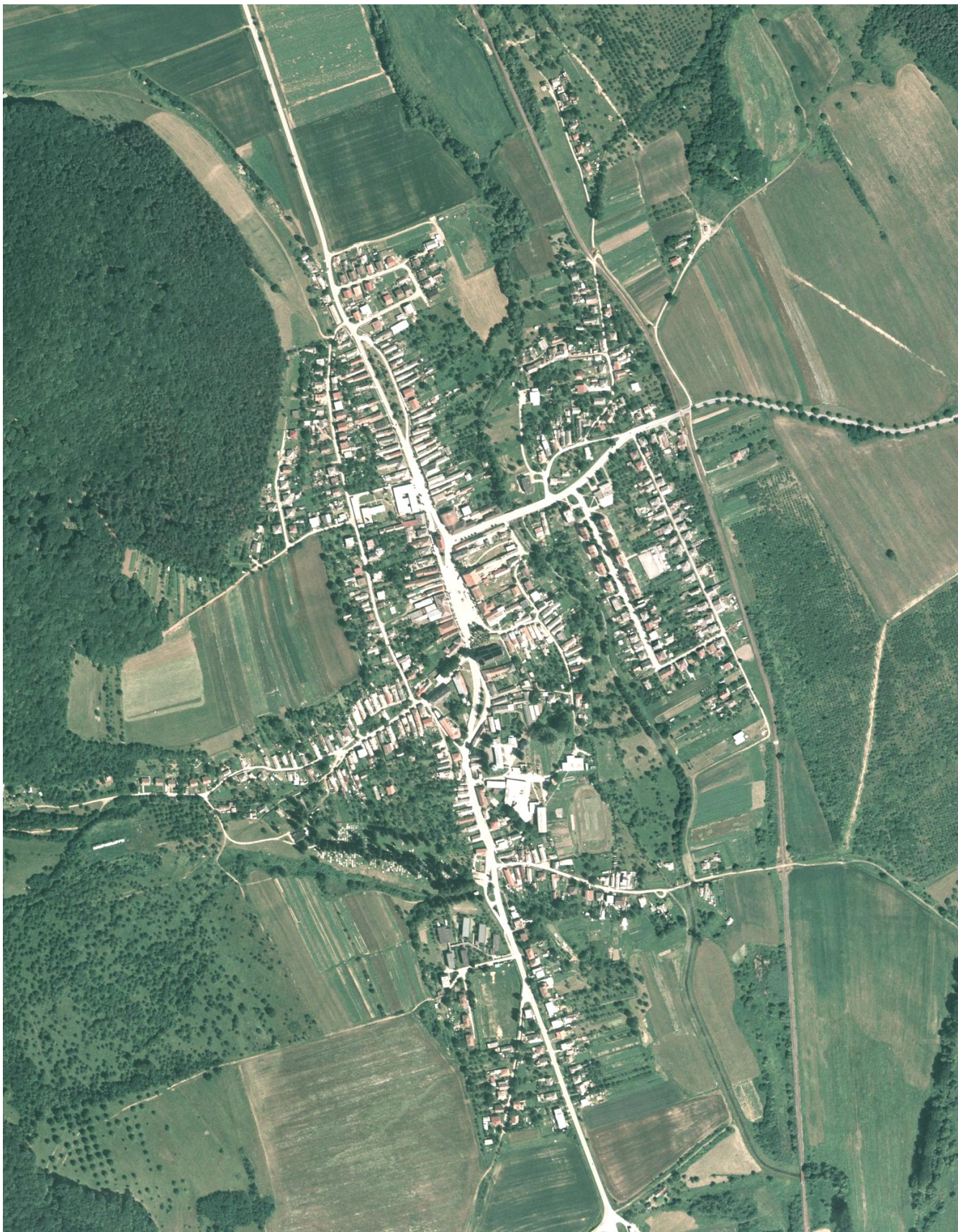
Ortofotomapa—pohľad na súčasné sídlo, ktoré si v sebe zachovalo pôvodnú urbanistickú štruktúru.