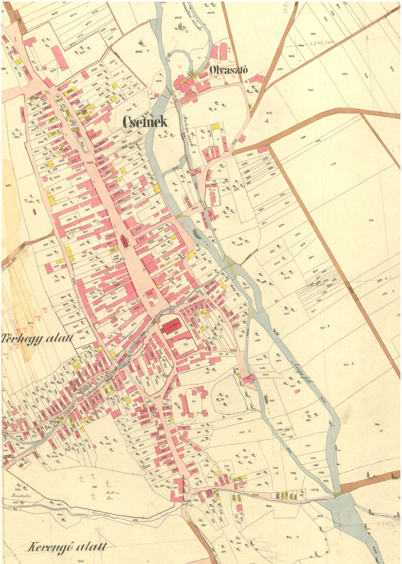
Sídlo na katastrálnej mape z roku 1868, zachytávajúcej stav pôvodného územia a rozsah parciel.