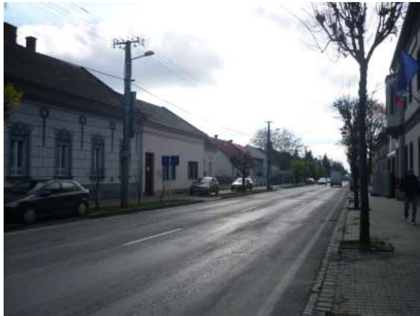
5.4.12. vnútorný pohľad č. 4 na severnej strane zóny na západnú stranu ulice