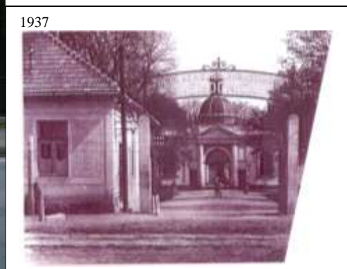
5.4.18. vnútorný pohľad č. 10 z mosta nad potokom Chotina