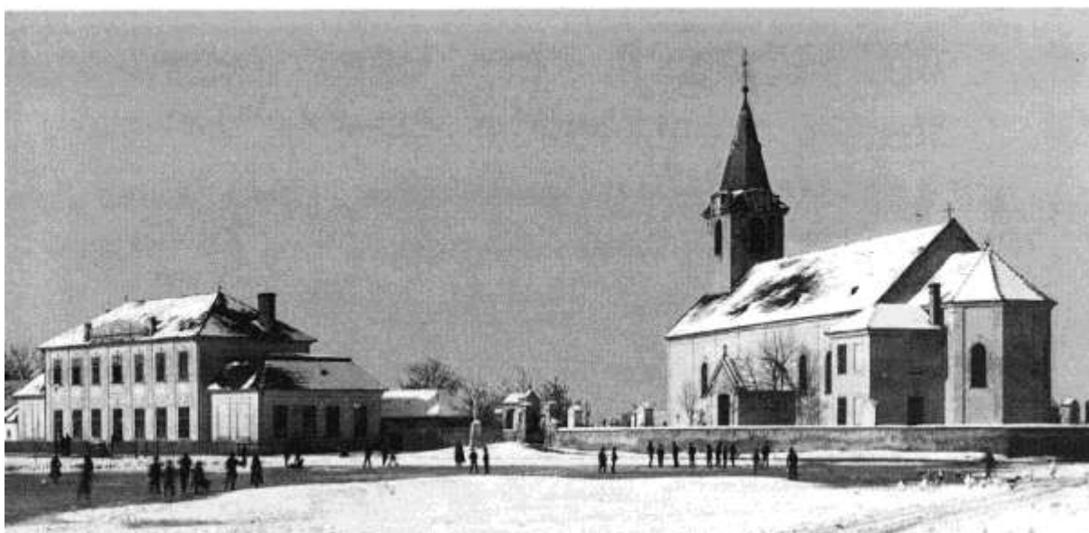
Pohľad na kostol a školu v zime pravdepodobne okolo roku 1945, kde sa na „jazierku“ deti korčuľujú.