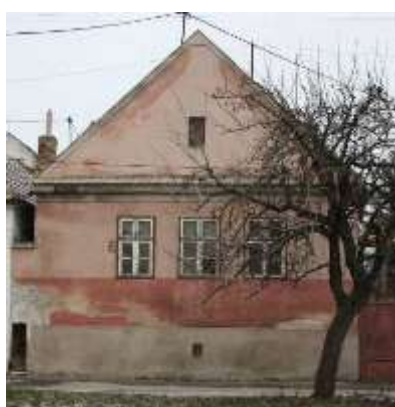
č. 139-143 – výnimočne 3-osový dom so zvýšenou pivnicou a s tvarovaním dvojitého okna.

Domy je potrebné zachovať pri súčasnom objeme a tvarovaní fasád so zabezpečením v prvom rade údržby a opráv poškodených častí domov. Okná podľa potreby vymeniť za tvarovo a členením podobné.