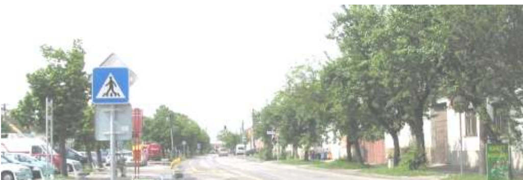
Pohľad č. 7

Pohľad na západnú stranu Roľníckej ulice od sochy sv. Floriána.