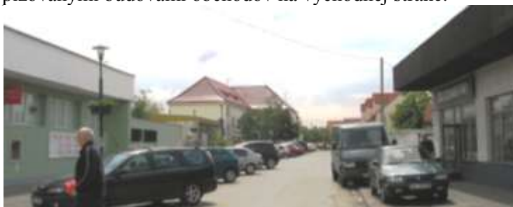
Pohľady na Jačmennú ulicu od juhu na sever (1) a so severu na juh (2), kde na východnej – ľavej strane je budova 2-podlažná Obecného úradu.