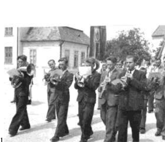
Pohľad na procesiu cez obec pred rokom 1950 ( 1936?), kde je zachytený aj stav zelene na Roľníckej ulici (1) a pred školou s kostolom (2).