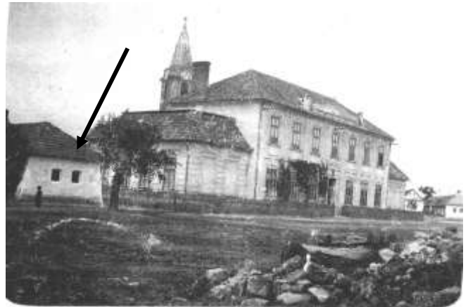
POHĽAD NA ŠKOLU Z R. 1926