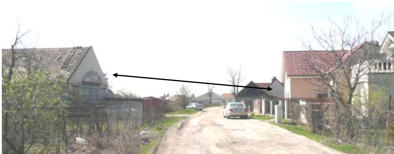
Pohľad na ulicu „Za humnami“ na západnej strane, kde končia zadné časti parciel domov z Roľníckej č. 210 – 170, kde na severnej – pravej strane je dvojica nevhodných novostavieb spojených podobne ako radové domy s použitím aj historizujúceho tvaroslovia. Na južnej – ľavej strane je stodola, ktorej podobný typ je a v pozadí pohľadu – označené šípkou.