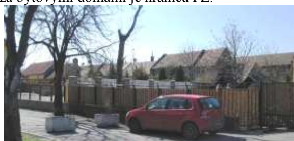
1 Pohľad na obe strany ulice Pod lipami, kde na východnej strane(1) sú krídla domu č. 167 a na

západnej strane hostinec a dvorové krídla domu. č.157-159.