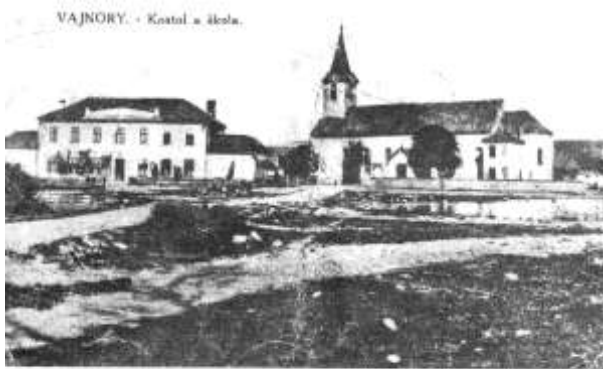
POHĽAD NA ŠKOLU A KOSTOL Z ROKU 1926

poskytnuté obcou alebo ako reprodukcie z Vajnorských noviniek – dokumentujúce stav priestorov a budov v obci v rokoch 1926 až 1956