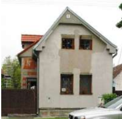
Pohľad na domy č. 230 a 226 a ich rozdelený dvor.