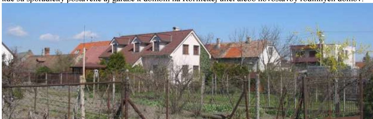
Zadné krídla domov z Roľníckej ulice previazané so zástavbou ulice – prestavané zadné krídla domov č. 286-290 na mieste hospodárskych objektov parcele s nevhodným použitím vikierov.