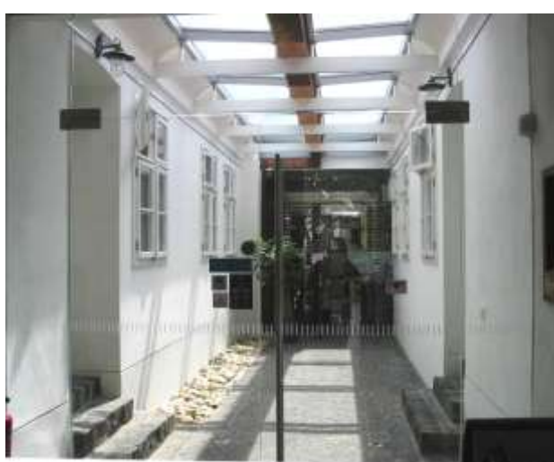
Pohľad na prejazdy a prekrytie dvorov v domoch č. 114 a 116 na Roľníckej ulici, ktoré sú využívané ako spoločenské priestory k domom využitým ako sídlo firmy (1) a vinotéka Régius (2)