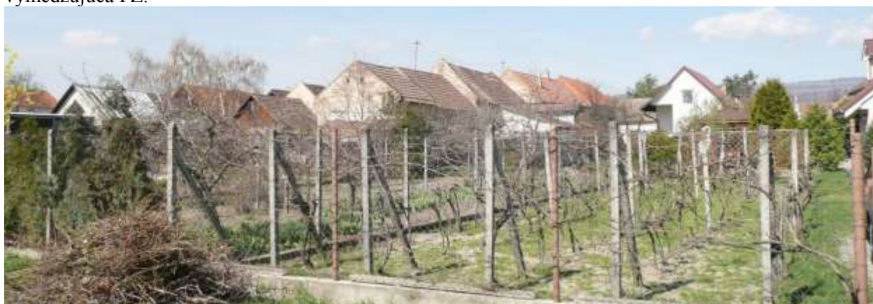
Pohľad na zadné časti parciel z Roľníckej ulici č. 286 - 220 na Tomanovej ulici s štruktúrou dvorových krídiel prestavovaných na bývanie.