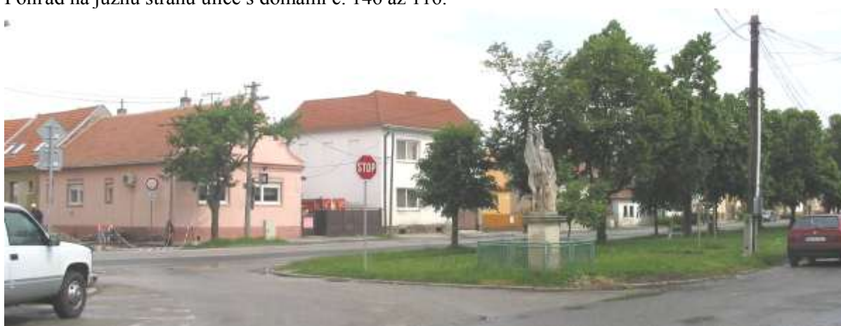
Centrálny priestor Roľníckej ulice so sochou sv. Floriána, ktorý je východiskovým bodom pri pohľadoch v interiéri obce č. 7 a 8. Za ním je dom č. 167 a 2-podlažný dom č. 169 - 153