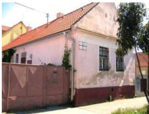
č. 52-54 s dobre udržiavanými oknami s mrežou z čias po roku 1950,