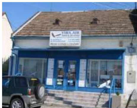
č. 142 a