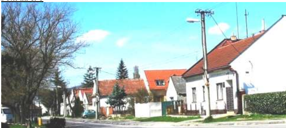
Pohľad č. 6

Pohľad na severnú stranu Baničovej ulice z napojenia ulice Pri struhe s parkom Pod lipami od domu č. 14 – r. k. fara, ktorou končí zástavba ulice.