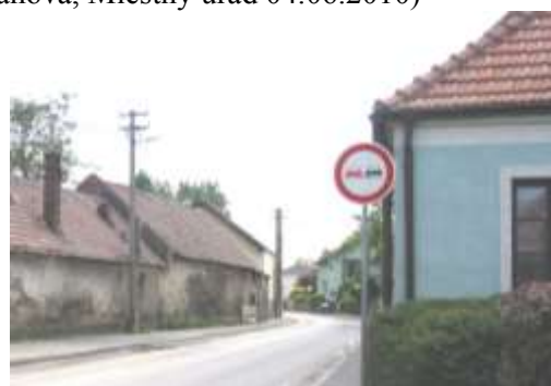
Pohľad na západné ukončenie pamiatkovej zóny na ulici Pri mlyne