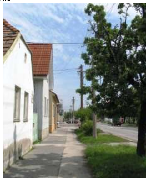
Pohľad na ukončenie Roľníckej a Rybníckej ulice s kaplnkou svätého Ján Nepomuckého a na domoradie domov na severnej strane Roľníckej ulice.