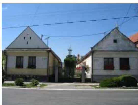
č. 35 a 37