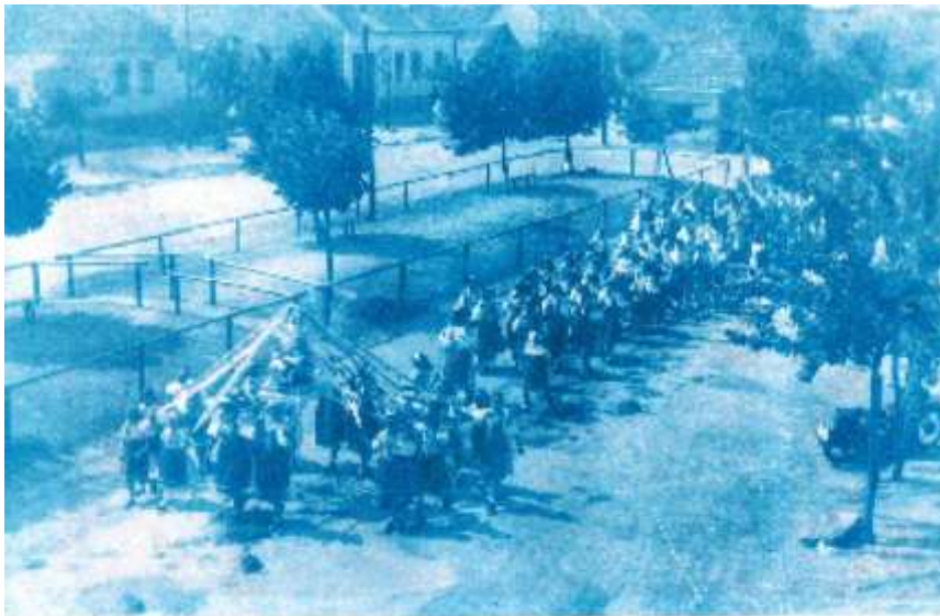
Procesia Božieho tela v roku 1932.

Pohľad na priestor pred kostolom a školou, ktoré zachytávajú stav zástavby v roku 1926: č.1 – dokumentuje zeleň a „jazierko“, budovu školy s 2-mi bočnými rizalitmi, z ktorých dnes stojí časť na pravej – západnej strane dnešnej Základnej školy Jána Pavla II, č. 2 – podobný pohľad so zachytením školy a skutočného vzhľadu vtedajšieho vajnorského ľudového domu → dnes už zbúrané, na ktorý sa dnes podobá dom č. 74 na Baničovej ulici a dom č. 254 – 256 na Roľníckej ulici – odporúčané na dokumentovanie a statické posúdenie.