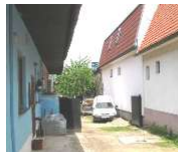
Pohľad na dom č. 65-67, ktorý patrí k typu „dlhého“ domu s presahom strechy nad vstupy – podobne ako bývajú riešené domy s „podstienkom“.