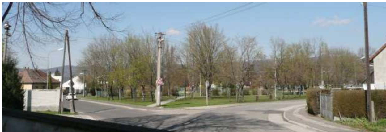
Pohľad na severnú hranicu PZ na Baničovej ulici s parkom Ferdiša Jurigu.