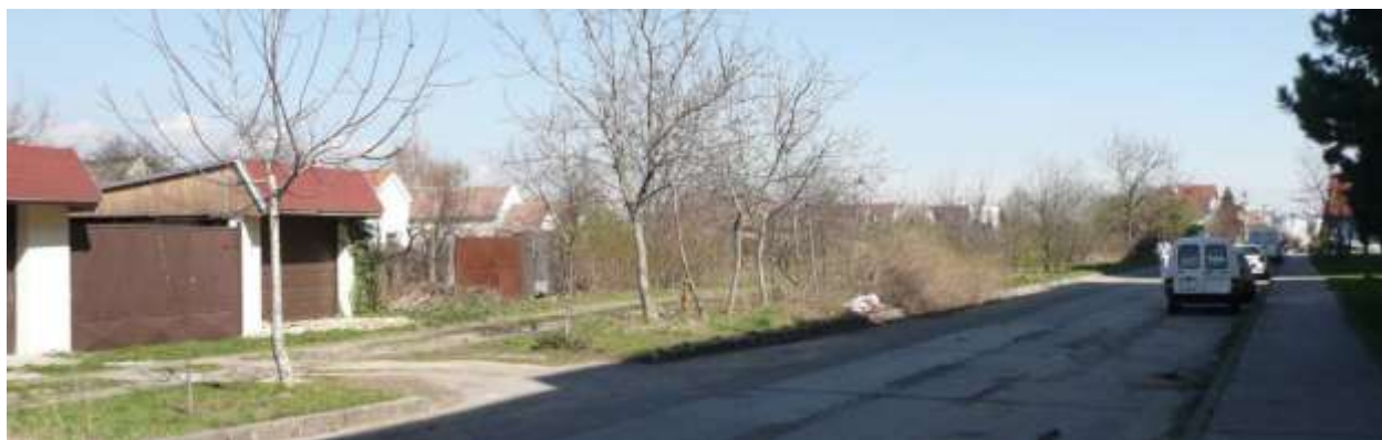
Celkový ohľad na západ na Tomanovú ulicu s neupravenou plochou a zadnými časťami parciel z Roľníckej ulice, kde sú sporadicky postavené aj garáže k domom na Roľníckej ulici alebo novostavby rodinných domov.