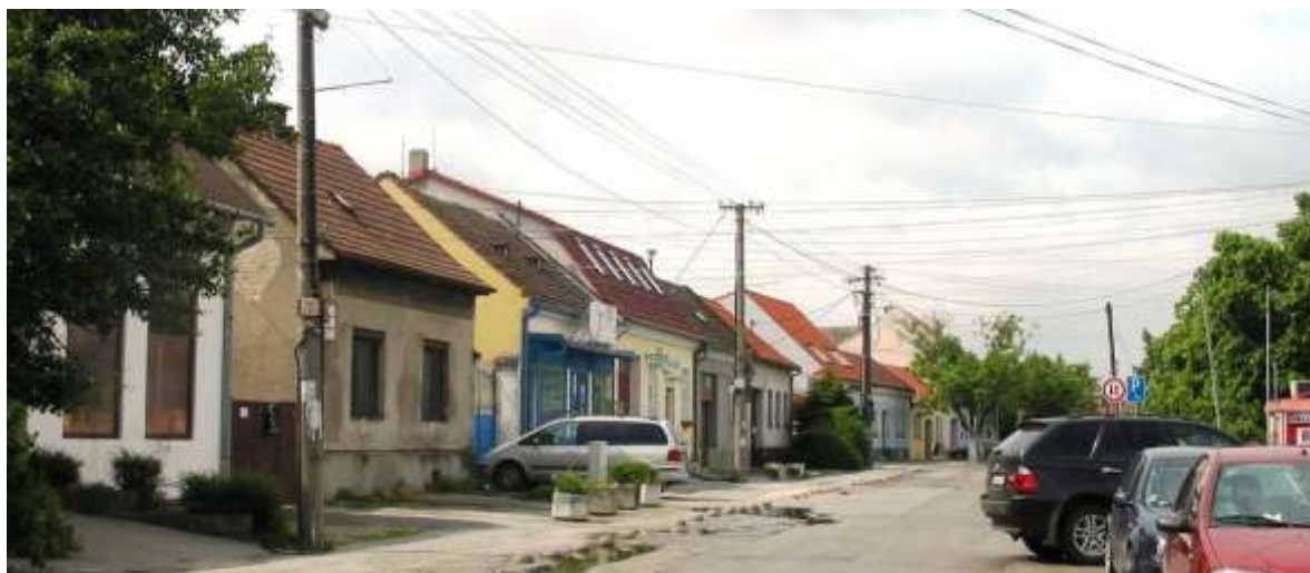
Pohľad na južnú stranu ulice s domami č. 146 až 116.