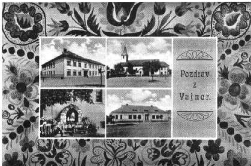
POZDRAV z VAJNOR, r.1942

Reprodukcia pohľadu na procesiu z Vajnorských noviniek č. 2/2009, kde je zachytený stav úpravy stredu ulice s lipami a dreveným ohradením trávnik, cesta a chodníky sú bez úpravy, pravdepodobne len prašný povrch – hĺina.