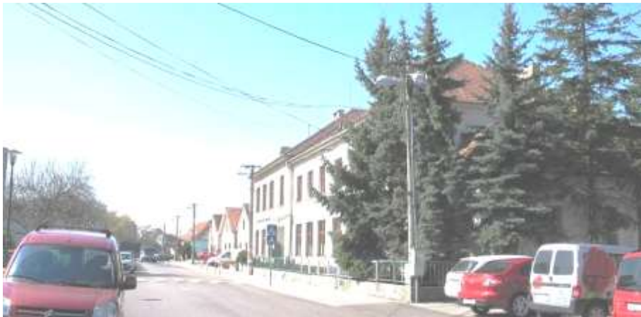
Pohľad č. 5

Pohľad na severnú stranu zástavby Osloboditeľskej ulice z priestoru pred areálom kostola a Parku pod lipami. Za ozdobnými smrekmi je prízemná historizujúca stavba a Základná škola Jána Pavla II. Kedysi spolu s kostolom viditeľným už z ulice Pod lipami, dnes prekrytá stromami parku.