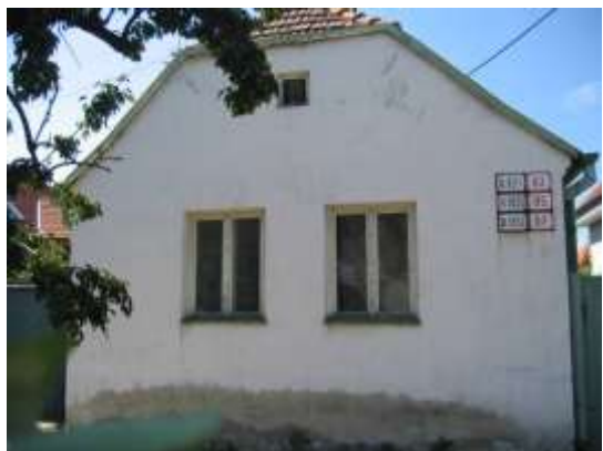
č. 93-95-97- 2 (1) štít s polvalbou a okná s prvoradým zabezpečením údržby a prípadne opravy poškodených častí.