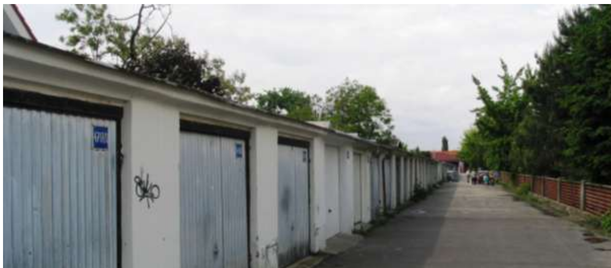
Pohľad z Jačmennej na severné ukončenie parciel domov z Roľníckej č. 31 až 101 hromadnými garážami, kde je aj hranica PZ.