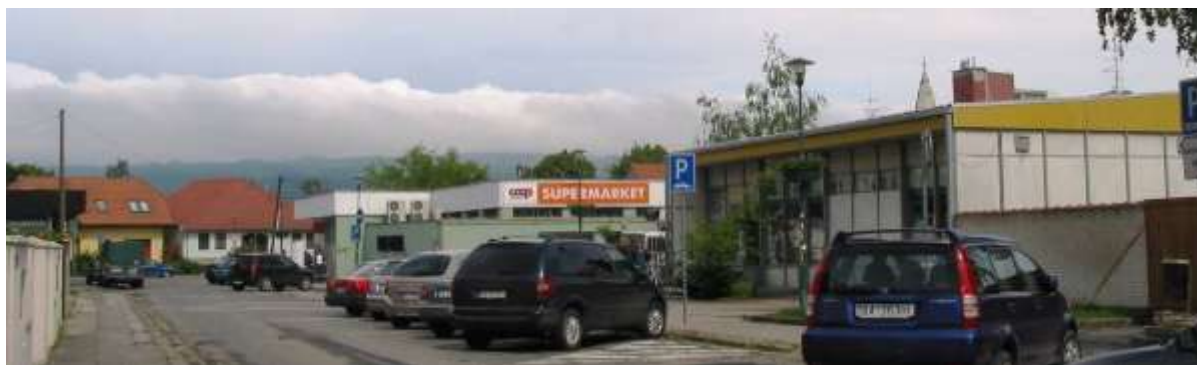
Celový pohľad na Jačmennú ulicu s typizovanými budovami obchodov na východnej strane.