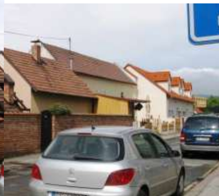
Pohľad na nárožie Jačmennej ulice s otvoreným dvorom po odstránení domov pri výstavbe Obecného úradu. Opravou dvorového krídla dom č. 101 sa modernizovala zástavba dvorového krídla, kde však na konci dom č. 7 má nevhodne použité vikiere.