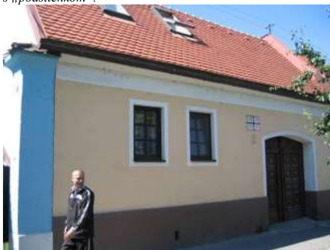
Pohľad na obnovený dom č. 89-71.