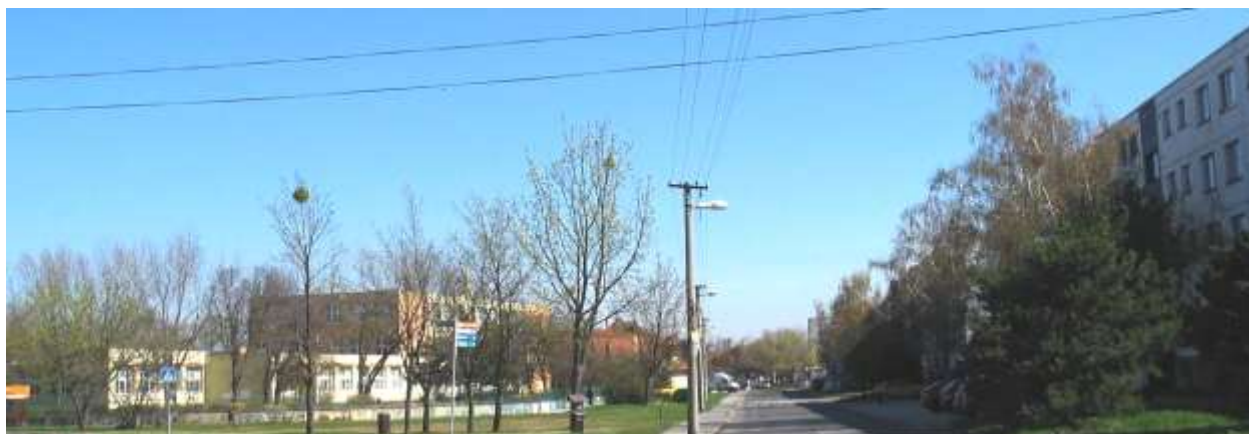
Pohľad na začiatok Osloboditeľskej ulice z Rybníčnej ulice, kde za bytovými domami je hranica PZ.