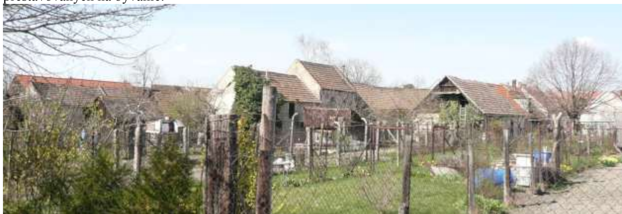
Pohľad na zadné časti parciel z Roľníckej ulici č. 286 - 220 na Tomanovej ulici s štruktúrou dvorových krídiel hospodárskych častí tzv. dlhých domov postupne prestavovaných na bývanie.