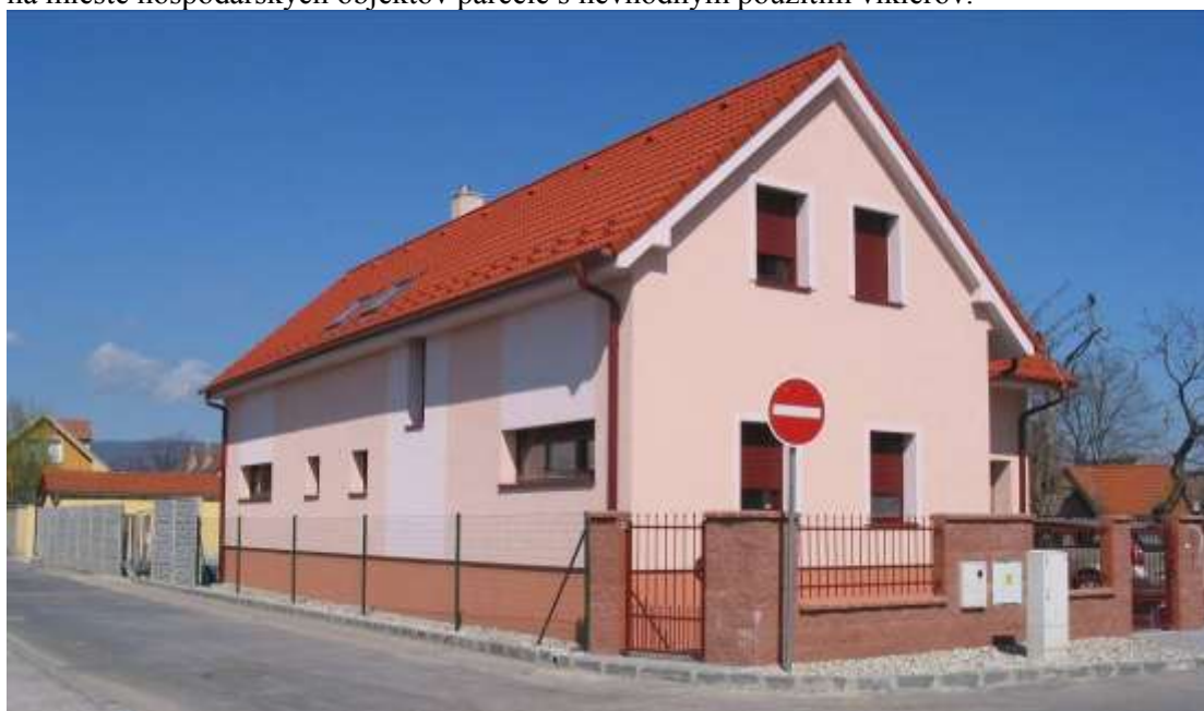
Pohľad na novostavbu na Tomanovej ulici na konci parcely z Roľníckej ulice č. 218-220, ktorá má prevýšené podkrovie a v pôdorysnej štruktúre uzatvára parcelu garážou na takmer celú šírku parcely – nezvládnuté riešenie domu s princípom pozdĺžnosti 2-osového domu a pristavenej garáže.