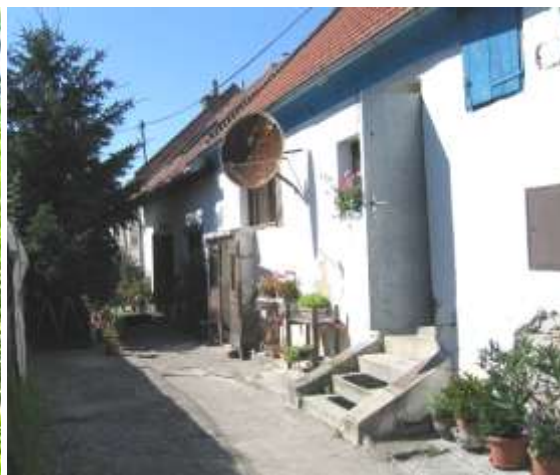
Pohľad na dom a dvor č. 187, ktorý spolu s domom č. 189 - 193 patria k typom domov z 2. polovice 19. storočia a vytvárajú široký odstup medzi sebou. Dokumentujú aj premenu domu komplexnou obnovou a udržiavanie dobrého stavebno - technického stavu.