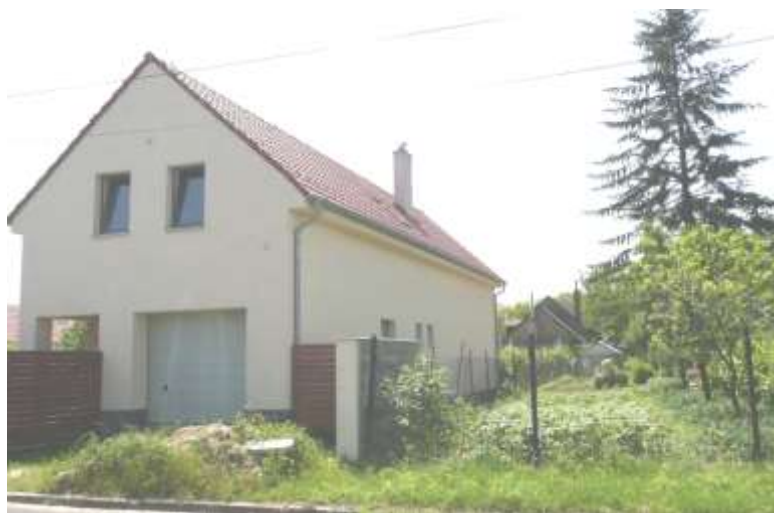
Novostavby domu na ulici Za farou na zadnej časti parcely domu č. z Baničovej ulice 70-62 s použitím dobrého princípu pozdĺžneho pôdorysu s 2-osovou fasádou s princípom prízemnia – stodoly.