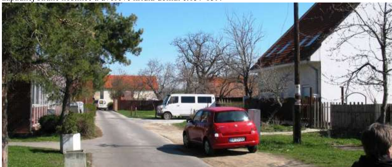
Pohľad z ulice Pod lipami na východ s typizovanou budovou kultúrneho domu na severnej – ľavej strane s novostavbu rodinného domu na parcele domu č. 163-173 z Roľníckej ulice – na mieste bývalej stodoly.

západnej strane hostinec a dvorové krídla domu. č.157-159.