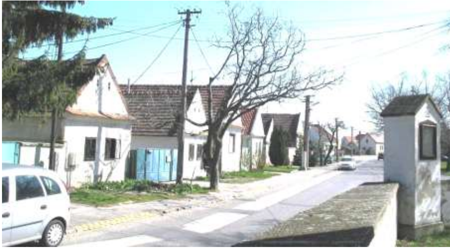
Pohľad č. 4

Pohľad na severnú stranu zástavby Baničovej ulice z areálu kostola. Južnú stranu ulice tvorí park Pod lipami.