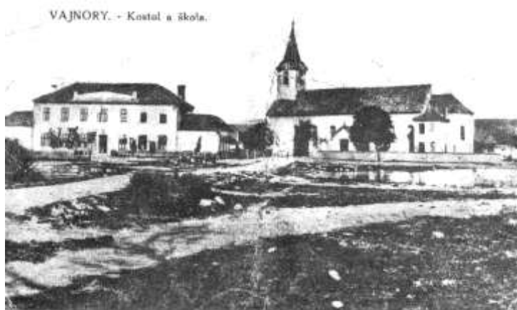
POHĽAD NA ŠKOLU A KOSTOL Z ROKU 1926