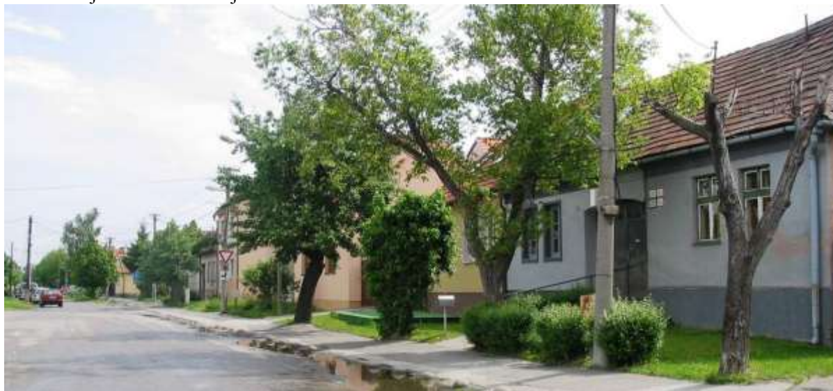
Pohľad na južnú stranu ulice, kde je predzáhradka s trávnatou plochou ukončená kríkmi v kombinácii so starými hruškami a lipami.