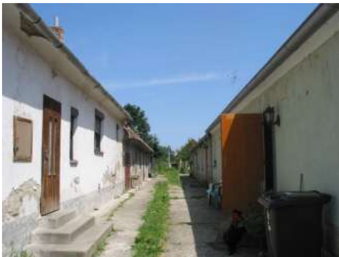
Pohľad na dom č. 48 - 50 na Baničovej ulici, ktorého prvý „predný“ dom je opravený v súlade s pamiatkovými kritériami, ostatné časti obojstrannej zástavby sú len udržiavané vo vyhovujúcom stave.