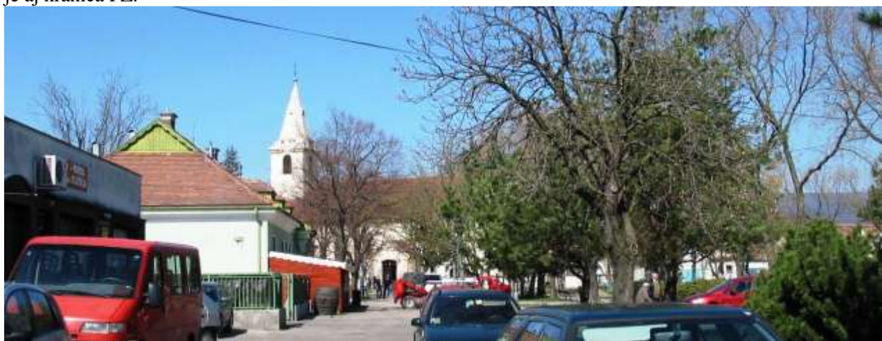
Súčasný pohľad na farský kostol z juhu z parku Pod Lipami, kde na západnej ľavej strane je budova reštaurácie Bakchus. Dole pohľad na farský kostol a podobný pohľad z roku 1926, kde je ešte vidieť škola a kostol – dnes nevnímateľné pre zeleň a stavbu reštaurácie Bacchus