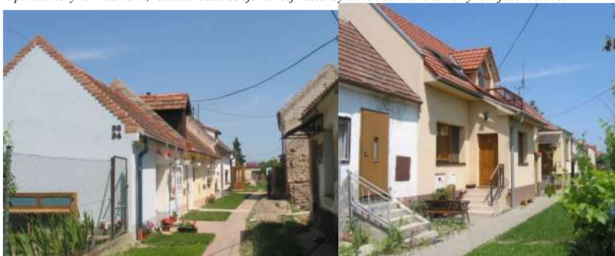
Obnova dvorového kridla domu č. 32-34, kde ostal zachovaný historický objem i tvarovanie domu a pri č.36-38-40, dvorové kridlo nahradili novostavbou, ktorá objemovo rešpektuje pozdĺžnosť dostavby.

Najlepším príkladom obnovy so zmenou funkcie domu je tzv. Modrý dom č. 56 a Reštaurácia pri kaplnke č.31, kde sa obytný dom s pozdĺžnym pôdorysom a pôdorysom tvaru U zmenil na reštauráciu so zachovaním a prezentáciou interiéru so štukovou výzdobou klenby, vstupu do pivnice a podkrovia, so zachovanými oknami i dvermi.