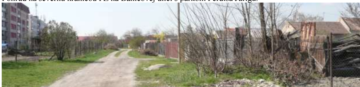
Pohľad smerom na západ na neupravenú cestu a plochu na Tomanovej ulici, kde po hranici parciel vedie línia vymedzujúca PZ.