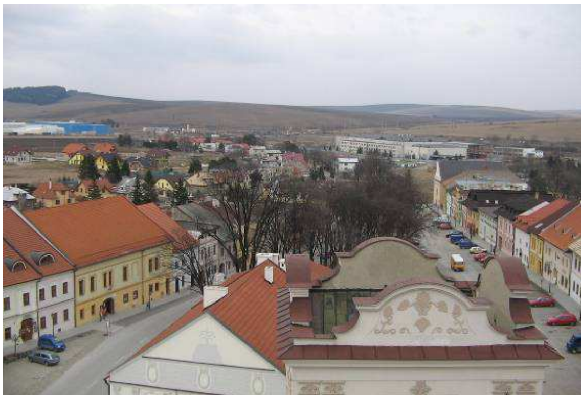
18. Pohľad z veže Kostola sv. Juraja na strednú a východnú časť námestia