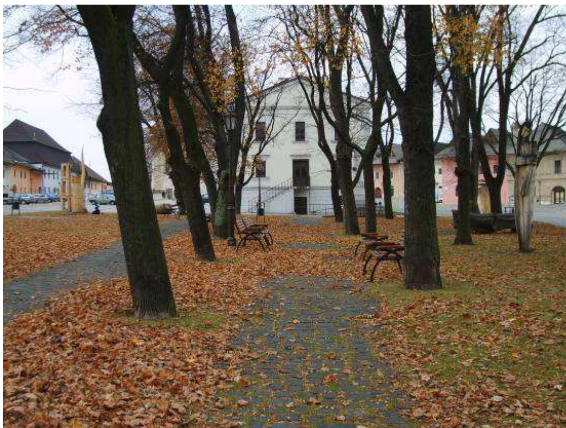
24. Pohľad z parku na námestí, v pozadí objekt bývalej radnice