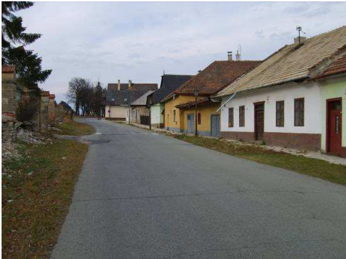
34. Matejovská ulica, pohľad smerom na západ – k Sobotskému námestiu