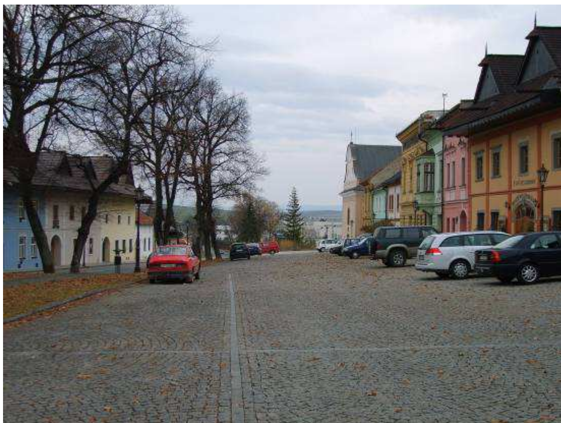
26. Pohľad na východný uzáver námestia