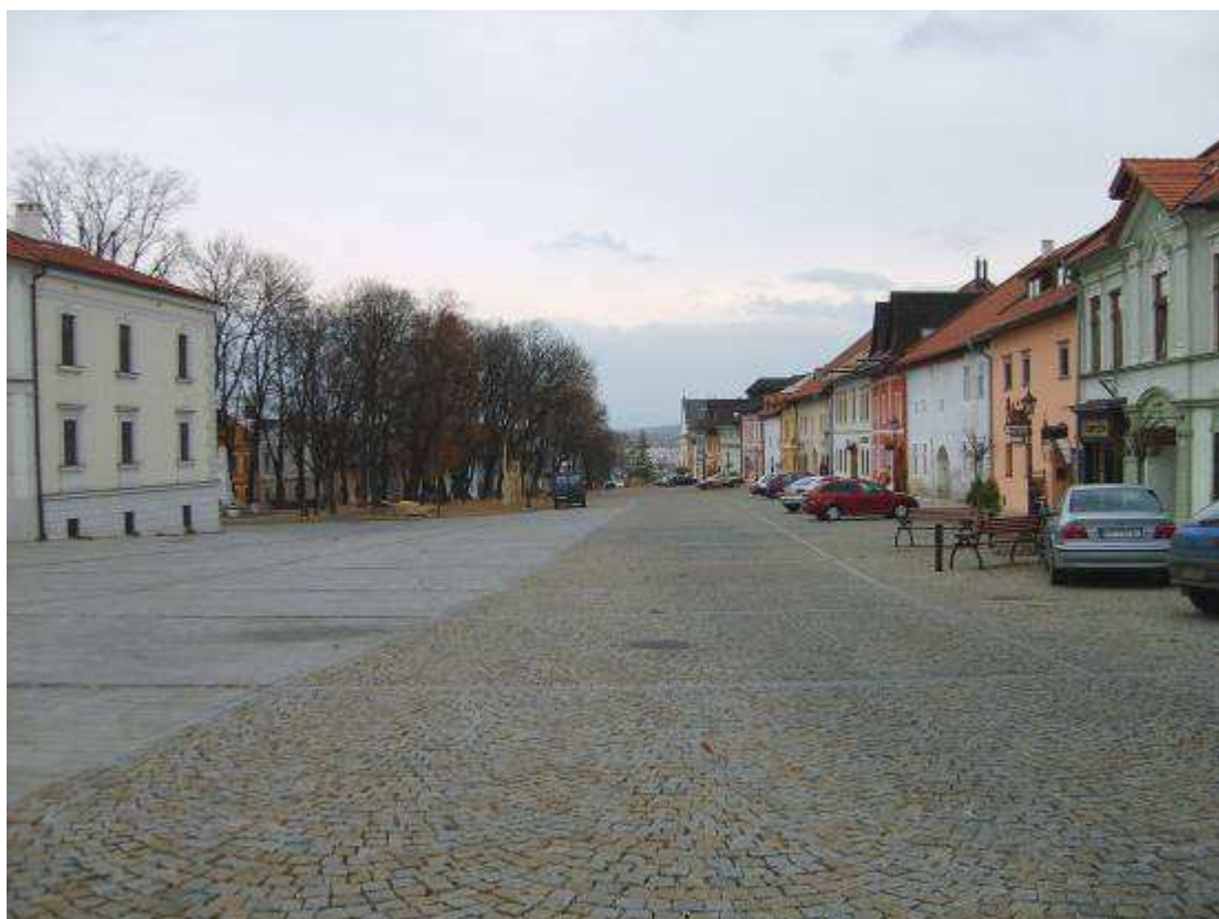
22. Južná strana námestia, pohľad smerom na východ