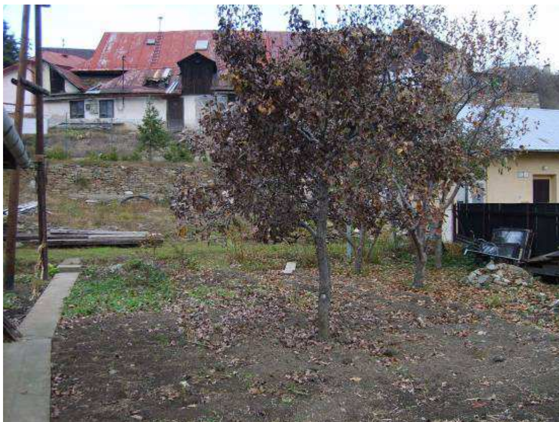
52. Rezervná plocha R2 (výkres č.1) - parcela č. 94, severná strana Riečnej ulice