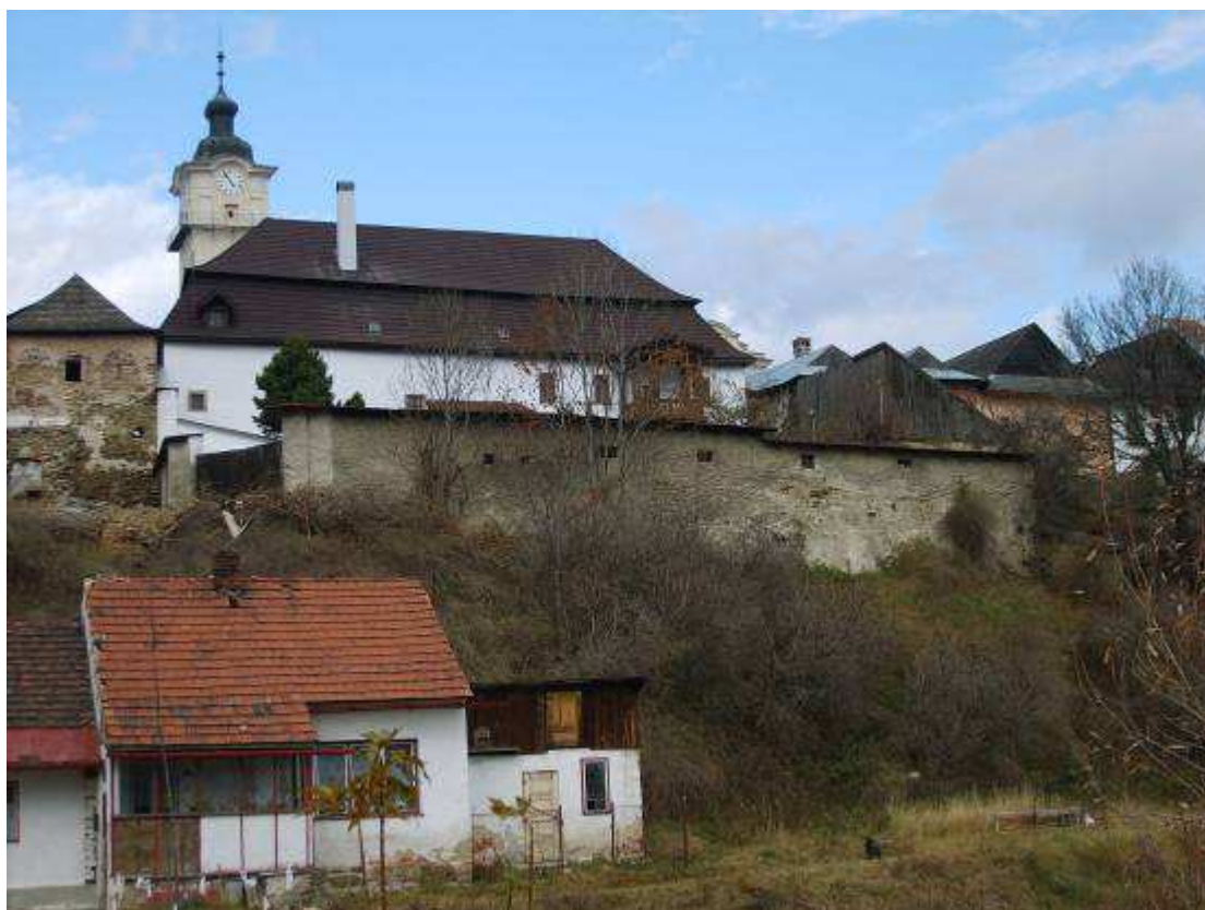
37. Pohľad na dvorové fasády a zástavbu na južnej strane PR