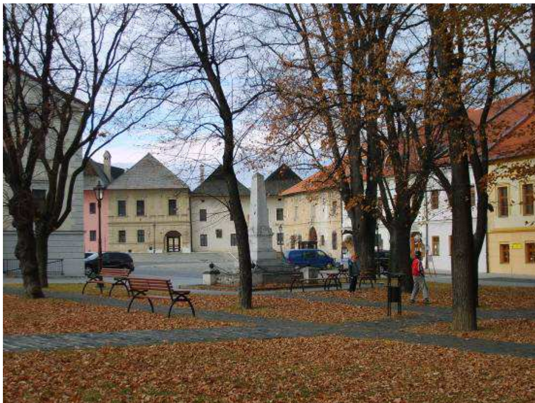
25. Pohľad z parku na námestí smerom na severozápad, v pozadí NKP pomník