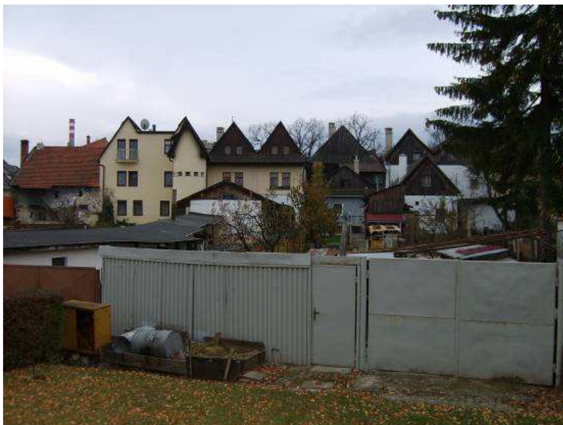
38. Pohľad na dvorové fasády a zástavbu na severnej strane PR