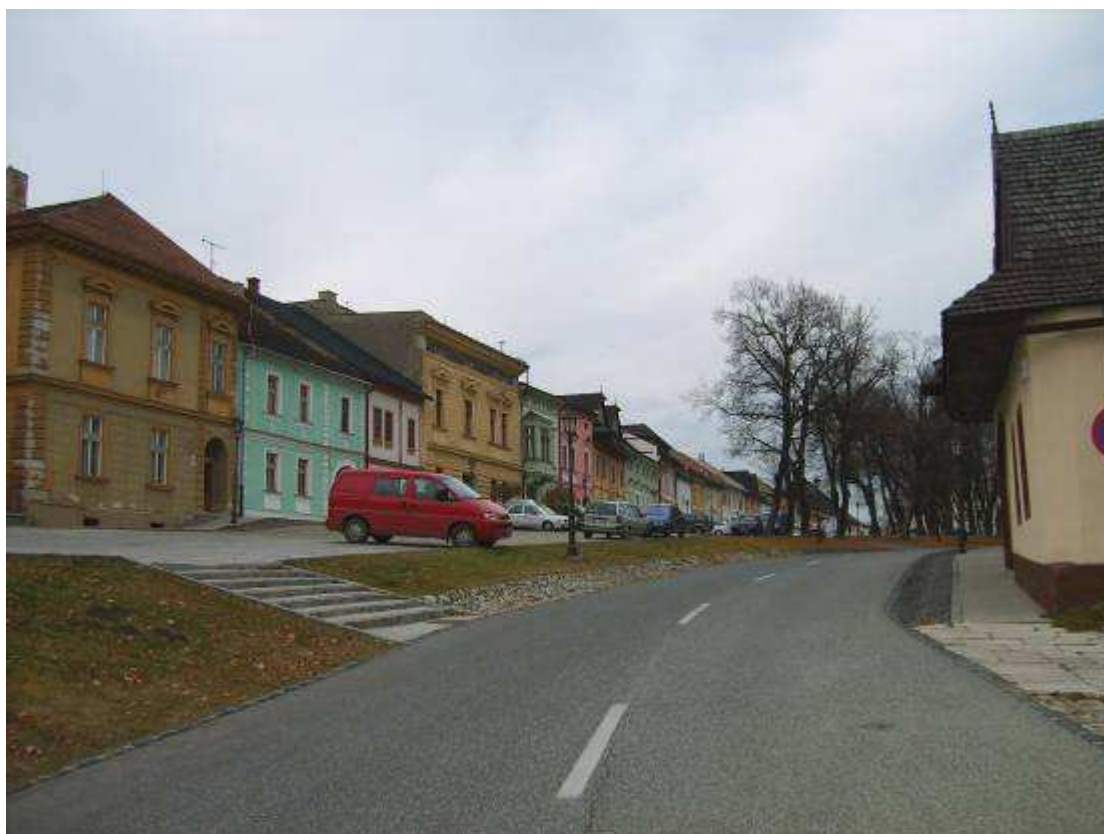
27. Vstup na námestie z východnej strany - z Matejovskej ulice