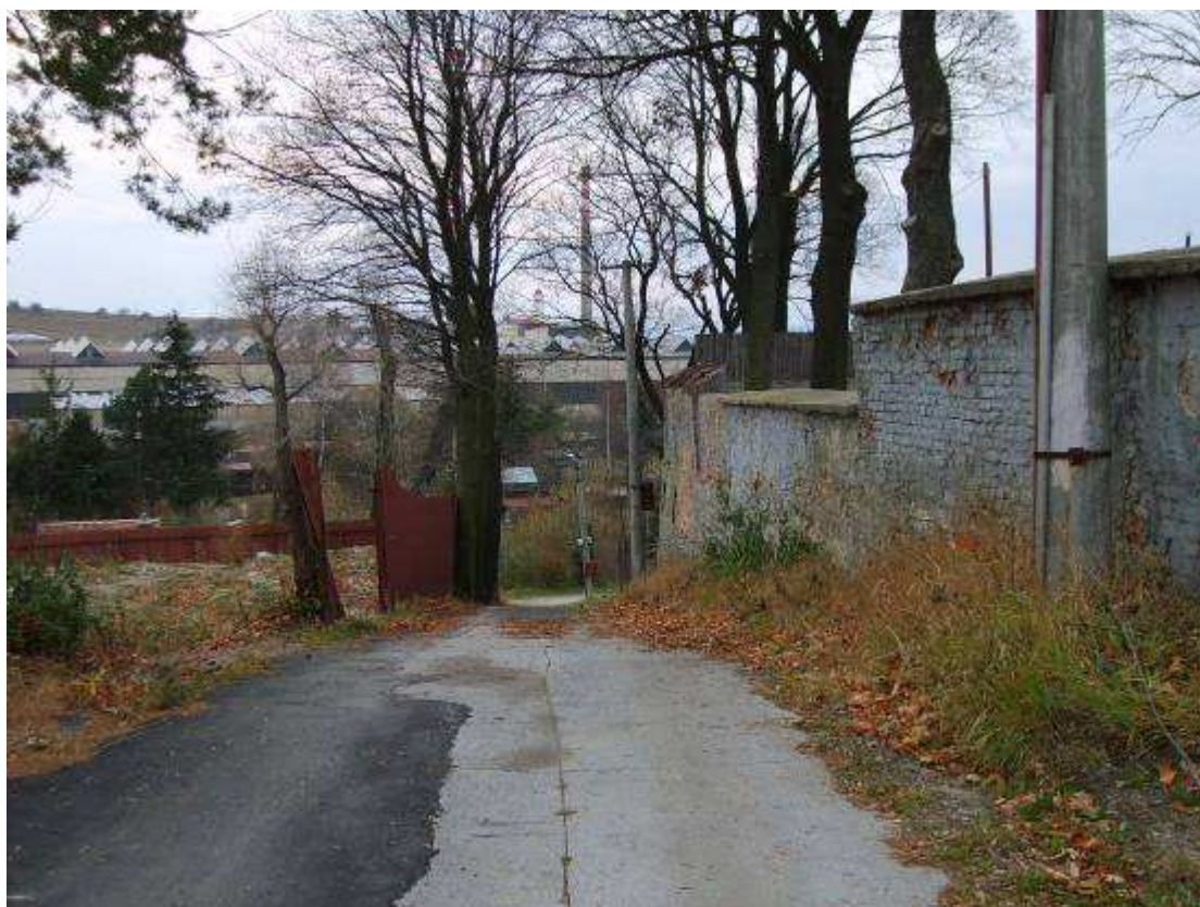
36. Nemocničná ulica, pohľad od evanjelického kostola smerom na juh