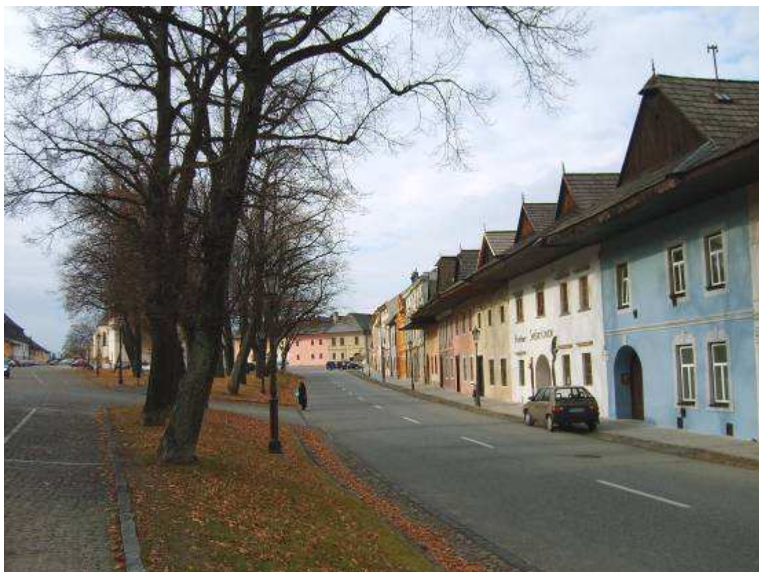
23. Radová zástavba na severnej strane námestia, pohľad smerom na západ