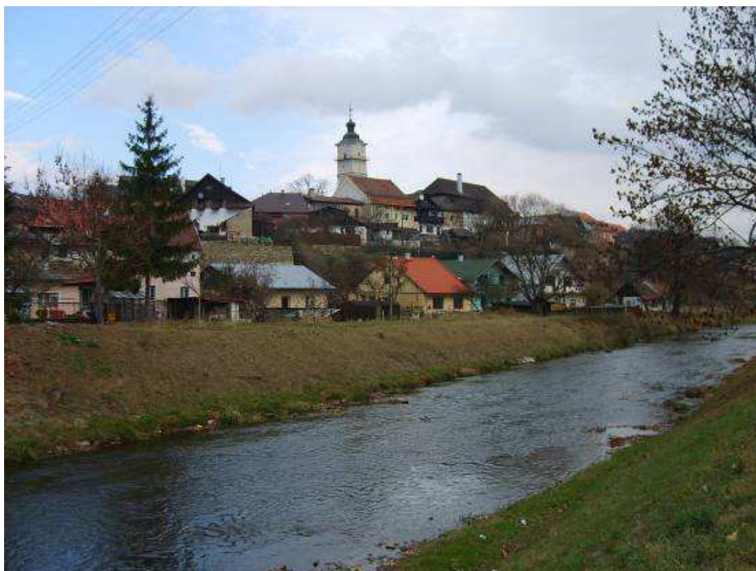
35. Pohľad na Spišskú Sobotu od rieky Poprad, v popredí zástavba Riečnej ulice