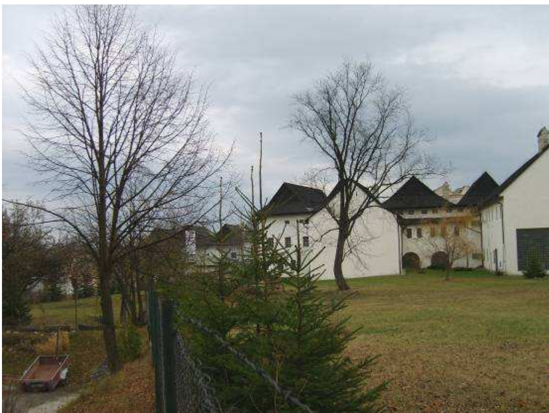
39. Pohľad na dvorové fasády a zástavbu na západnej strane PR