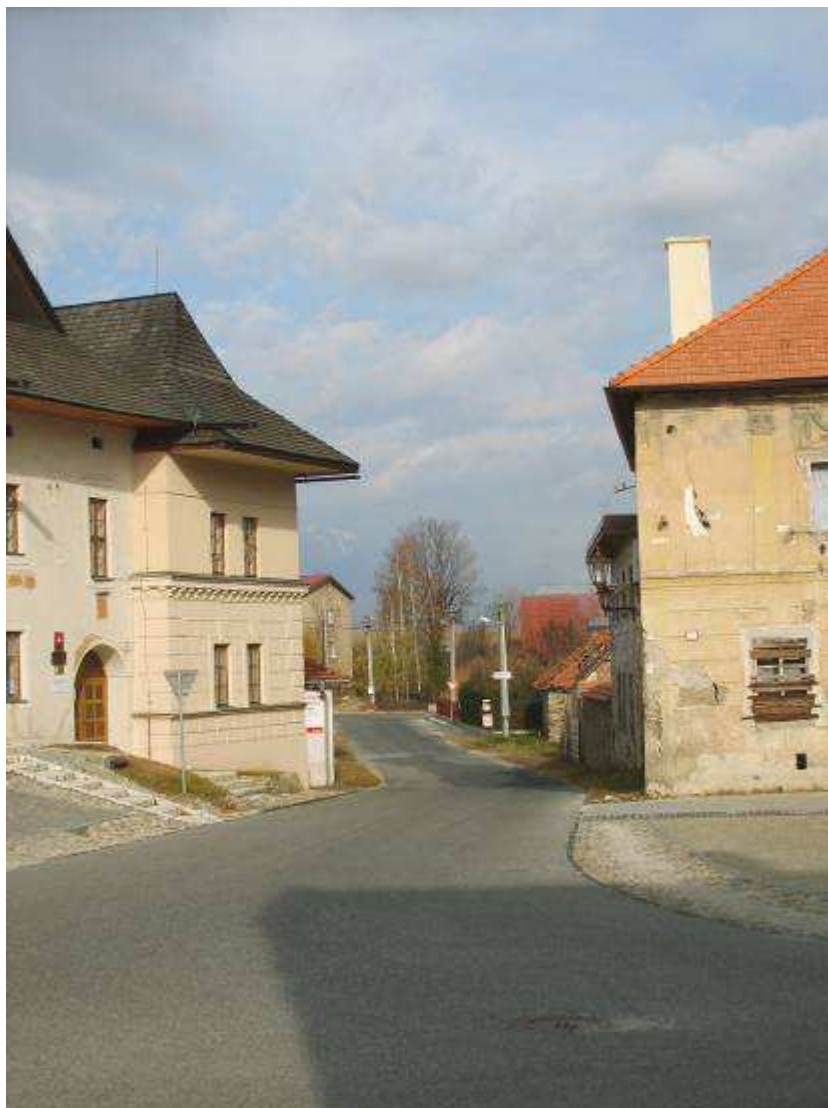
29. Pohľad z námestia do Slavkovskej ulice