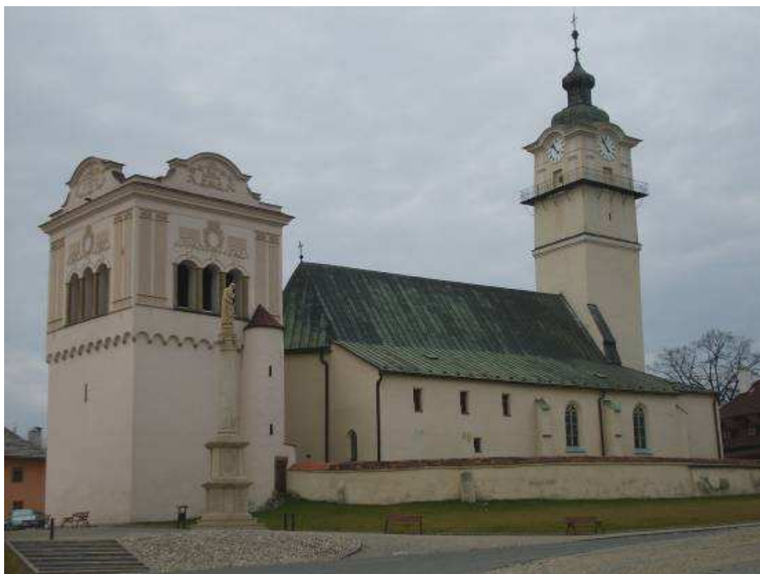
17. Kostol sv. Juraja, zvonica a Immaculata v západnej časti centra námestia