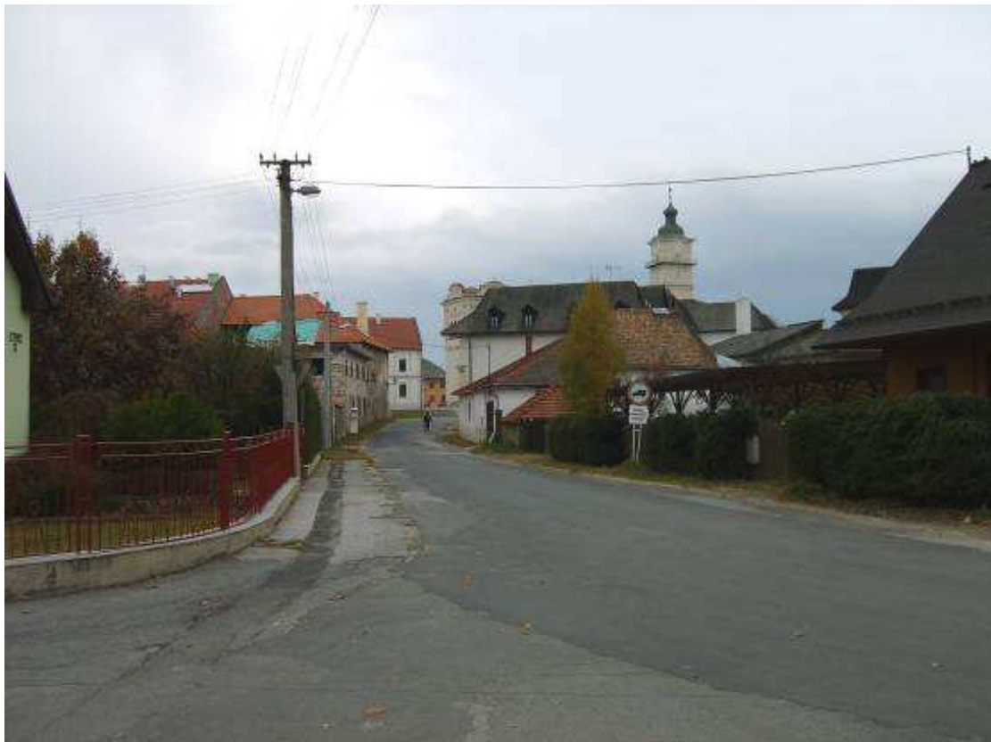
32. Slavkovská ulica, pohľad smerom na juh – k Sobotskému námestiu