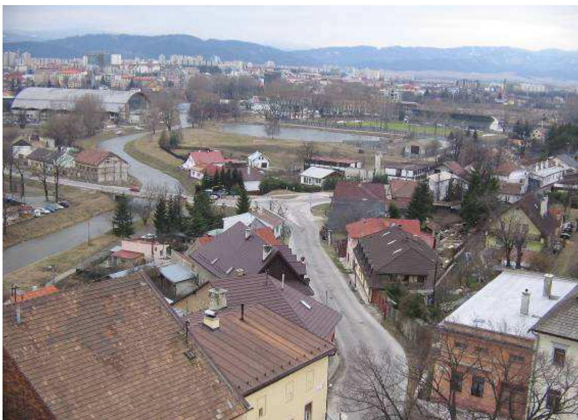
21. Pohľad z veže Kostola sv. Juraja na zástavbu Ulice Pod bránou