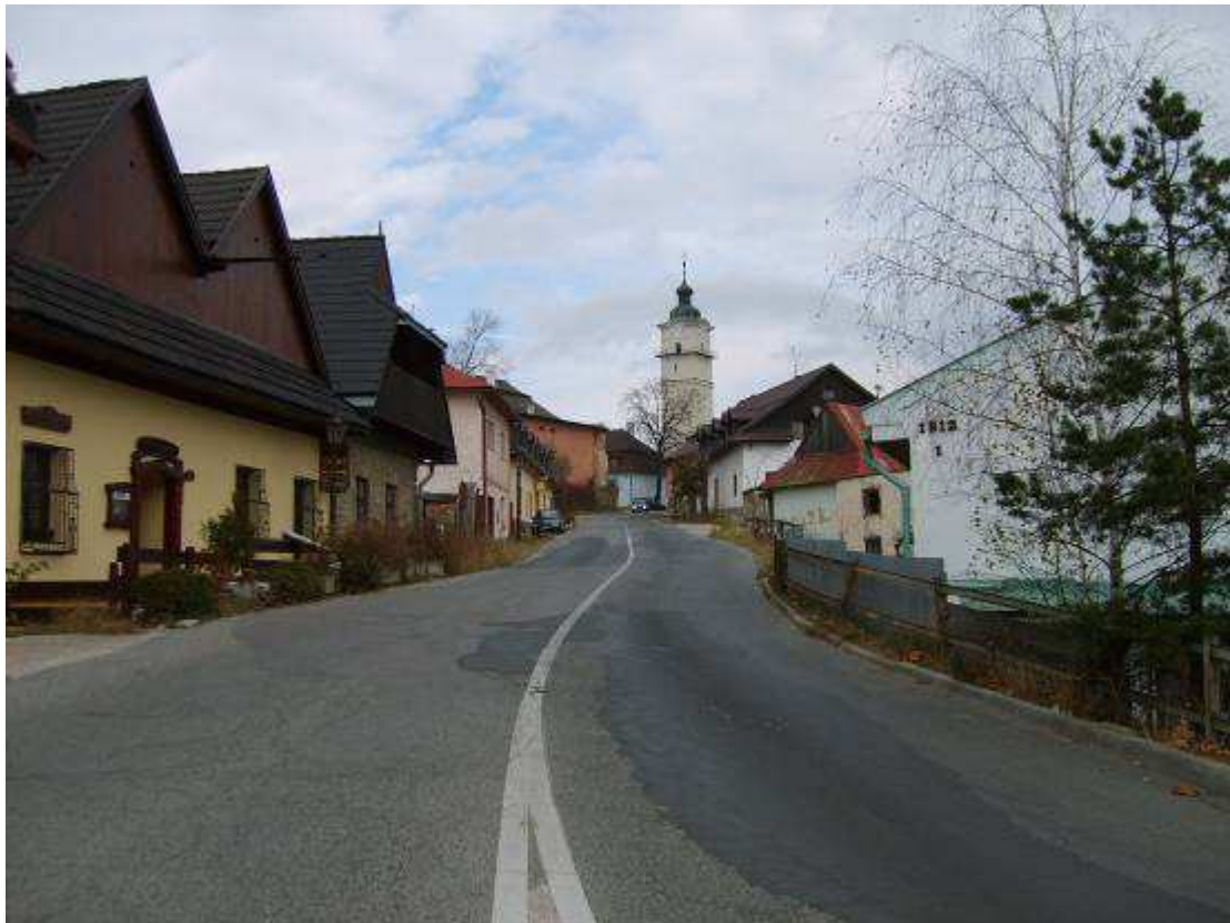
33. Ulica Pod bránou, pohľad smerom na severovýchod – k Sobotskému námestiu