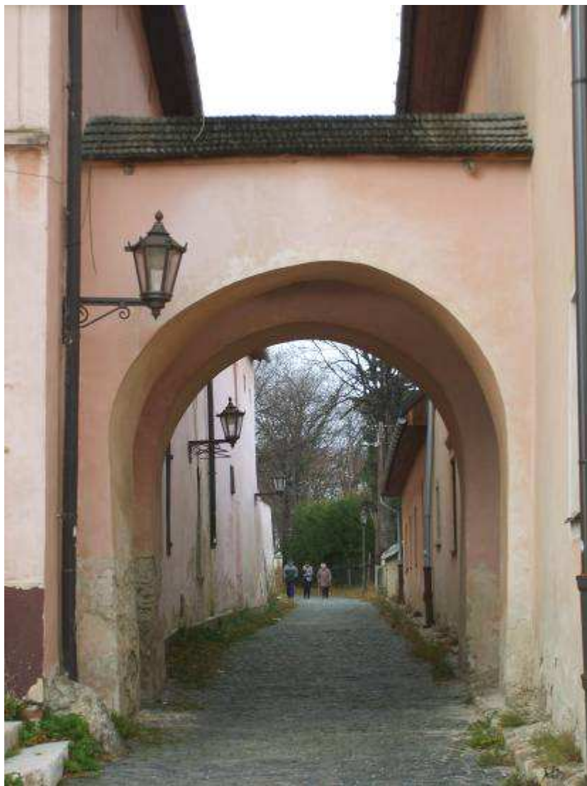
30. Pohľad z námestia do Velickej uličky