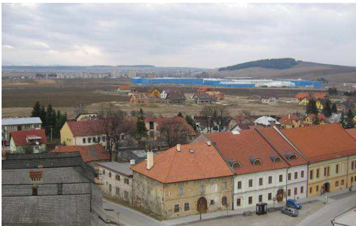
19. Pohľad z veže Kostola sv. Juraja na severozápadnú časť námestia