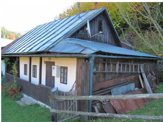
dom č. 111