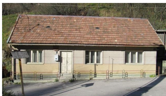
dom č. 71 – 3-dielne okná, brizolitová omietka, krytina