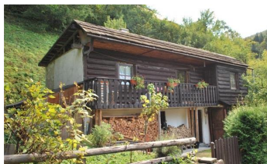
dom č. 38