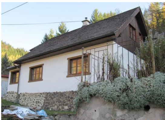
dom č. 88 – okenné výplne, okná v štíte, obložený sokel kameňom