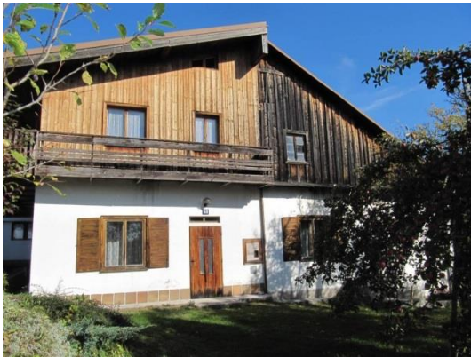
domy č. 159 a 160 – nevhodné spojenie 2 objektov, nevhodný sklon strechy, okenné A dverné výplne, úprava štítov