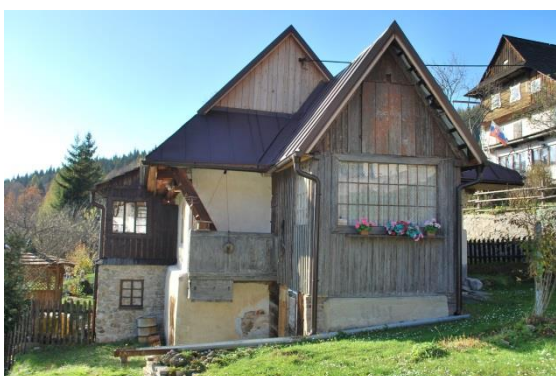
dom č. 29