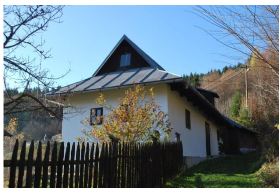
dom č. 22