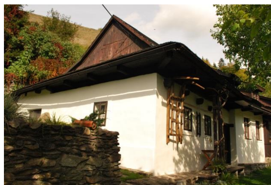
dom č. 57