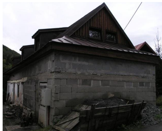
dom č. 146 – nevhodná nadstavba, dostavba