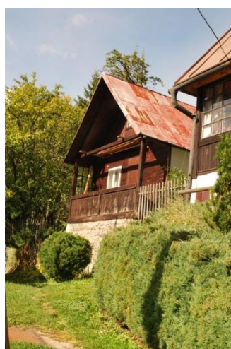
dom č. 53