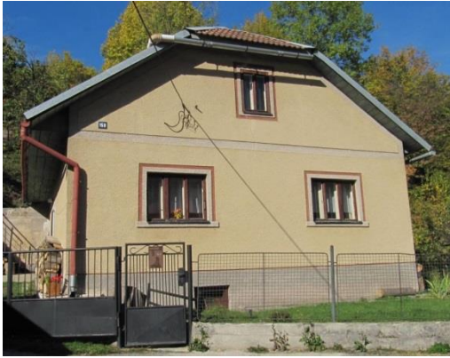
dom. č. 158 – 3-dielne okná, brizolitová omietka, škridlová krytina