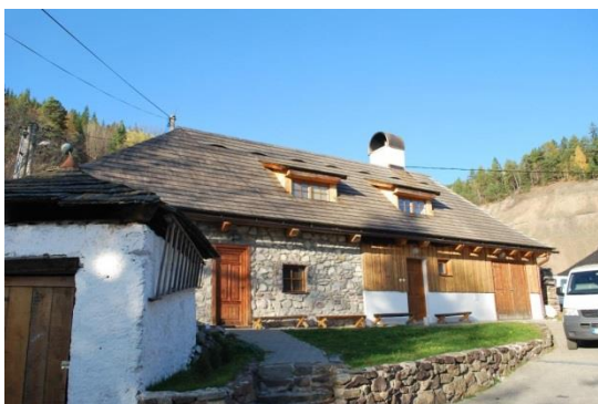
stavba hospodárska – celková nevhodná prestavba