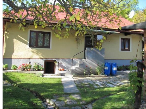
dom č. 148 – 3-dielne okno, brizolitová omietka