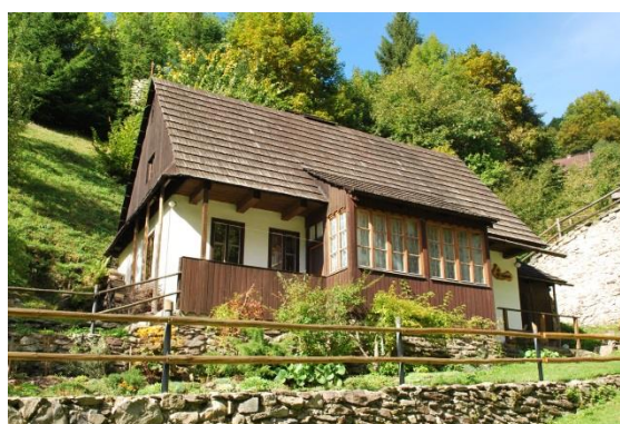
dom č. 37