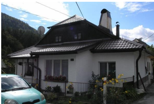
dom č. 214 – nevhodné okenné výplne, krytina kabrincový sokel