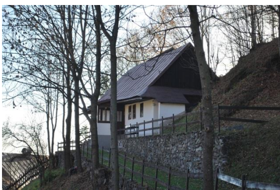
dom č. 3