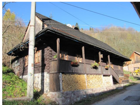
dom č. 69