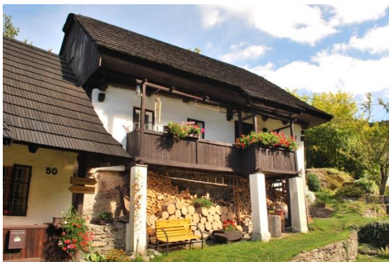
dom č. 52