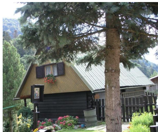
dom č. 217