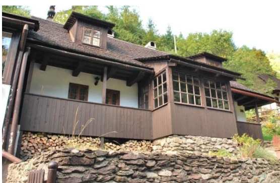
dom č. 36