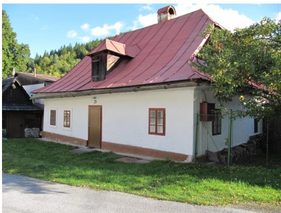
dom č. 150