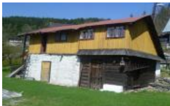
dom č. 254 – nevhodná prestavba a nadstavba hospodárskeho objektu