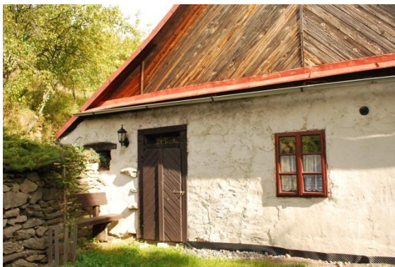
dom č. 67