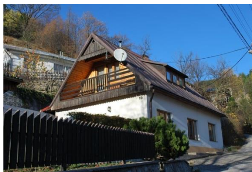
dom č. 10 – nevhodné okenné výplne, nevhodný balkón v štíte