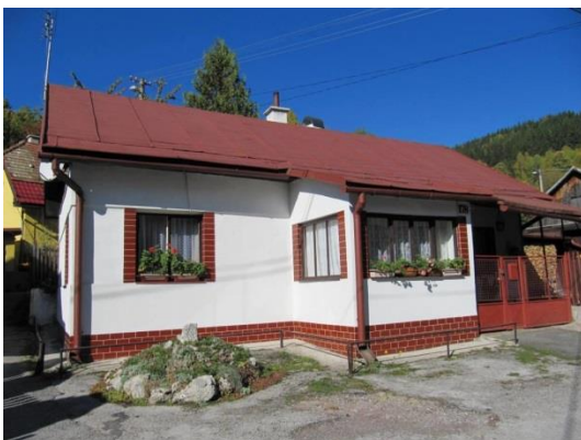
dom č. 178 – nevhodné okenné výplne, fasáda kabrincový sokel, veranda