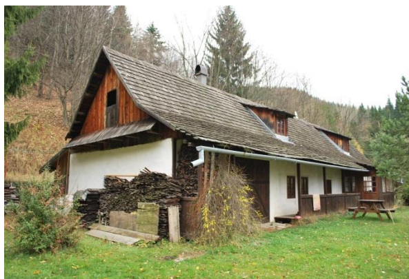
dom č. 2