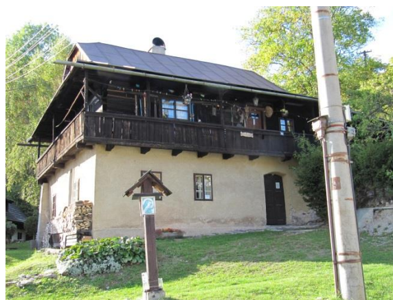
dom č. 155