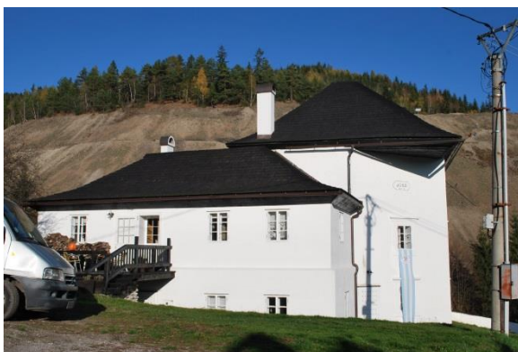
objekt č. 9, bašta