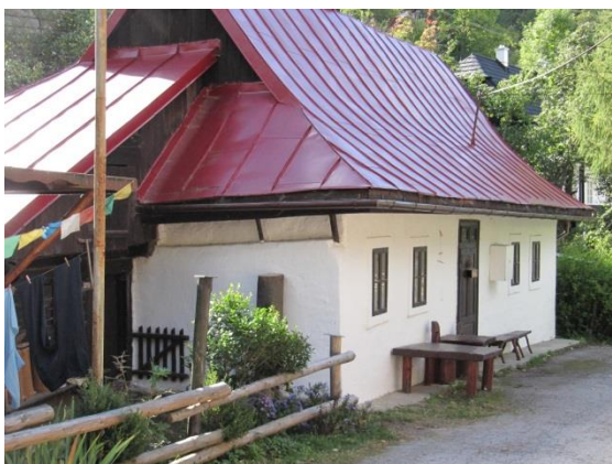
dom č. 96