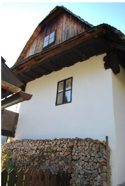
dom č. 23