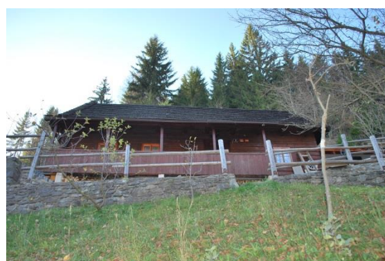
dom č. 7