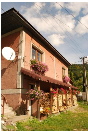
dom č. 199