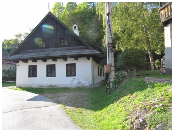
dom č. 156-157