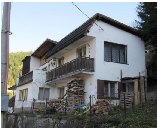
dom č. 90