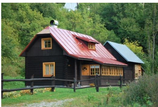
dom č. 235