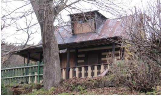
dom č. 27