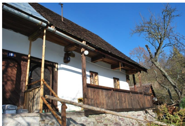
dom č. 18