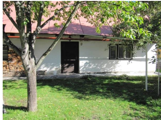
dom č. 170 – 3-dielne okno