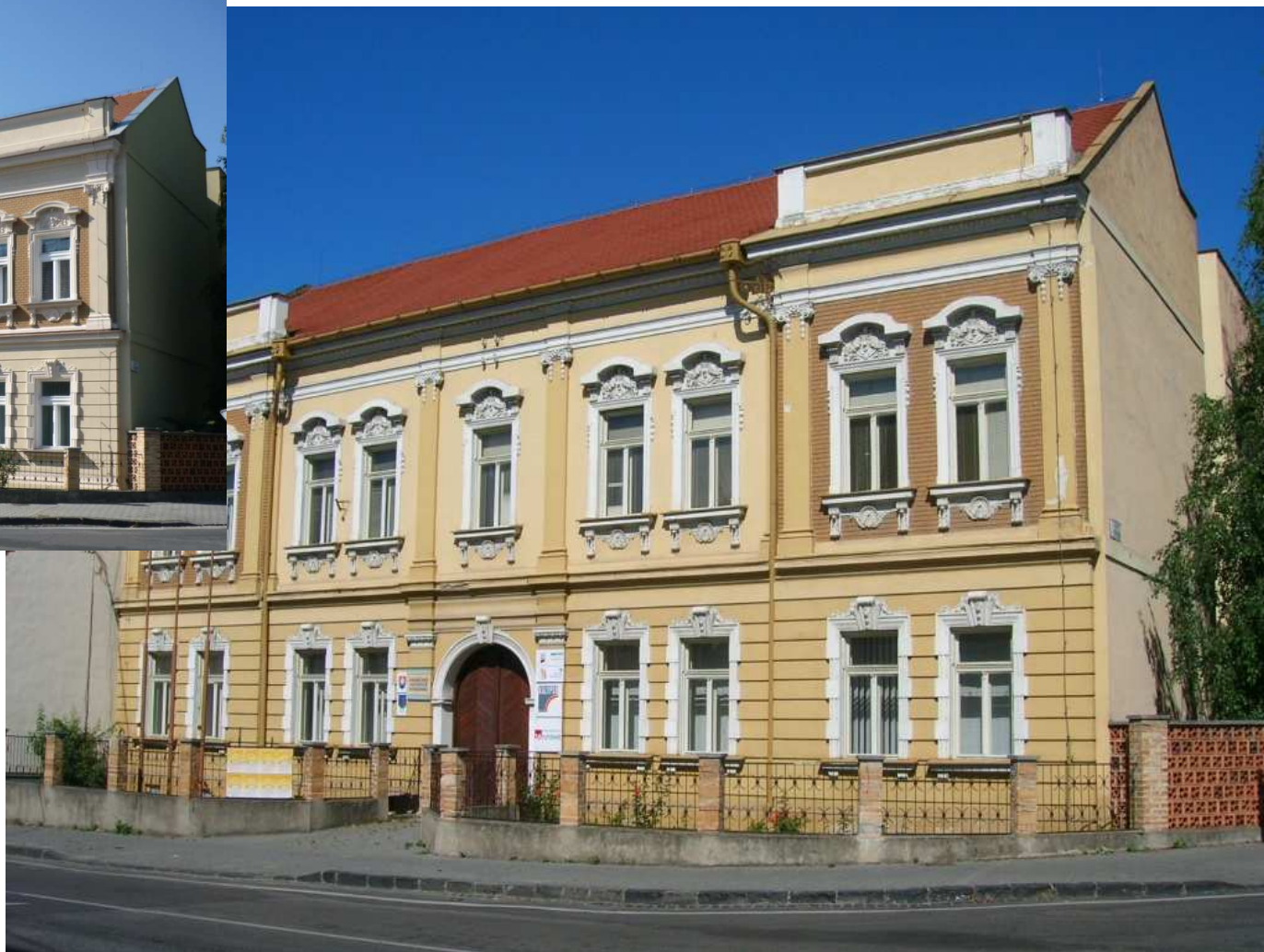
dom po obnove