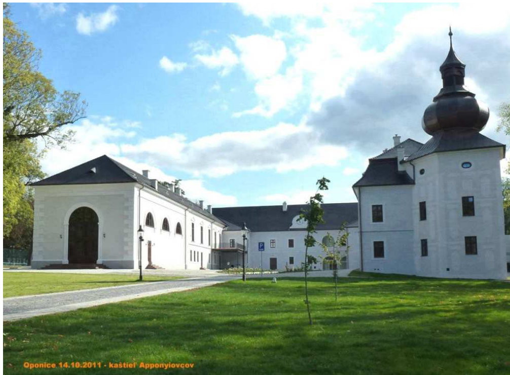
Oponice 14.10.2011 - kaštieľ Apponyovcov