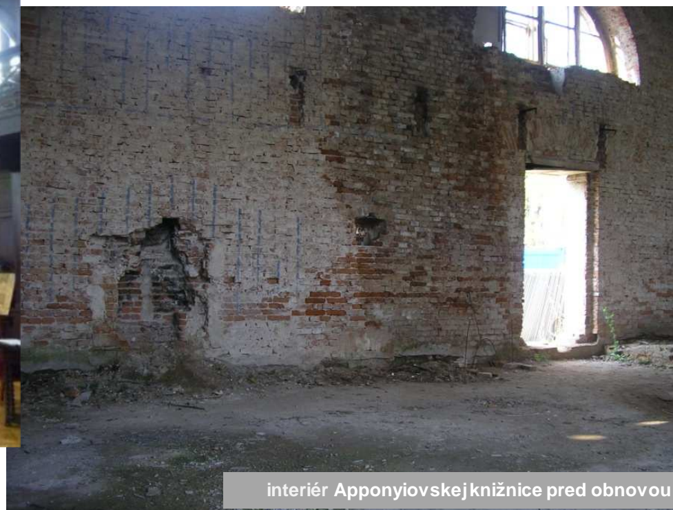
interiér Apponyovskej knižnice pred obnovou