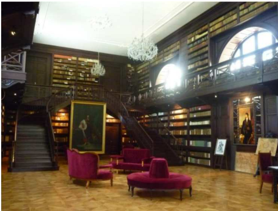
interiér Apponyovskej knižnice po obnove