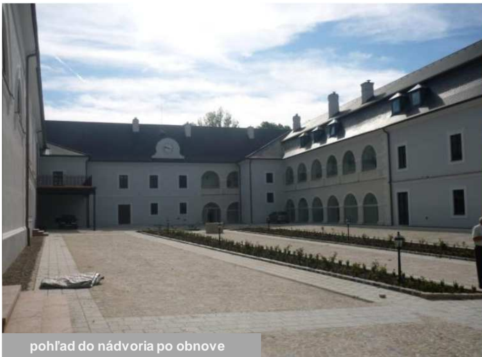
pohľad do nádvorja po obnove