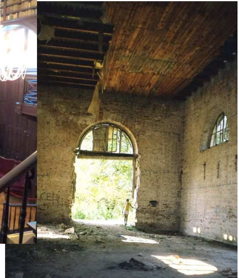
interiér Apponyovskej knižnice pred obnovou