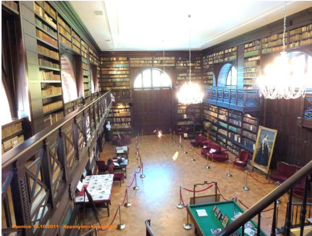
interiér Apponyovskej knižnice po obnove