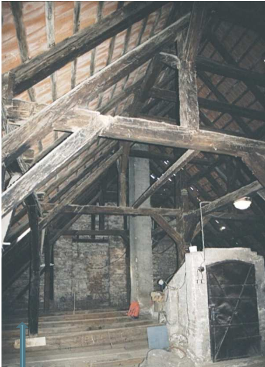
podstrešný priestor pred obnovou