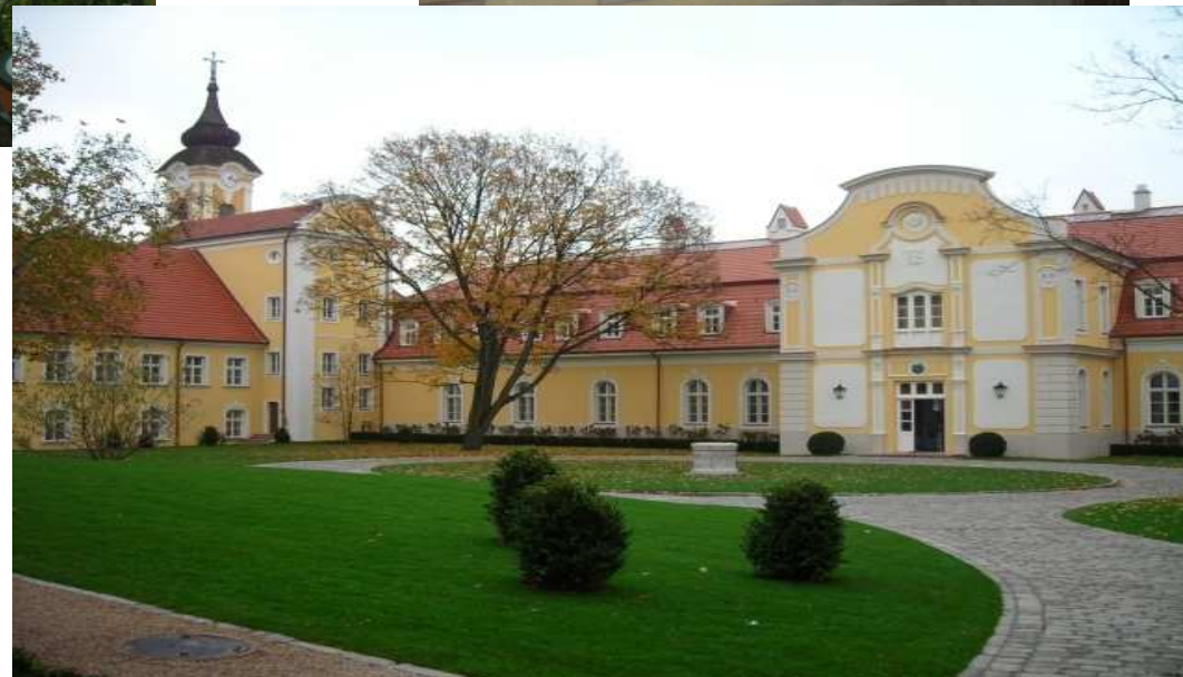
pohľad do vnútorného nádvoria