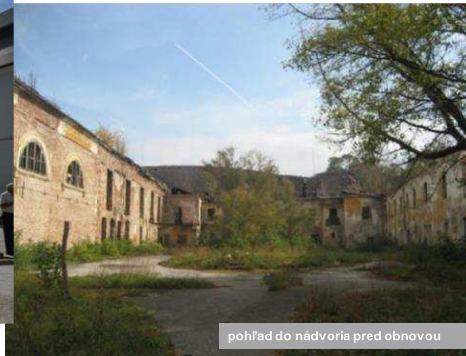
pohľad do nádvorja pred obnovou