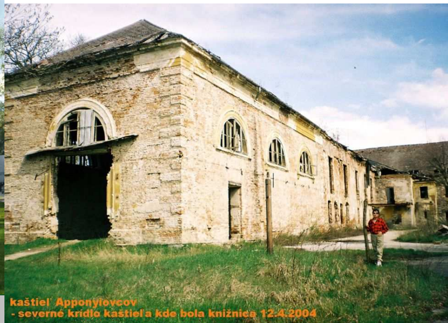
kaštieľ Apponyovcov - severné krídlo kaštieľa a kde bola knižnica 12.4.2004

Pôvodne renesančný kaštieľ z prvej pol. 17. stor. Na začiatku 19. stor., páni hradu a panstva Oponice, Apponyovci z malého kaštieľa urobili sídlo správy svojho oponického majetku.