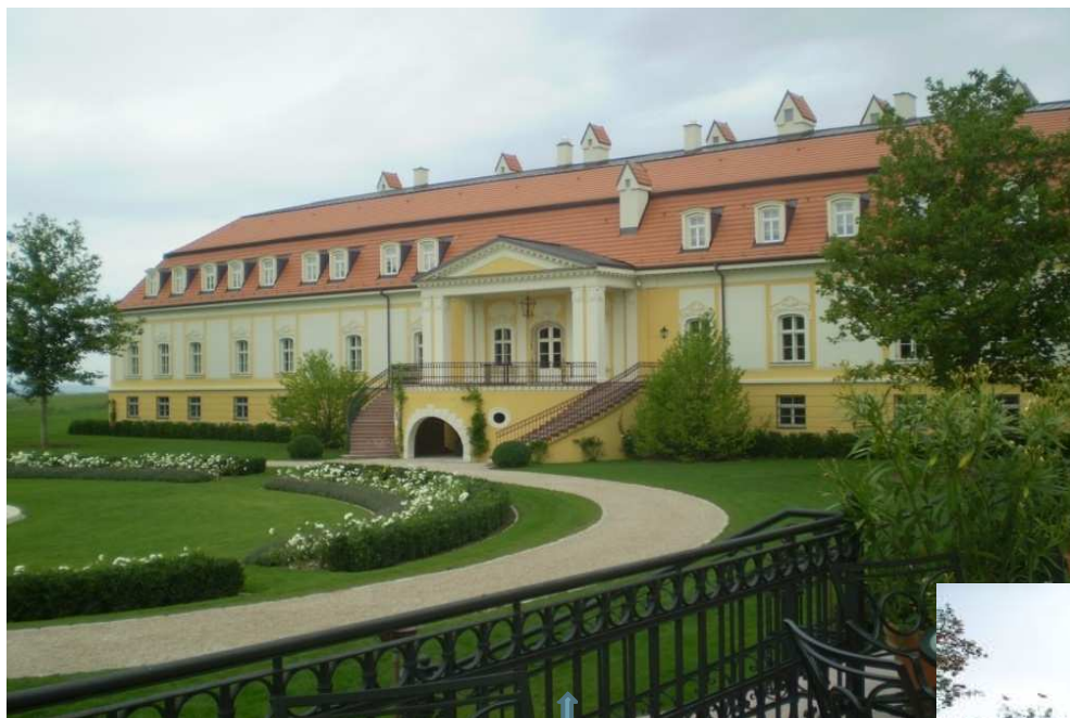
nádvorie za kaštieľom